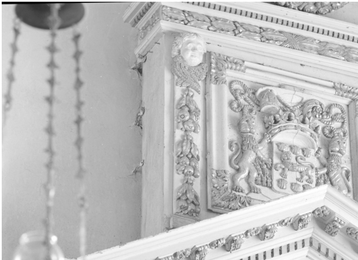
Retable du choeur : détail du panneau armorié (aile droite)