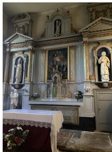
Vue générale IVR53_20265610854NUCA