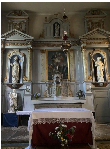
Vue générale IVR53_20265610856NUCA