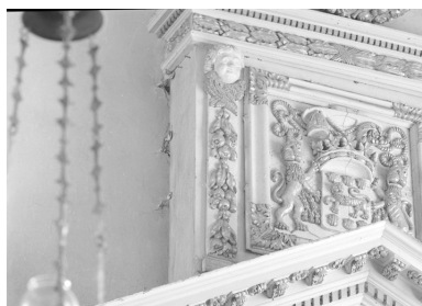
Retable du choeur : détail du panneau armorié (aile droite) IVR53_19775600458X