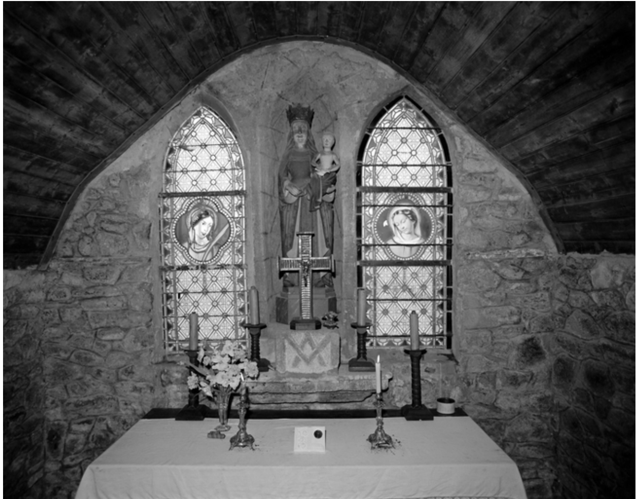
Intérieur, chœur : vue générale.