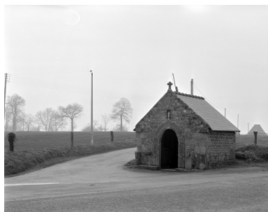
Elévation Nord-Est : vue générale IVR53_19933500140X