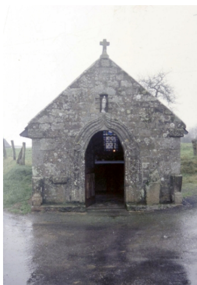
Elévation ouest : vue générale. IVR53_19943502660ZA