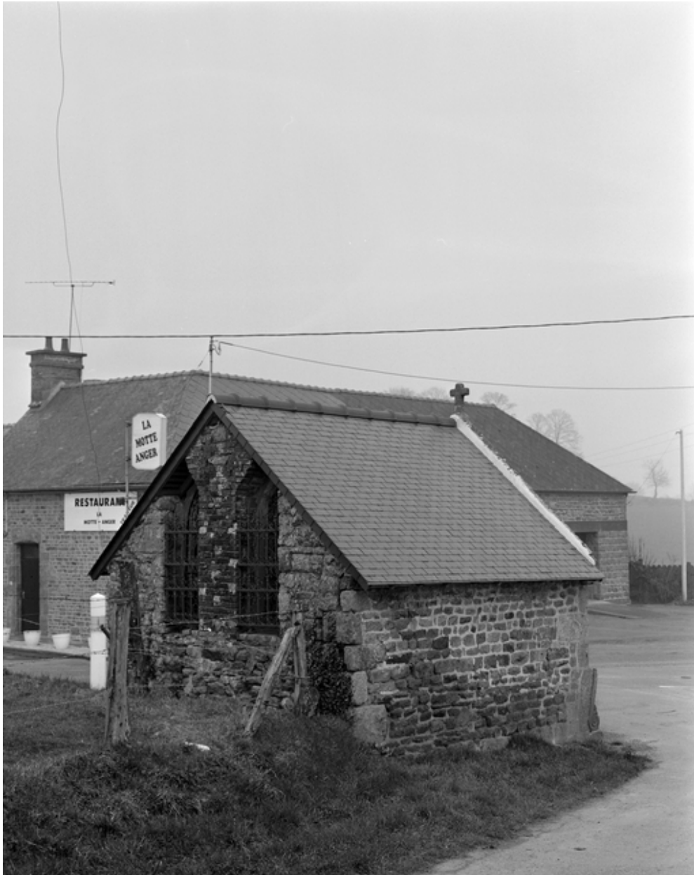
Elévation Ouest : vue générale