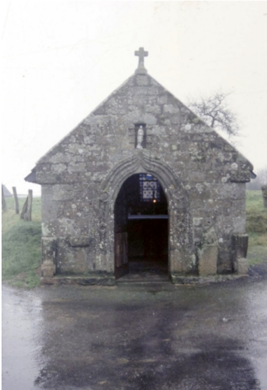
Elévation ouest : vue générale.