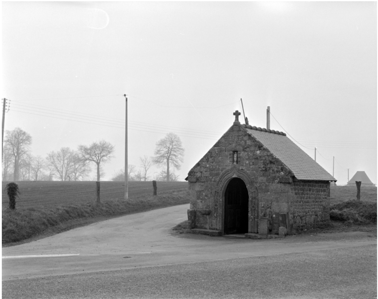
Elévation Nord-Est : vue générale