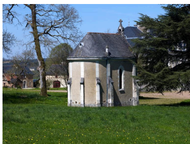
Chevet de la chapelle IVR53_20155600119NUCA