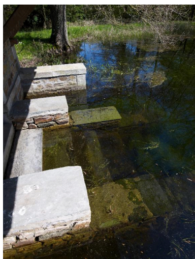
Vue de détail du lavoir