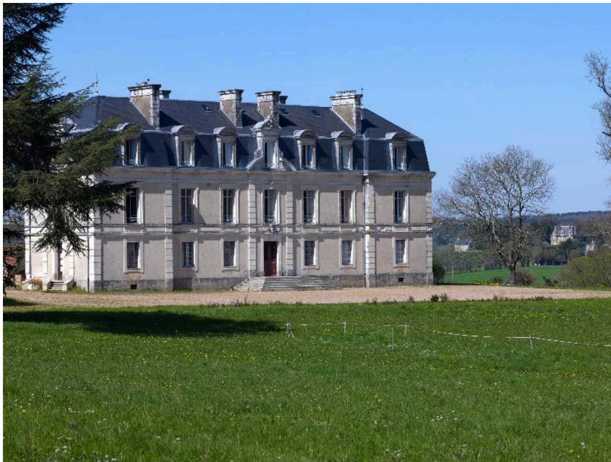
Vue sud-est du château