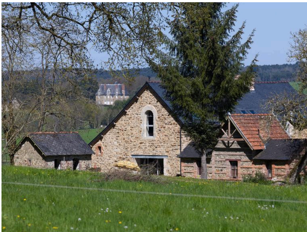
Vue de situation des dépendances du château