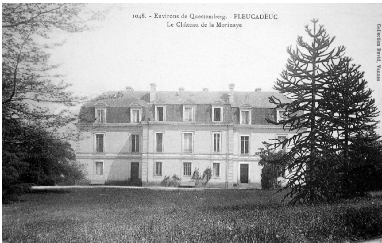
Environs de Questemberg [sic]. - PLEUCADEUC. - Le Château de la Morinaye. Carte postale, limite 19e-20e siècle (A. D. Ille-&-Vilaine, 6 Fi)