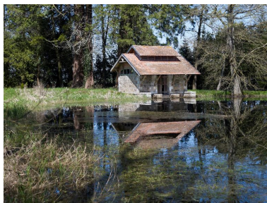
Lavoir privé, de style pittoresque avec buanderie et séchoir bordant la pièce d'eau IVR53_20155600111NUCA