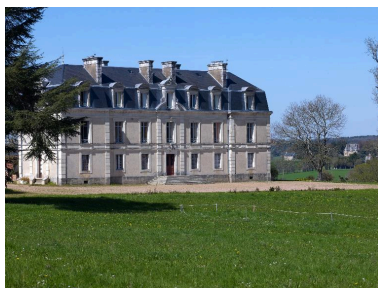
Vue sud-est du château