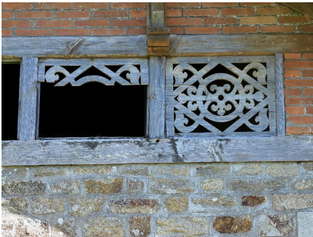
Fenêtre ajourée du lavoir