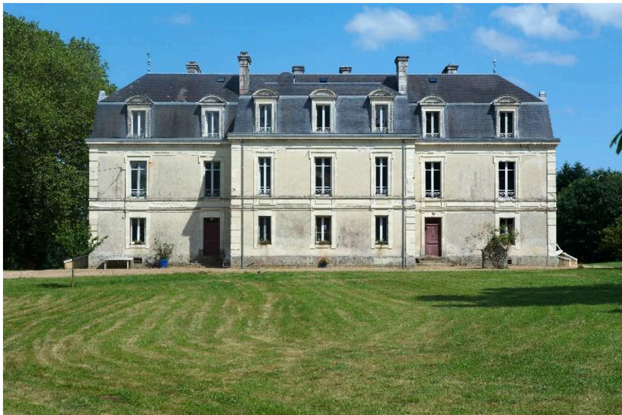
Façade ouest du château