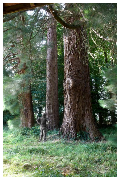
Vue des séquoias géants dans le parc du château