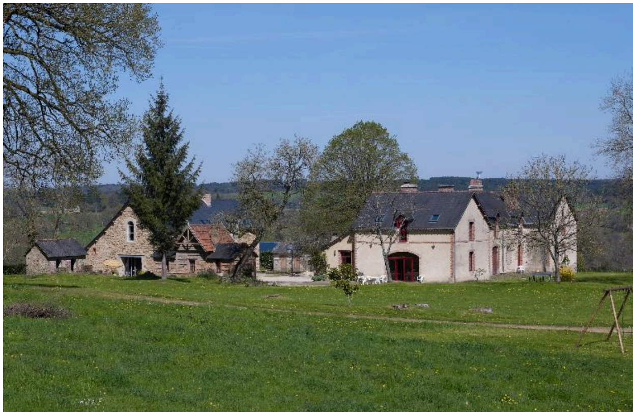
Vue de situation des dépendances du château