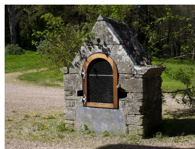
Puits à l'est du château IVR53_20155600103NUCA