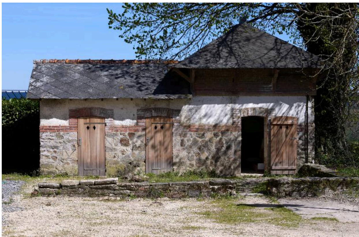
Dépendance du château