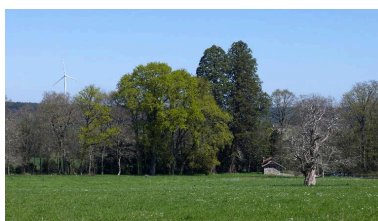
Vue du parc en direction du lavoir