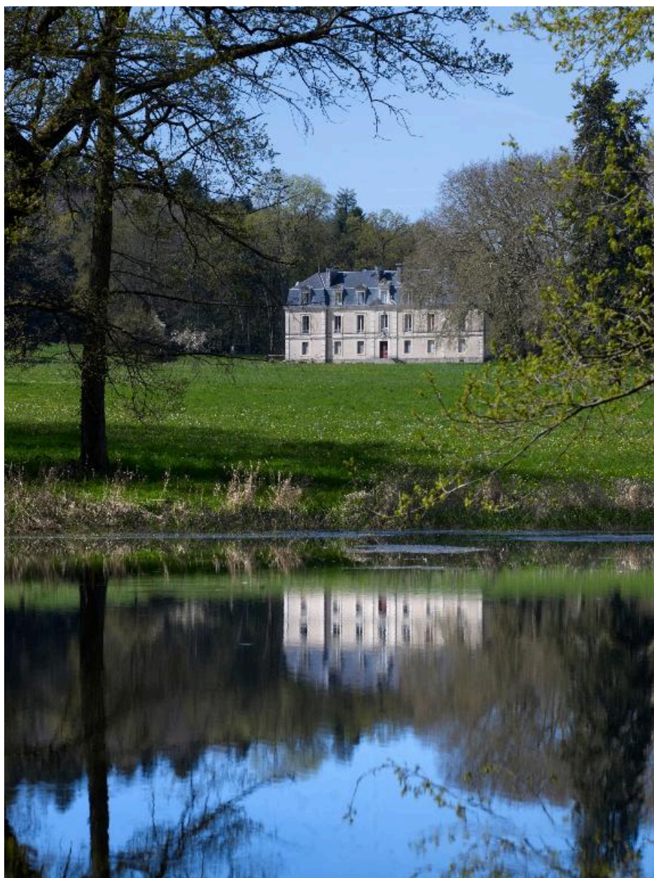
Vue de situation du château