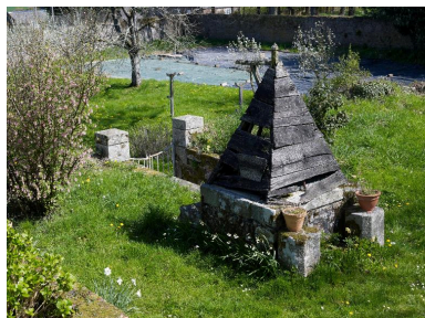
Puits associé au jardin clos IVR53_20155600104NUCA