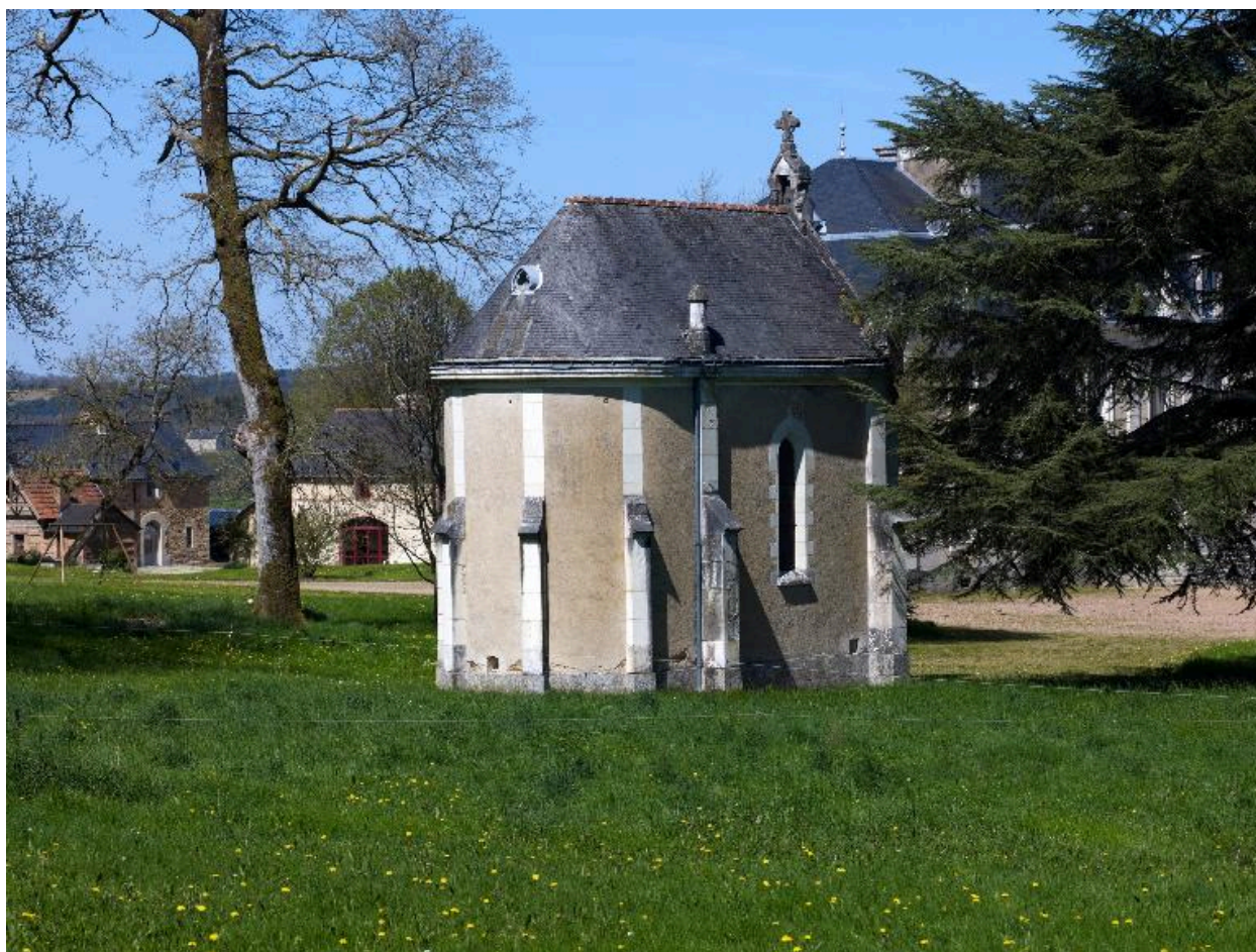
Chevet de la chapelle