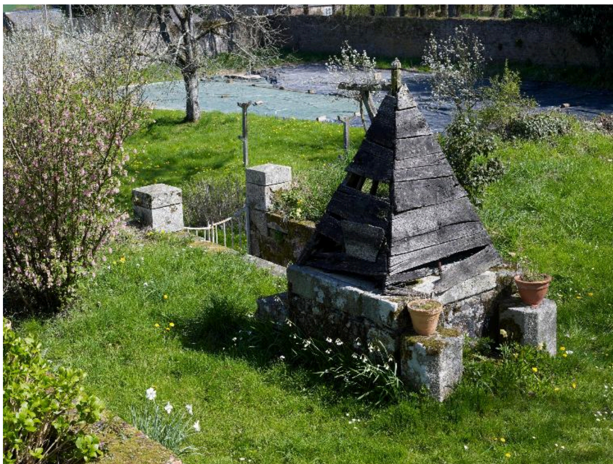
Puits associé au jardin clos