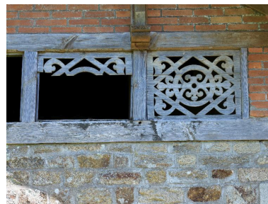
Fenêtre ajourée du lavoir