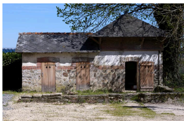
Dépendance du château IVR53_20155600098NUCA