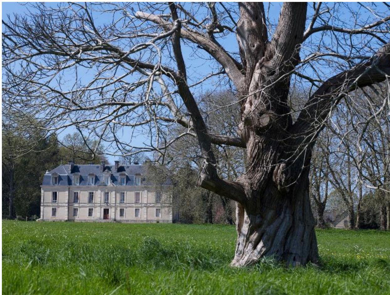
Vue paysagère du château