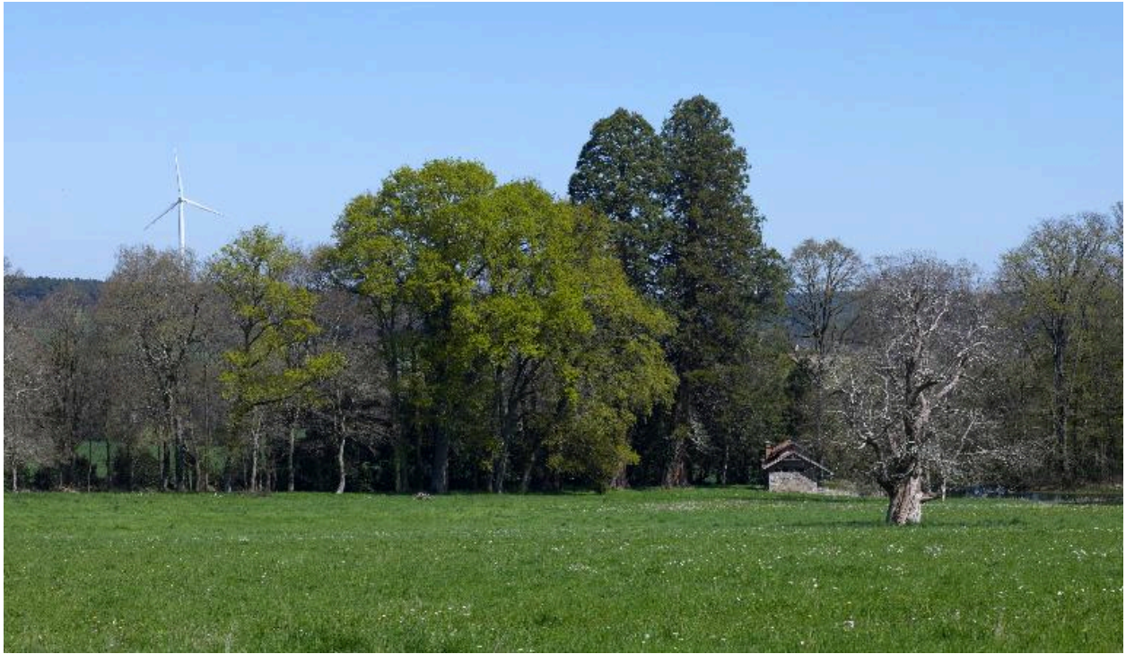
Vue du parc en direction du lavoir