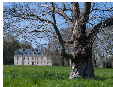
Vue paysagère du château IVR53_20155600114NUCA