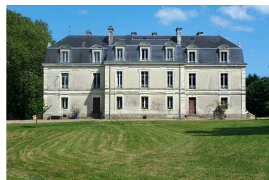
Façade ouest du château IVR53_20155600330NUCA