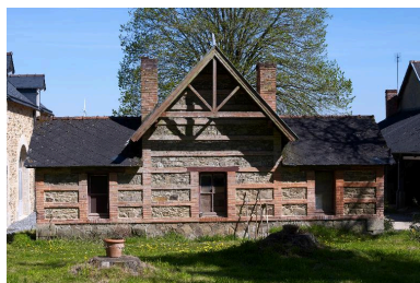
Dépendance du château