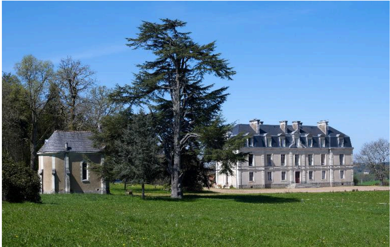
Vue de situation du château