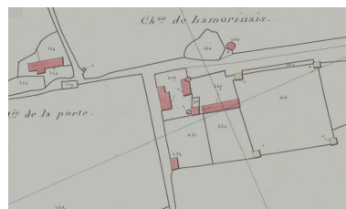
Le château de la Morinais et ses dépendances sur le cadastre de 1824 (A. D. Morbihan, 3 P 479) IVR53_20125606381NUCB