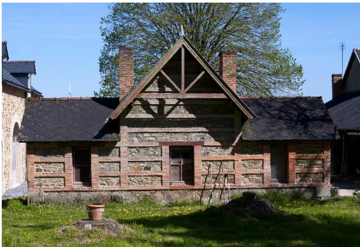
Dépendance du château