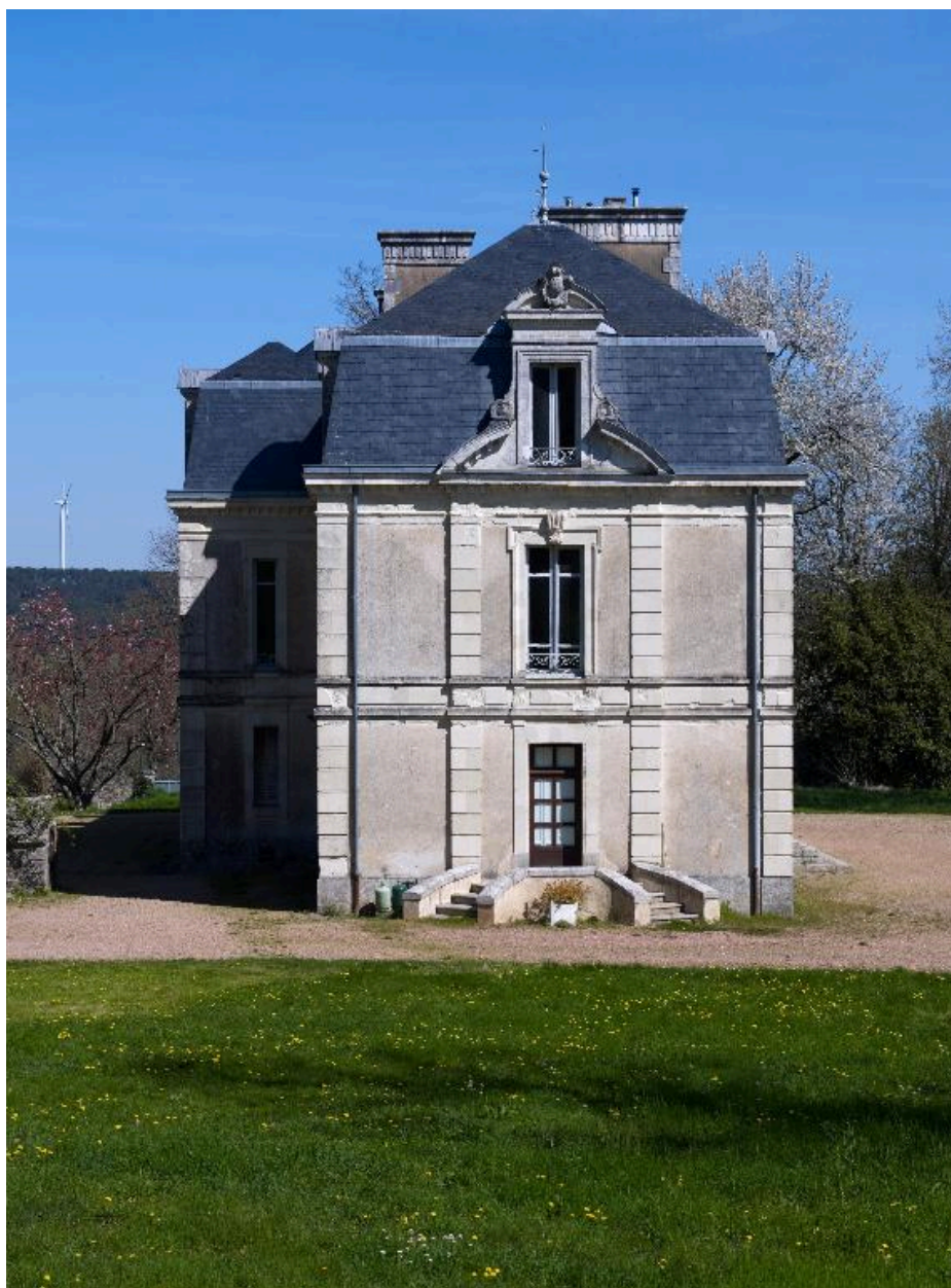
Pignon sud du château