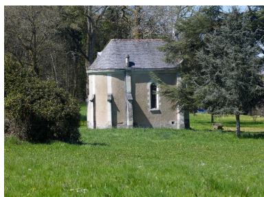
Façade est de la chapelle IVR53_20155600116NUCA