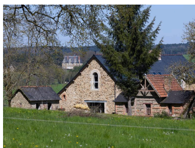
Vue de situation des dépendances du château IVR53_20155600102NUCA