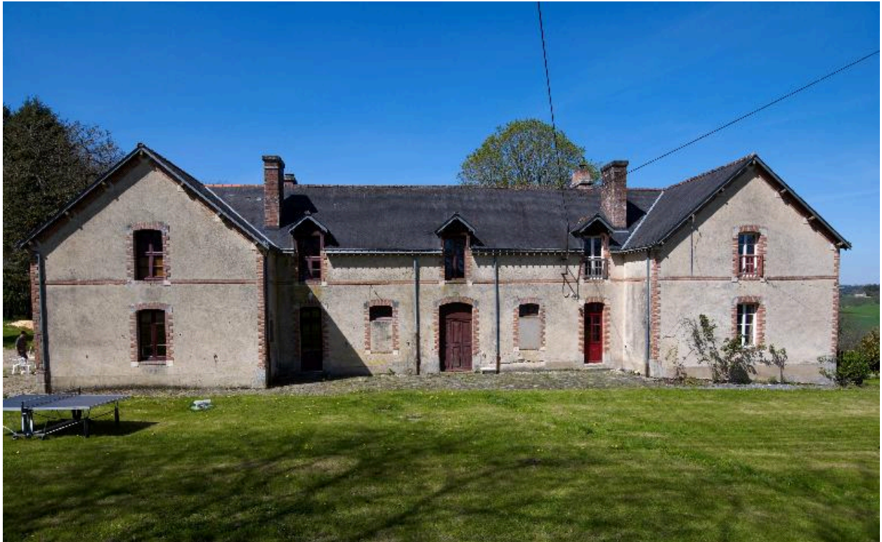
Façade est de la dépendance