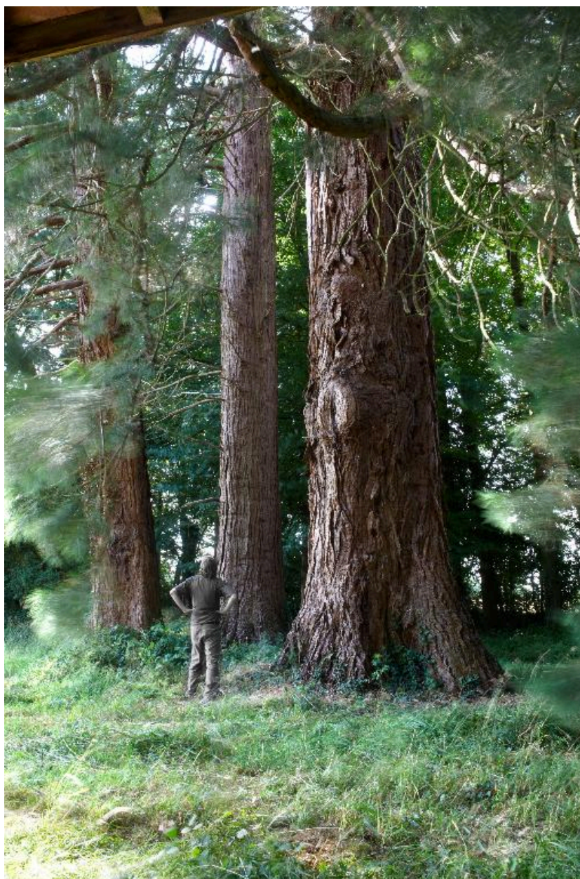
Vue des séquoias géants dans le parc du château