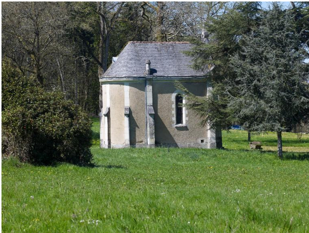
Façade est de la chapelle