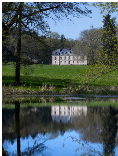
Vue de situation du château IVR53_20155600110NUCA