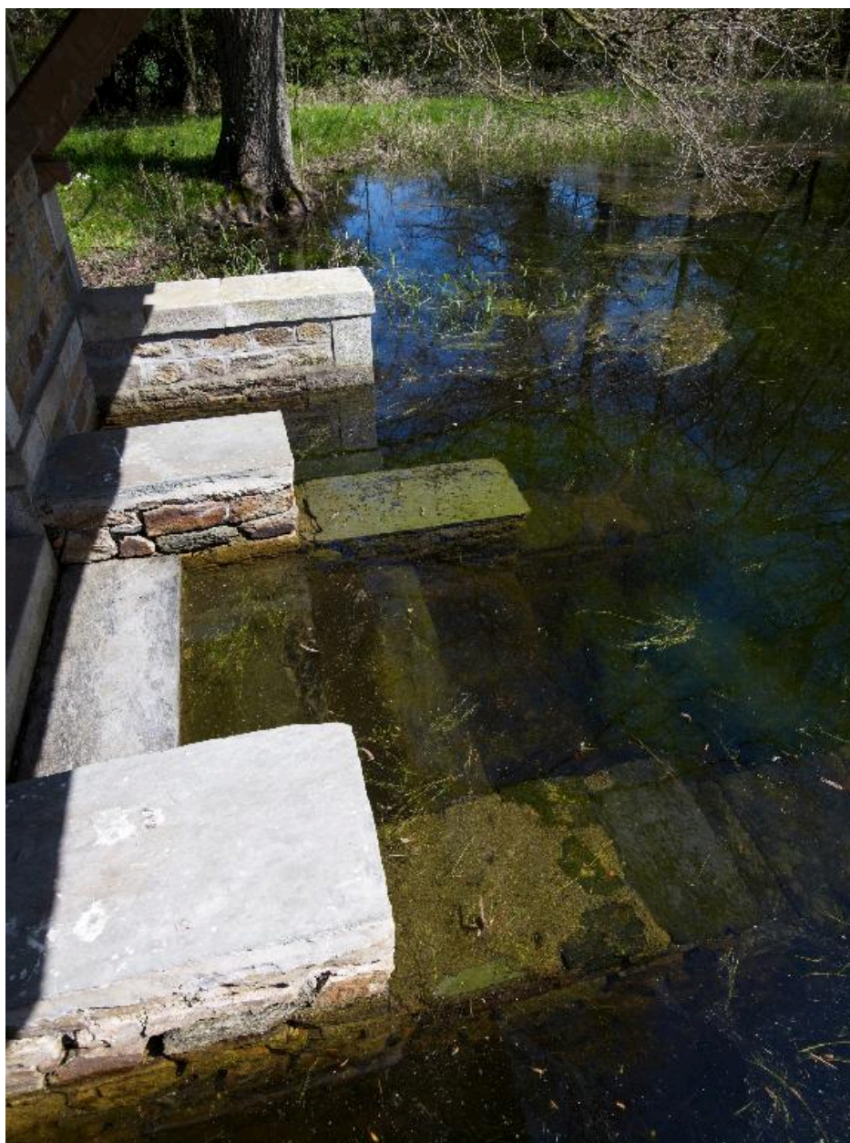
Vue de détail du lavoir