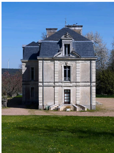
Pignon sud du château IVR53_20155600099NUCA