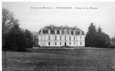
Environs de Malestroit. - PLEUCADEUC. - Le Château de la Morinaye. Carte postale, 1er quart 20e siècle (A. D. d'Ille-&-Vilaine, série 6 Fi) IVR53_20045606268NUCB