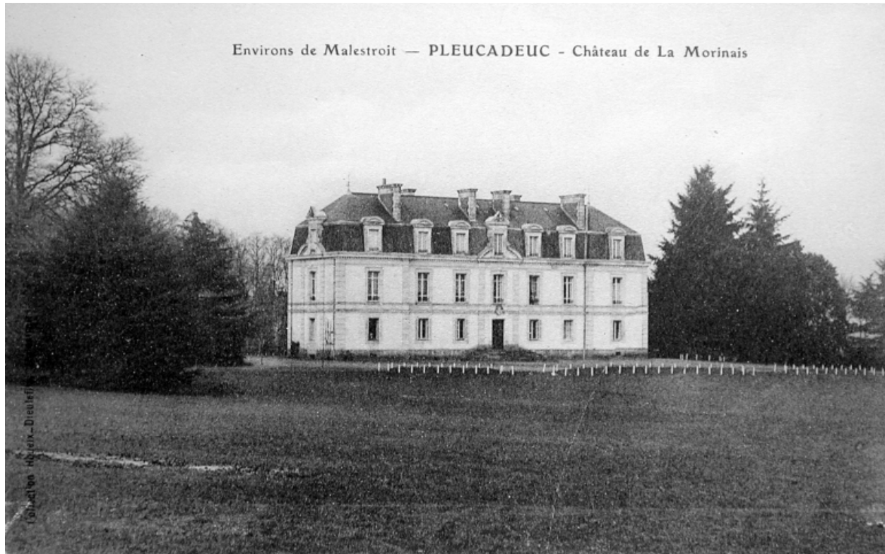
Environs de Malestroit. - PLEUCADEUC. - Le Château de la Morinaye. Carte postale, 1er quart 20e siècle