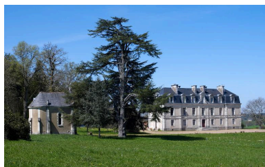
Vue de situation du château IVR53_20155600117NUCA