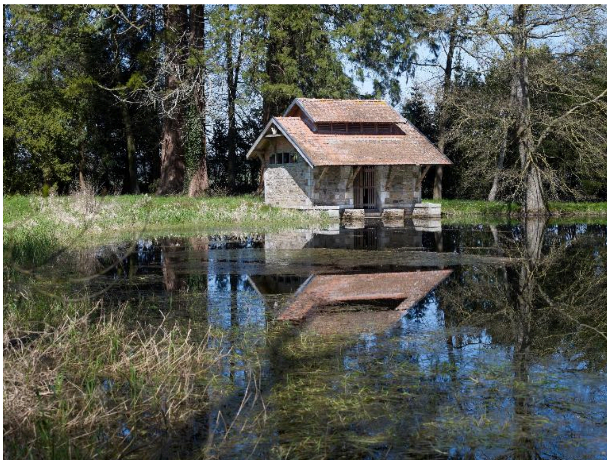
Lavoir privé, de style pittoresque avec buanderie et séchoir bordant la pièce d'eau