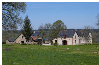
Vue de situation des dépendances du château IVR53_20155600100NUCA