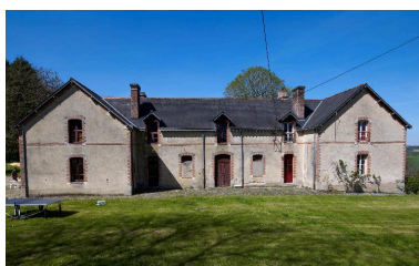
Façade est de la dépendance