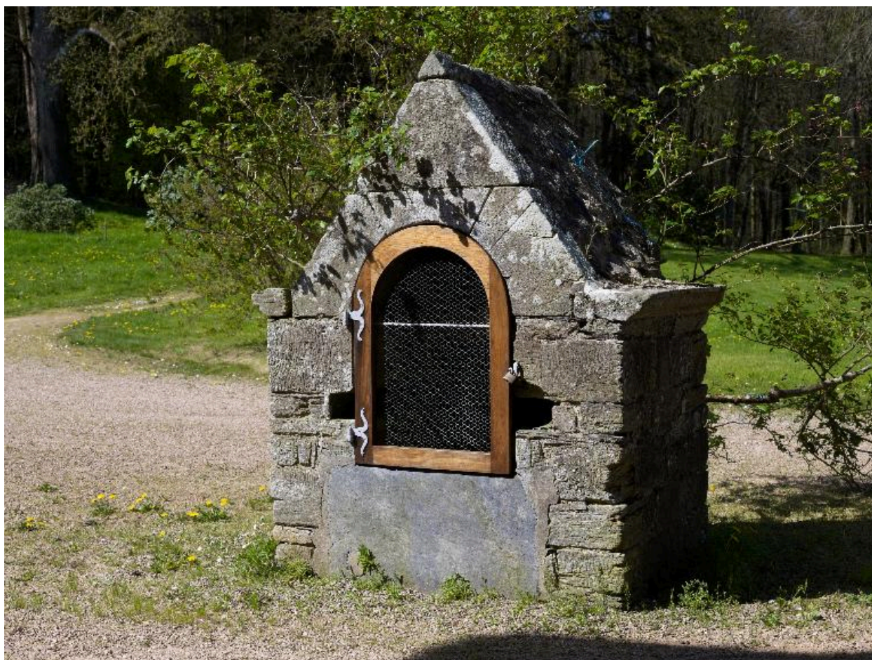
Puits à l'est du château