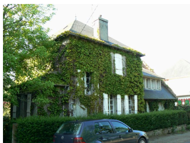
Villas Les Petite Gares, rue de Lesquiffinec