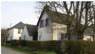
Vue générale de 2 des villas surnommées Les Petites Gares IVR53_20072908637NUCA