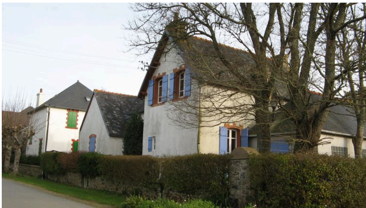
Vue générale de 2 des villas surnommées Les Petites Gares