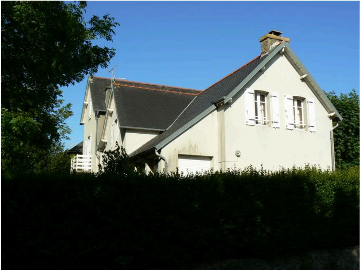
Pignon d'une des villas Les Petites Gares