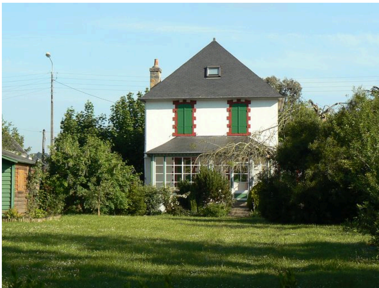
Une des villas Les Petites Gares côté jardin