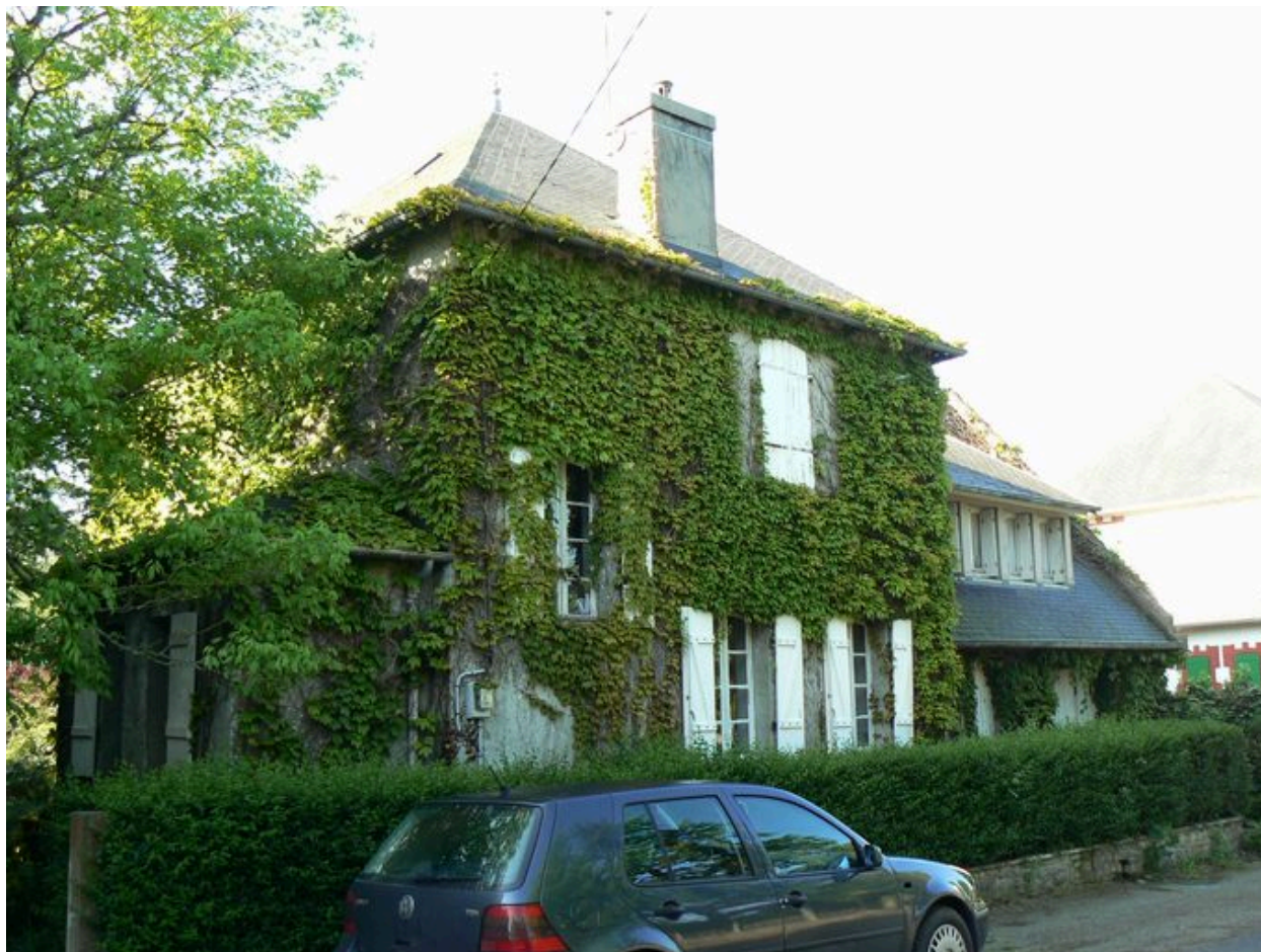
Villas Les Petite Gares, rue de Lesquiffinec