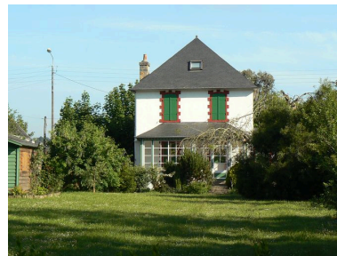
Une des villas Les Petites Gares côté jardin