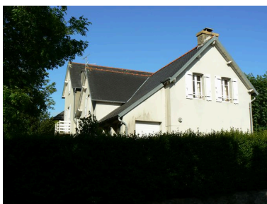
Pignon d'une des villas Les Petites Gares