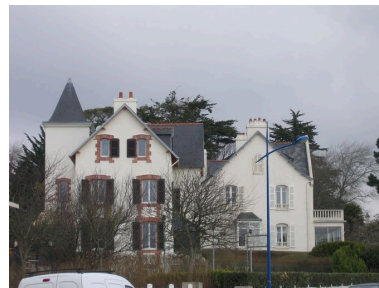
Vue latérale de la villa Ker Lisanton IVR53_20062908634NUCA