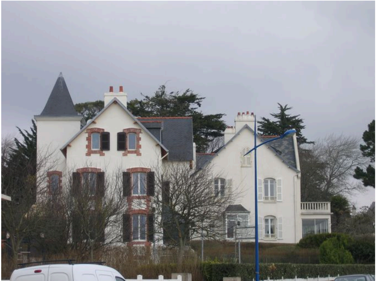
Vue latérale de la villa Ker Lisanton