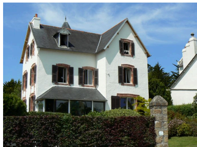
Vue générale de la villa Ker Lisanton IVR53_20072908691NUCA