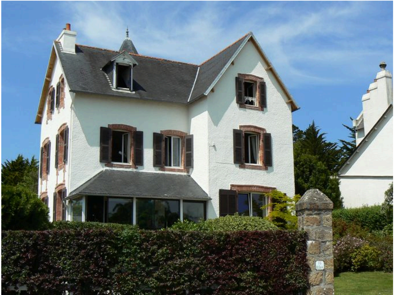
Vue générale de la villa Ker Lisanton