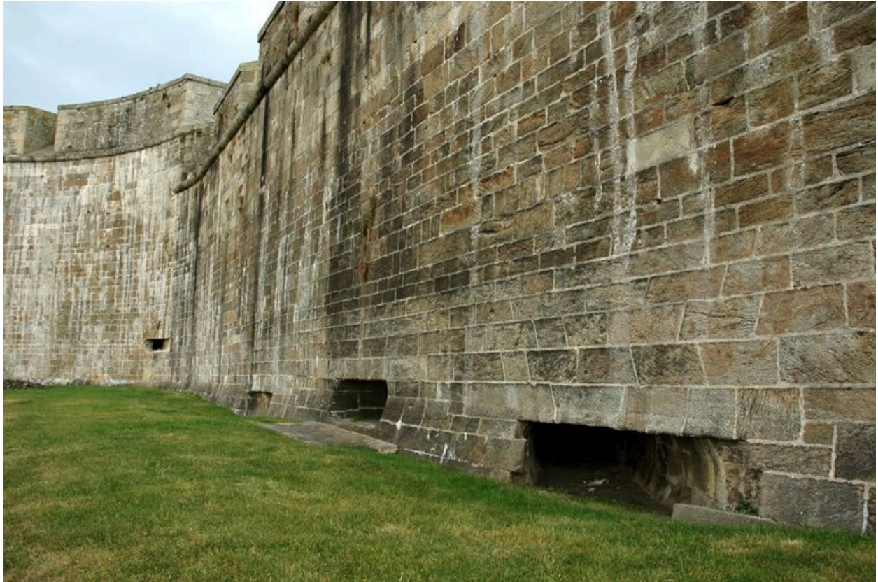
Vue générale de Saint-Malo : château, canonnières de la partie dit ouvrage de la Galère (peut-être due à l'architecte de la Renaissance Philibert de L'Orme)