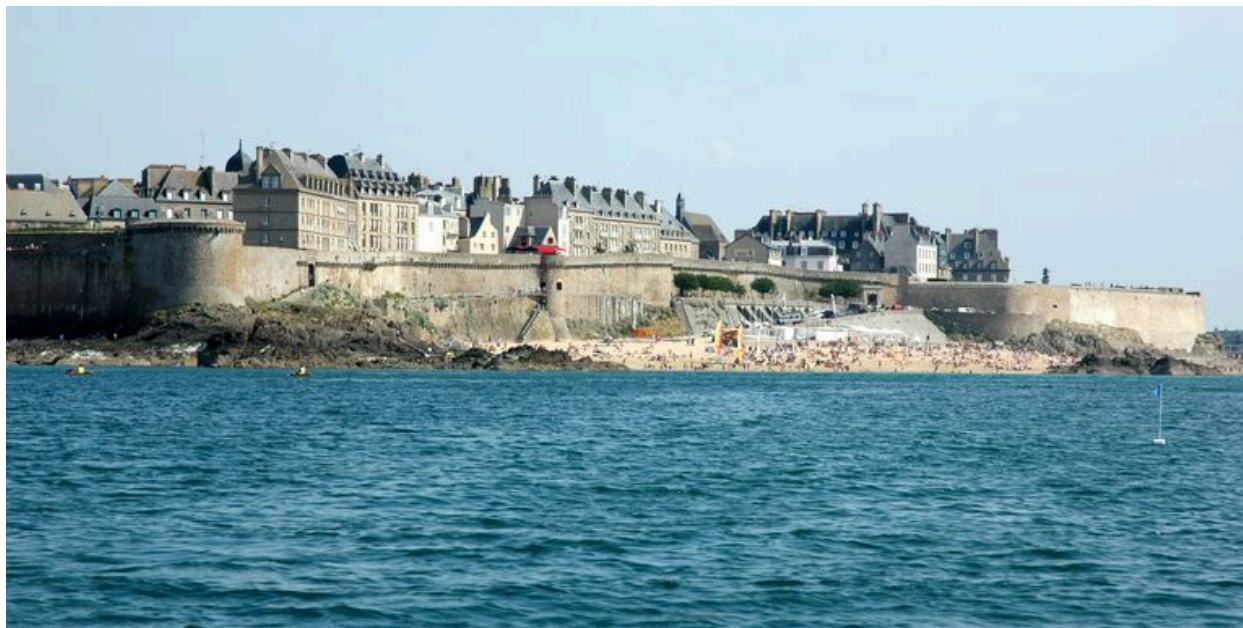
Vue générale de Saint-Malo depuis la mer