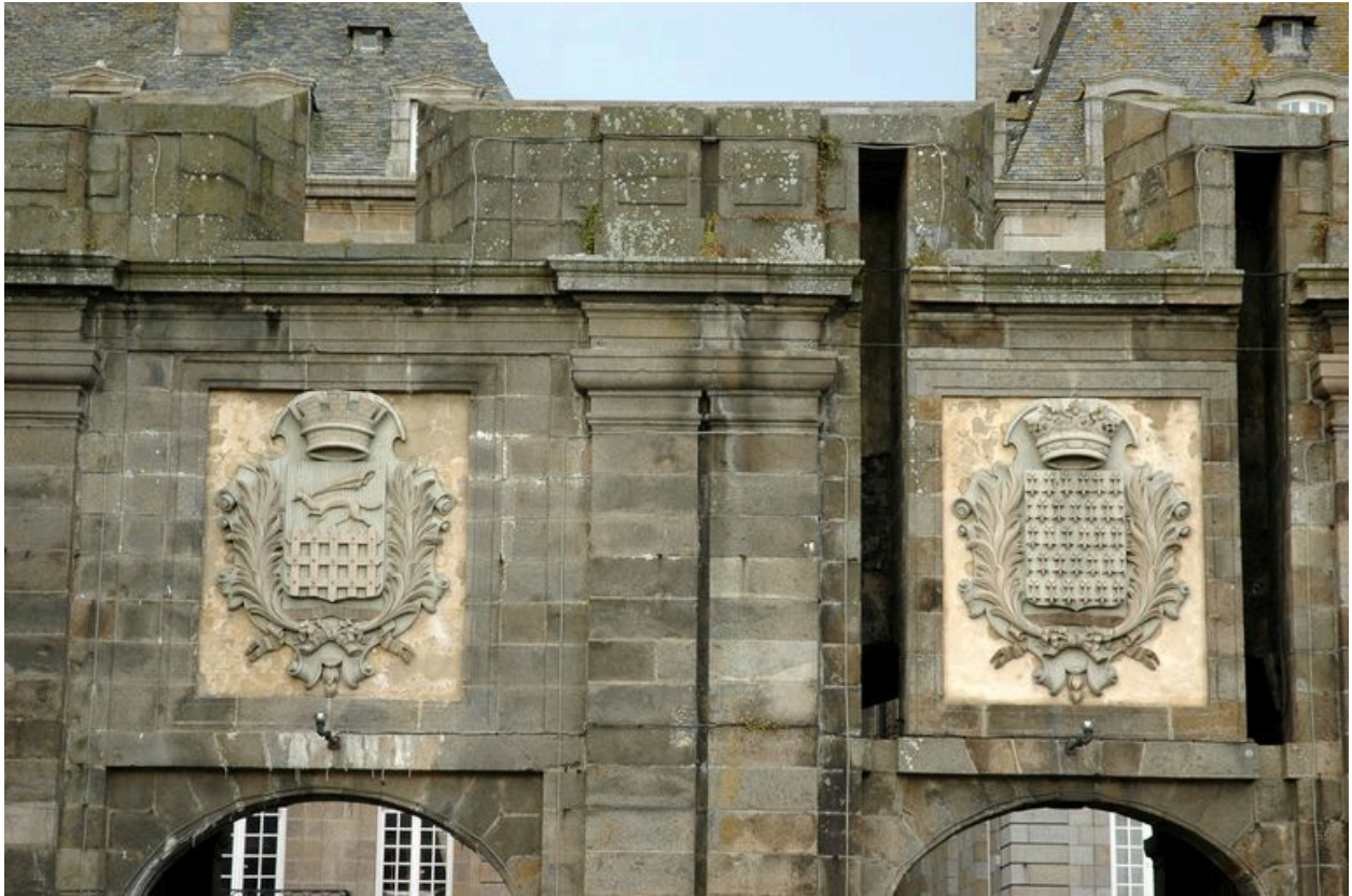
Vue de Saint-Malo : détail de la porte Saint-Vincent