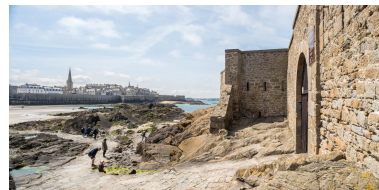
Vue panoramique du site défensif : fortifications de la ville et Fort National