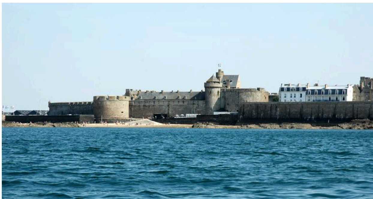
Vue générale de Saint-Malo depuis la mer : château