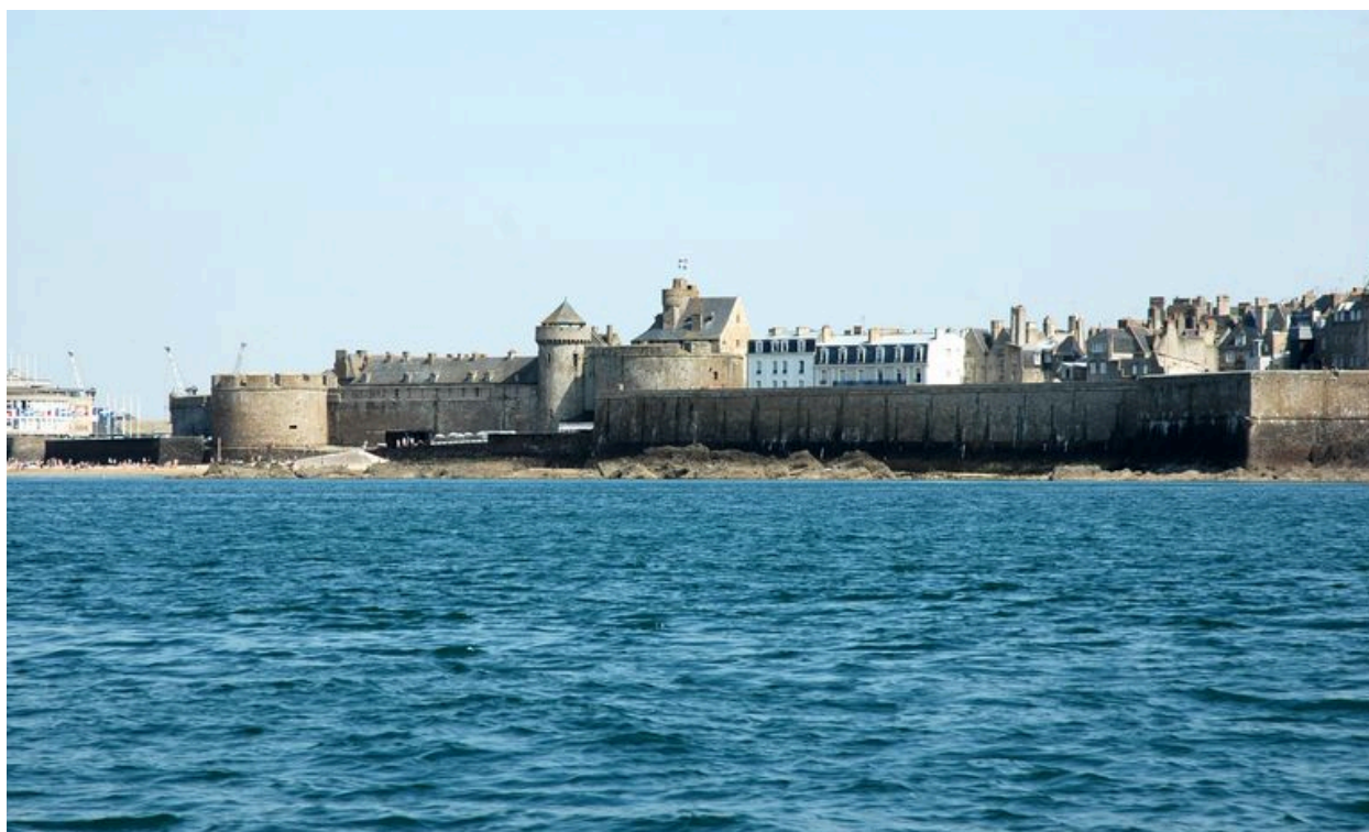
Vue générale de Saint-Malo depuis la mer : château