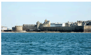
Vue générale de Saint- Malo depuis la mer : château