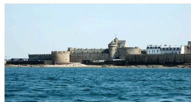
Vue générale de Saint- Malo depuis la mer : château IVR53_20063517668NUCA