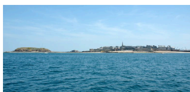
Vue générale de Saint- Malo depuis la mer