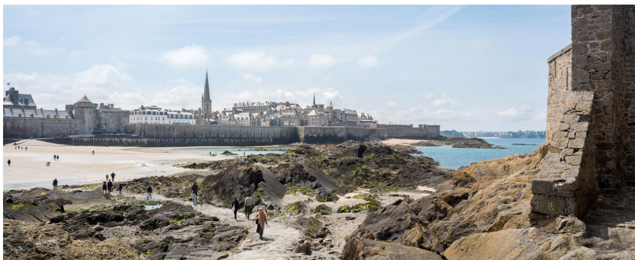
Vue générale des fortifications depuis le Fort National : château, cathédrale, batterie de Fort La Reine