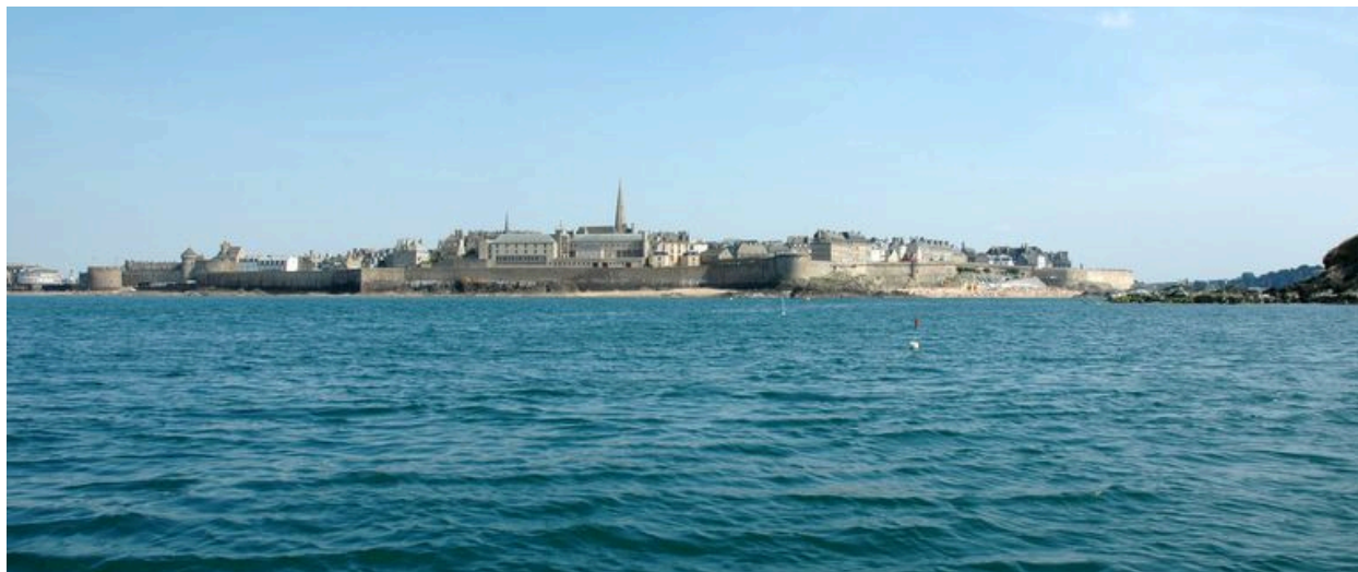
Vue générale de Saint-Malo depuis la mer