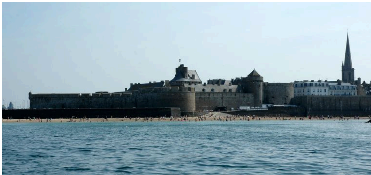
Vue générale de Saint-Malo depuis la mer : château