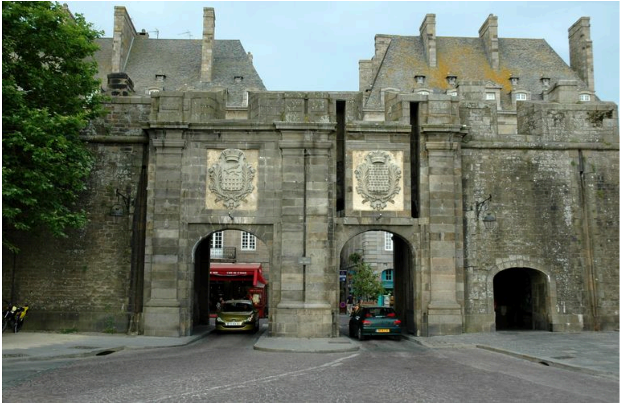
Vue de Saint-Malo : porte Saint-Vincent