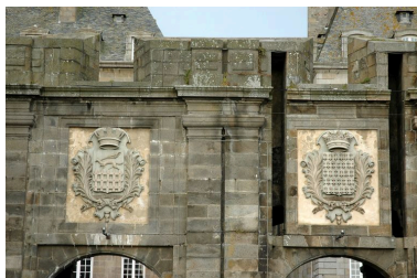
Vue de Saint-Malo : détail de la porte Saint-Vincent