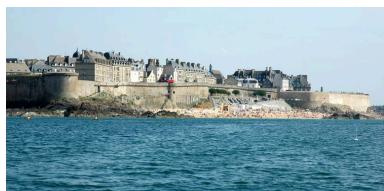
Vue générale de Saint- Malo depuis la mer IVR53_20063517666NUCA