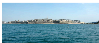
Vue générale de Saint- Malo depuis la mer