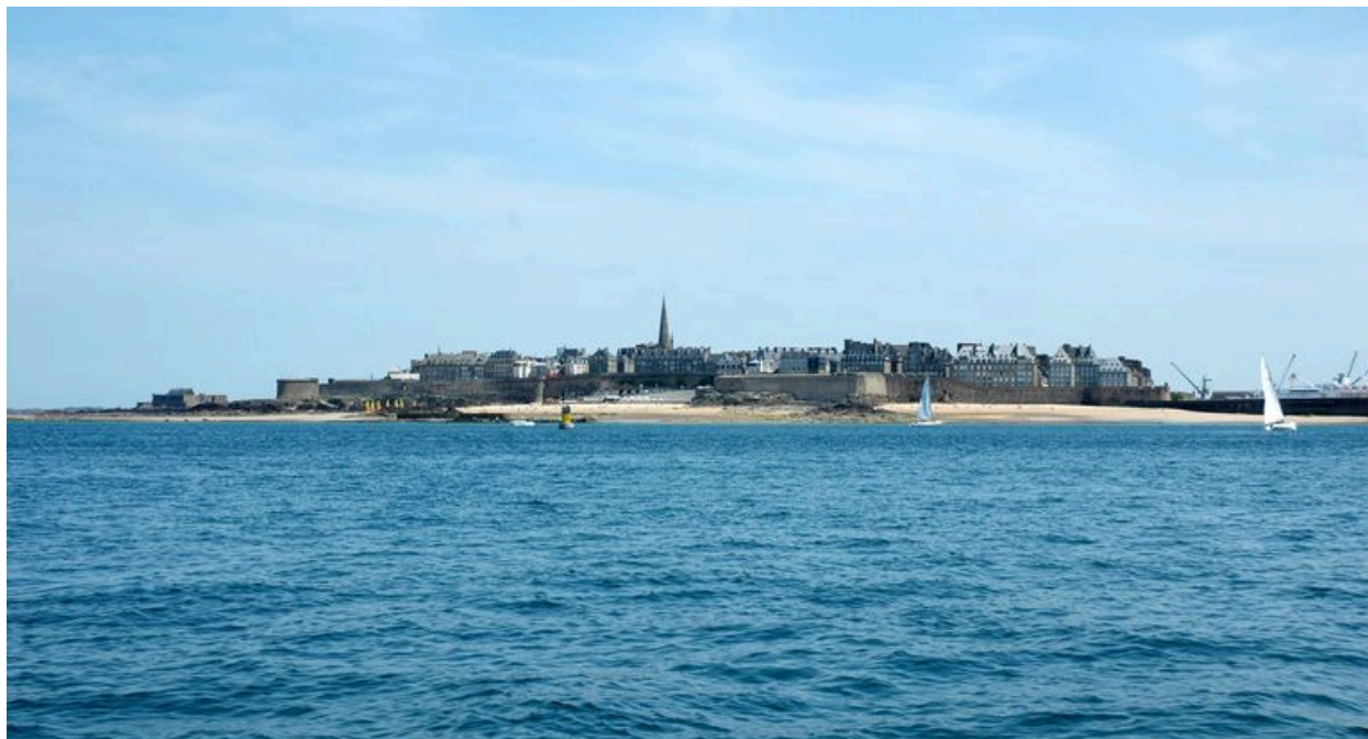
Vue générale de Saint-Malo depuis la mer