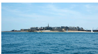
Vue générale de Saint- Malo depuis la mer IVR53_20063517664NUCA