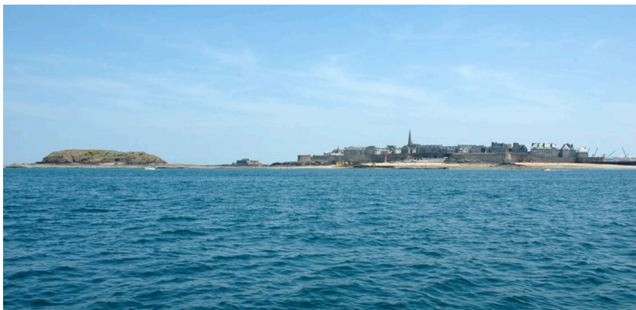
Vue générale de Saint-Malo depuis la mer