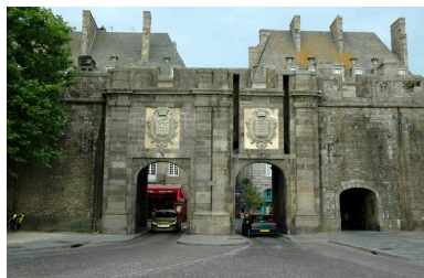
Vue de Saint-Malo : porte Saint-Vincent