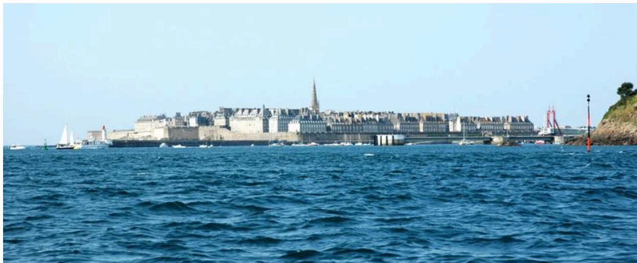
Vue générale de Saint-Malo depuis la mer