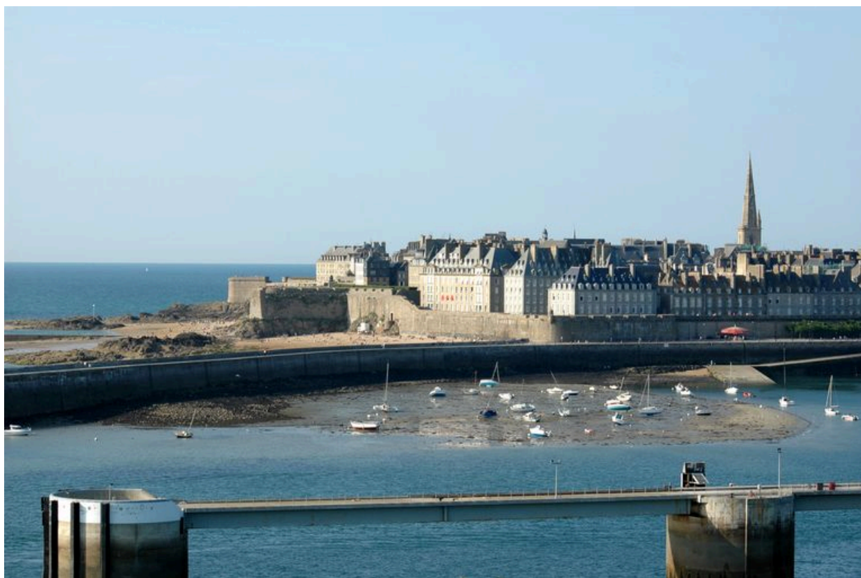
Vue générale de la ville de Saint-Malo depuis le fort de la Cité d'Aleth