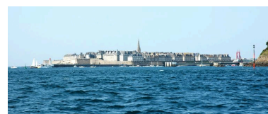
Vue générale de Saint-Malo depuis la mer