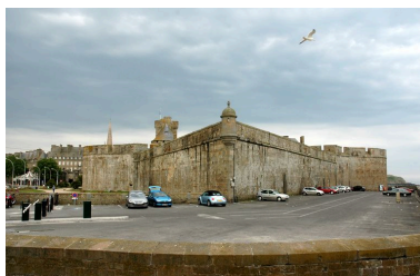
Vue générale de Saint-Malo : château, partie dit ouvrage de la Galère (peut-être due à l'architecte de la Renaissance Philibert de L'Orme) IVR53_20063517670NUCA