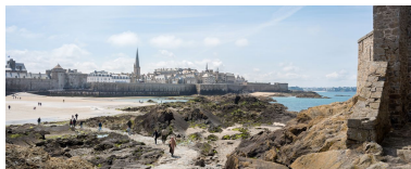
Vue générale des fortifications depuis le Fort National : château, cathédrale, batterie de Fort La Reine