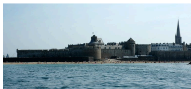
Vue générale de Saint- Malo depuis la mer : château IVR53_20063517669NUCA