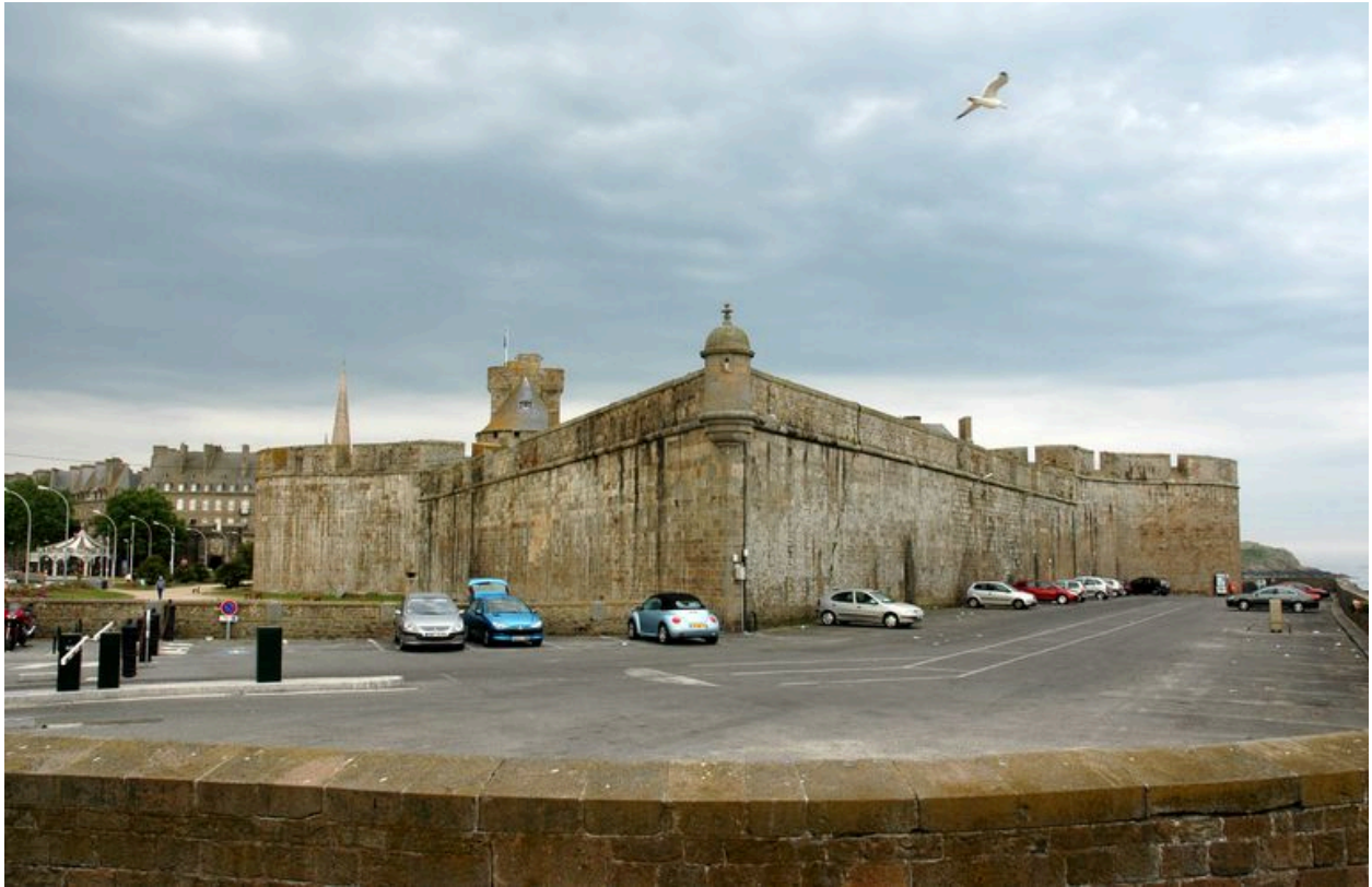
Vue générale de Saint-Malo : château, partie dit ouvrage de la Galère (peut-être due à l'architecte de la Renaissance Philibert de L'Orme)