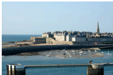
Vue générale de la ville de Saint- Malo depuis le fort de la Cité d'Aleth IVR53_20053522692NUCA

Vue aérienne de la ville close de Saint-Malo et de sa ceinture de forts maritimes, Orthophotographie littorale 2004 IVR53_20042904286NUCA