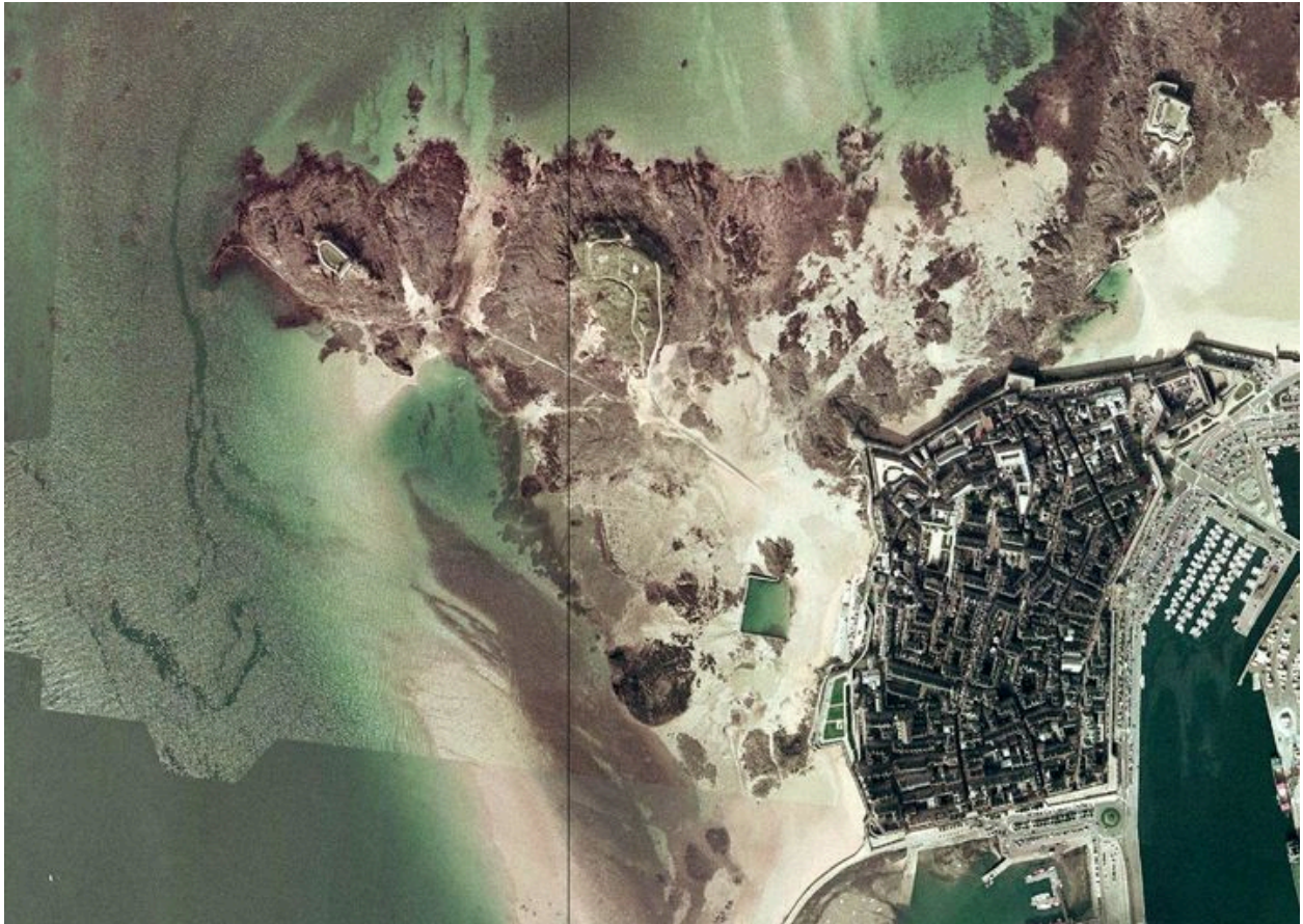
Vue aérienne de la ville close de Saint-Malo et de sa ceinture de forts maritimes, Orthophotographie littorale 2004