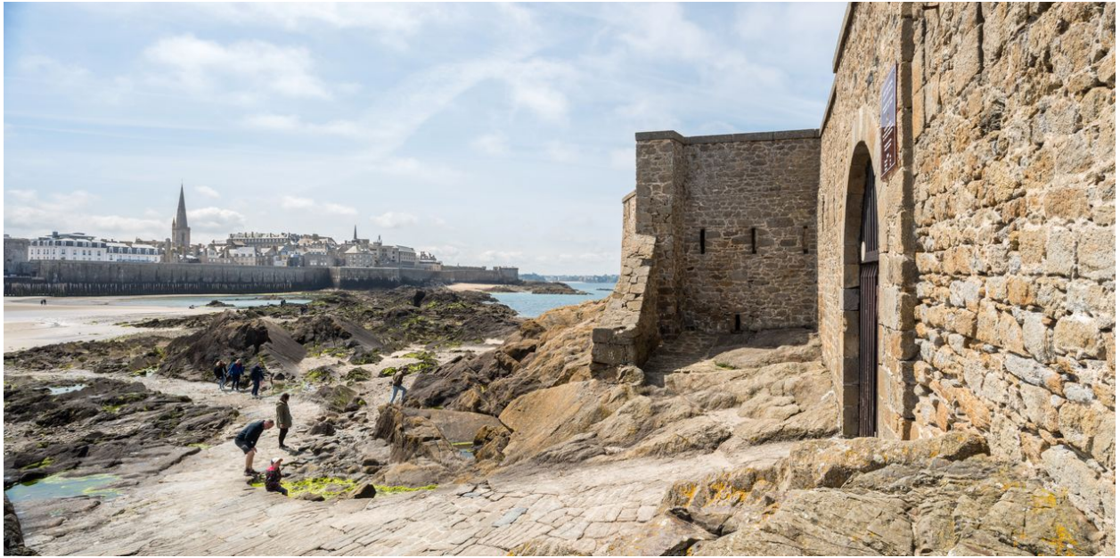
Vue panoramique du site défensif : fortifications de la ville et Fort National