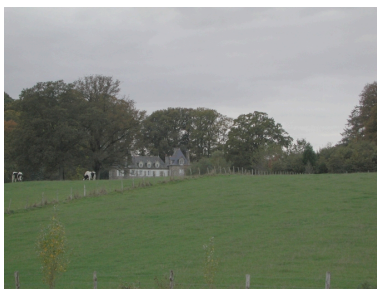
Vue de situation est IVR53_20003516699NUCA

IVR53_19883500290X