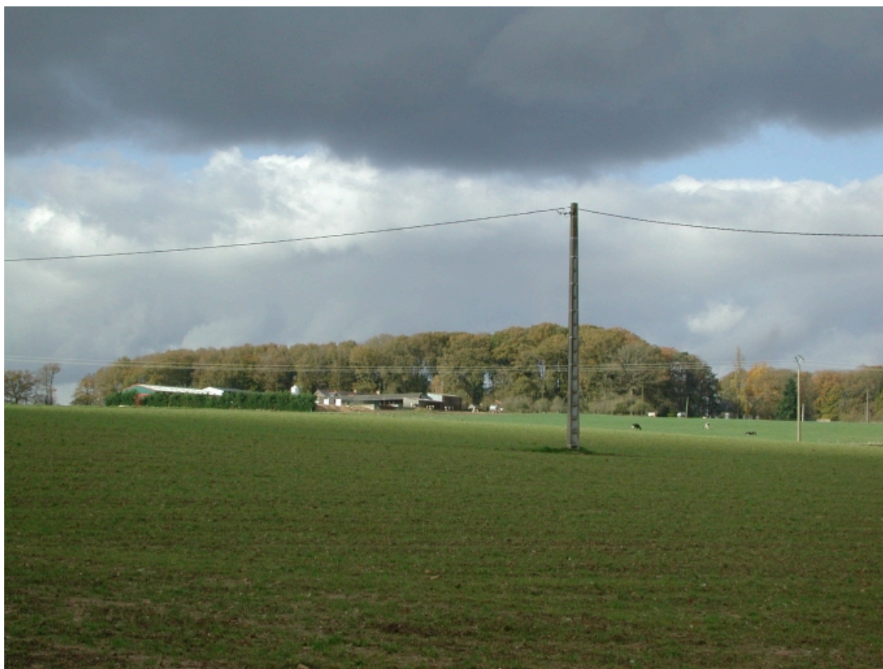
Vue de situation sud-est du site