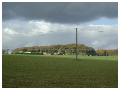
Vue de situation sud-est du site IVR53_20003516925NUCA

IVR53_20003517025NUC