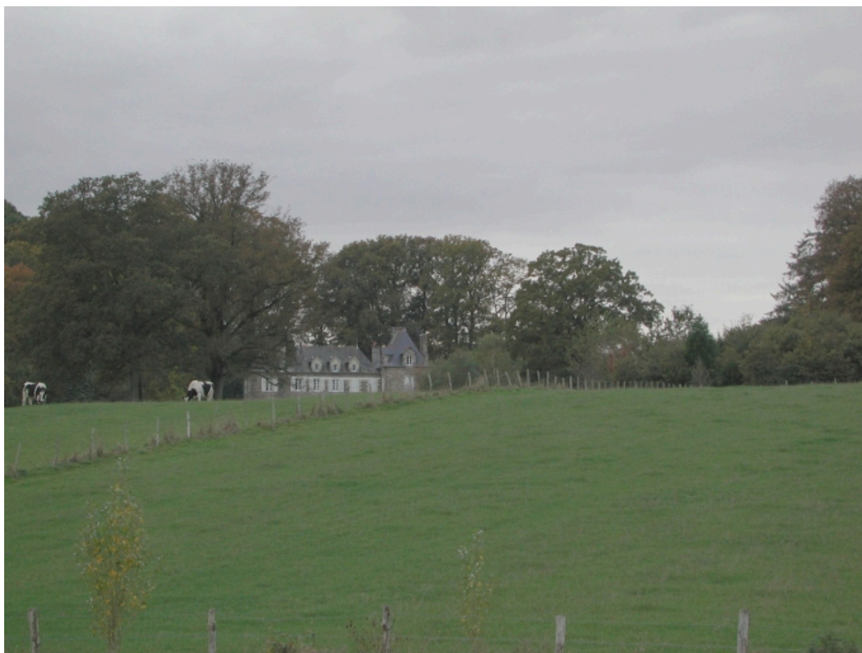
Vue de situation est