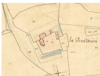
Plan masse de 1831