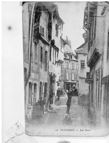
Façade enduite du 12 rue Beaumanoir à droite du cliché IVR53_19855600240VB