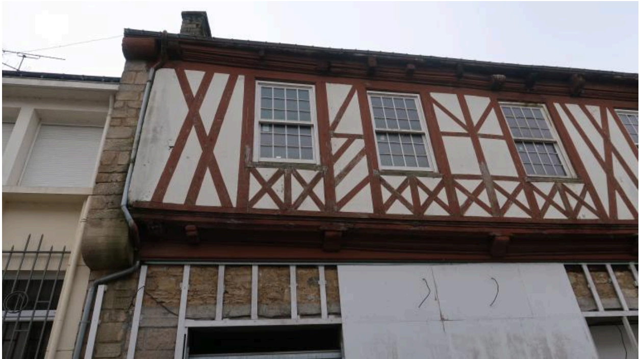
Vue rapprochée de la façade (état 2019)