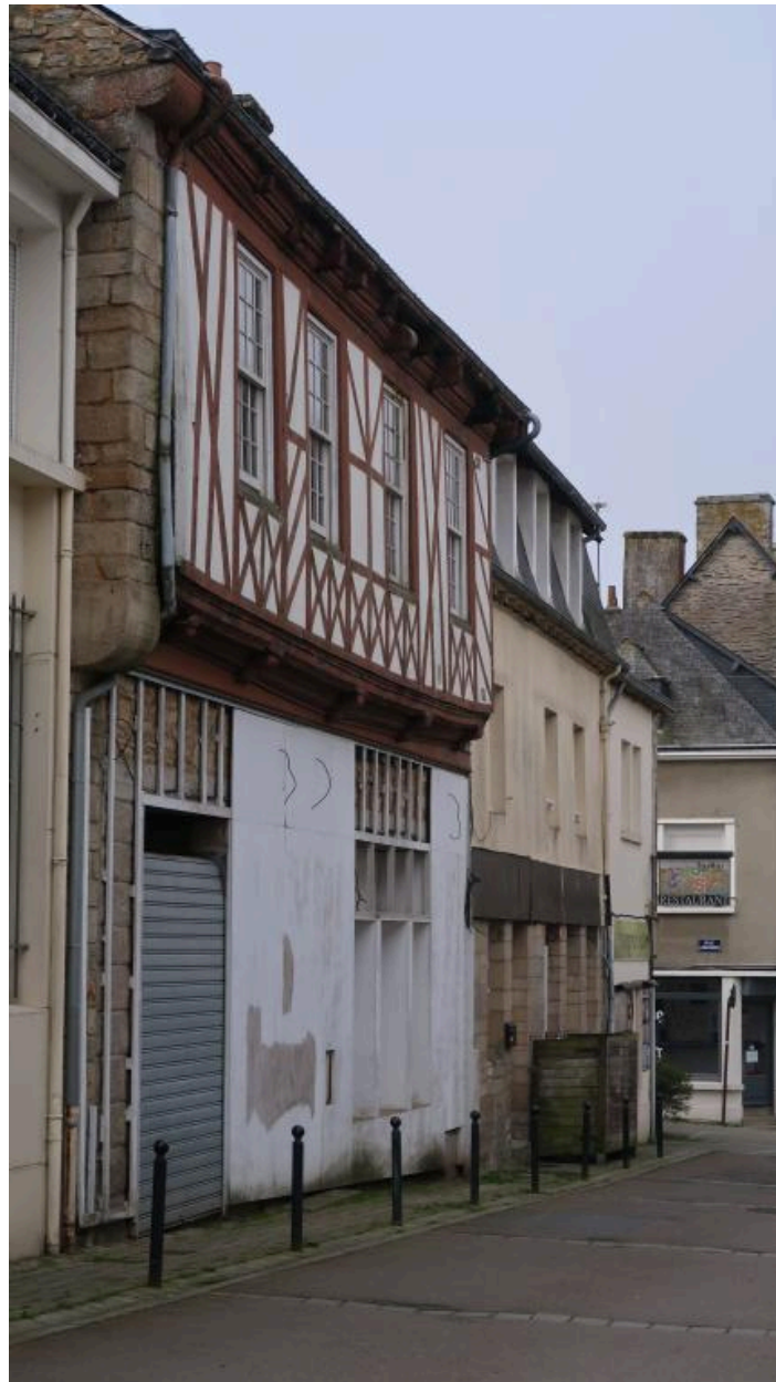
Façade du 12 rue Beaumanoir avec rdc en travaux (2019)