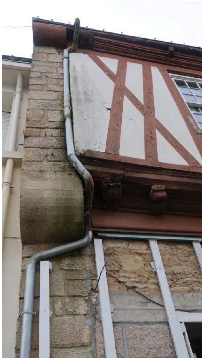
Vue rapprochée du mur en encorbellement et des modifications (état 2019)