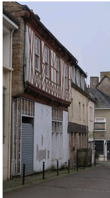
Façade du 12 rue Beaumanoir avec rdc en travaux (2019) IVR53_20195606107NUCA