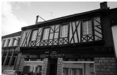
Salon de coiffure occupant en 1967 le rdc remanié de cette maison à pans de bois IVR53_19675605070Z