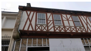
Vue rapprochée de la façade (état 2019)