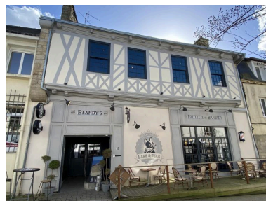
Façade nord IVR53_20265610750NUCA