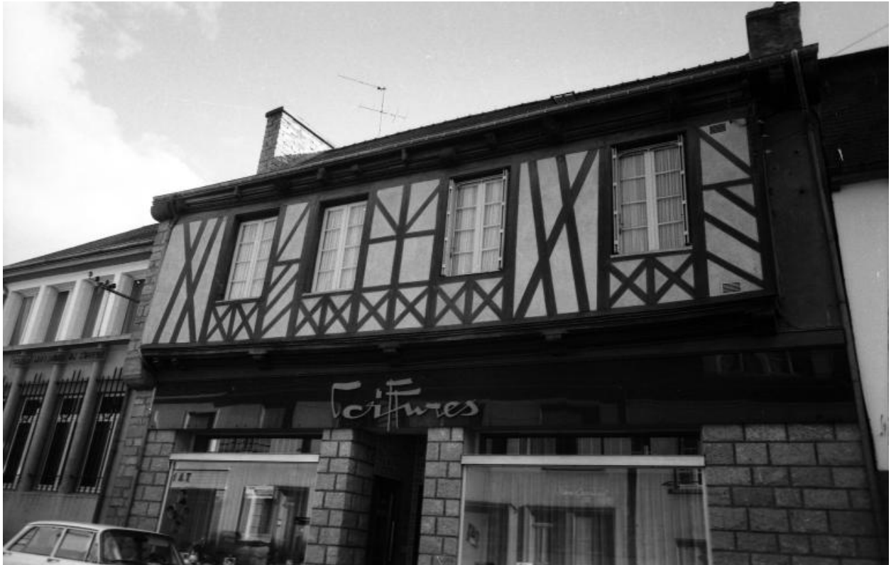
Salon de coiffure occupant en 1967 le rdc remanié de cette maison à pans de bois