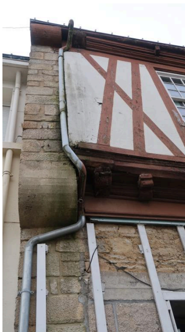
Vue rapprochée du mur en encorbellement et des modifications (état 2019)