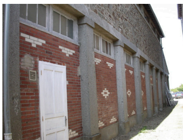
Mur nord IVR53_20053518174NUCA