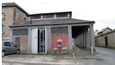
Vue ouest des anciennes halles IVR53_20253510350NUCA