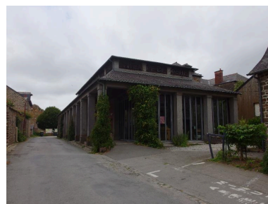
Vue sud est des anciennes halles IVR53_20253510348NUCA