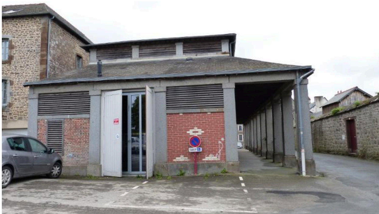
Vue ouest des anciennes halles