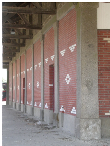
Mur sud IVR53_20053518173NUCA