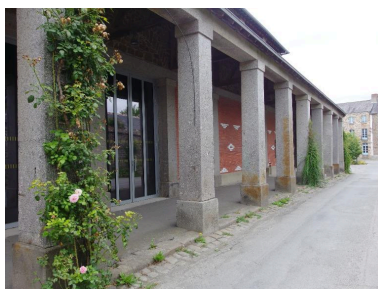
Vue sud des anciennes halles IVR53_20253510347NUCA