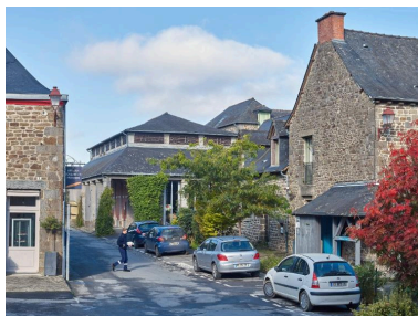
Rue Saint-Louis, depuis la place de la Mairie.