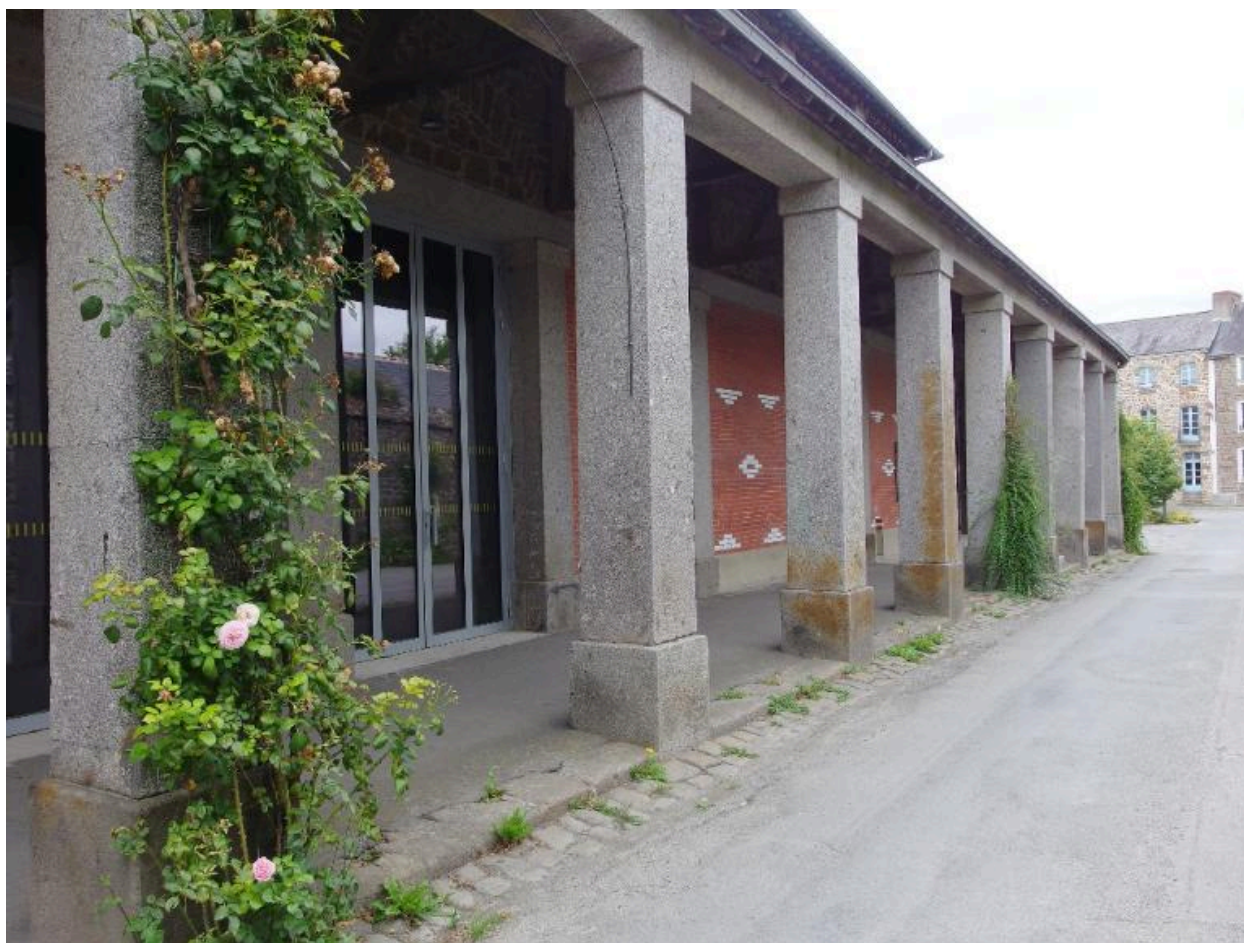
Vue sud des anciennes halles