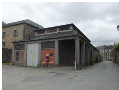
Vue sud ouest des anciennes halles IVR53_20253510349NUCA