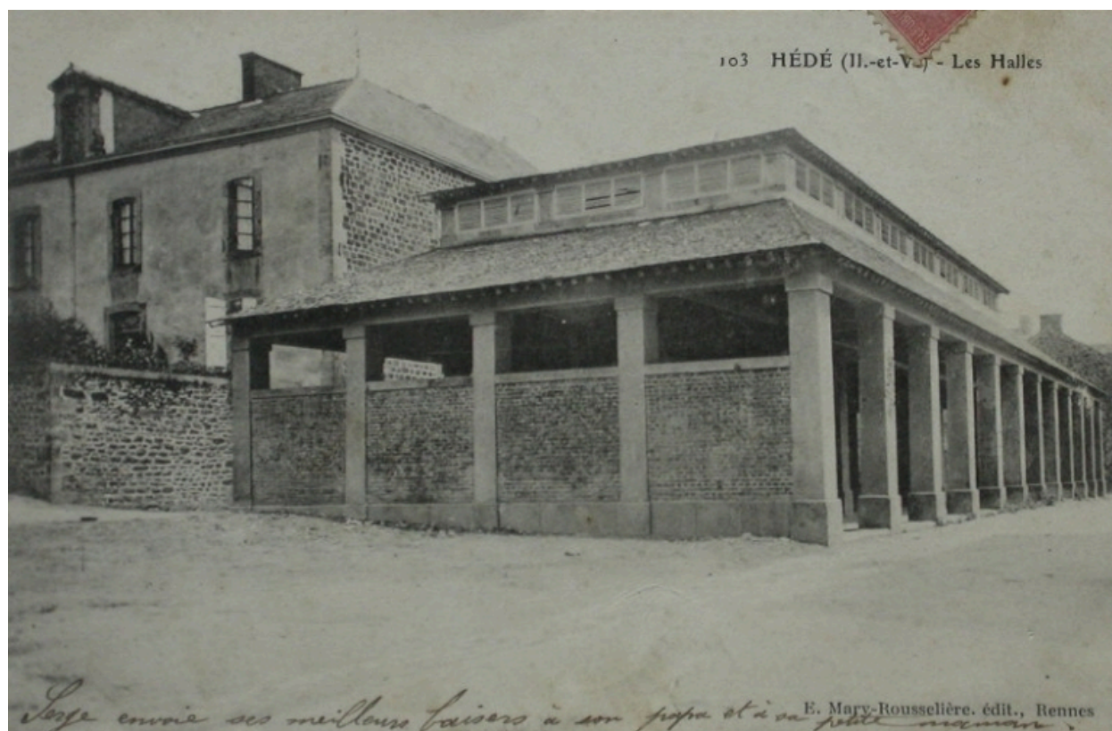
Les halles sur une carte postale ancienne