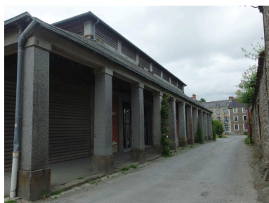
Vue sud des anciennes halles