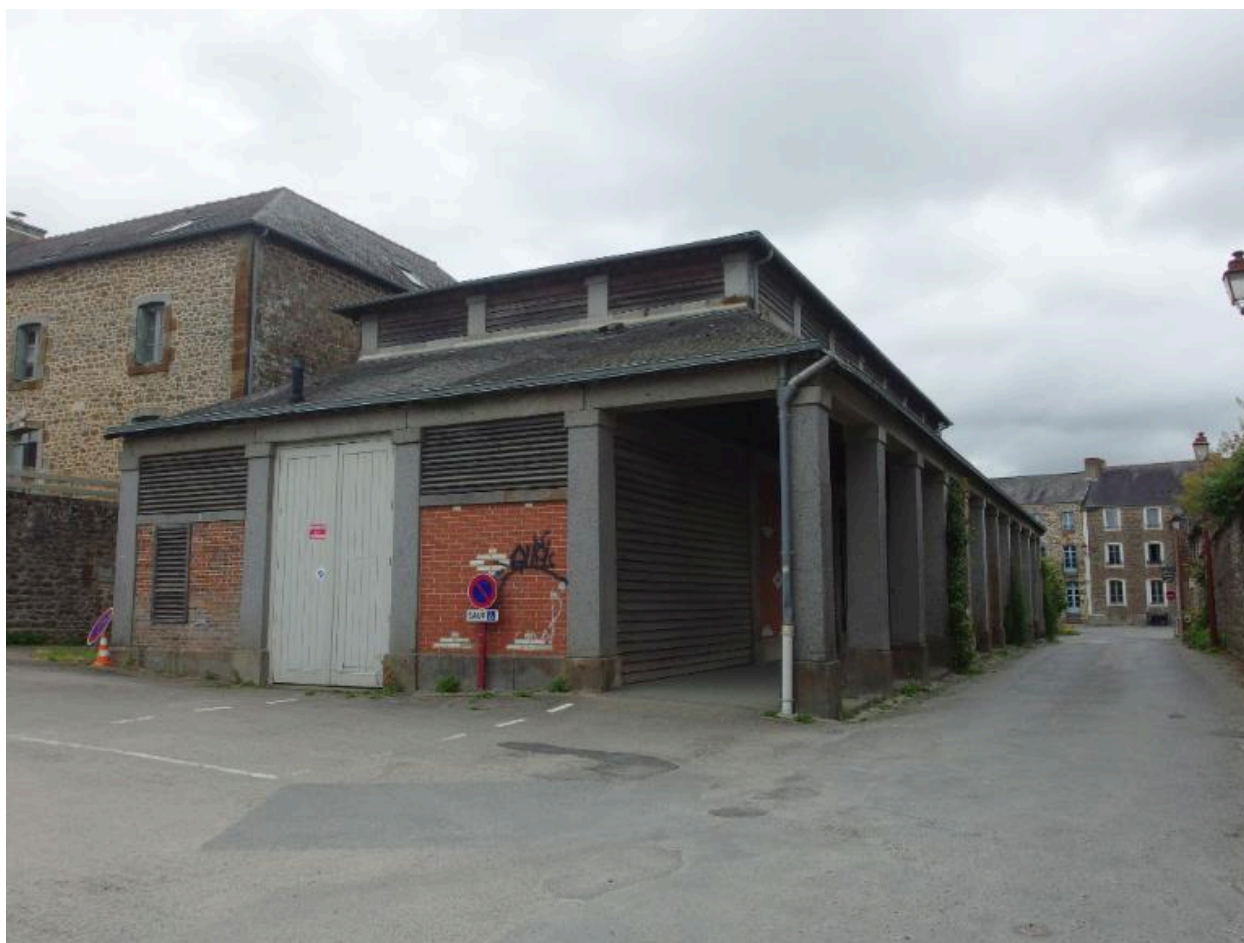
Vue sud ouest des anciennes halles