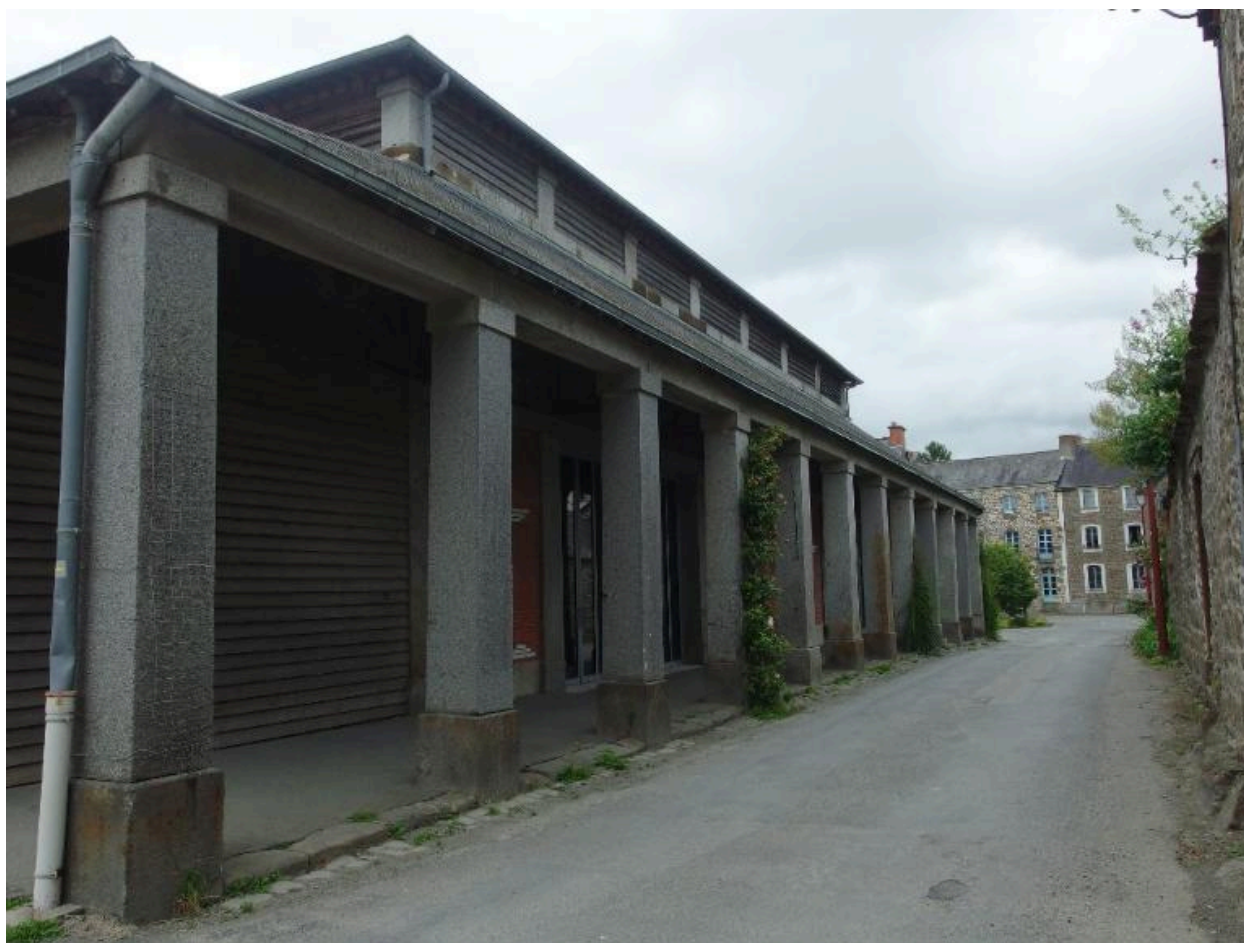
Vue sud des anciennes halles