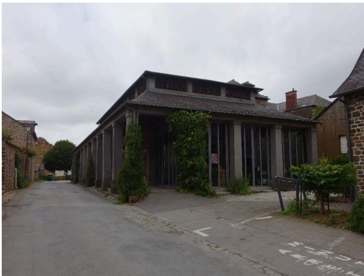
Vue sud est des anciennes halles