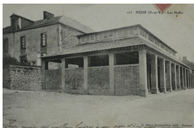
Les halles sur une carte postale ancienne IVR53_20053519237NUCA