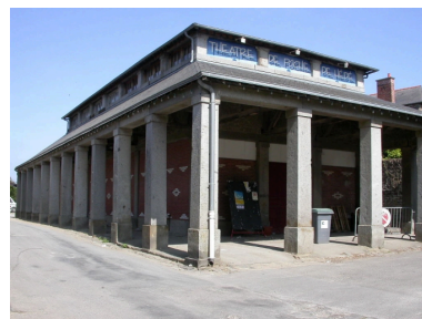
Vue générale sud-est IVR53_20053518172NUCA