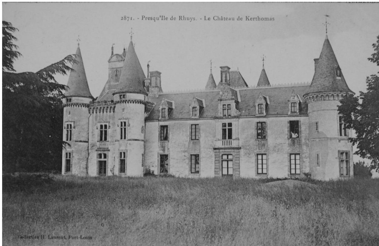
Vue de la façade sur jardin