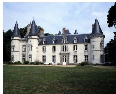
Elévation sud IVR53_19935601811XA