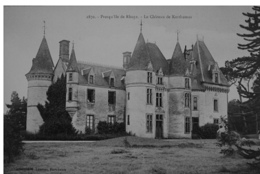
Vue de la façade antérieure