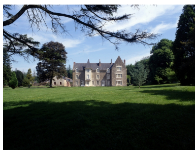
Elévation nord, IVR53_19935601810XA