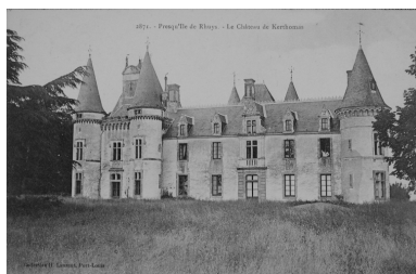
Vue de la façade sur jardin IVR53_20035604293NUCB