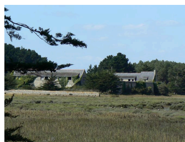
Ferme de la Villeneuve