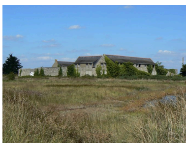
Vue générale de la ferme de la Villeneuve