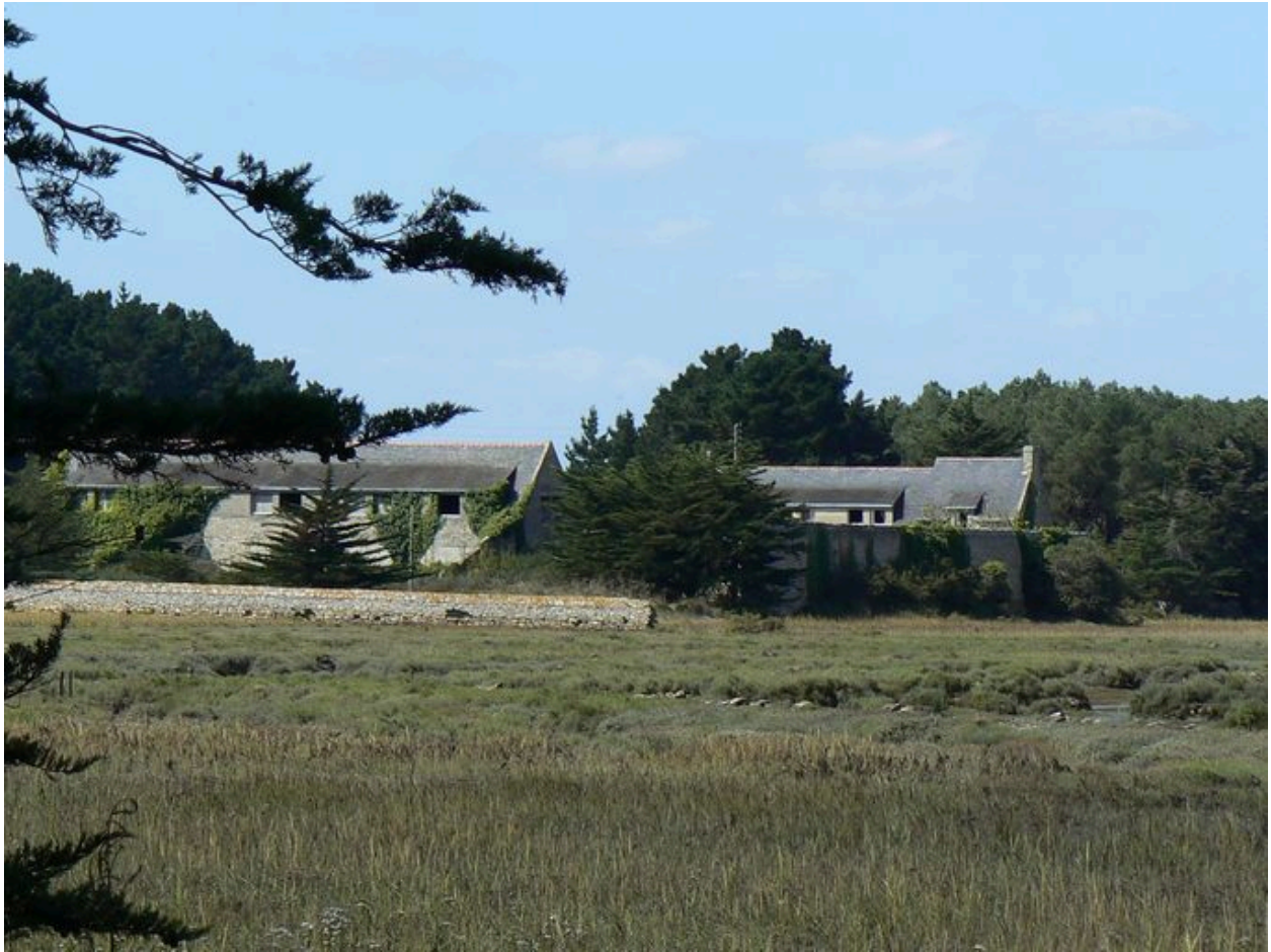
Ferme de la Villeneuve