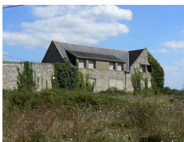
Détail de la ferme de la Villeneuve IVR53_20075605714NUCA