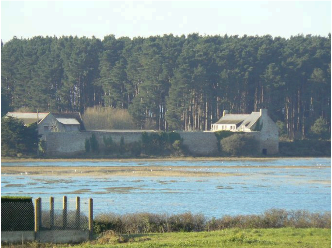
Ferme de la Villeneuve avec l'anse Mancel au premier plan