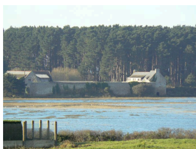
Ferme de la Villeneuve avec l'anse Mancel au premier plan IVR53_20075605713NUCA