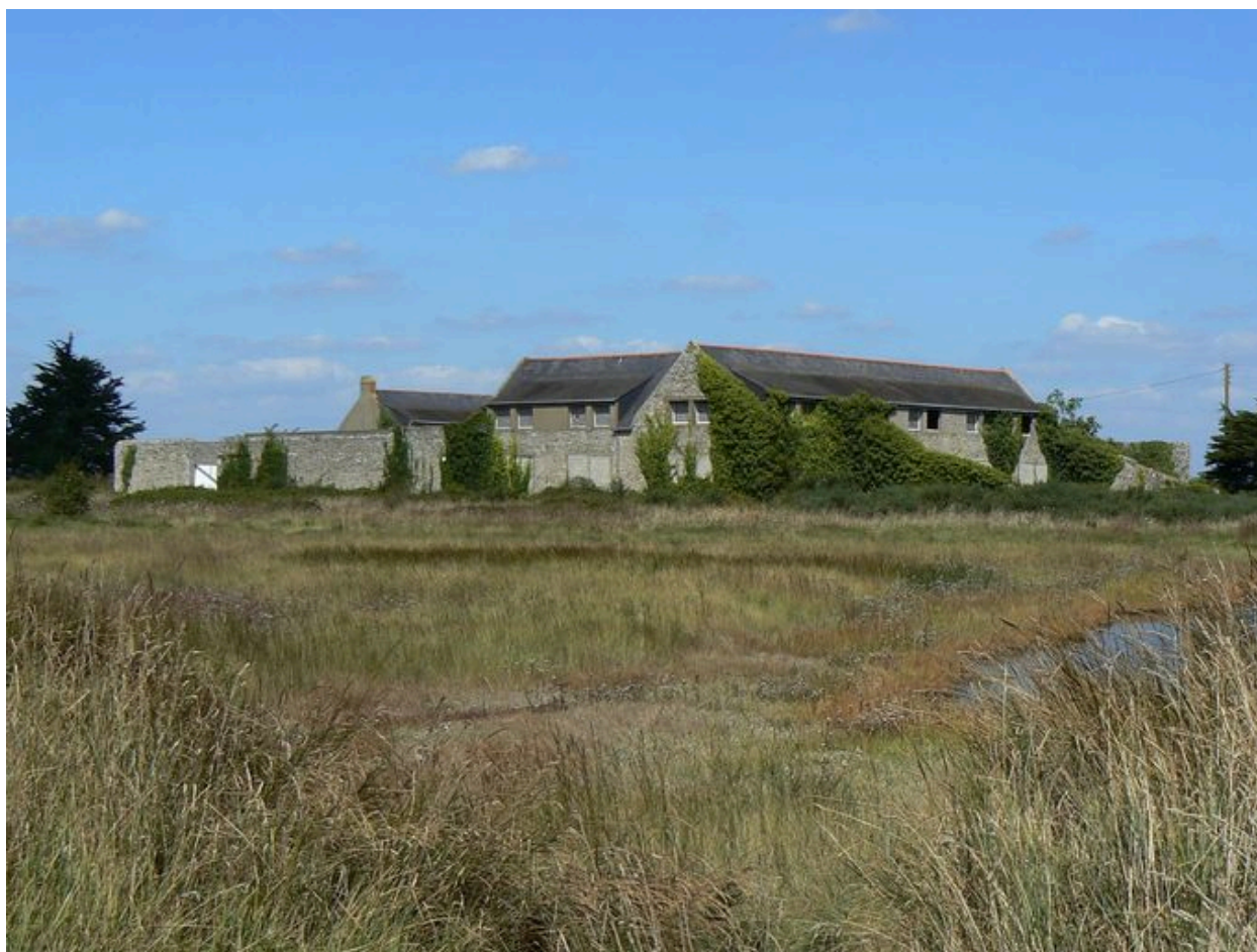
Vue générale de la ferme de la Villeneuve