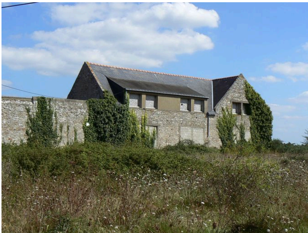
Détail de la ferme de la Villeneuve