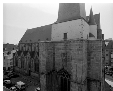
Élévation nord, vue générale. IVR53_19953500212X