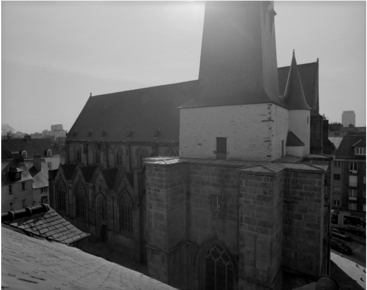
Elévation nord, vue générale