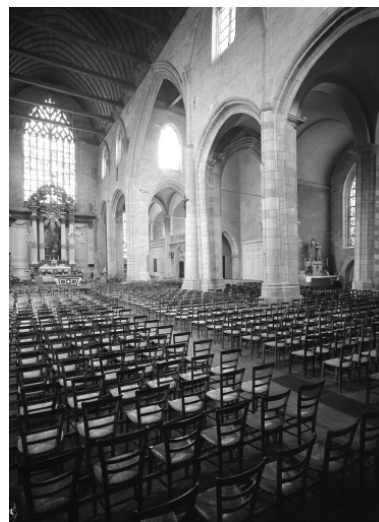
Vue intérieure prise de la nef vers le bas-côté Sud IVR53_19863500112V