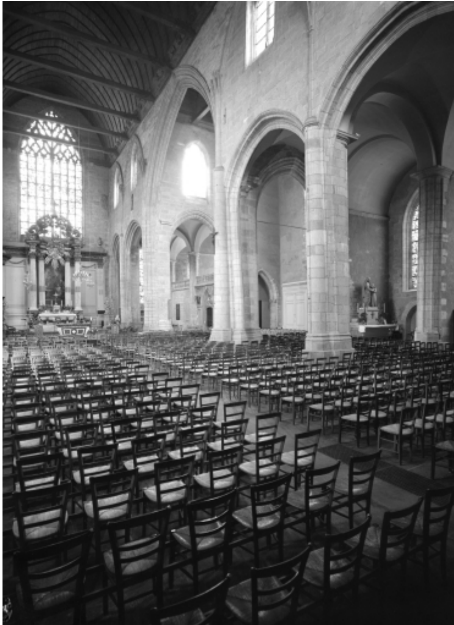
Vue intérieure prise de la nef vers le bas-côté Sud