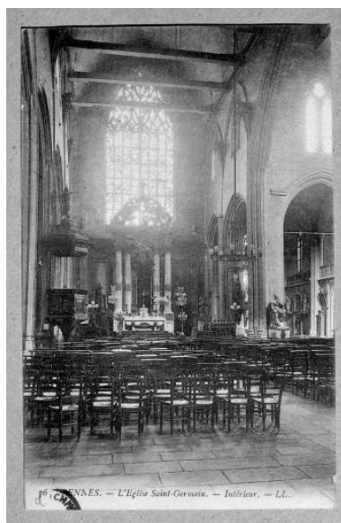
Intérieur, chœur : vue générale, IVR53_19933500959X