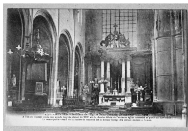
Intérieur, vue générale vers le chœur IVR53_19933500960X