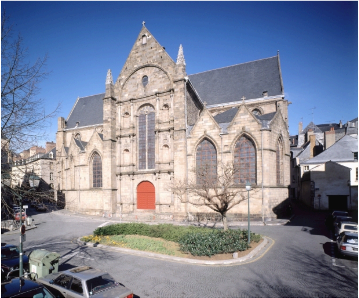
Elévation sud, vue générale