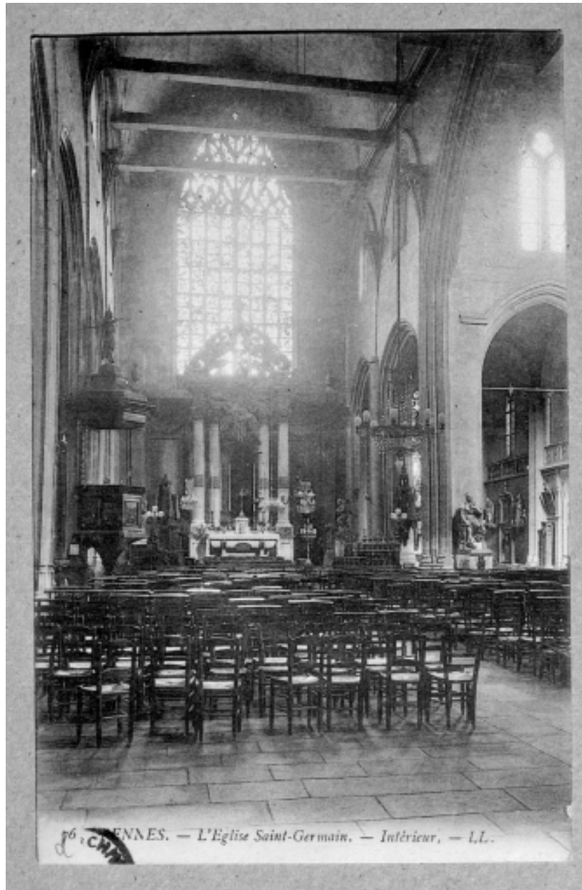
Intérieur, chœur : vue générale (Carte postale ancienne, AD35 : 6Fi)