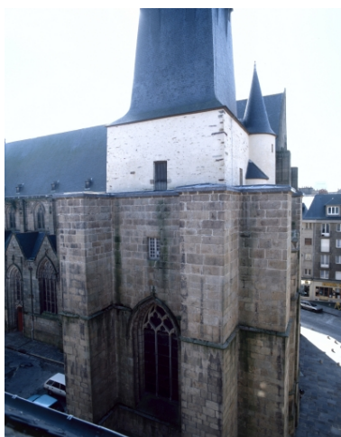
Elévation nord, clocher : vue générale IVR53_19953500208XA