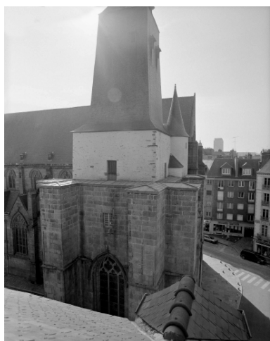
Elévation nord, clocher : vue générale IVR53_19953500207X