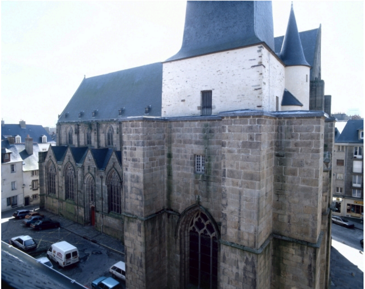
Elévation nord, vue générale