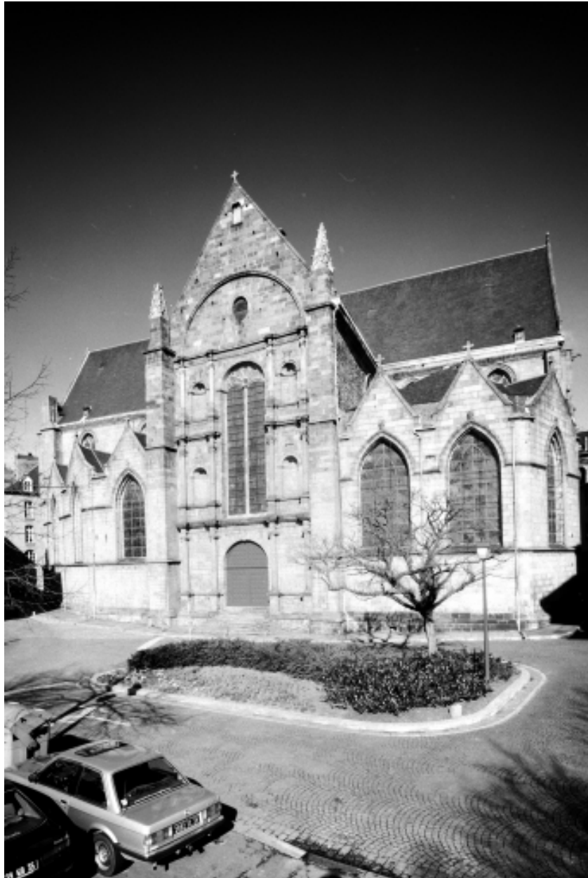
Elévation sud, vue générale