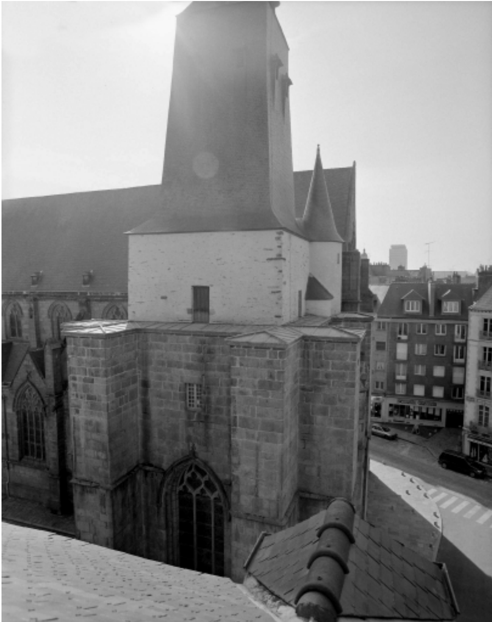
Elévation nord, clocher : vue générale