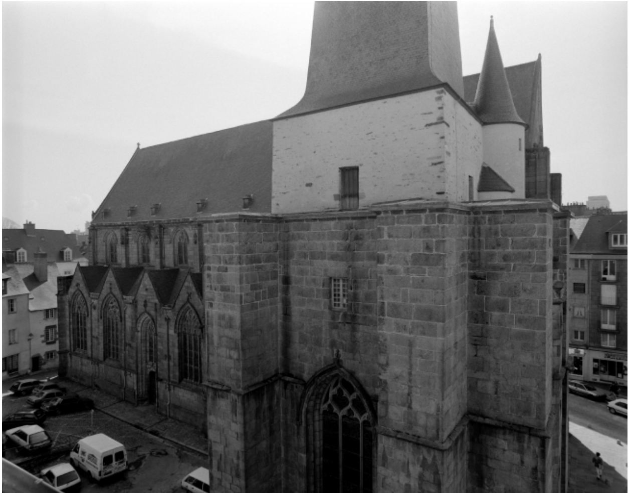
Elévation nord, vue générale.