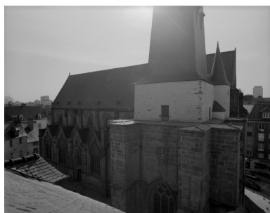
Elévation nord, vue générale IVR53_19953500209X