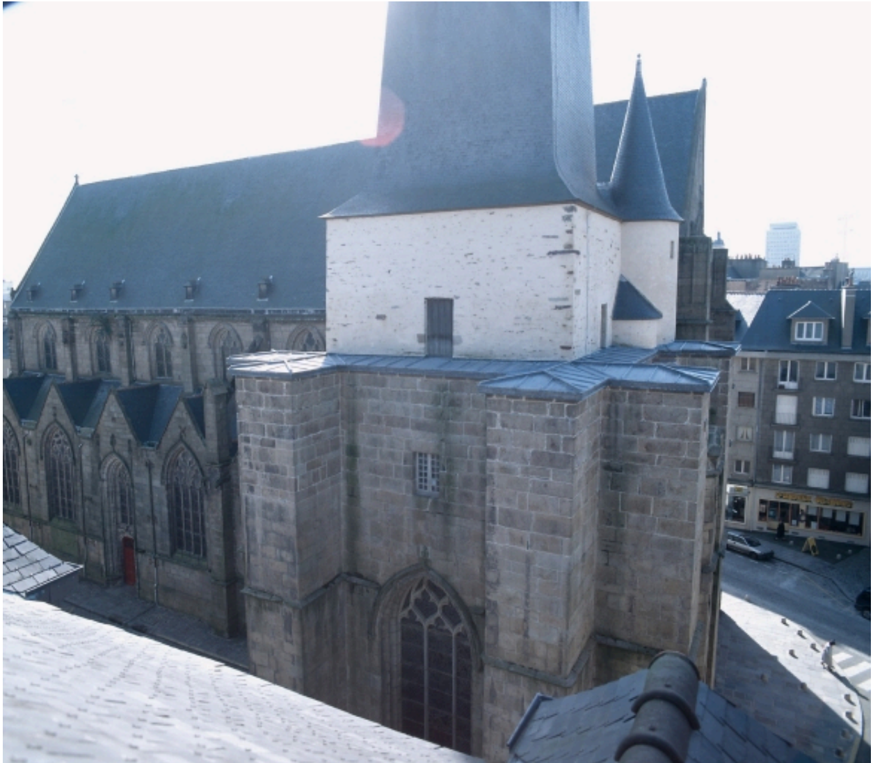
Elévation nord, vue générale