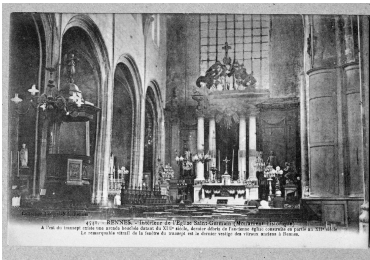
Intérieur, vue générale vers le choeur (Carte postale ancienne, AD35 : 6Fi)