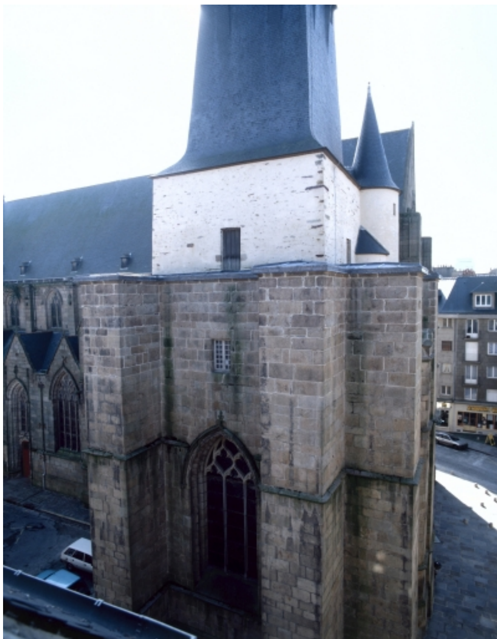
Elévation nord, clocher : vue générale