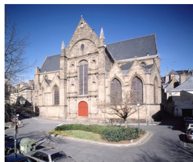
Elévation sud, vue générale IVR53_19953500082VA