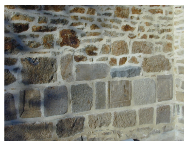
Sacristie, oriental monté avec des pierres de remplois : vue partielle sud-est IVR53_20013518188NUCA