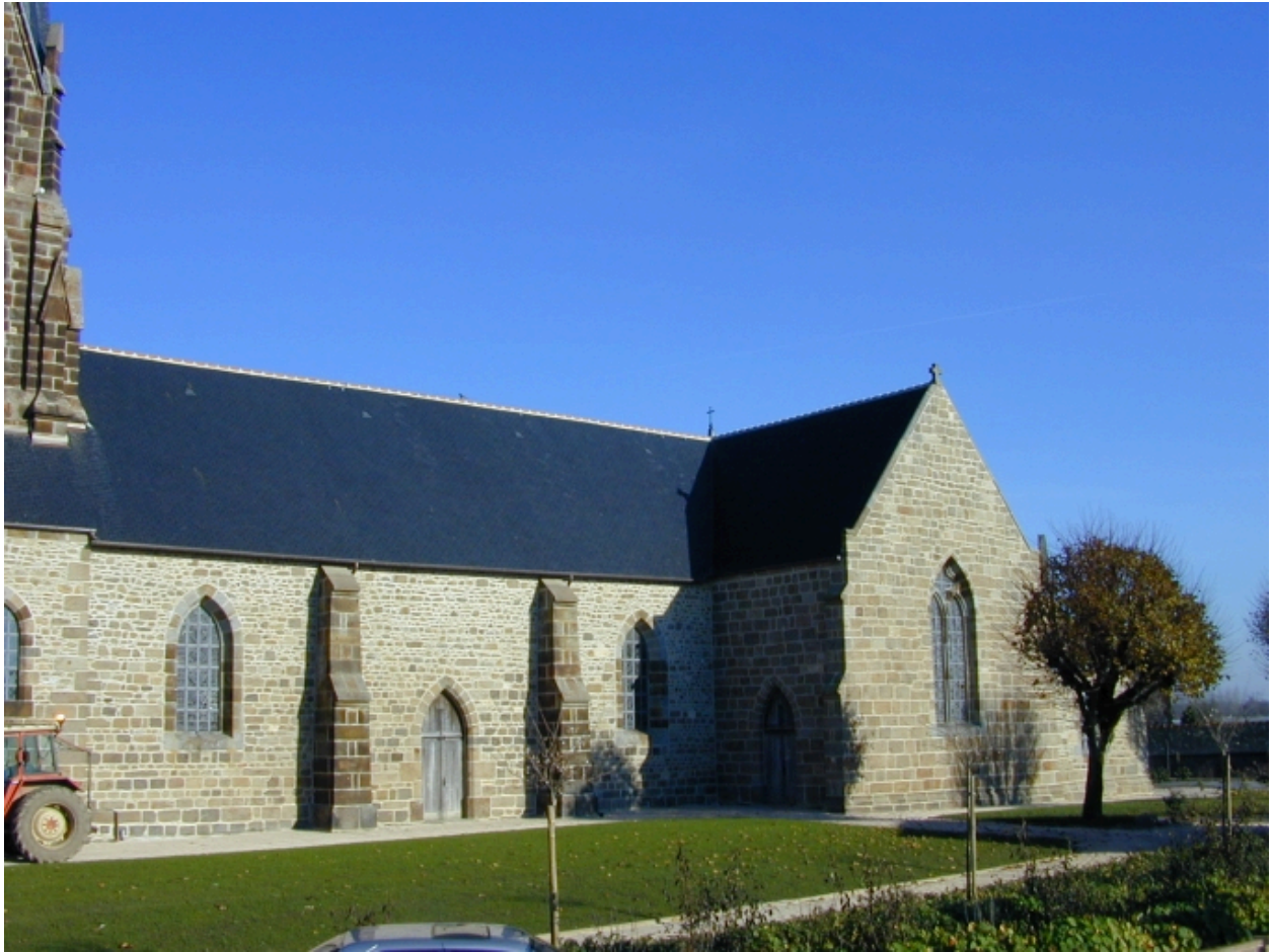
Vue générale sud-ouest