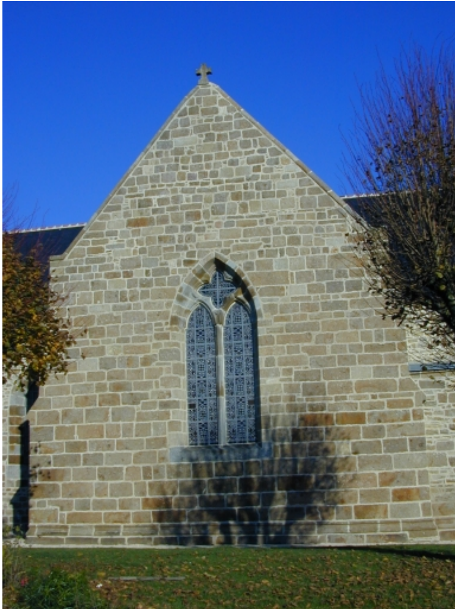
Le croisillon sud : vue générale