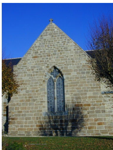
Le croisillon sud : vue générale IVR53_20013518186NUCA