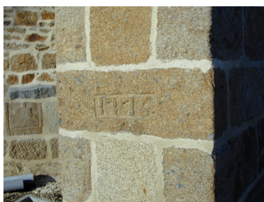
Contrefort sud-est du chœur gravé d'une dat : détail