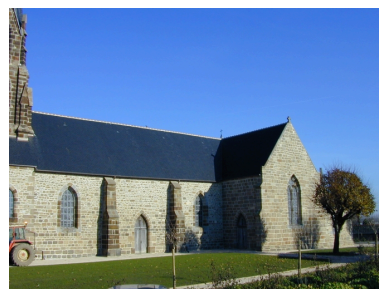
Vue générale sud-ouest IVR53_20013518184NUCA