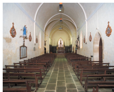
Vue générale intérieure vers le chœur IVR53_20023500026XA