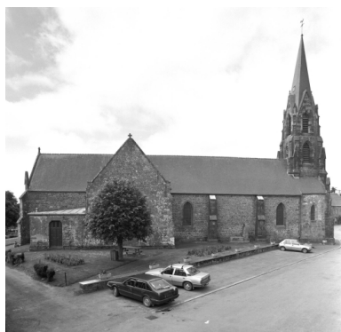
Vue générale nord IVR53_20013502252X