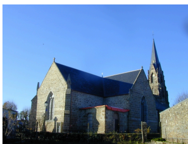
Vue générale nord-est IVR53_20013518201NUCA