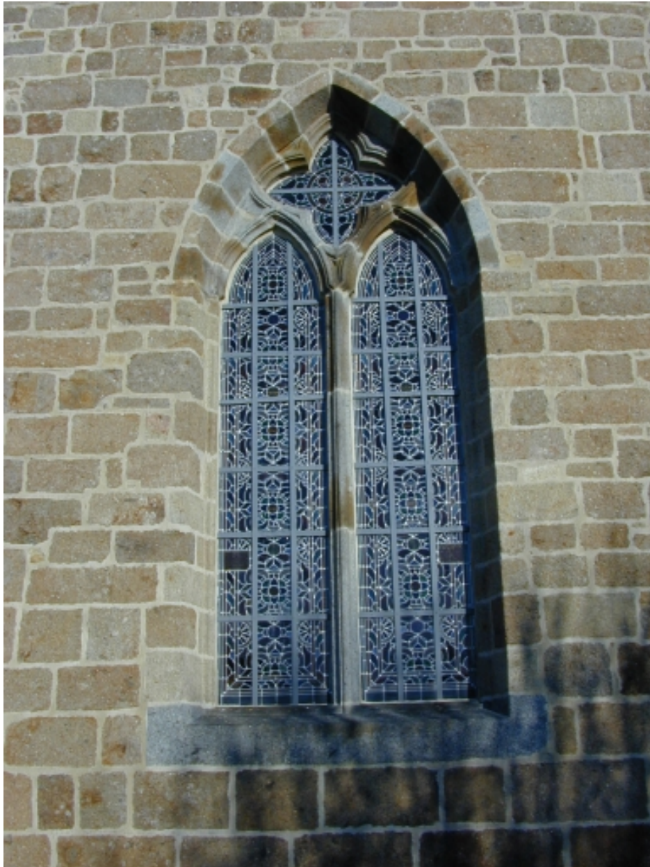
Le croisillon sud, la baie : vue générale sud