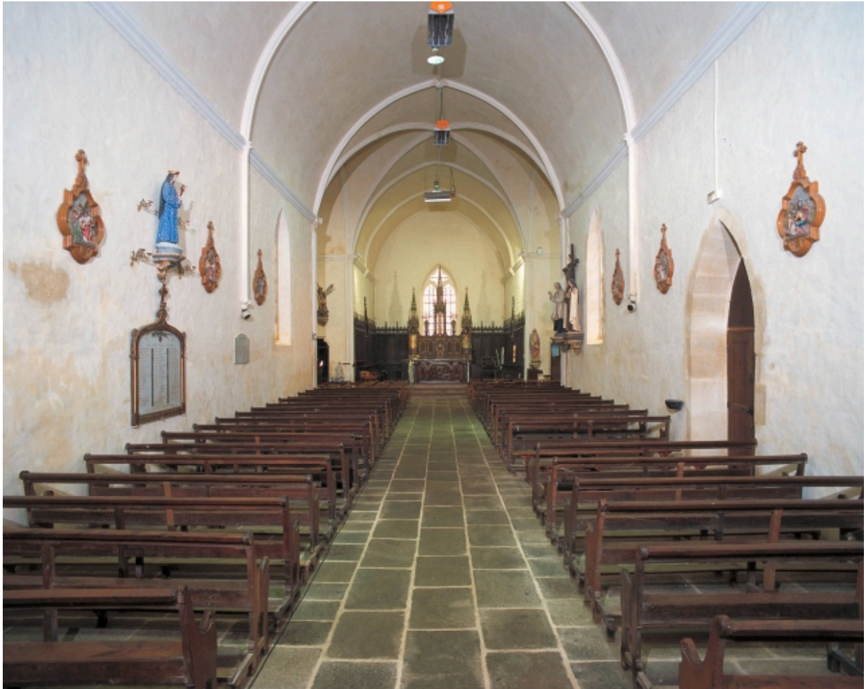
Vue générale intérieure vers le chœur