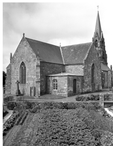
Le choeur : vue générale nord-est IVR53_19943502251X