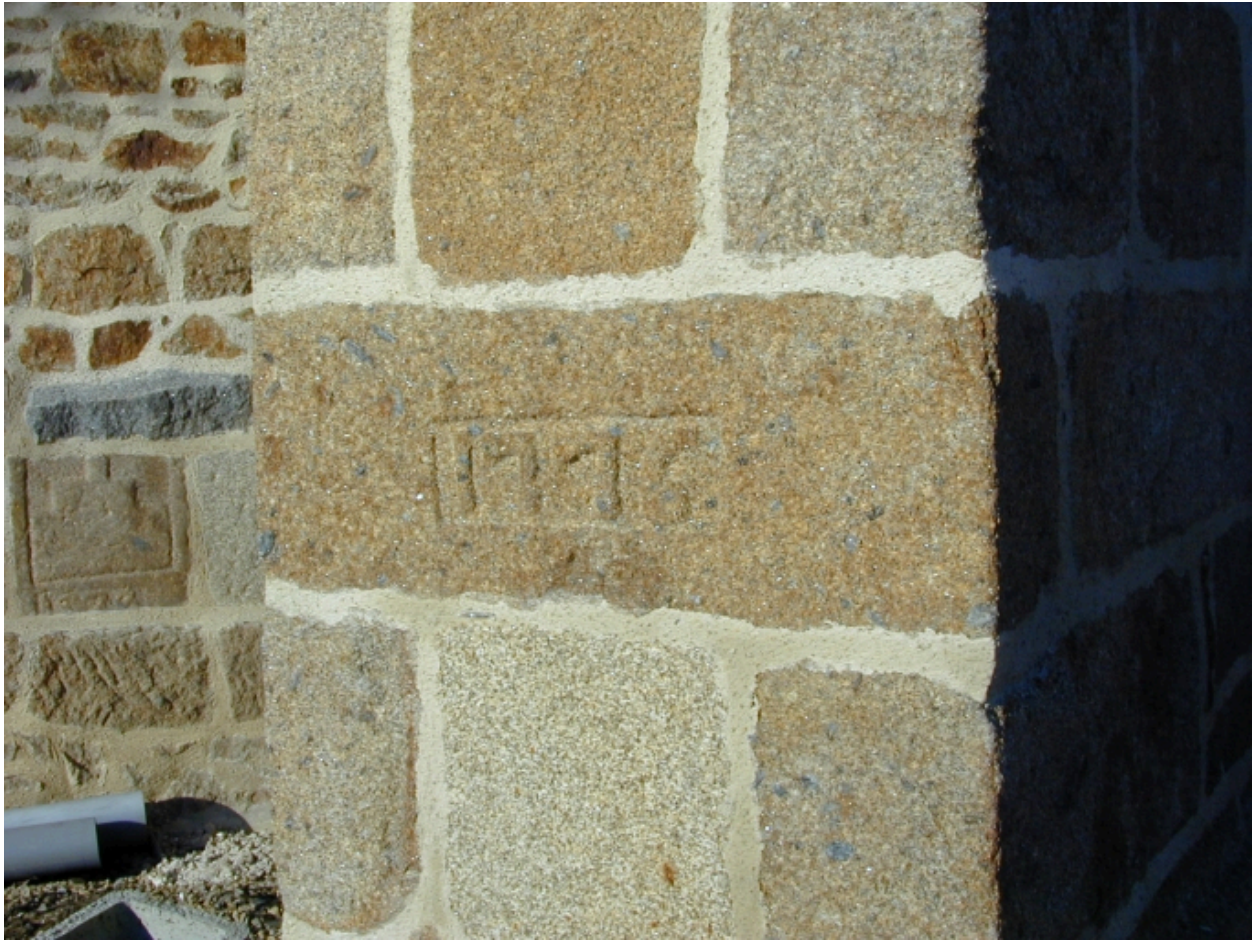
Contrefort sud-est du chœur gravé d'une dat : détail