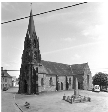
L'église en 1994 : vue générale sud-ouest IVR53_19943502250X