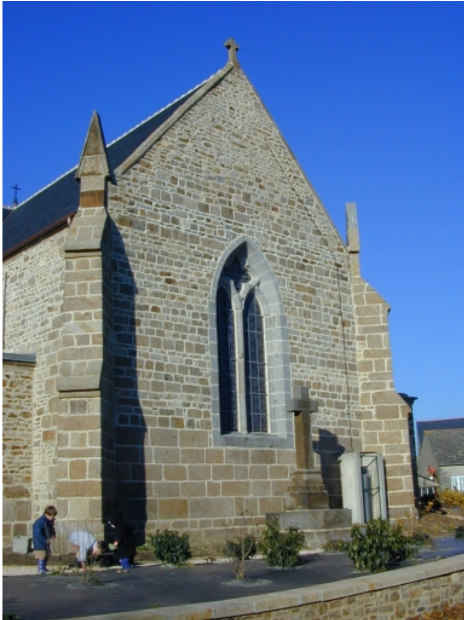
Le chevet : vue générale sud-est