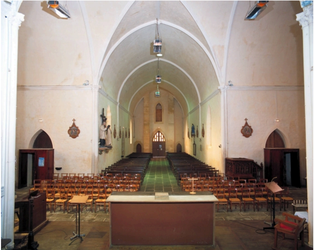
Vue intérieure prise du chœur vers la nef