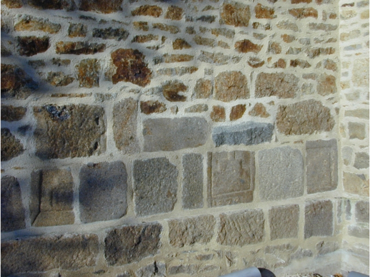
Sacristie, oriental monté avec des pierres de remplis : vue partielle sud-est