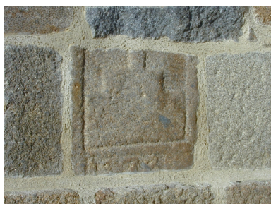
Sacristie, pierre tombale remployée dans le mur oriental : détail IVR53_20013518189NUCA