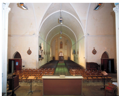
Vue intérieure prise du choeur vers la nef IVR53_20023500027XA