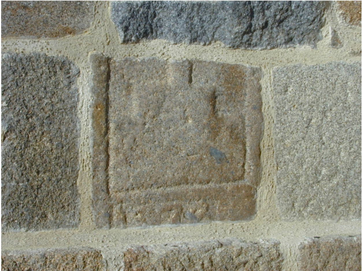
Sacristie, pierre tombale remployée dans le mur oriental : détail