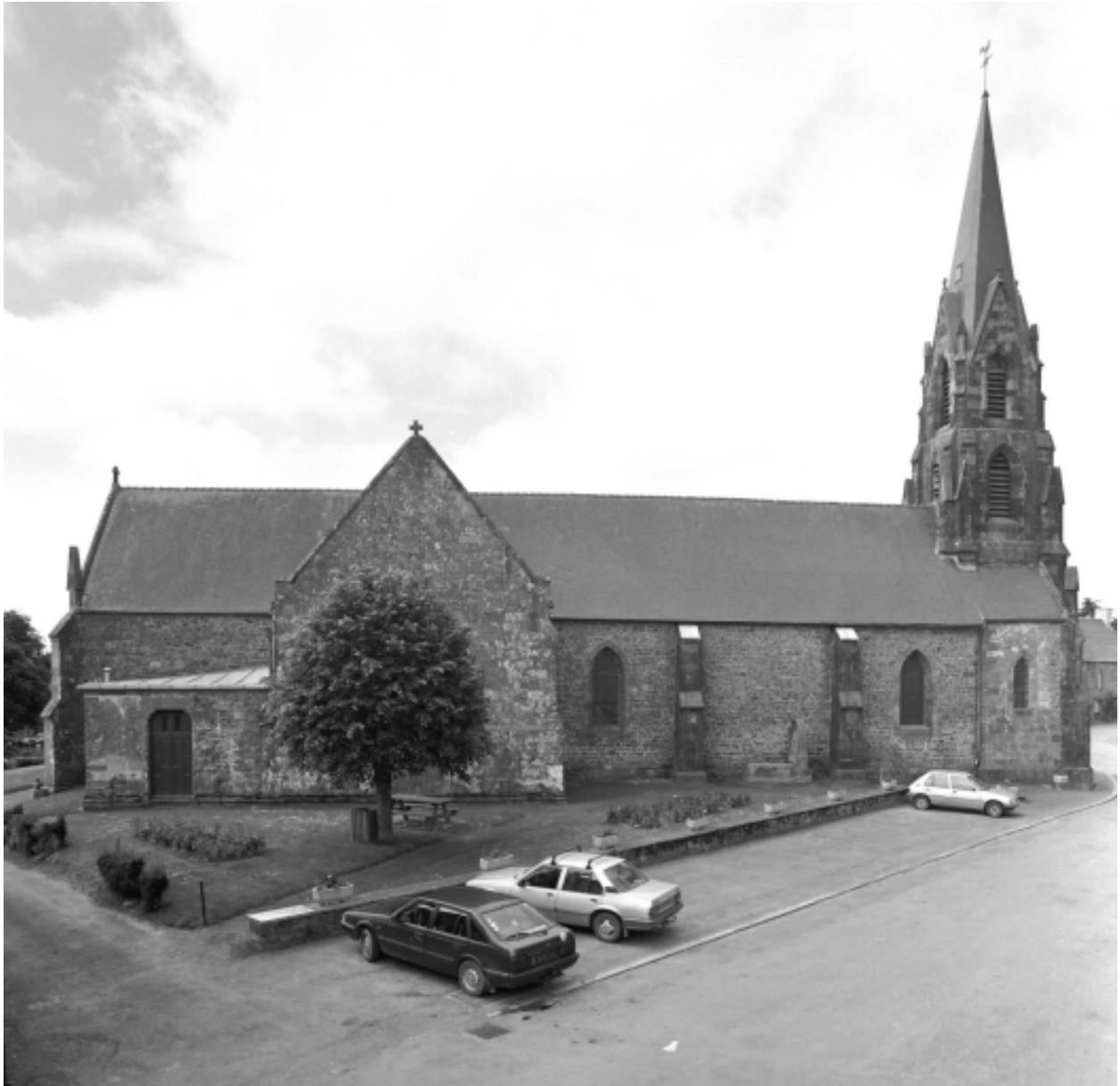
Vue générale nord