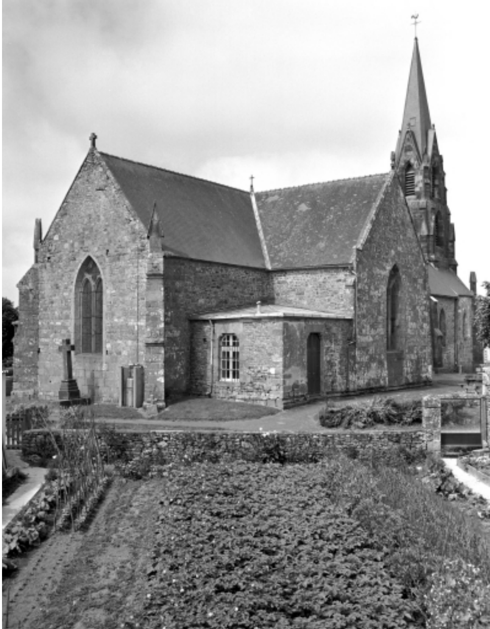
Le choeur : vue générale nord-est