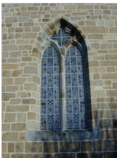
Le croisillon sud, la baie : vue générale sud IVR53_20013518187NUCA