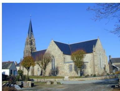
Vue générale sud-est IVR53_20013517999NUCA