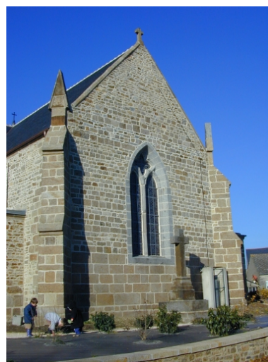
Le chevet : vue générale sud-est IVR53_20013518185NUCA