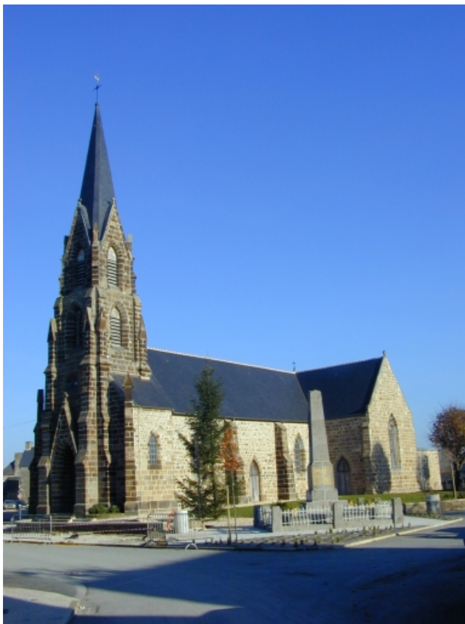
Vue générale sud-ouest