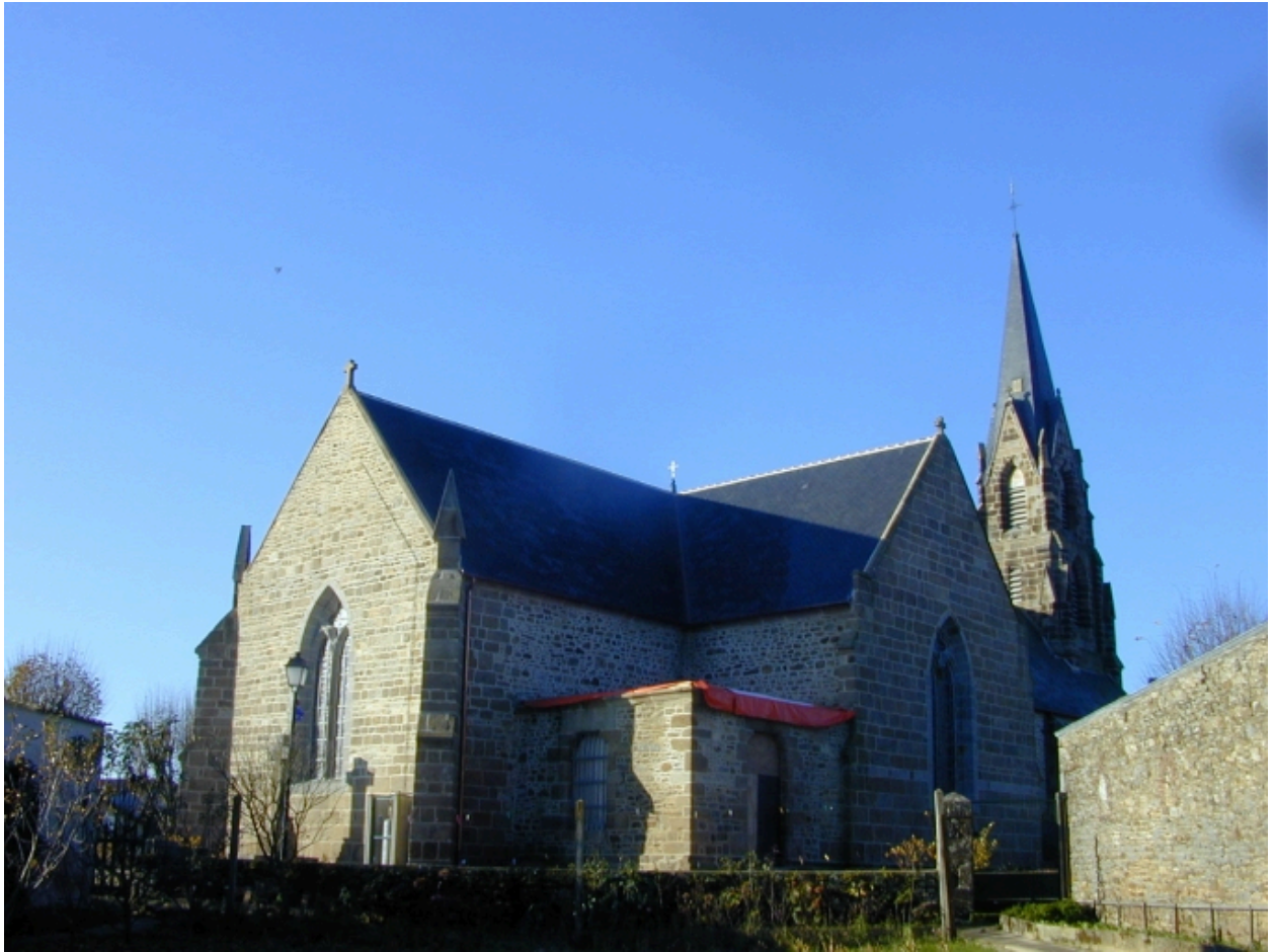
Vue générale nord-est