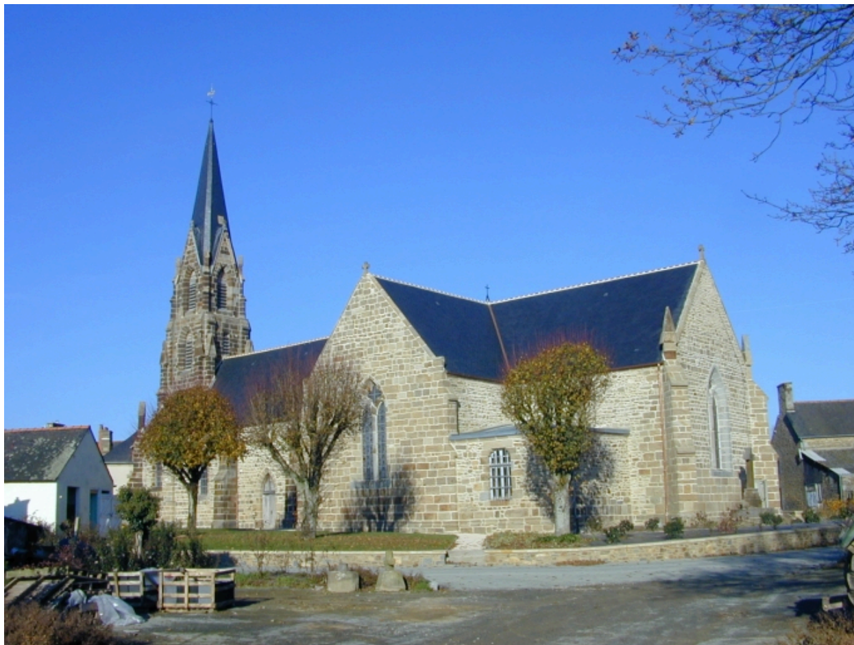
Vue générale sud-est