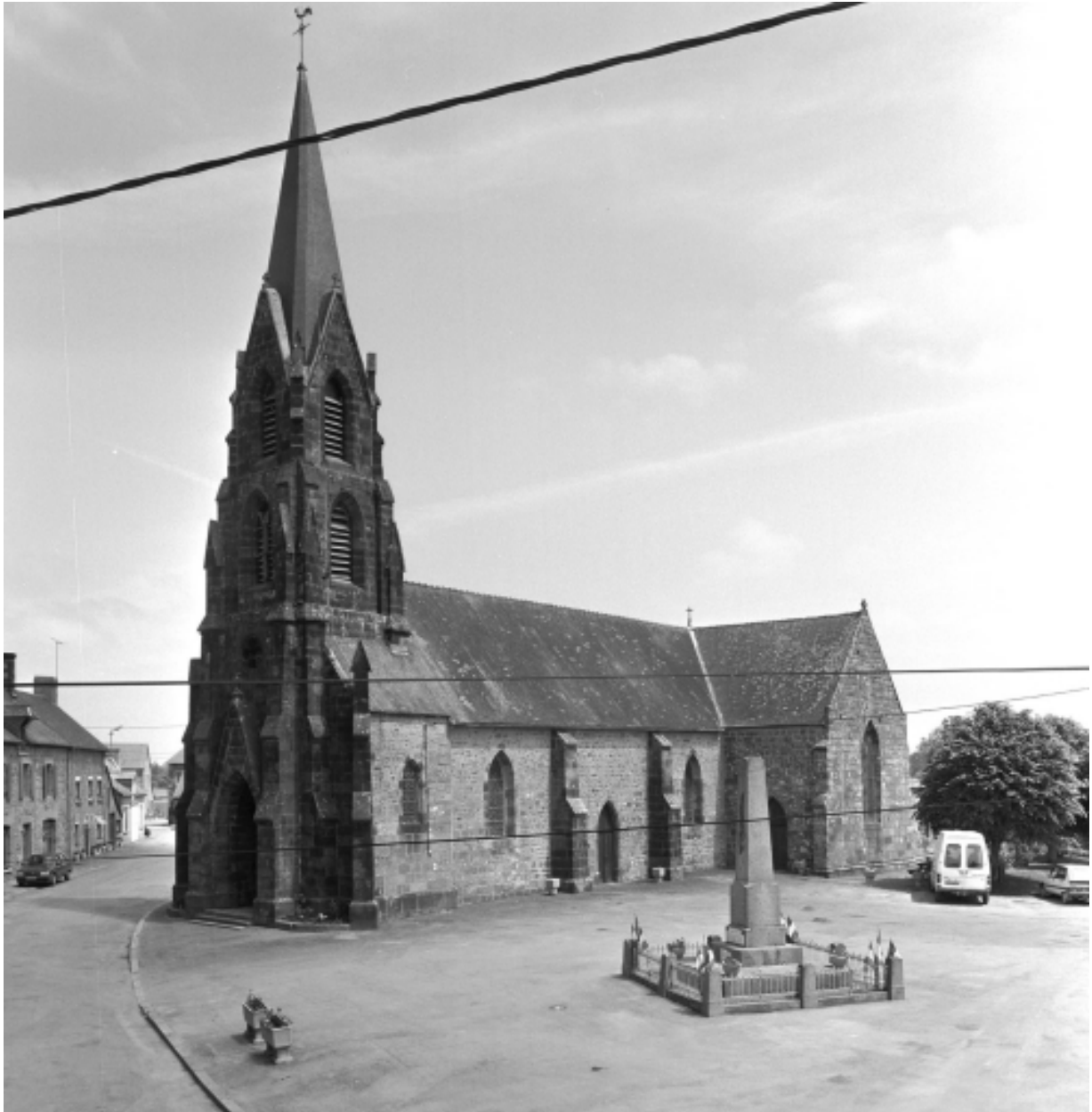
L'église en 1994 : vue générale sud-ouest