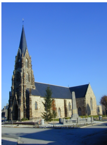
Vue générale sud-ouest IVR53_20013517939NUCA