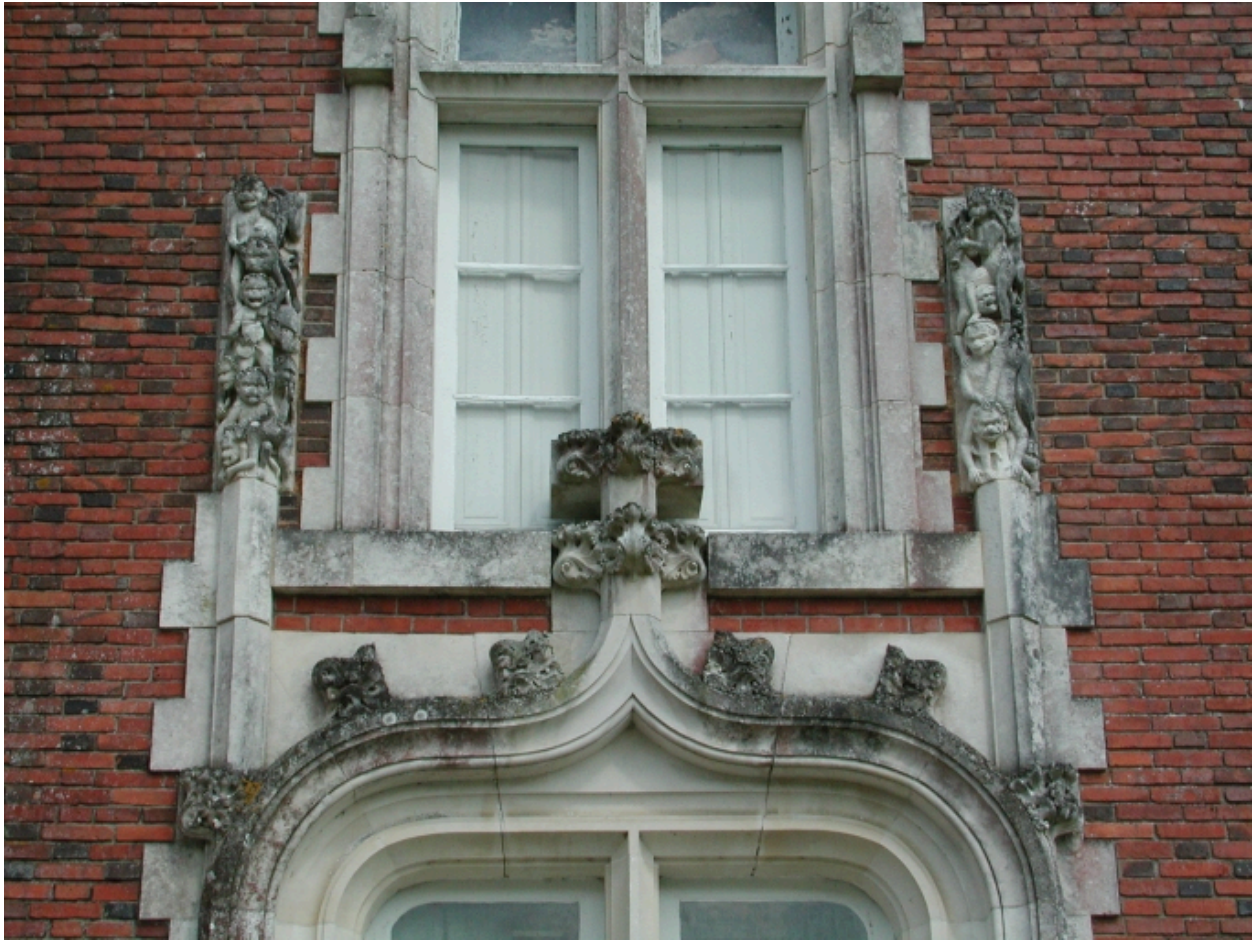
Détail de la façade ouest : arc en accolade et pinacles sculptés