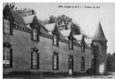
Vue générale de la façade principale IVR53_19883500329X