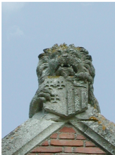
Détail du pignon de la façade ouest : lion tenant un blason armorié