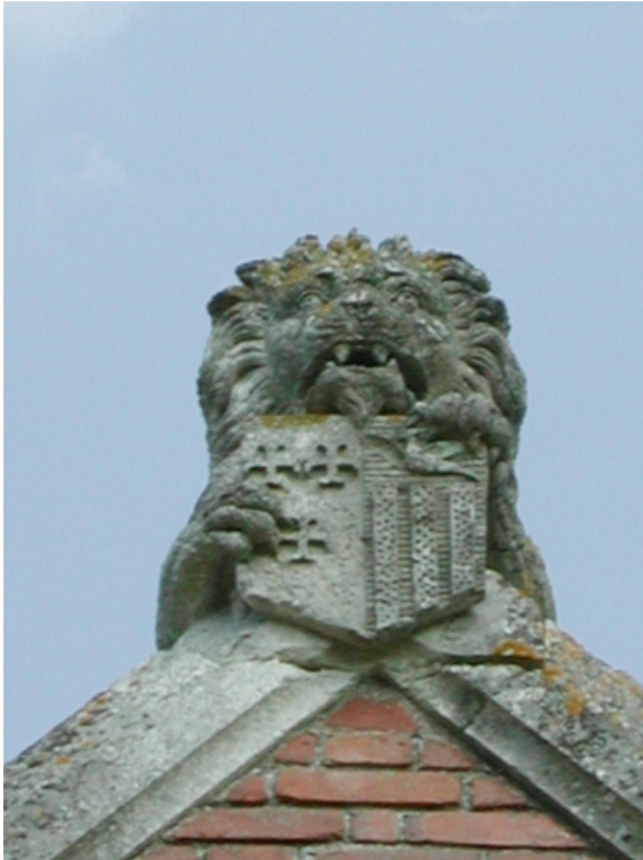
Détail du pignon de la façade ouest : lion tenant un blason armorié