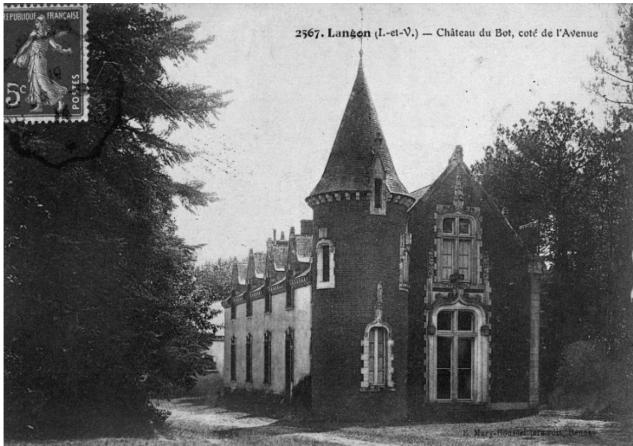
Vue générale des façades, côté de l'avenue