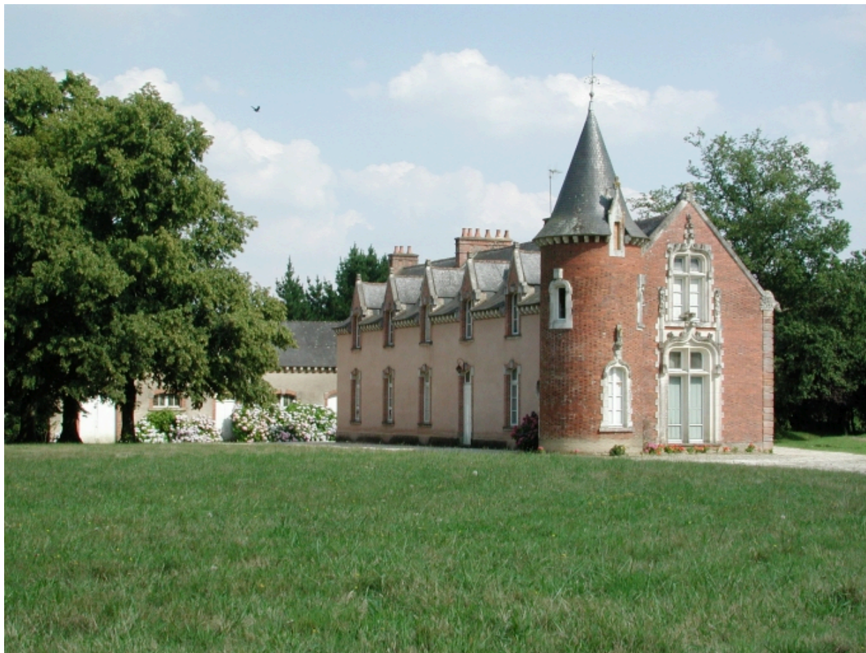
Vue générale nord-ouest