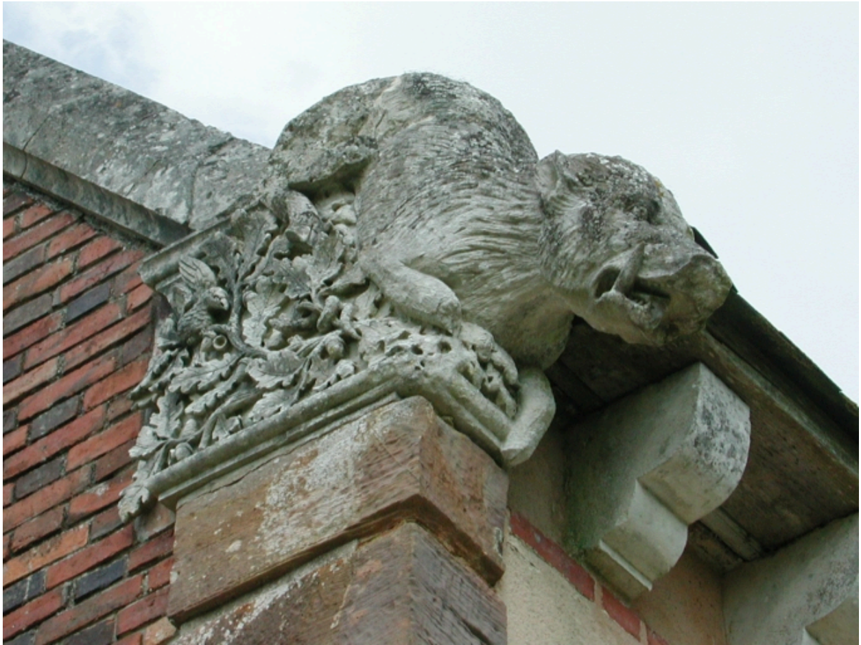
Détail de la façade ouest : sanglier et feuillage