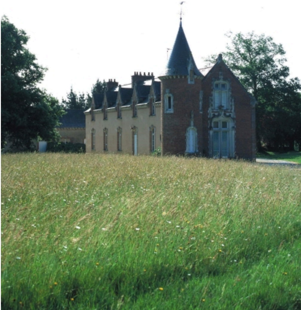
Vue de situation nord-ouest