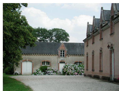
Vue partielle de la façade nord et des communs, à l'est IVR53_20013510565NUCA