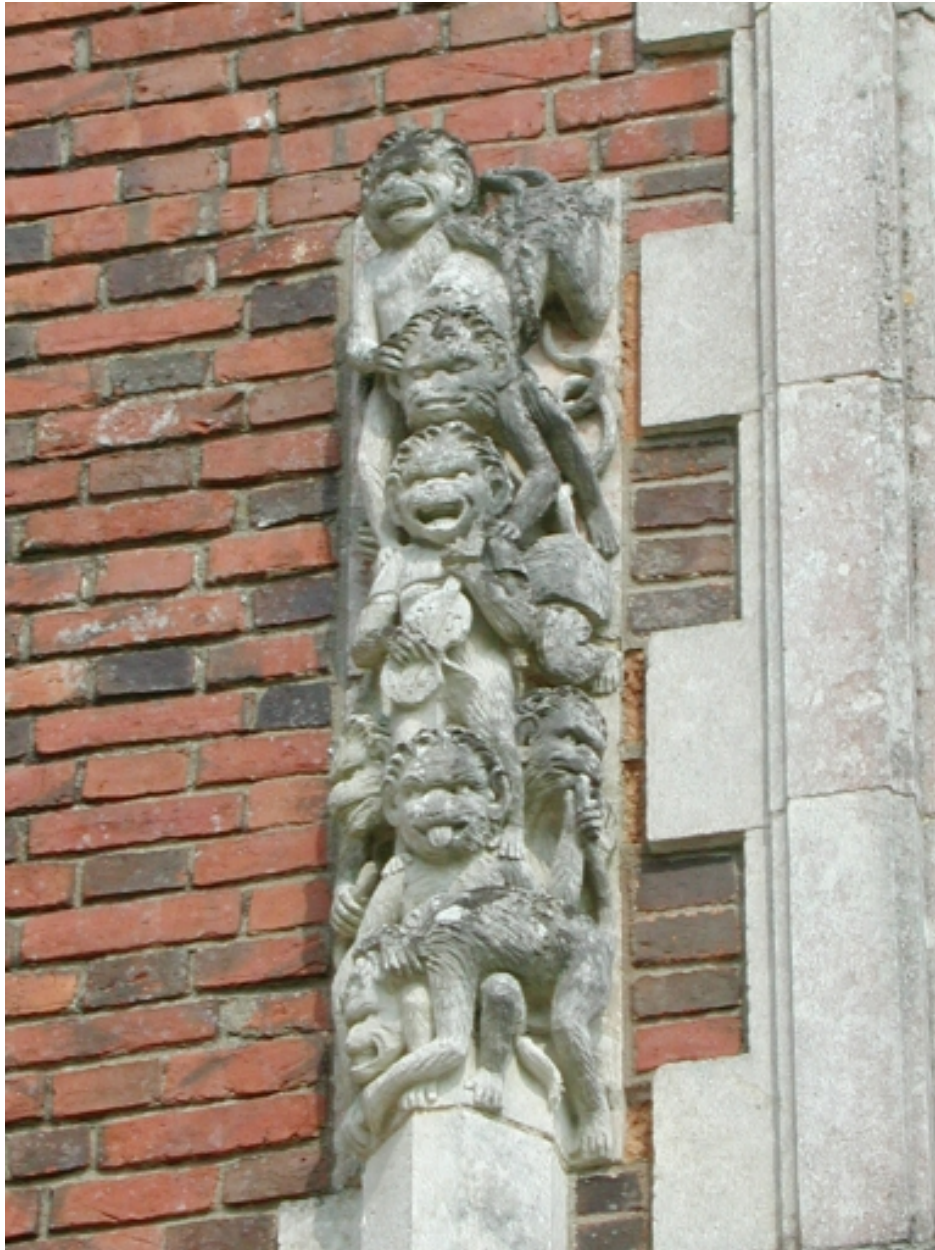
Détail de la façade ouest : singes musiciens