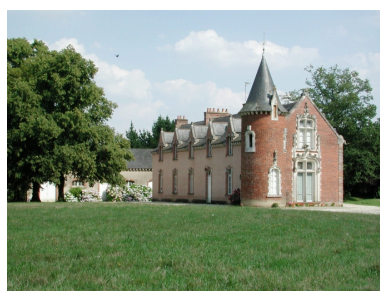
Vue générale nord-ouest IVR53_20013510564NUCA