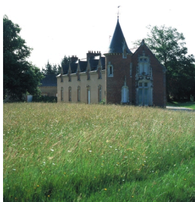
Vue de situation nord-ouest IVR53_20013501817XA