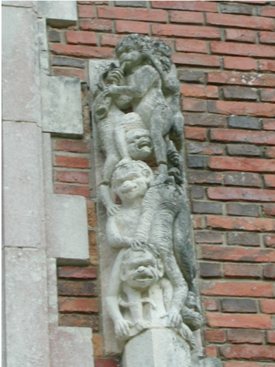
Détail de la façade ouest : singes grimaçants