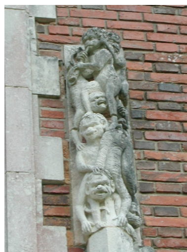
Détail de la façade ouest : singes grimaçants IVR53_20013510568NUCA