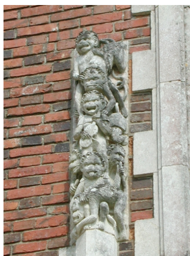
Détail de la façade ouest : singes musiciens