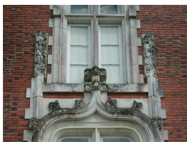
Détail de la façade ouest : arc en accolade et pinacles sculptés