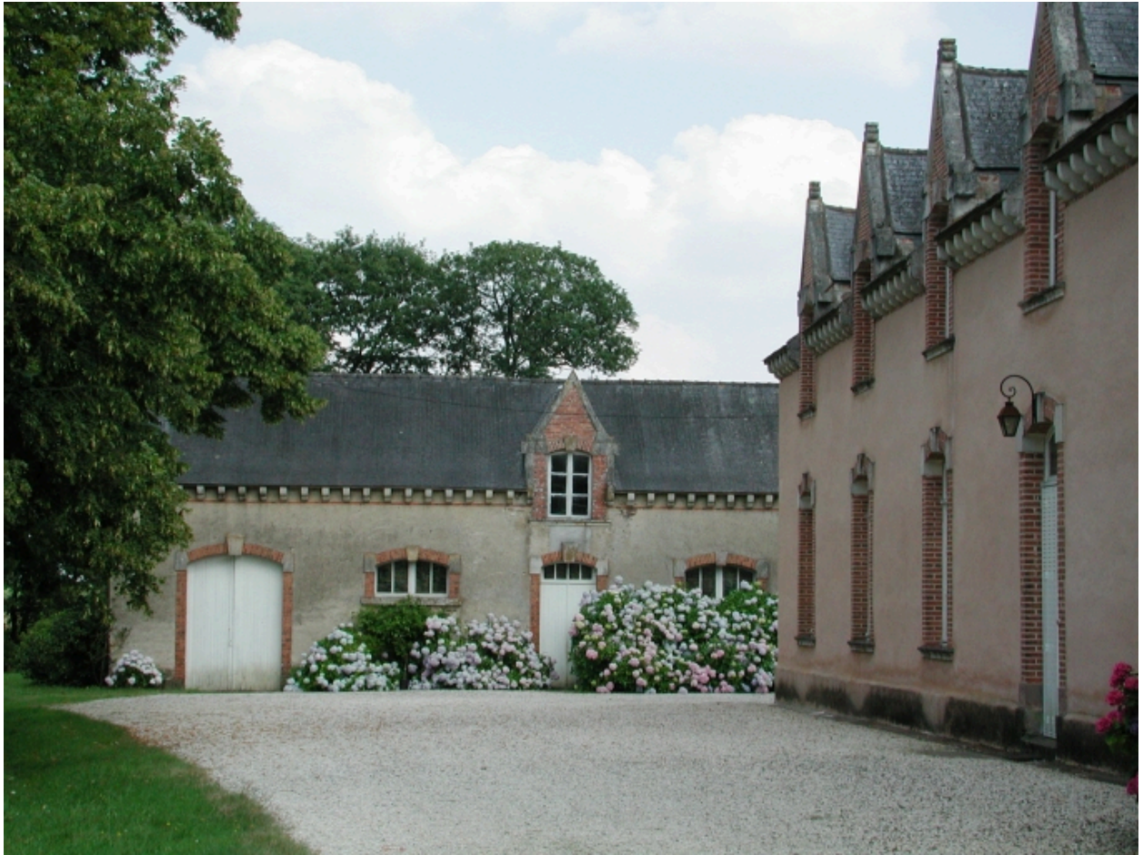
Vue partielle de la façade nord et des communs, à l'est