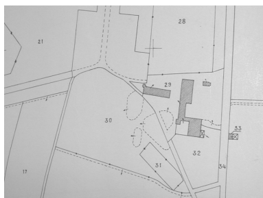
Extrait du cadastre moderne