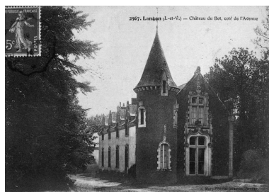
Vue générale des façades, côté de l'avenue IVR53_19883500330X