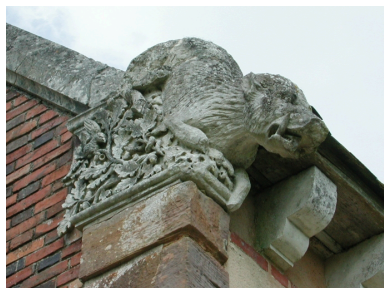
Détail de la façade ouest : sanglier et feuillage IVR53_20013510569NUCA