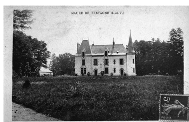
Le château sur une carte postale au début du 20e siècle : vue générale nord