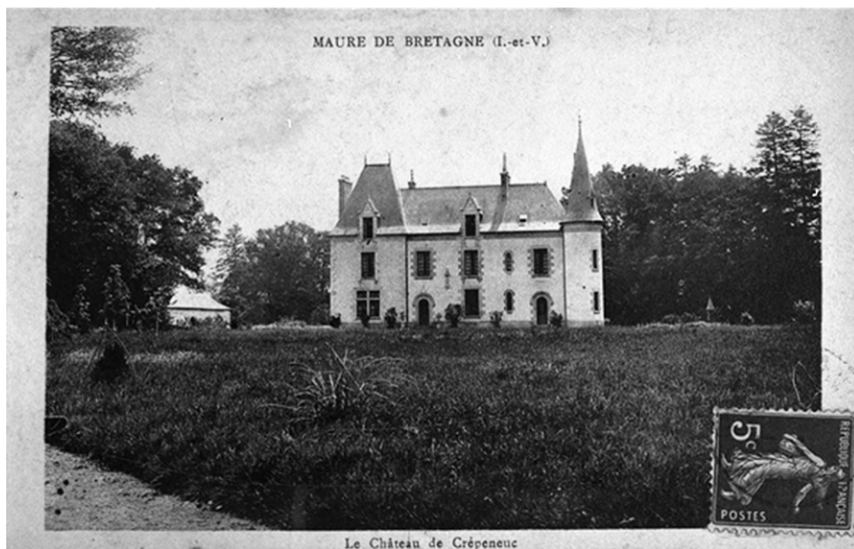
Le château sur une carte postale au début du 20e siècle : vue générale nord