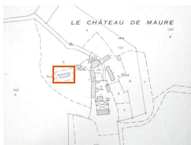
Le château sur le cadastre rénové de 1983