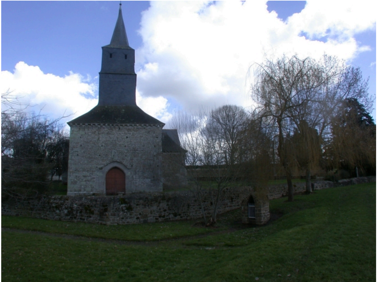
Façade clocher, vue Ouest