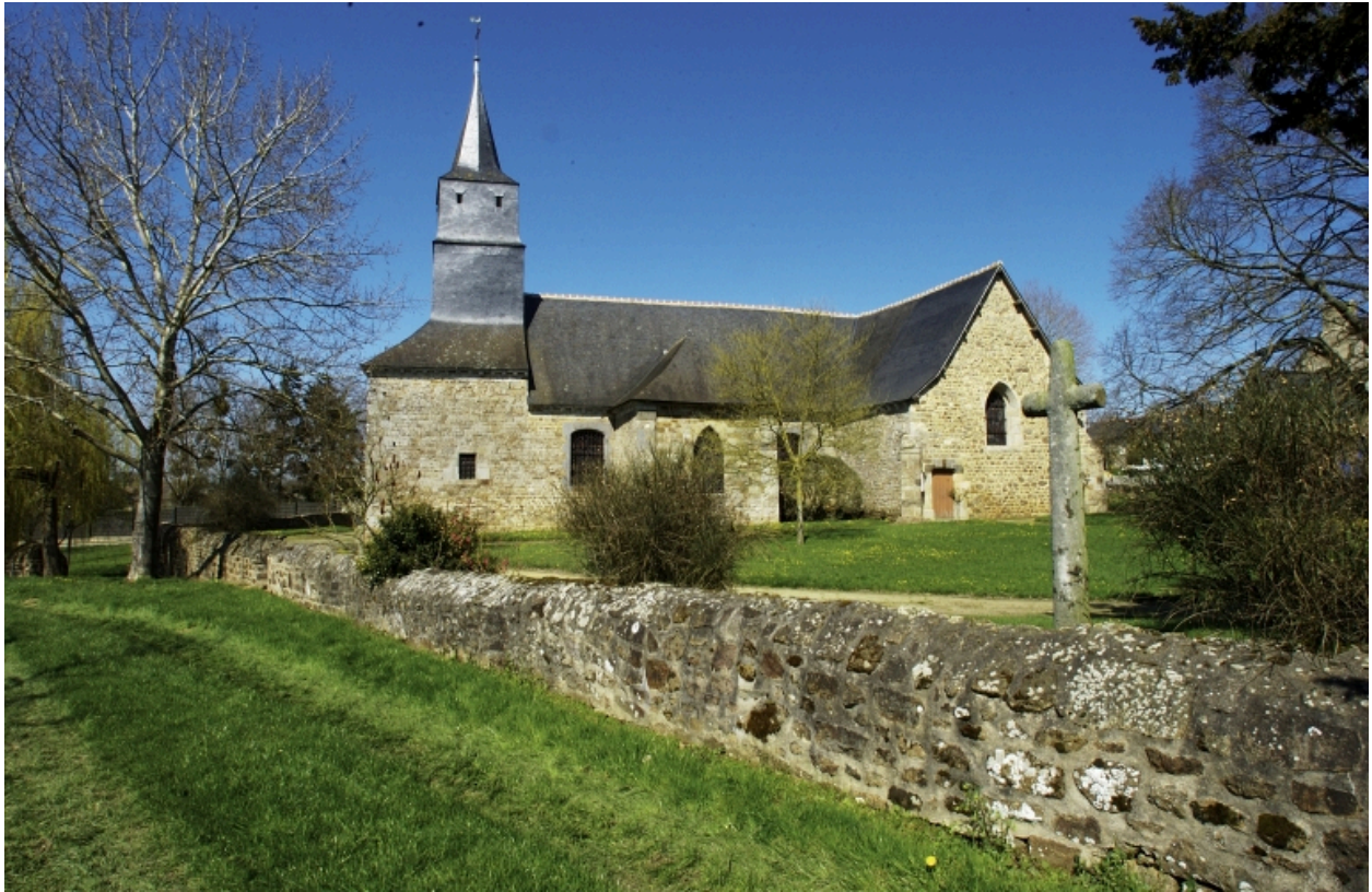
Vue générale Sud avec l'enclos et la croix