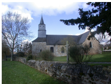
Vue générale Sud avec l'enclos