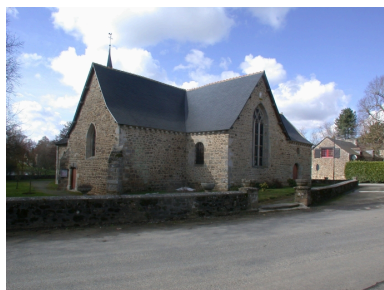
Vue Sud-Est IVR53_20063506998NUC