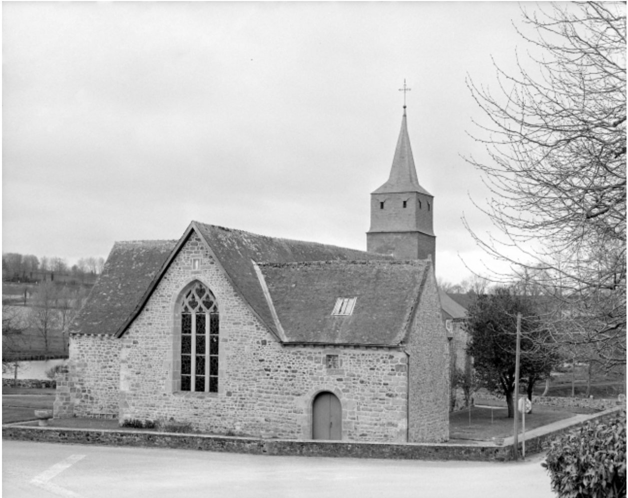
Elévation Est : vue générale