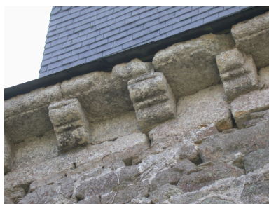
Corbelets IVR53_20063506995NUC