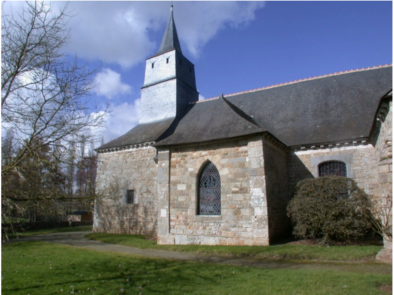
Façade Sud, ossuaire