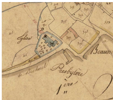
Extrait du cadastre de 1834. IVR53_20063506873NUC