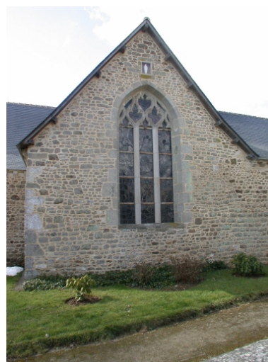
Chevet, détail IVR53_20063506997NUC