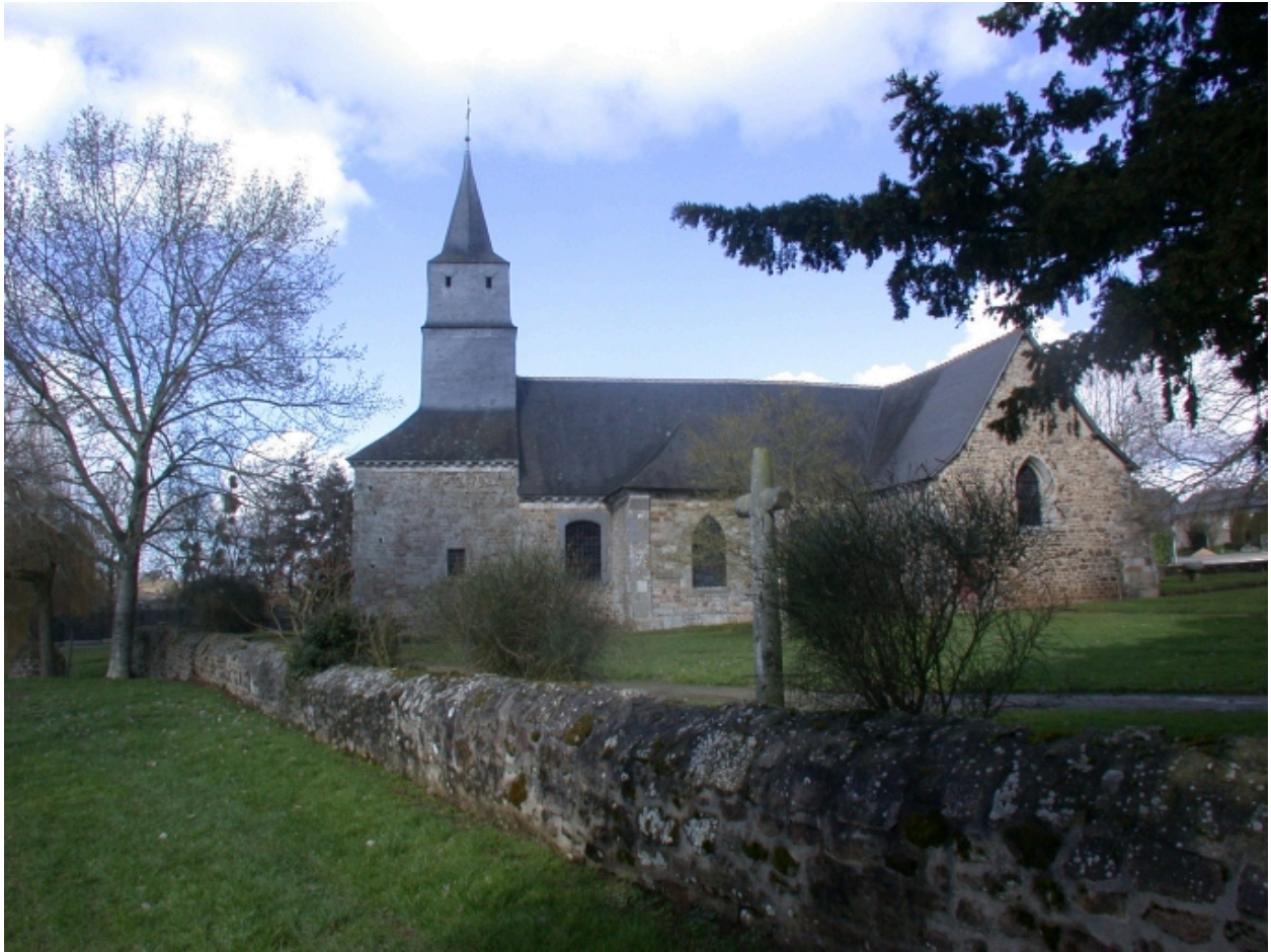
Vue générale Sud avec l'enclos