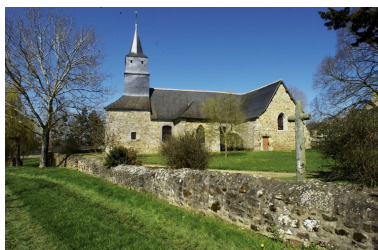
Vue générale Sud avec l'enclos et la croix IVR53_20063500491NUCA