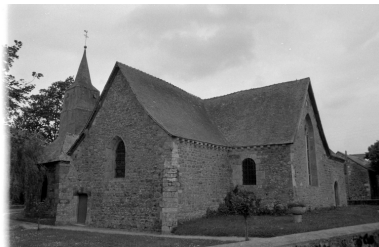
État en 1970 IVR53_19703501742NUC