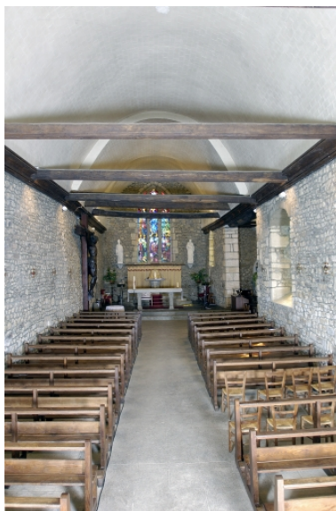
Vue intérieure prise de la nef vers le chœur IVR53_20063500850NUCA