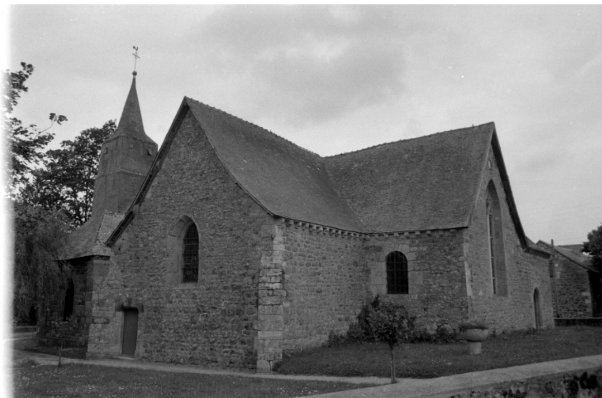
Etat en 1970