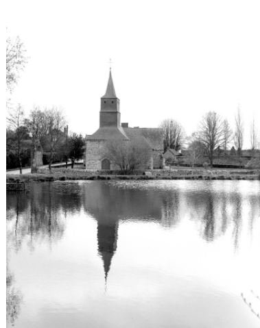
L'église et l'étang