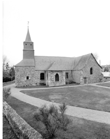
Élévation Sud