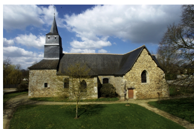
Elévation Sud IVR53_20063500457NUCA