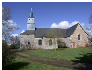
Vue générale Sud IVR53_20063507000NUC