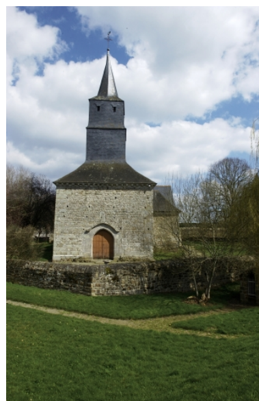
Elévation Ouest IVR53_20063500459NUCA