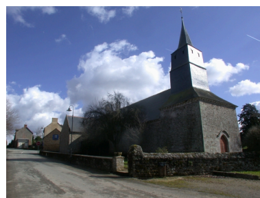
Façade Nord IVR53_20063506994NUC