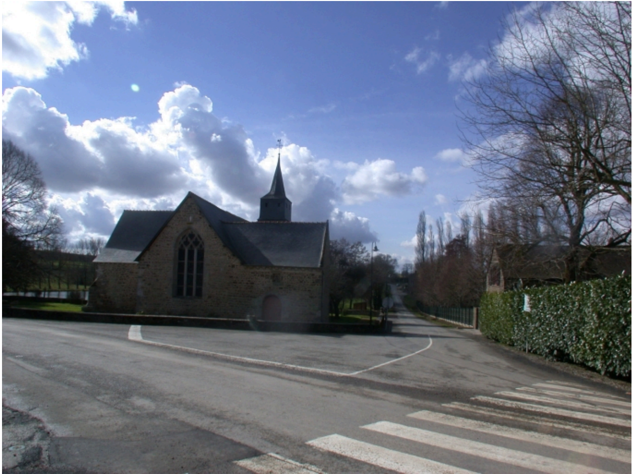
Vue Est, chevet