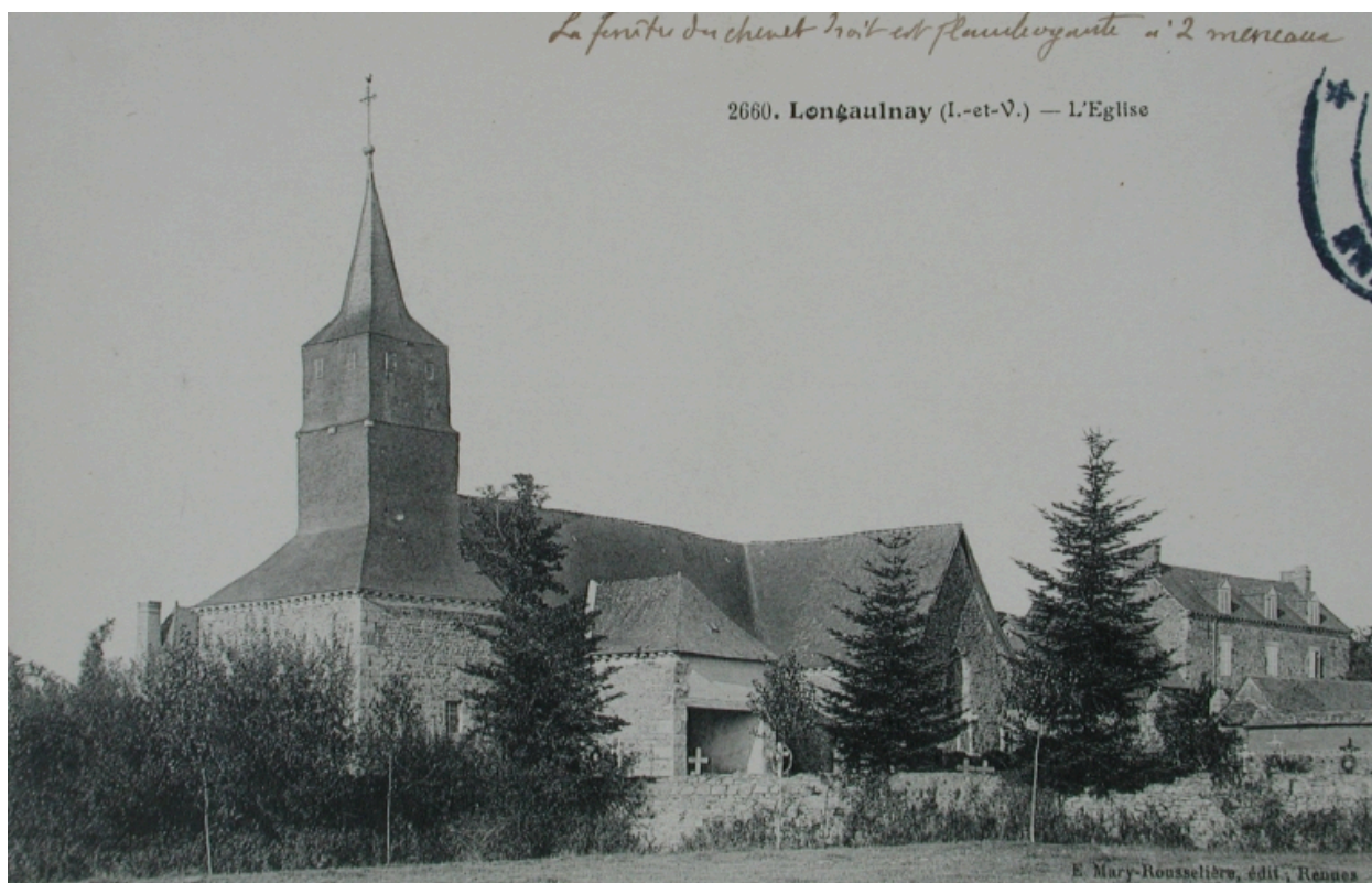
Carte postale du début du siècle, E. Mary Rouselière, éditeur à Rennes