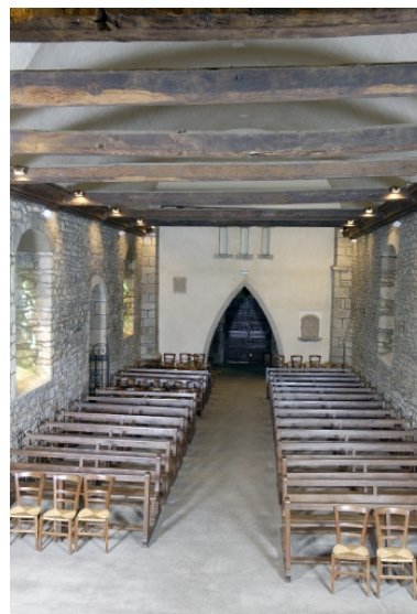
Vue intérieure prise du chœur vers la nef IVR53_20063500851NUCA