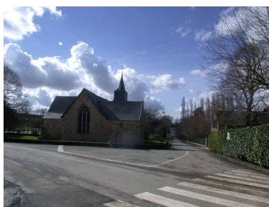
Vue Est, chevet IVR53_20063506996NUC