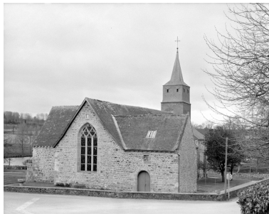
Élévation Est : vue générale IVR53_19943500727X