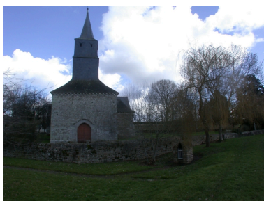
Façade clocher, vue Ouest IVR53_20063506993NUC