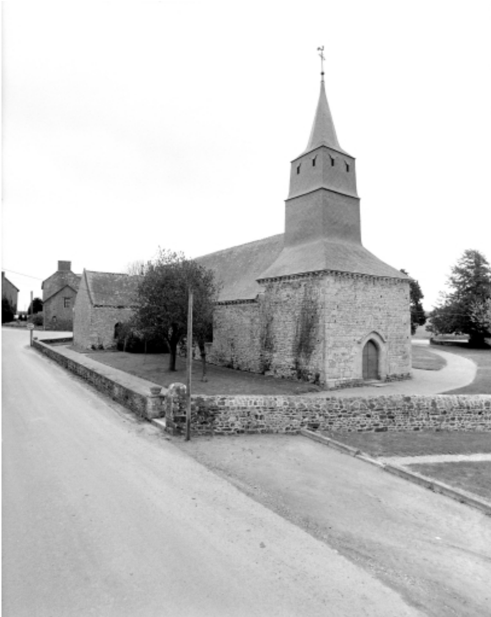
Elévation Nord-Ouest : vue générale