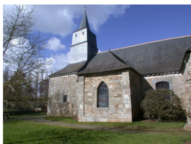
Façade Sud, ossuaire IVR53_20063506999NUC