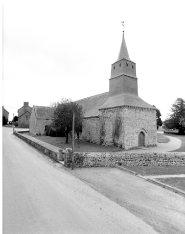
Elévation Nord-Ouest : vue générale