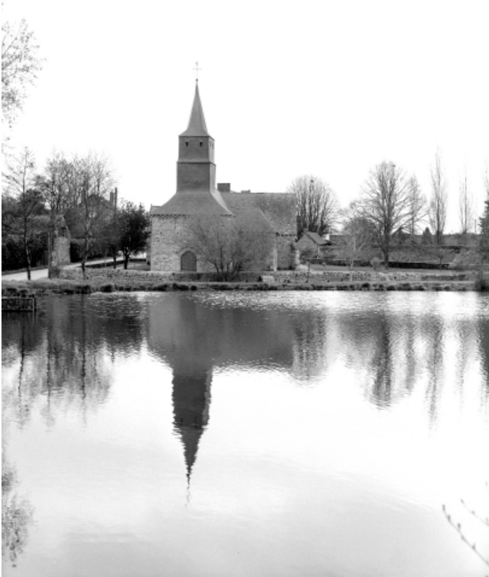
L'église et l'étang