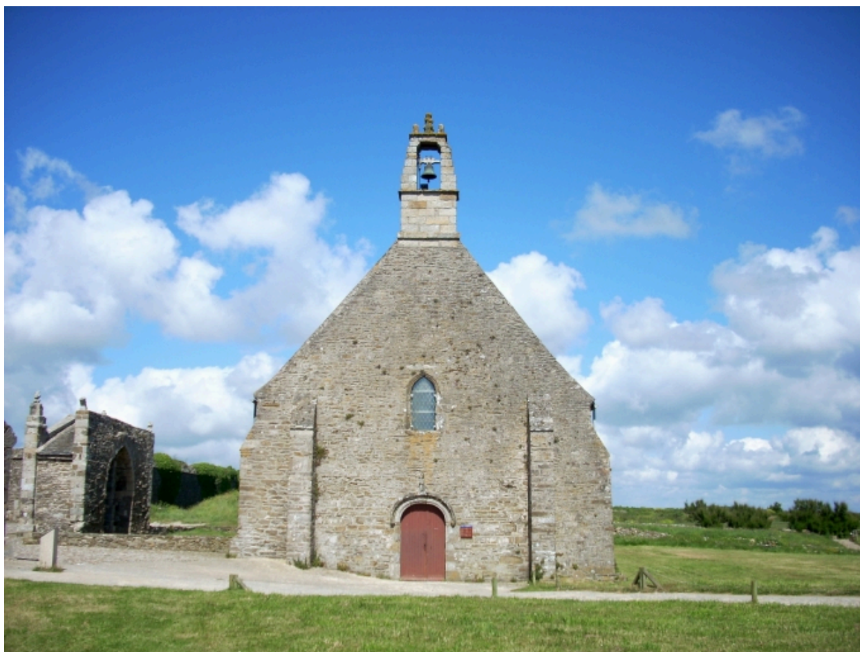
Plougonvelin, chapelle Notre-Dame-des-Grâces : élévation ouest