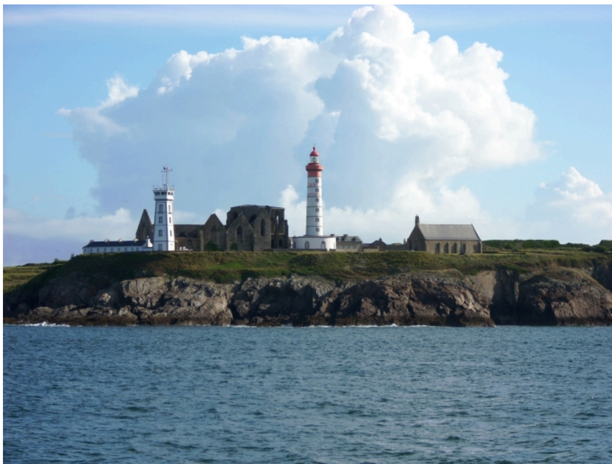
Plougonvelin, chapelle Notre-Dame-des-Grâces : vue de situation depuis le sud-ouest