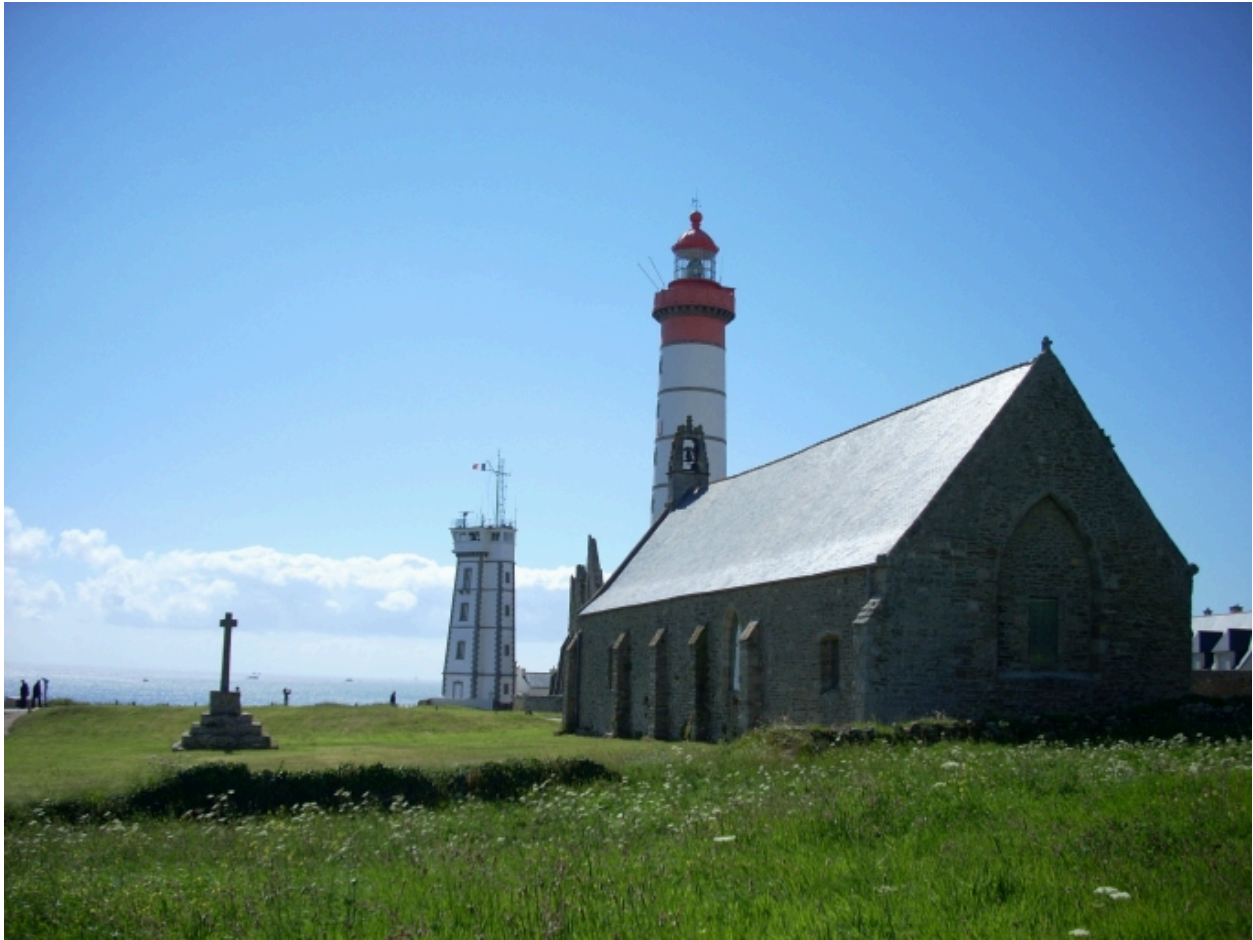
Plougonvelin, chapelle Notre-Dame-des-Grâces : vue générale sud-est