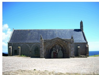
Plougonvelin, chapelle Notre-Dame-des-Grâces : élévation nord IVR53_20082906248NUCA