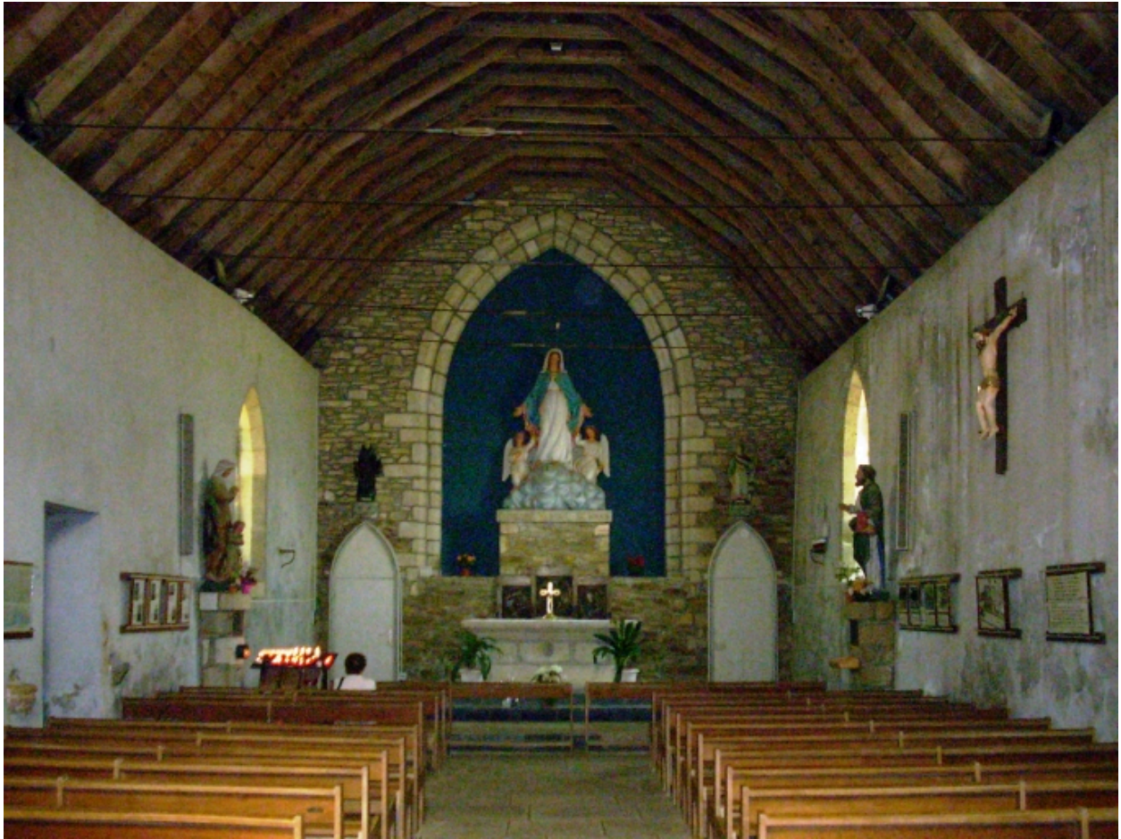
Plougonvelin, chapelle Notre-Dame-des-Grâces : vue axiale est