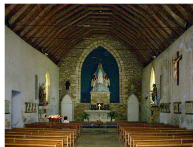
Plougonvelin, chapelle Notre-Dame-des-Grâces : vue axiale est