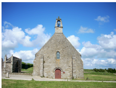
Plougonvelin, chapelle Notre-Dame-des-Grâces : élévation ouest IVR53_20082906250NUCA