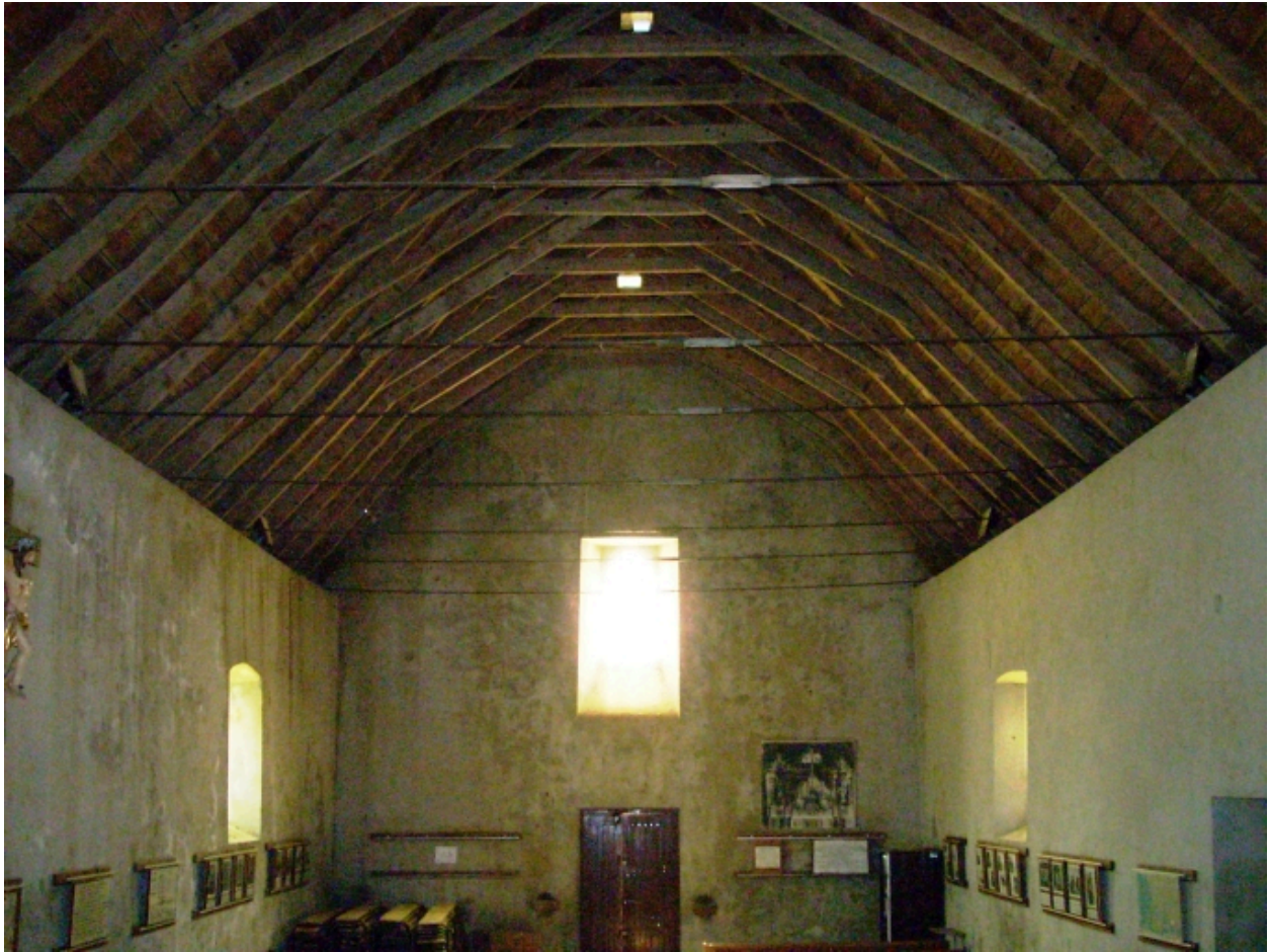
Plougonvelin, chapelle Notre-Dame-des-Grâces : vue axiale ouest