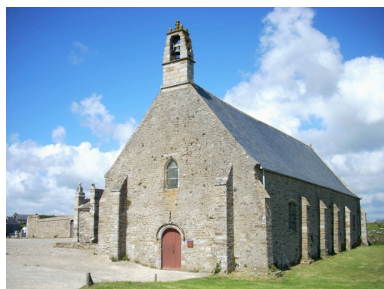
Plougonvelin, chapelle Notre-Dame-des-Grâces : vue générale sud-ouest IVR53_20082906249NUCA