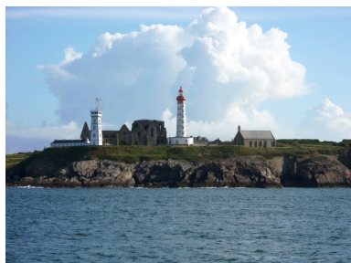
Plougonvelin, chapelle Notre-Dame-des-Grâces : vue de situation depuis le sud-ouest IVR53_20082906246NUCA