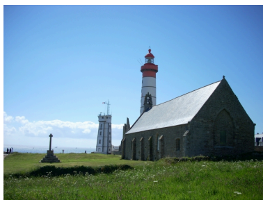
Plougonvelin, chapelle Notre-Dame-des-Grâces : vue générale sud-est IVR53_20082906247NUCA