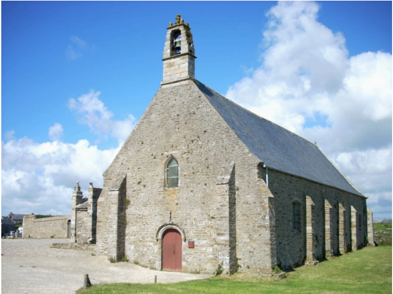
Plougonvelin, chapelle Notre-Dame-des-Grâces : vue générale sud-ouest