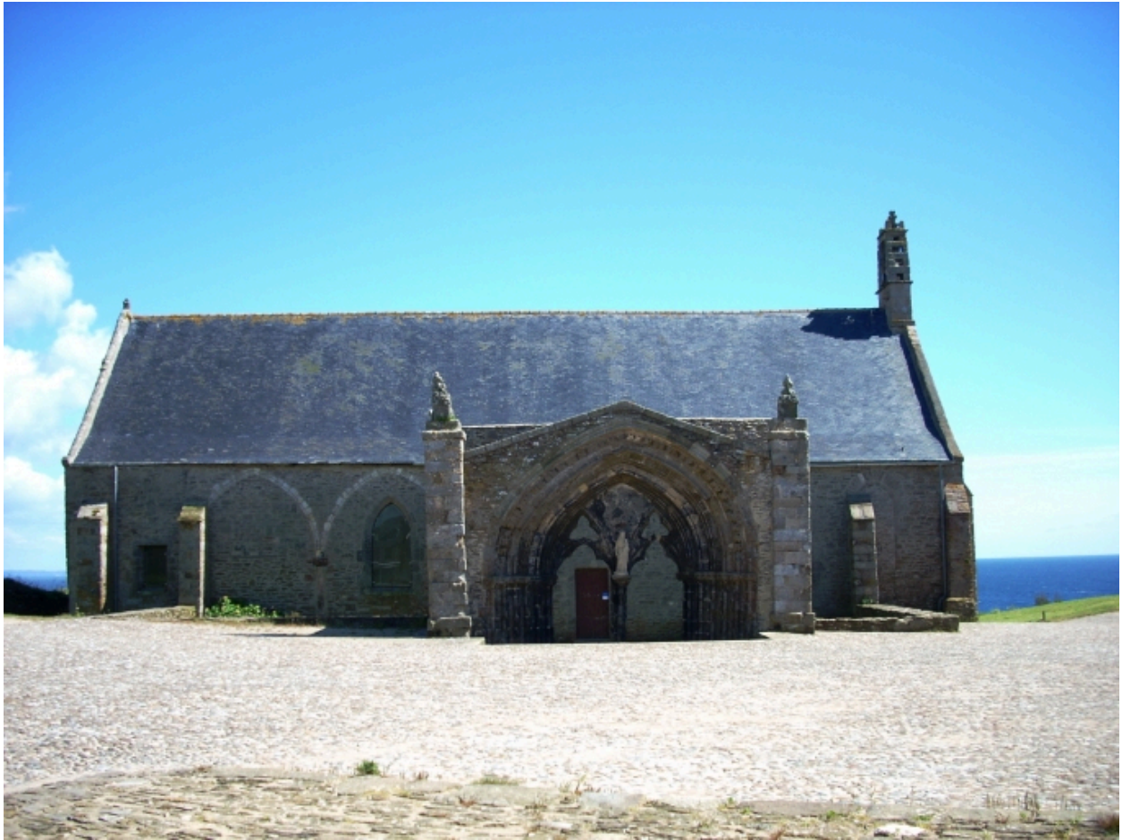
Plougonvelin, chapelle Notre-Dame-des-Grâces : élévation nord