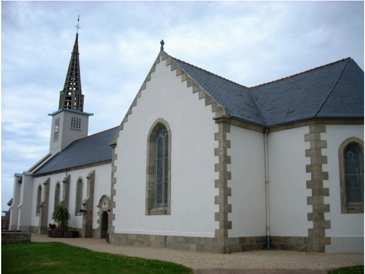
Plouguerneau, église de Lilia : vue générale sud-est