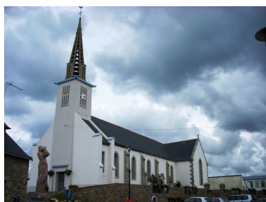
Plouguerneau, église de Lilia : vue générale sud-ouest IVR53_20082906118NUCA