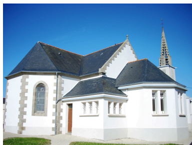
Plouguerneau, église de Lilia : vue générale nord-est IVR53_20082906121NUCA