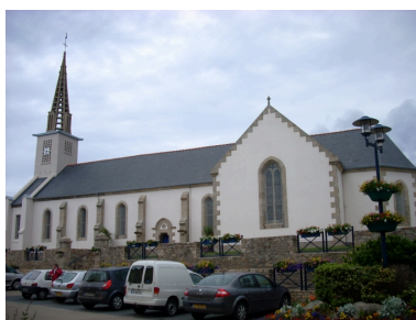
Plouguerneau, église de Lilia : vue générale sud-est IVR53_20082906119NUCA