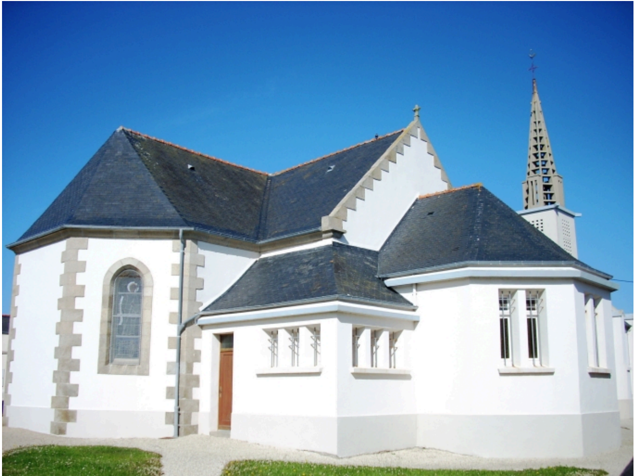
Plouguerneau, église de Lilia : vue générale nord-est