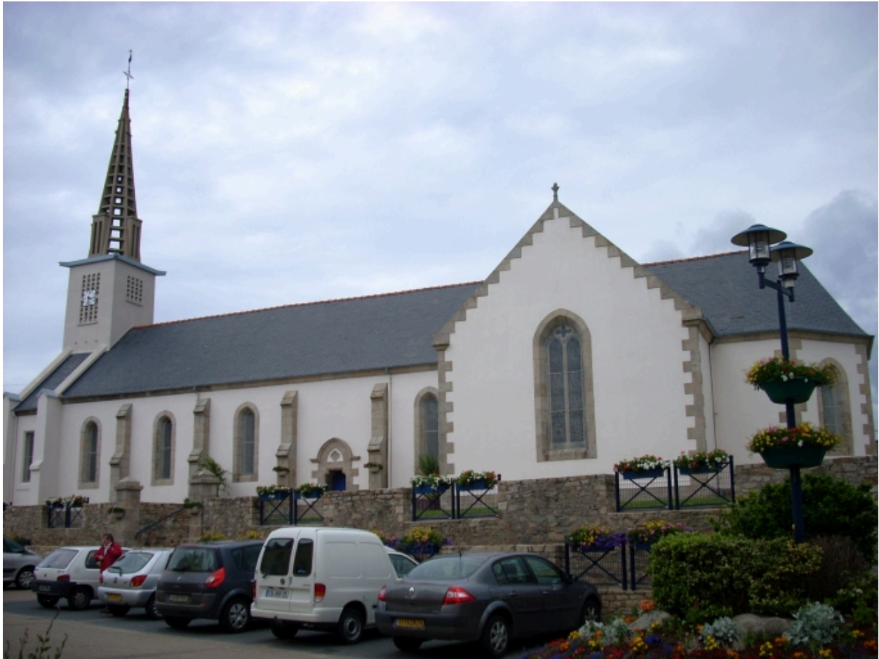
Plouguerneau, église de Lilia : vue générale sud-est