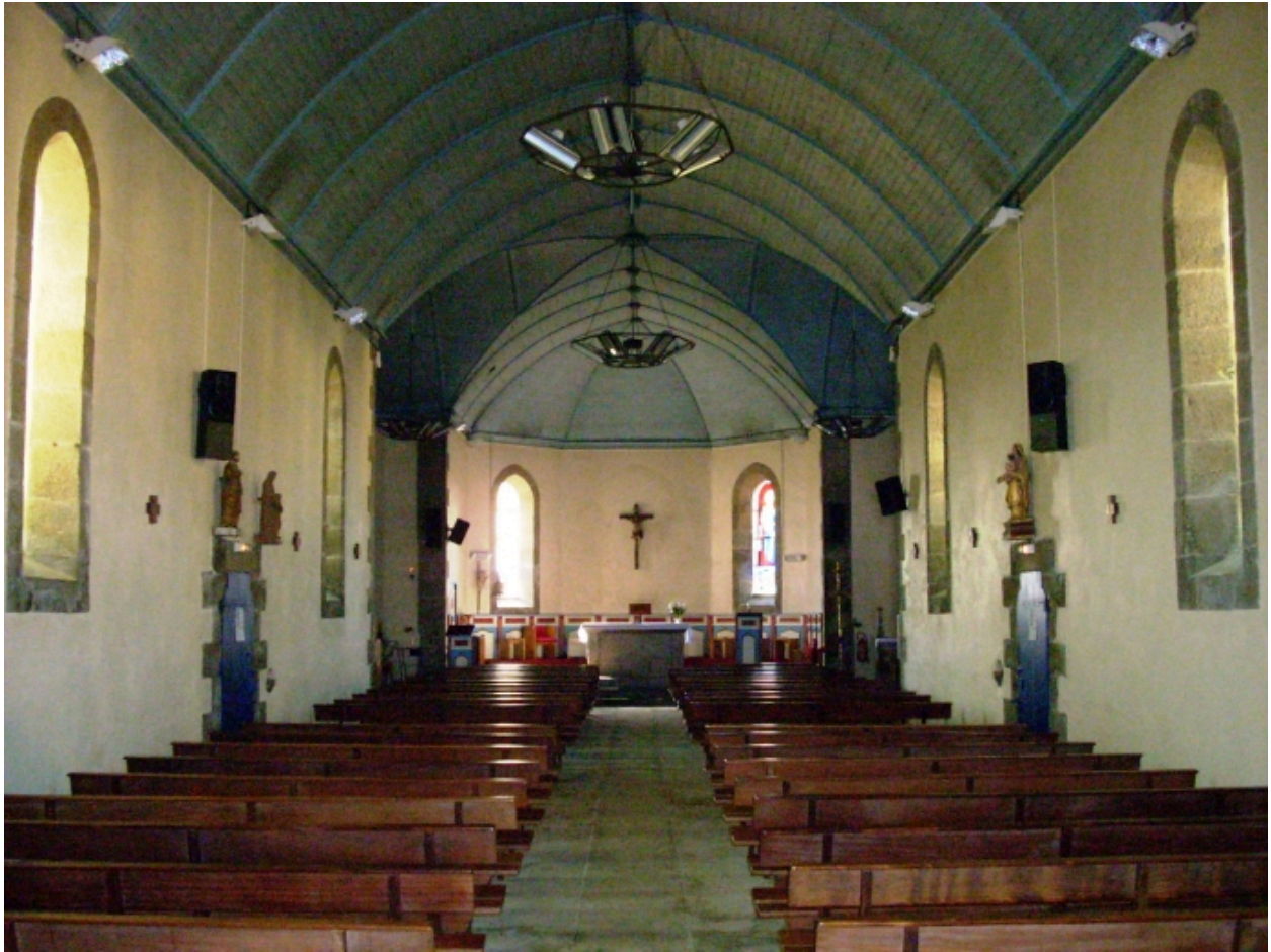
Plouguerneau, église de Lilia : vue axiale est