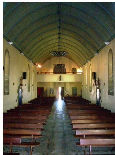
Plouguerneau, église de Lilia : vue axiale ouest