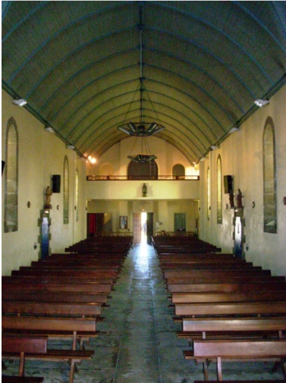
Plouguerneau, église de Lilia : vua axiale ouest