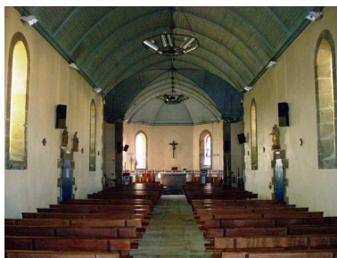
Plouguerneau, église de Lilia : vue axiale est IVR53_20082906122NUCA