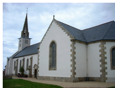
Plouguerneau, église de Lilia : vue générale sud-est IVR53_20082906120NUCA