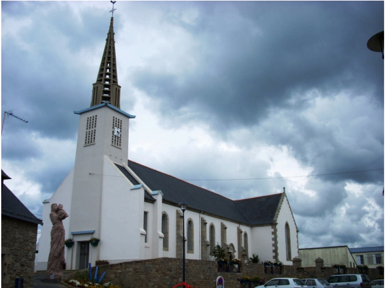
Plouguerneau, église de Lilia : vue générale sud-ouest