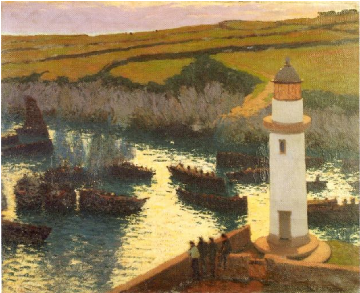
Peinture de Fernand Bruguière, Entrée du port de Doëlan, vers 1910