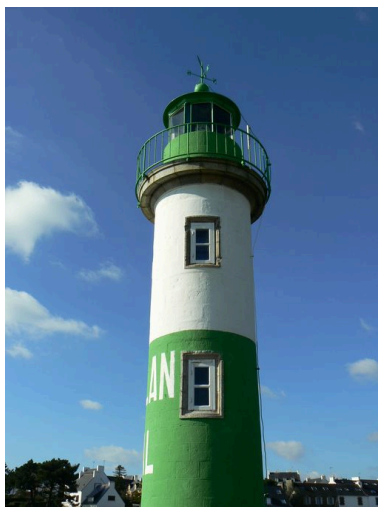
Détail du phare aval de Doëlan IVR53_20092909058NUCA