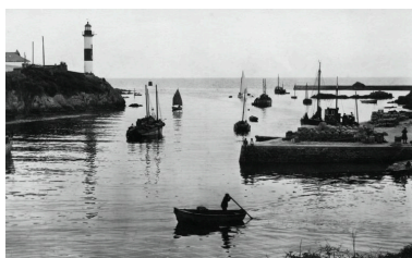
Phare aval dans les années 1950