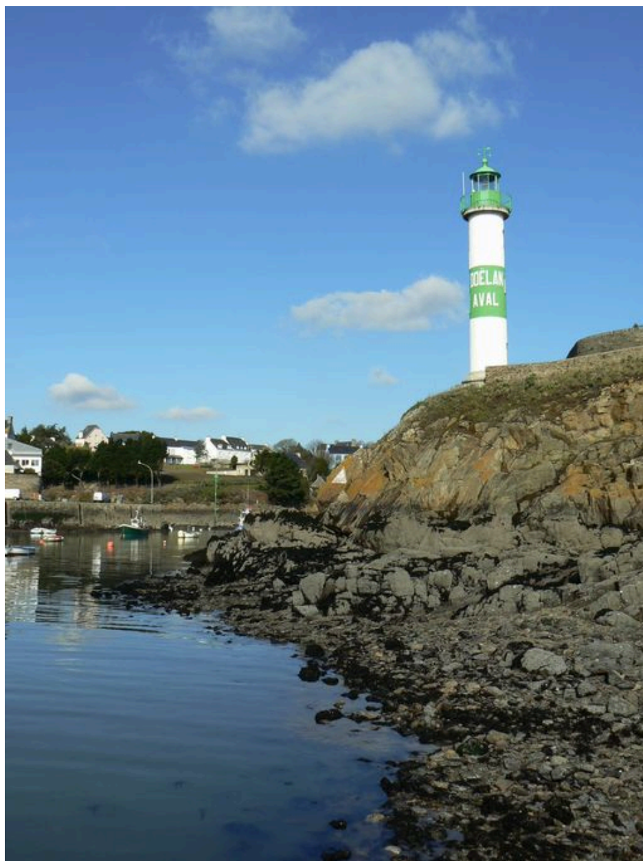
Phare aval de Doëlan