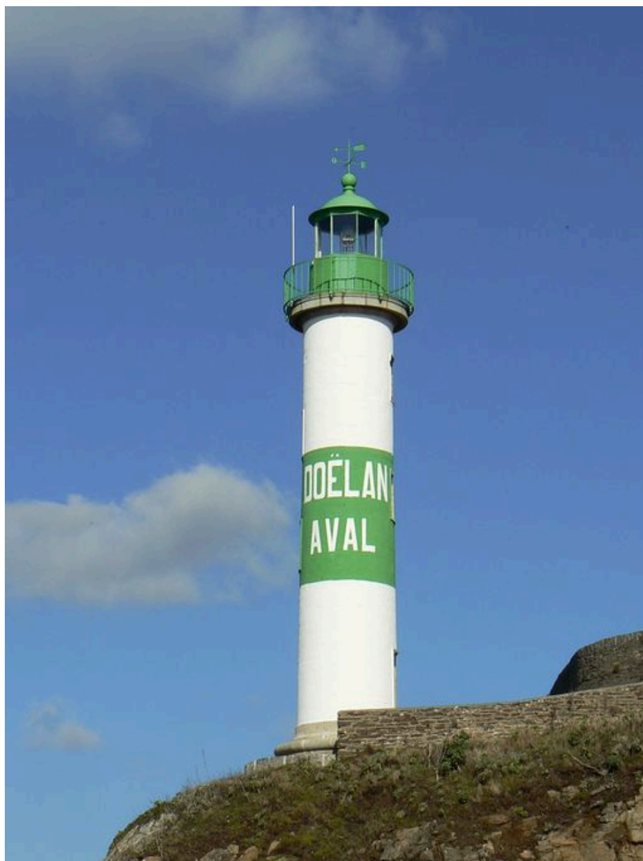
Phare aval de Doëlan