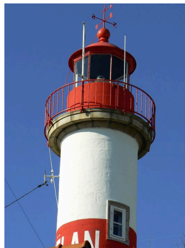
Détail du phare amont de Doëlan IVR53_20092909060NUCA