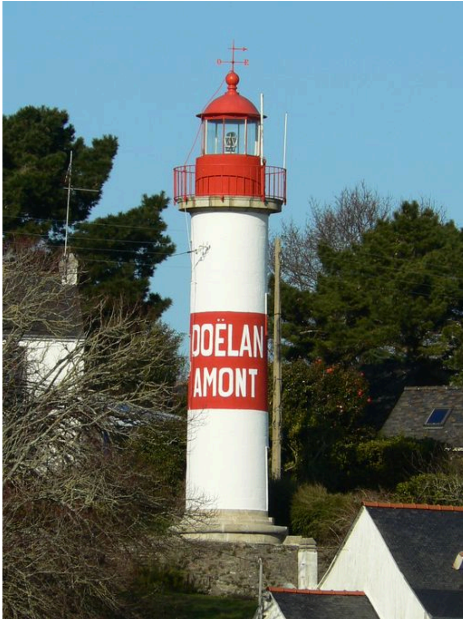
Phare amont de Doëlan