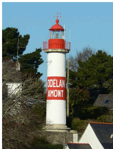
Phare amont de Doëlan IVR53_20092909059NUCA