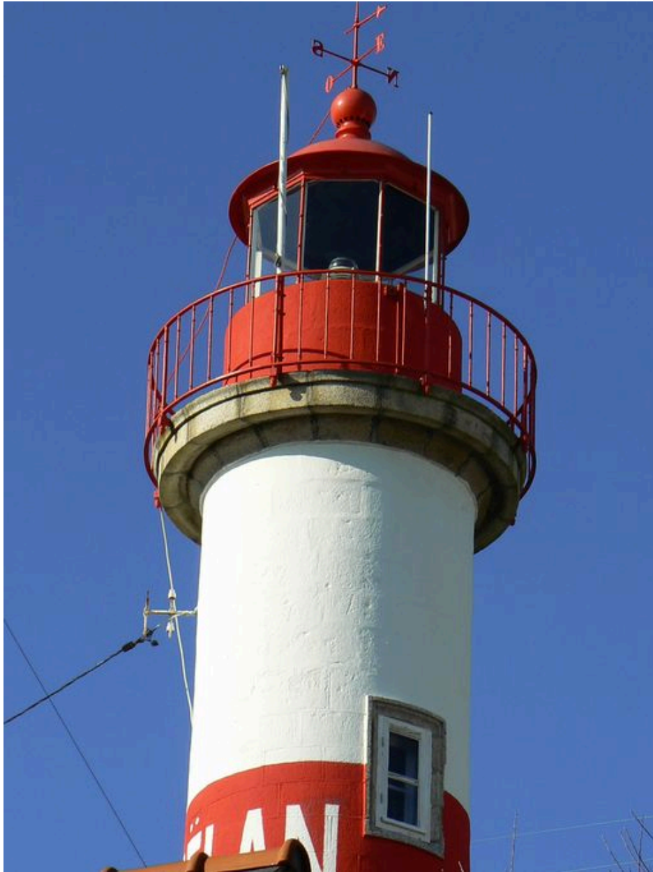
Détail du phare amont de Doëlan