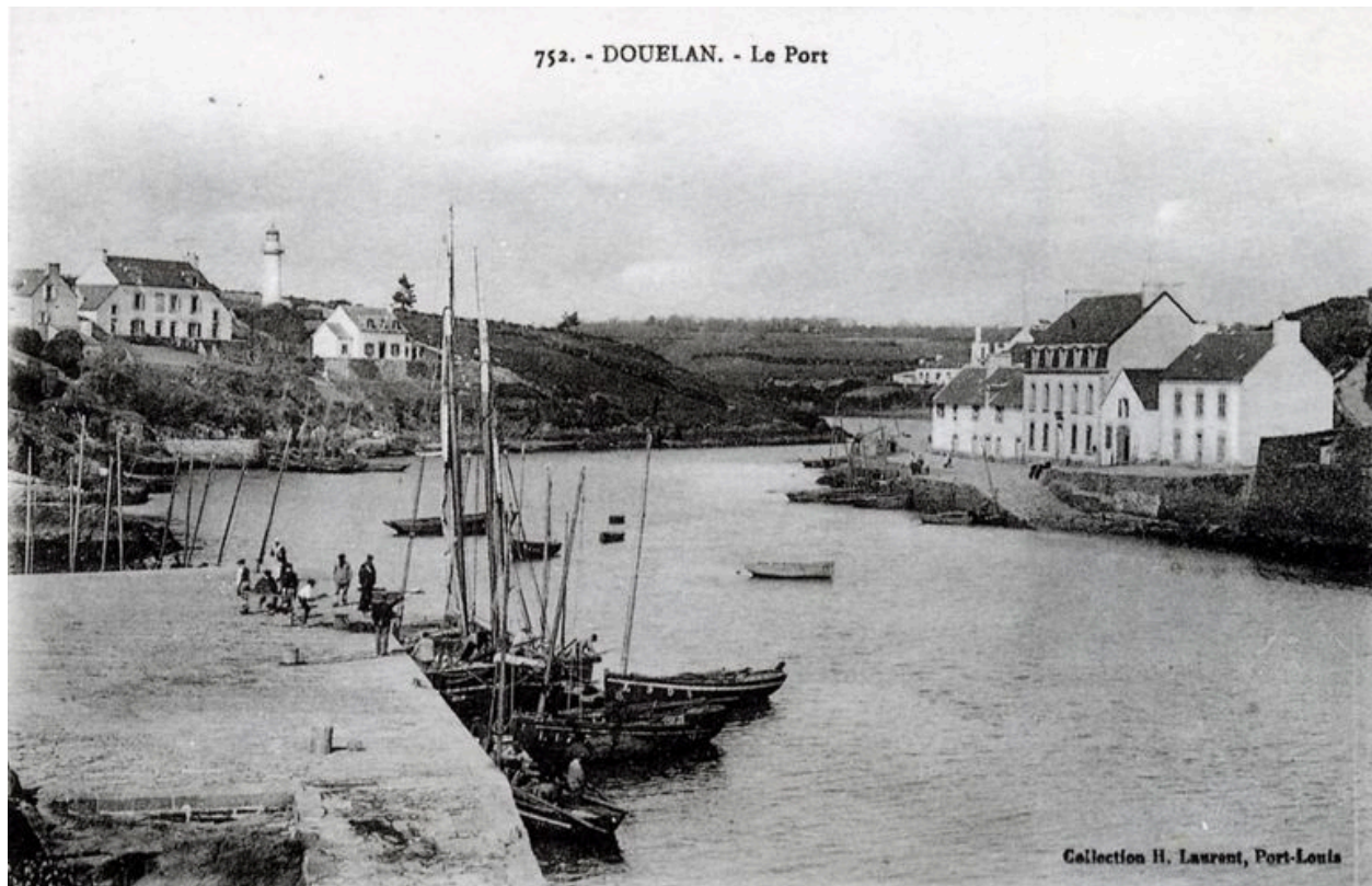
Phare amont de Doëlan au dernière plan, avant 1920