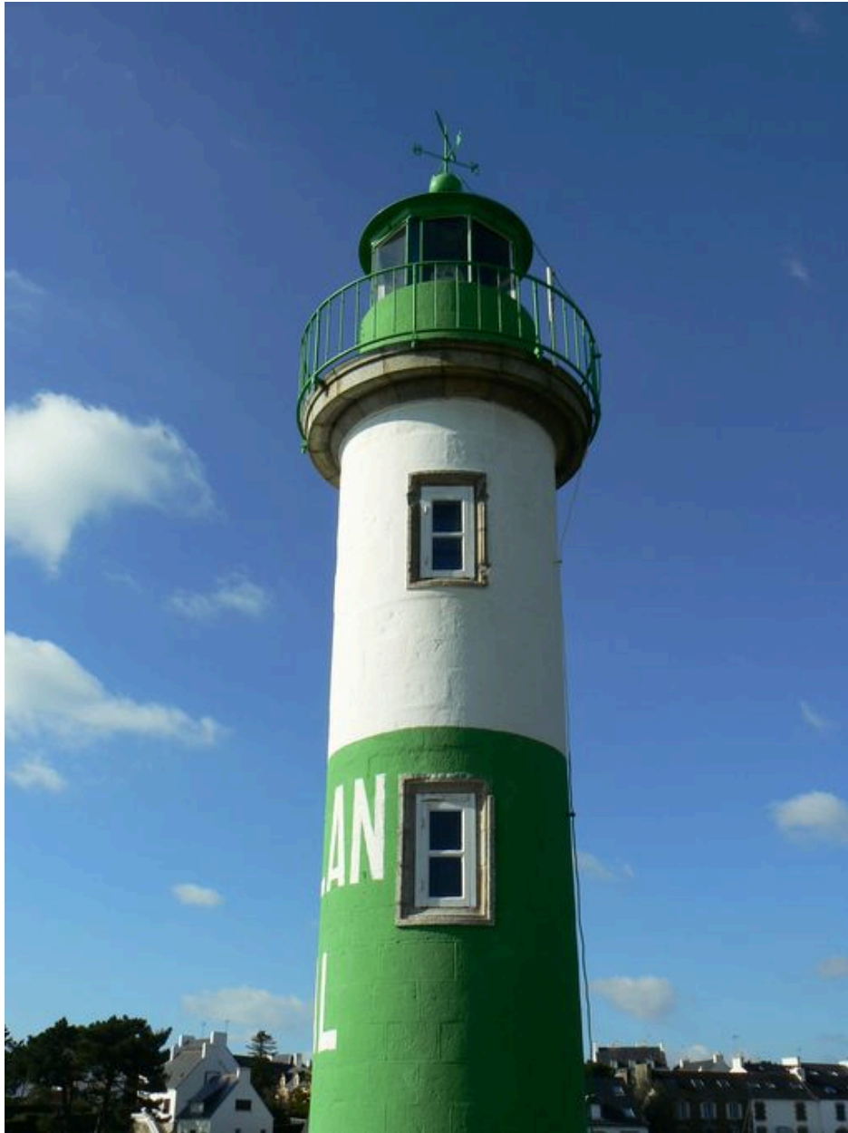
Détail du phare aval de Doëlan