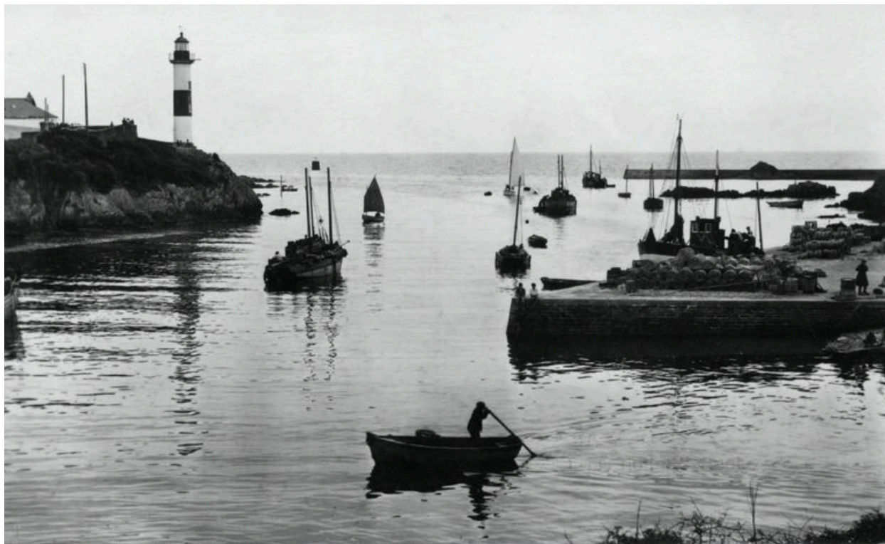
Phare aval dans les années 1950