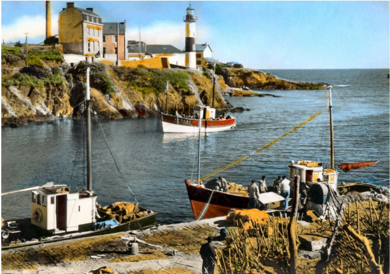
Phare aval dans les années 1950