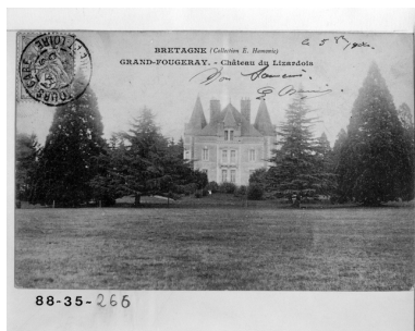
Vue de situation IVR53_19883500266X