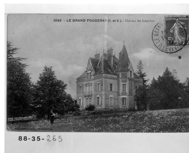
Vue rapprochée depuis le parc IVR53_19883500265X