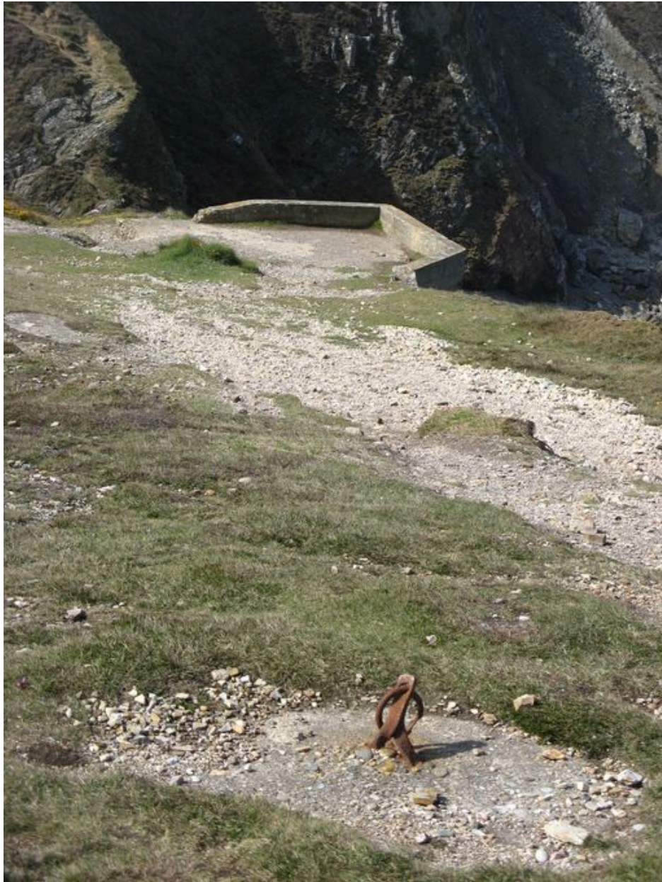
Vue générale du poste de chargement de galets