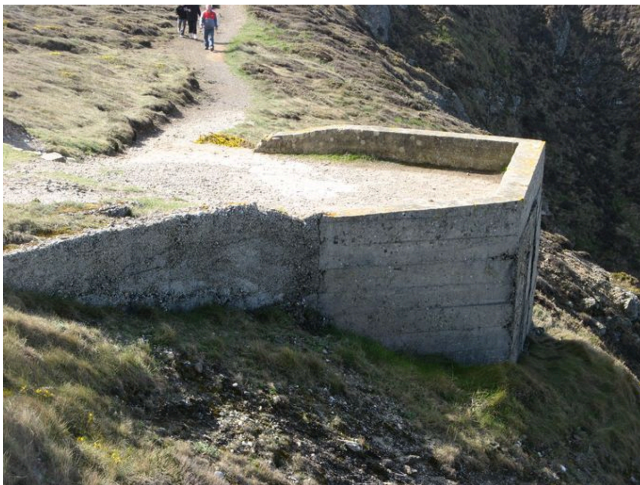
Parapet du poste de chargement de galets