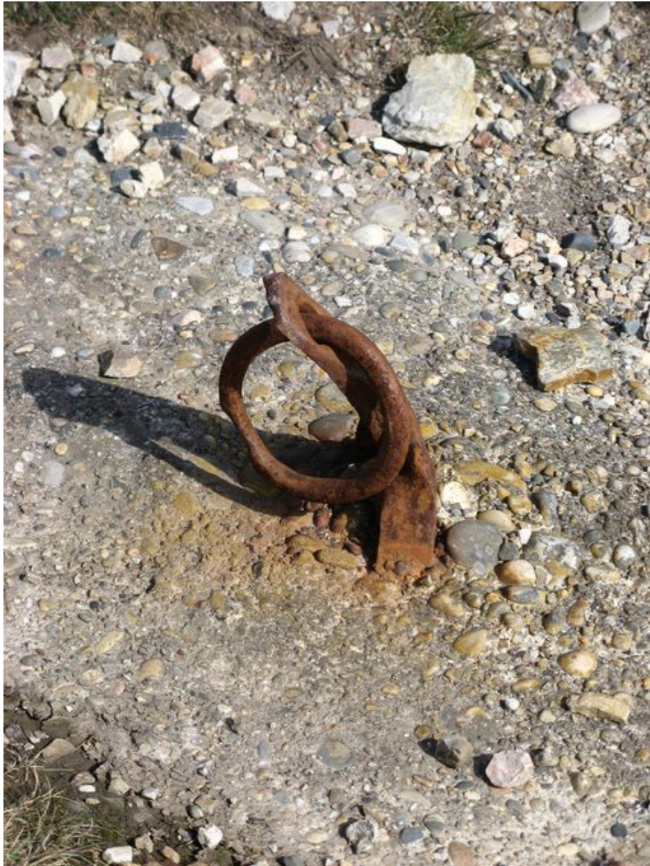
Anneau du poste de chargement de galets