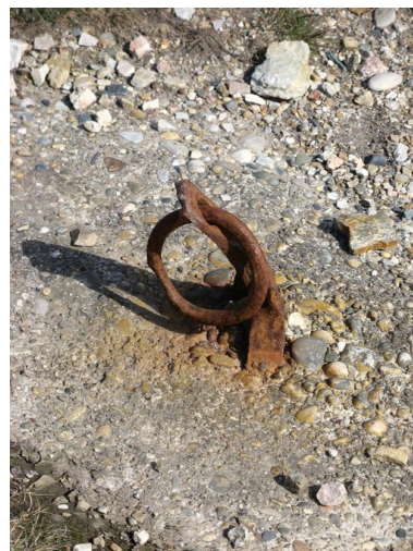
Anneau du poste de chargement de galets IVR53_20082908311NUCA