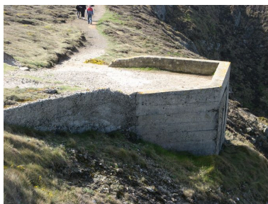
Parapet du poste de chargement de galets IVR53_20082908310NUCA