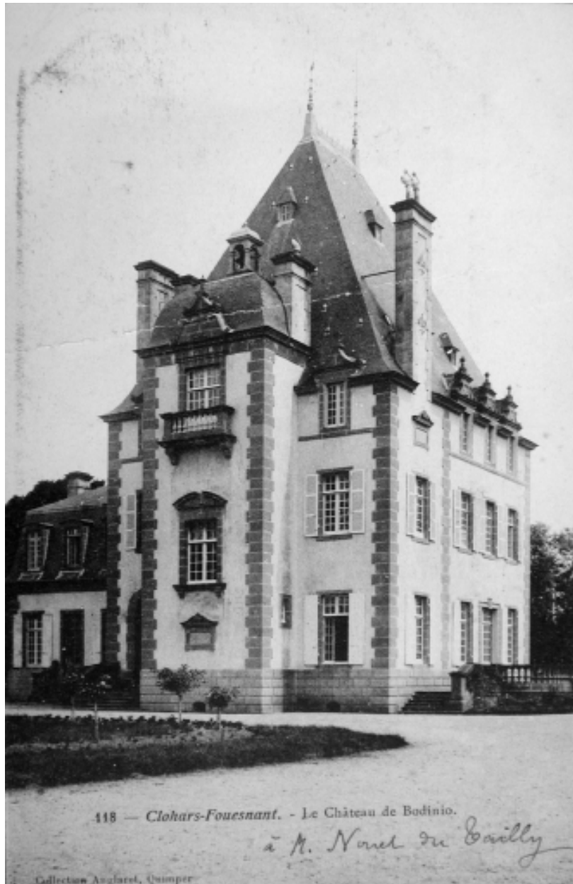
Vue du corps de logis moderne