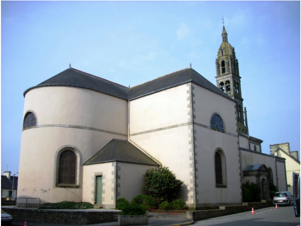
Plonéour-Lanvern, église paroissiale Saint-Eneour : vue générale nord-est