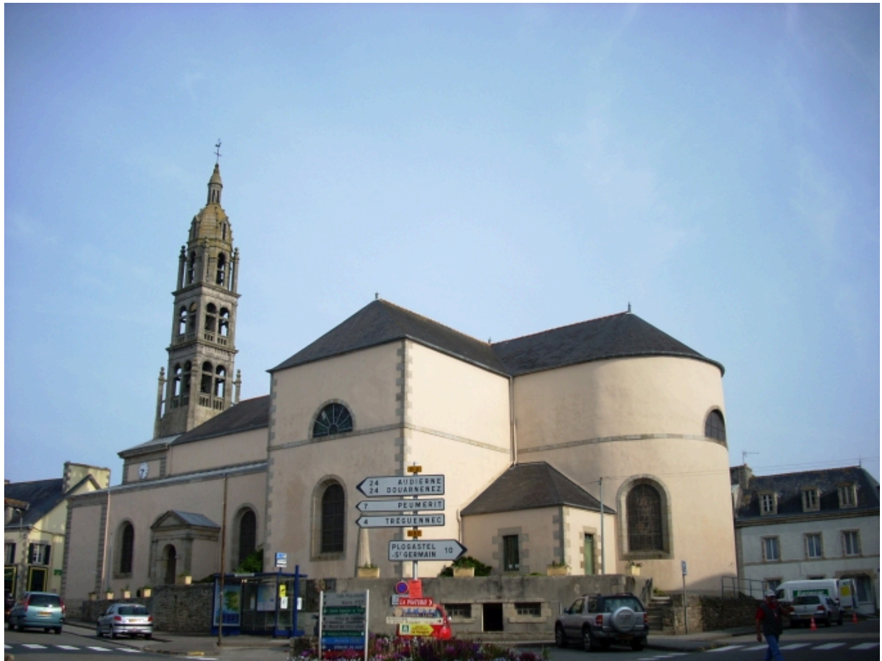
Plonéour-Lanvern, église paroissiale Saint-Eneour : vue générale sud-est