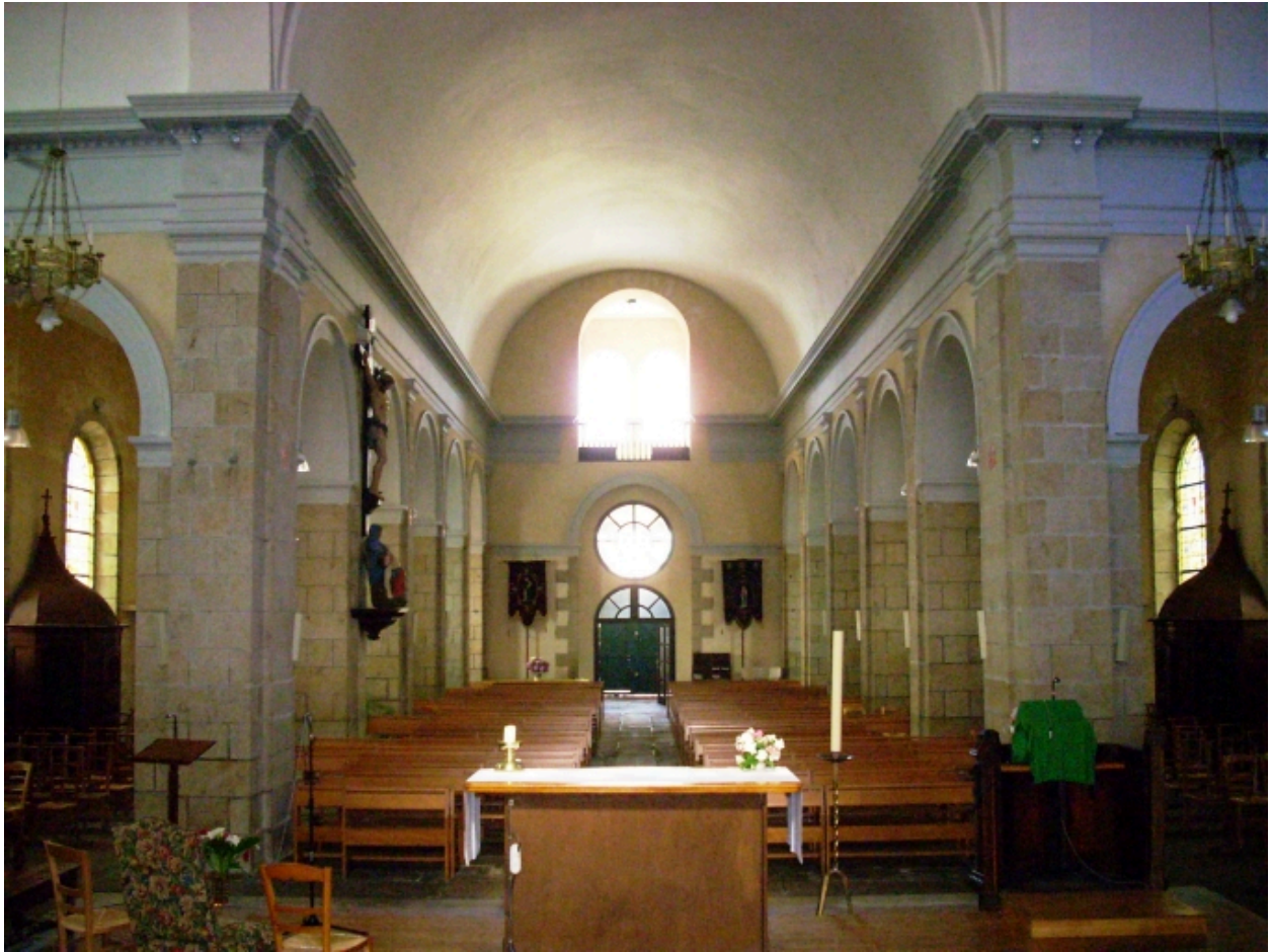
Plonéour-Lanvern, église paroissiale Saint-Eneour : vue axiale ouest