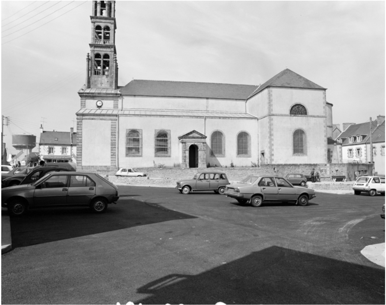
Plonéour-Lanvern, église paroissiale Saint-Eneour : élévation sud, vue générale, état en 1982