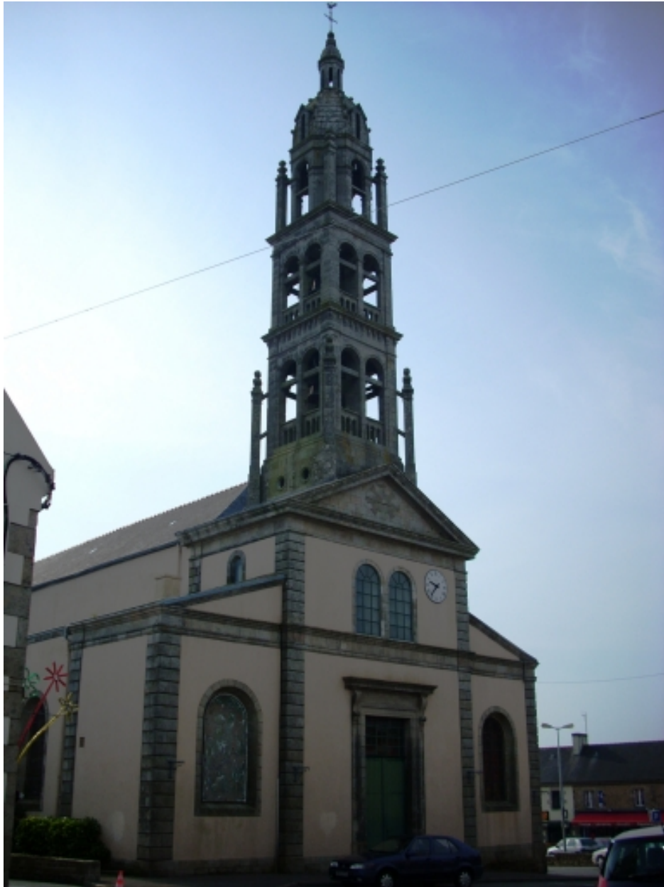
Plonéour-Lanvern, église paroissiale Saint-Eneour : vue générale ouest