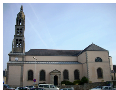
Plonéour-Lanvern, église paroissiale Saint-Eneour : vue général sud IVR53_20082905861NUCA