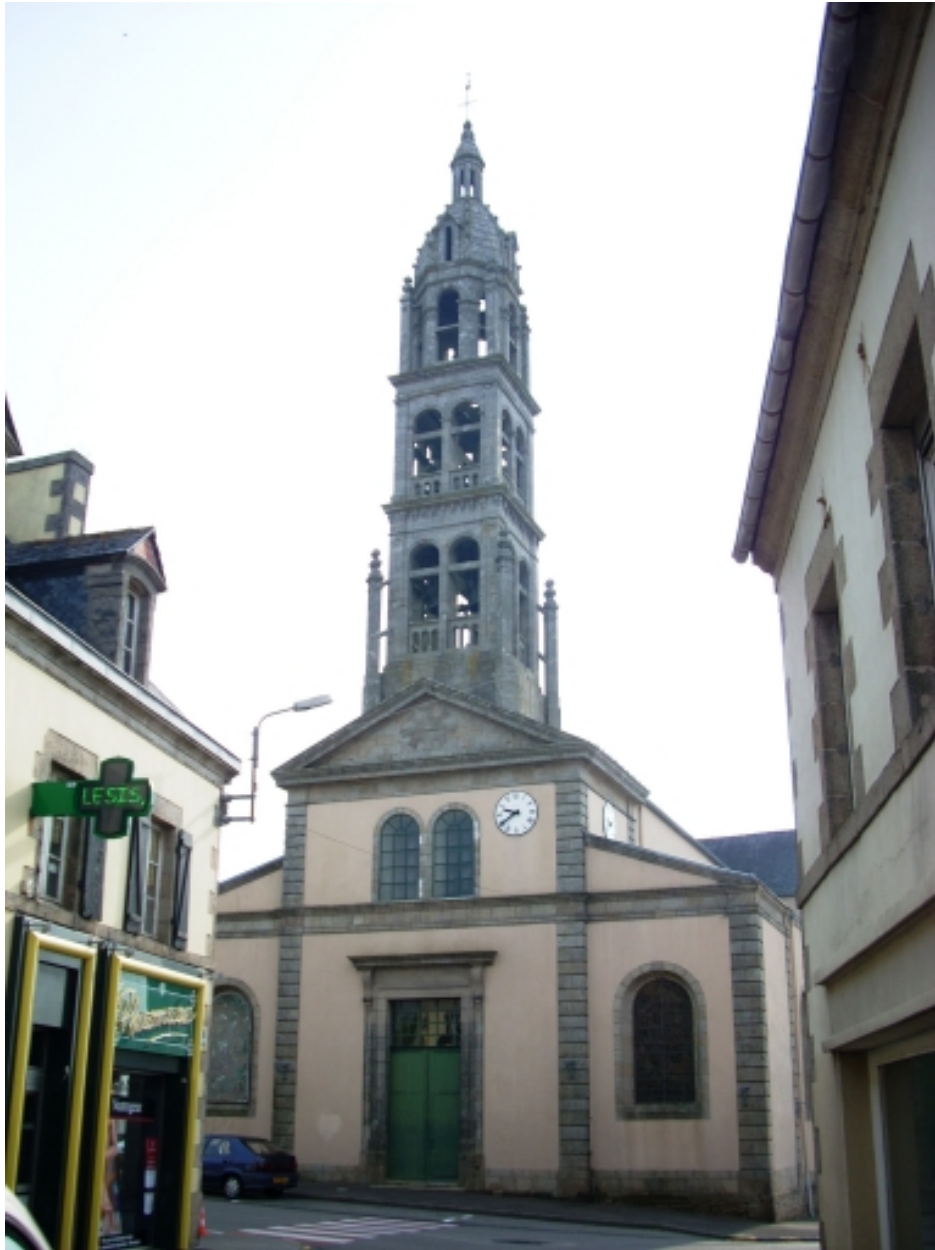
Plonéour-Lanvern, église paroissiale Saint-Eneour : vue générale ouest