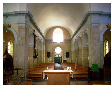
Plonéour-Lanvern, église paroissiale Saint-Eneour : vue axiale ouest IVR53_20082905864NUCA