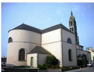
Plonéour-Lanvern, église paroissiale Saint-Eneour : vue générale nord-est