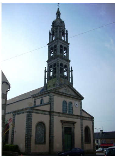
Plonéour-Lanvern, église paroissiale Saint-Eneour : vue générale ouest IVR53_20082905860NUCA