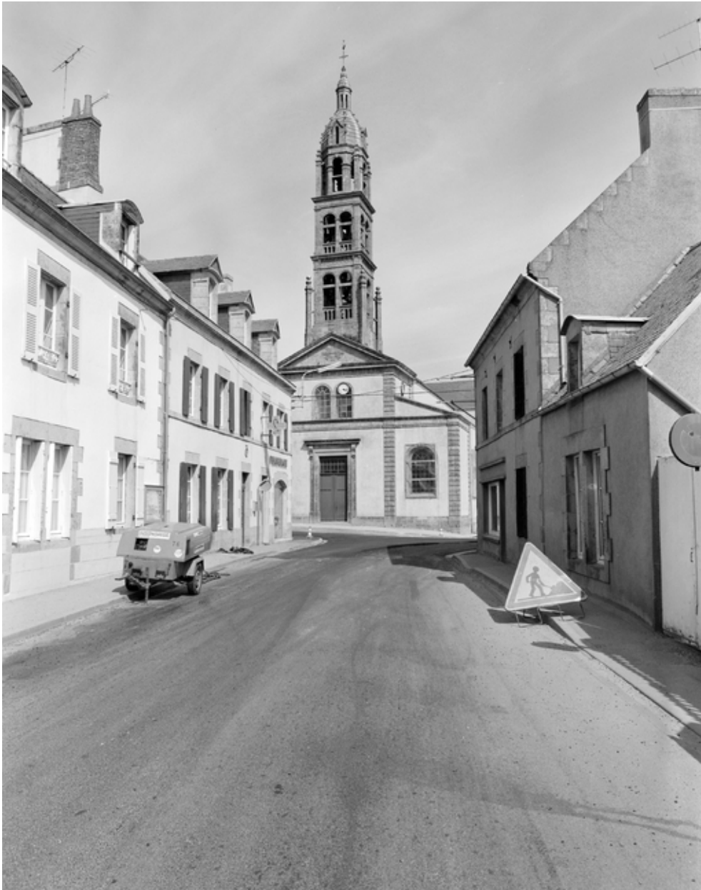
Plonéour-Lanvern, église paroissiale Saint-Eneour : élévation ouest, vue générale, état en 1982