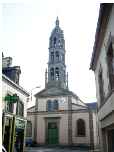
Plonéour-Lanvern, église paroissiale Saint-Eneour : vue générale ouest IVR53_20082905859NUCA