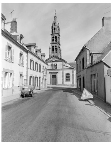
Plonéour-Lanvern, église paroissiale Saint-Eneour : élévation ouest, vue générale, état en 1982 IVR53_19822900173X