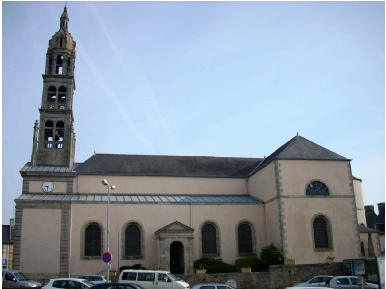
Plonéour-Lanvern, église paroissiale Saint-Eneour : vue général sud