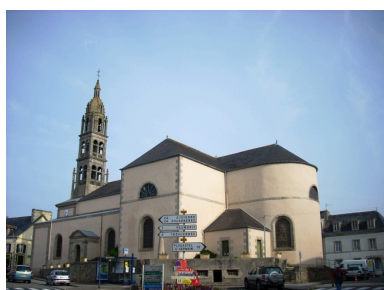
Plonéour-Lanvern, église paroissiale Saint-Eneour : vue générale sud-est IVR53_20082905862NUCA