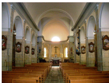
Plonéour-Lanvern, église paroissiale Saint-Eneour : vue axiale est IVR53_20082905865NUCA