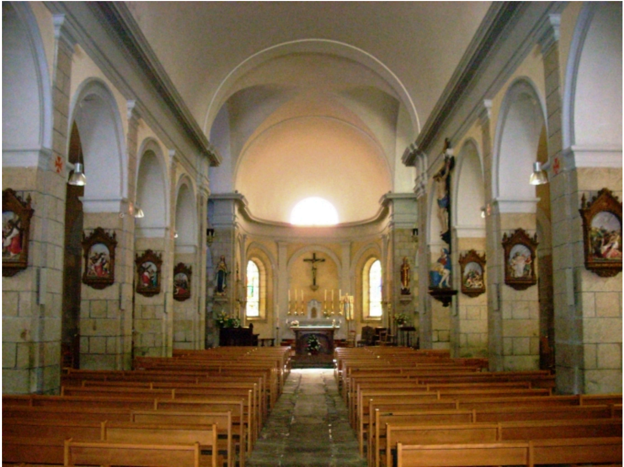
Plonéour-Lanvern, église paroissiale Saint-Eneour : vue axiale est