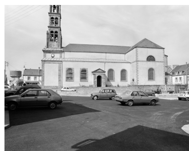
Plonéour-Lanvern, église paroissiale Saint-Eneour : élévation sud, vue générale, état en 1982 IVR53_19822900174X