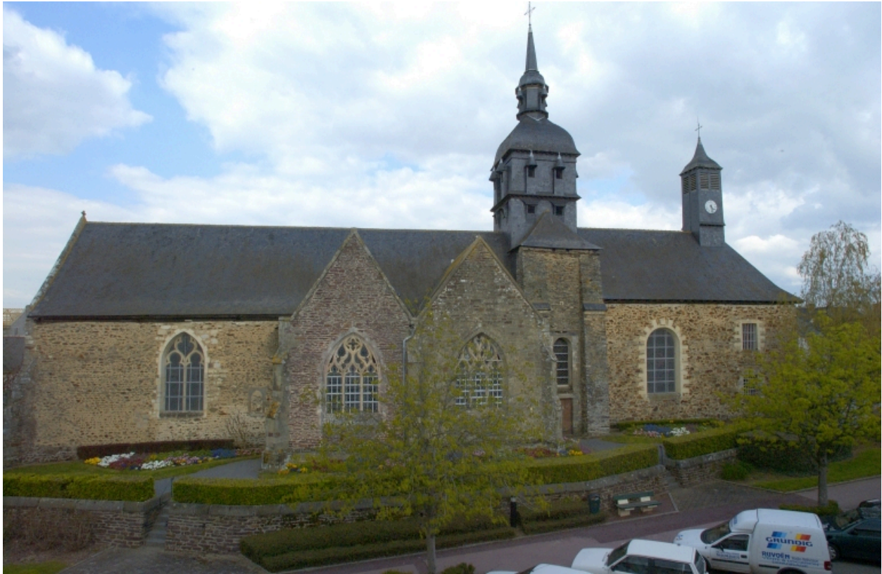
Vue générale sud