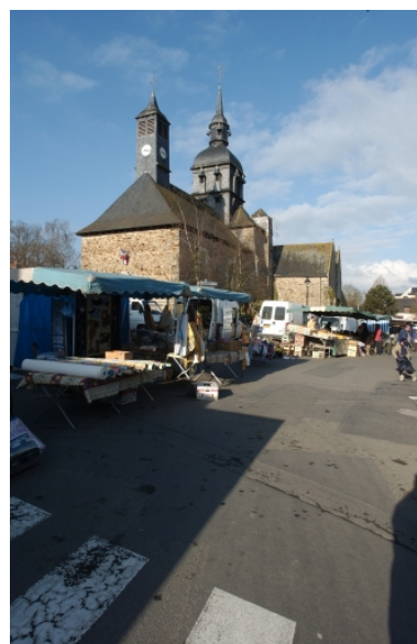
Vue depuis l'est un Jour de marché