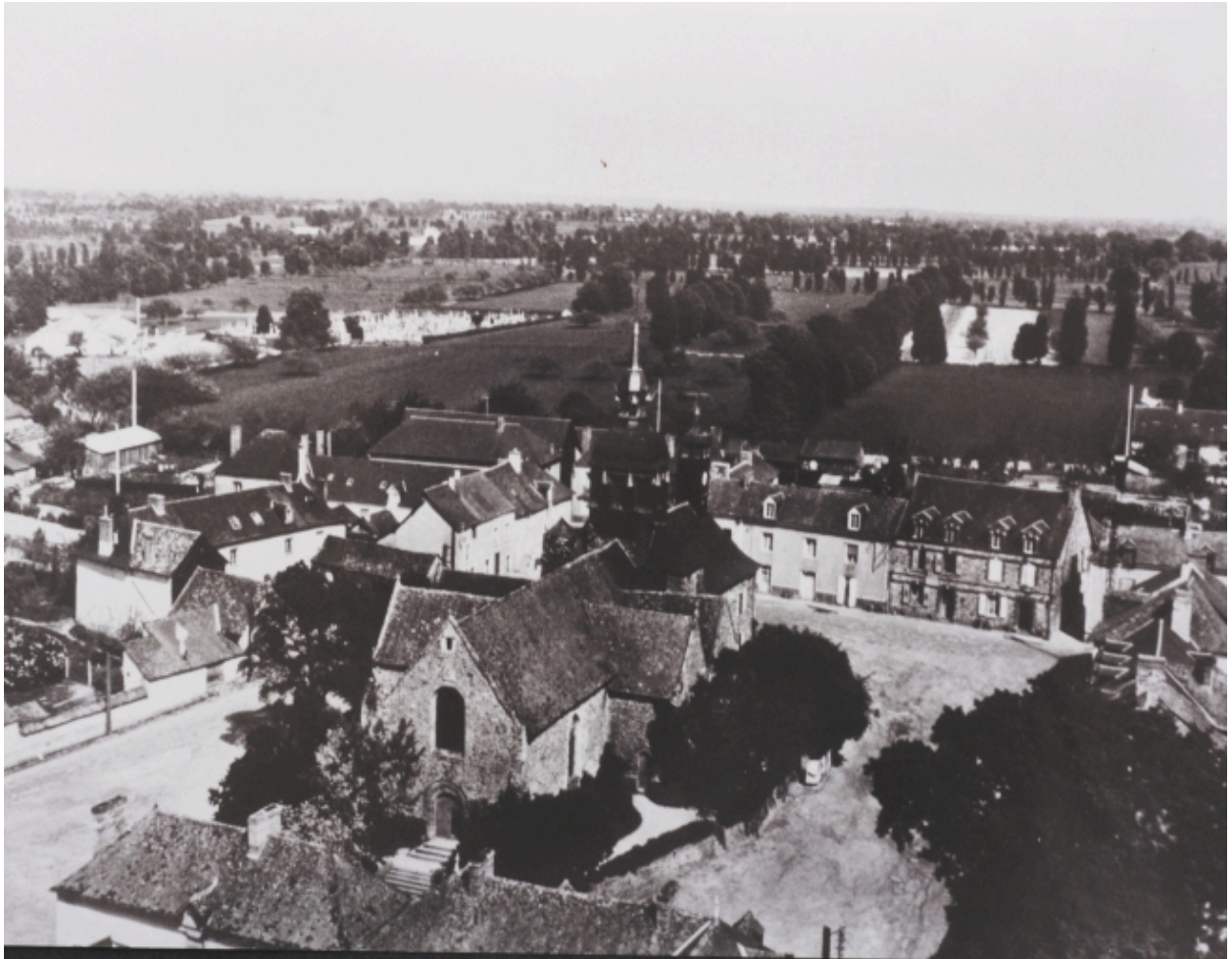
Vue aérienne sud ouest vers 1960