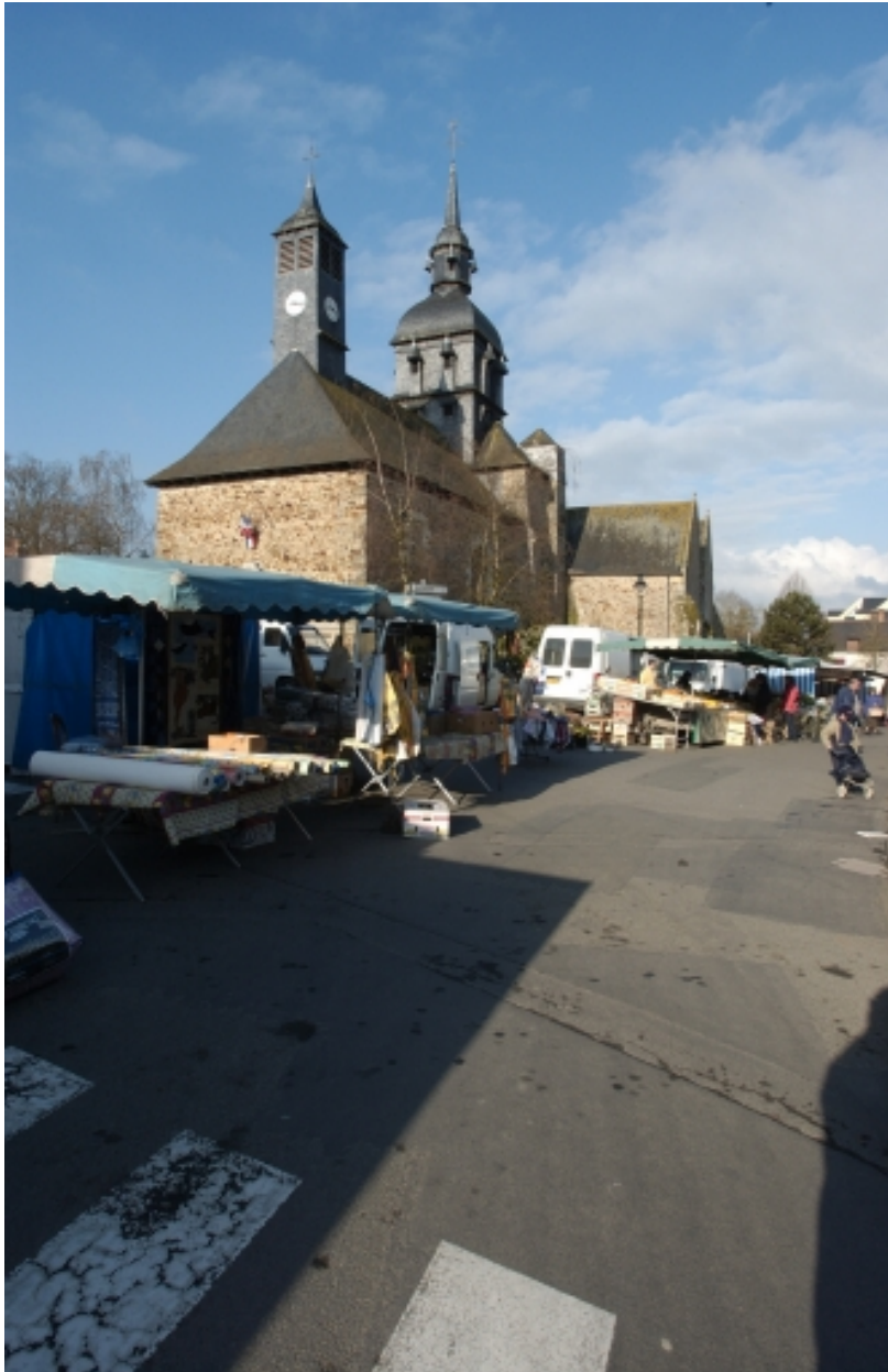
Vue depuis l'est un Jour de marché