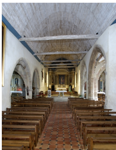
Vue intérieure prise de la nef vers le choeur IVR53_20043501122NUCA