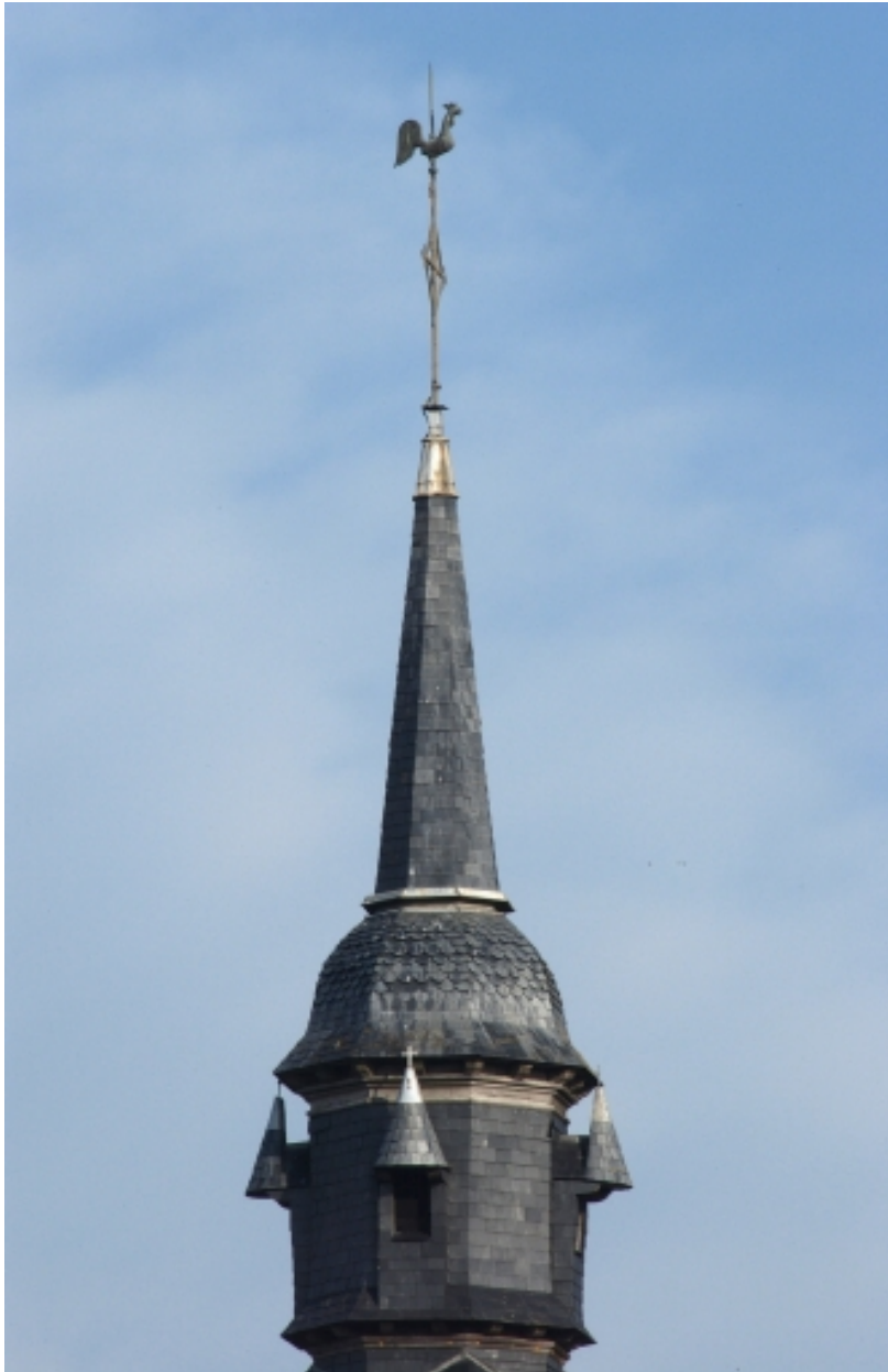
Flèche au sommet du clocher