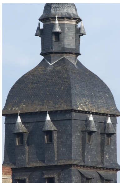
Vue de l'étage du clocher IVR53_20043500254NUCA