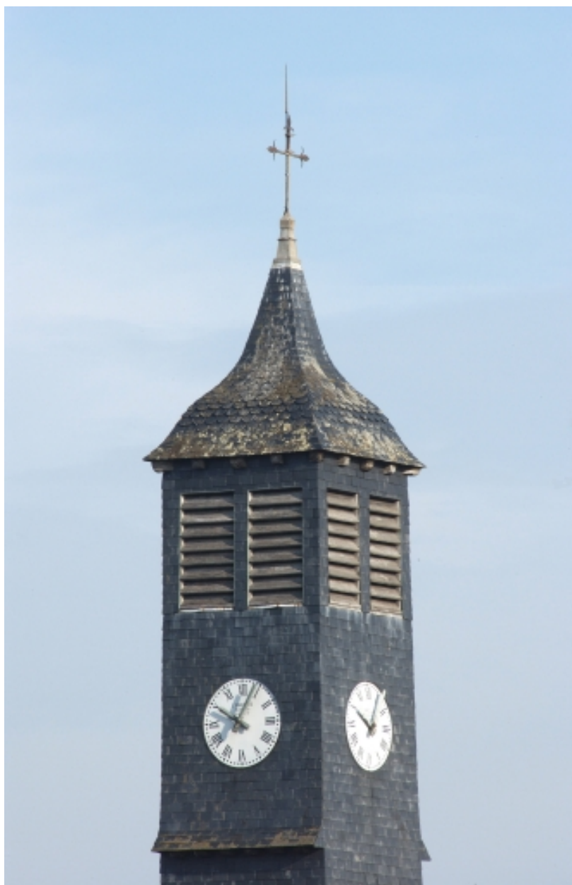
Campanile et horloge sur le chevet