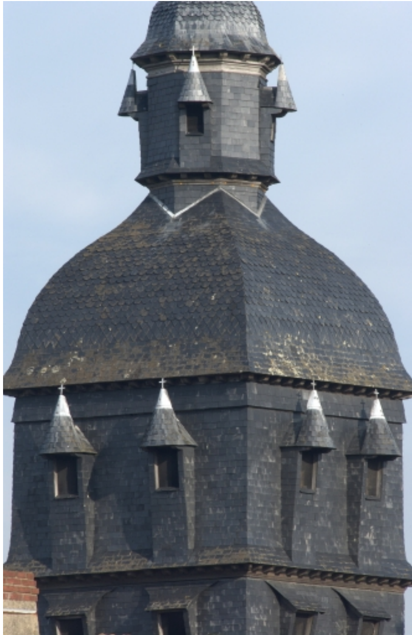
Vue de l'étage du clocher