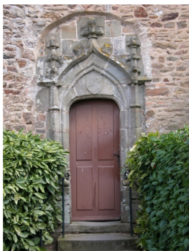
Détail : porte ; transept nord, mur ouest IVR53_20043503909NUCA