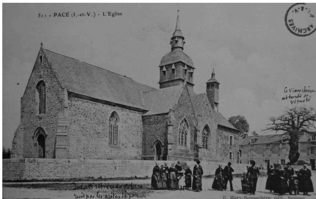
Carte postale vers 1900 : l'église vue du sud-ouest