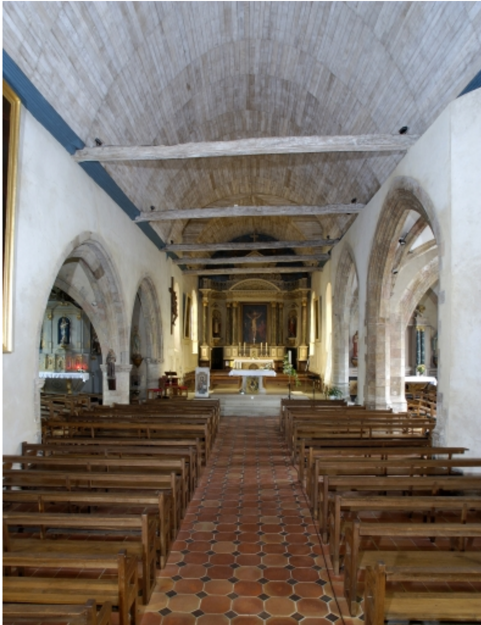
Vue intérieure prise de la nef vers le chœur