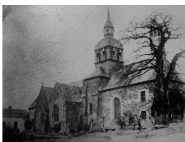
Vue de l'église prise du sud-est vers 1900.