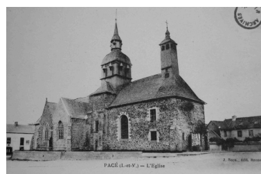
Carte postale : l'église vue du sud-est vers 1900 IVR53_20043503823NUC