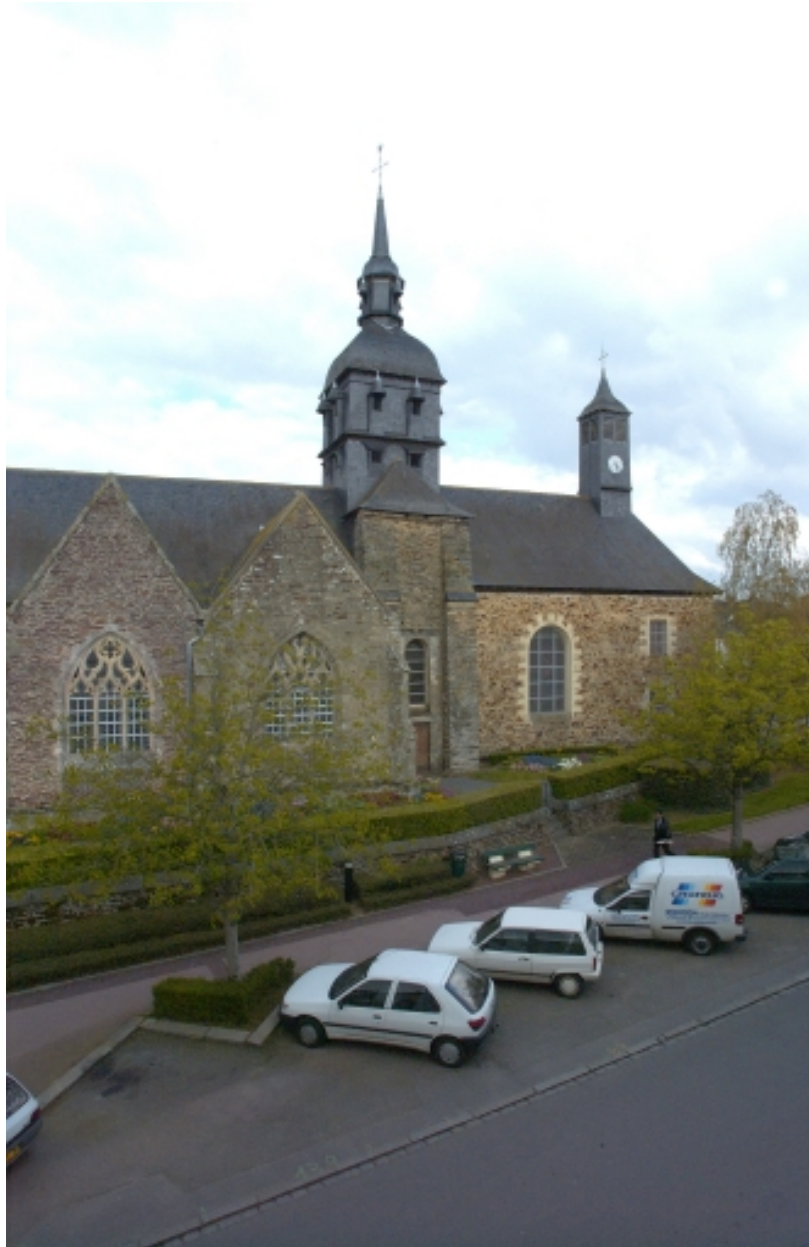
Vue partielle sud