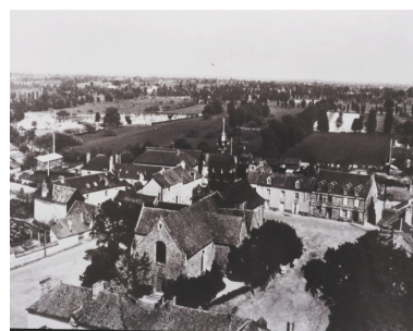
Vue aérienne sud ouest vers 1960 IVR53_20043500609NUC