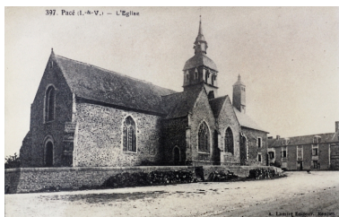
Carte postale vers 1900, l'église vue du sud-ouest IVR53_20043500622NUC