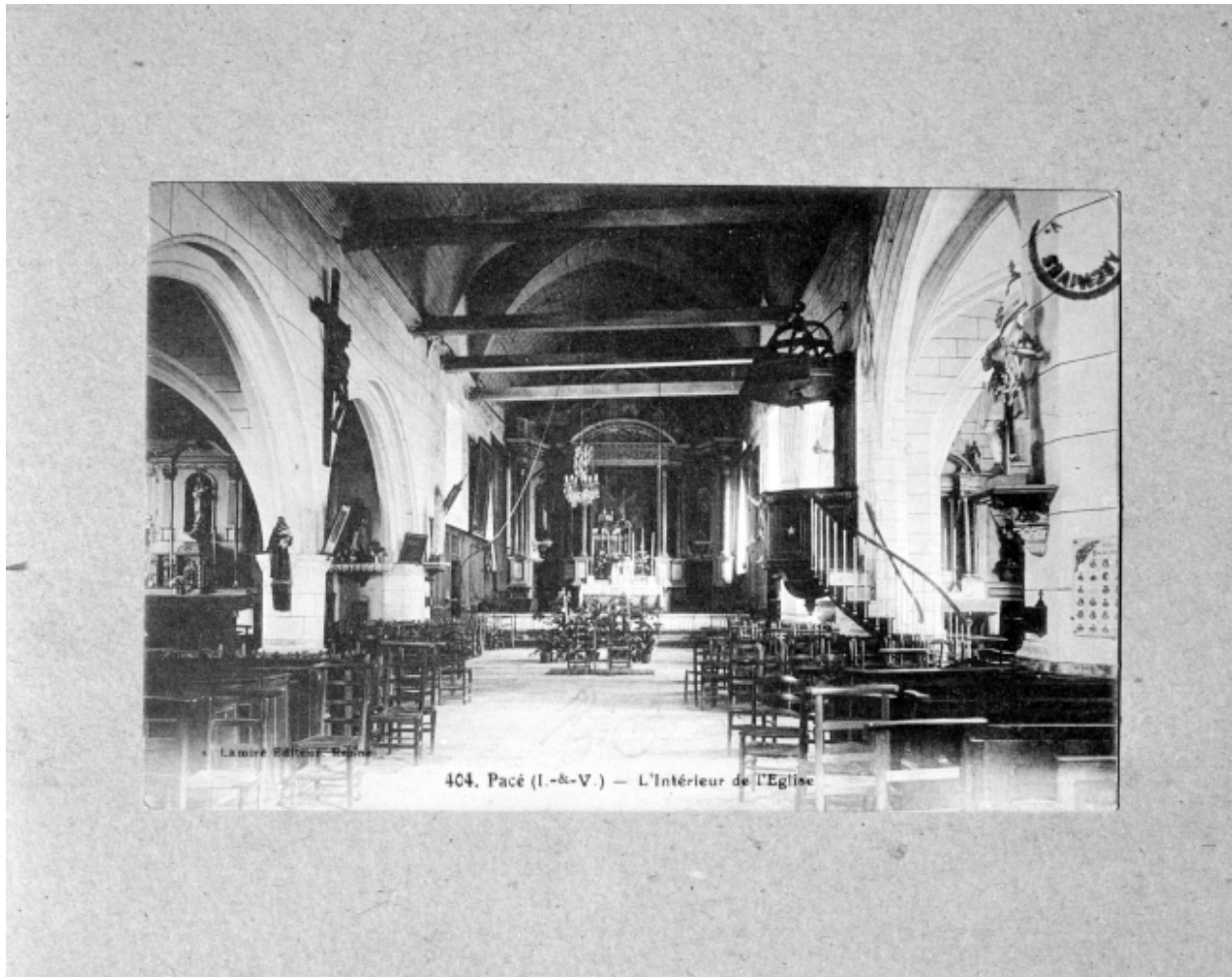
Carte postale ; vue intérieure vers 1900