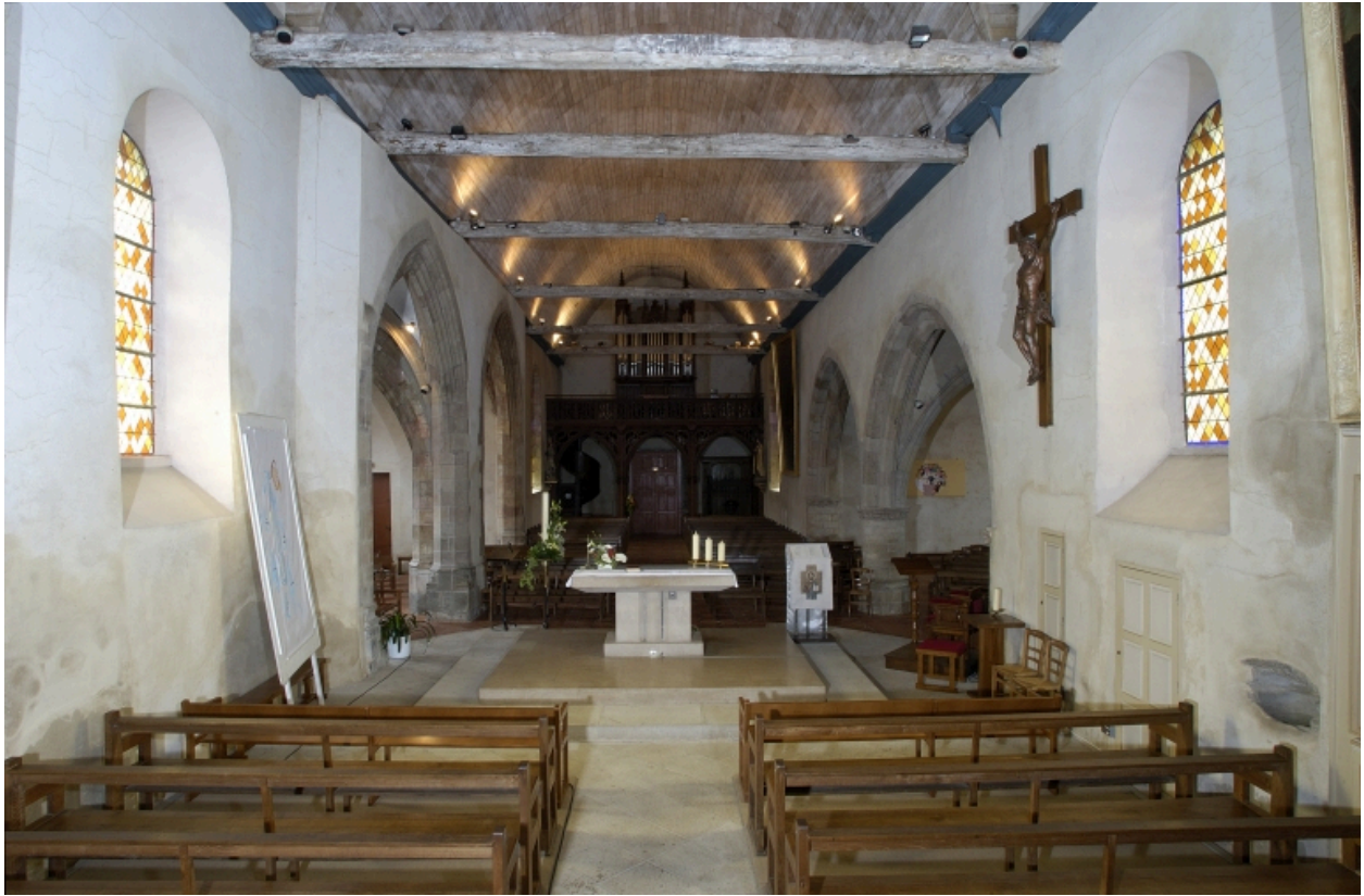
Vue intérieure prise du chœur vers la nef