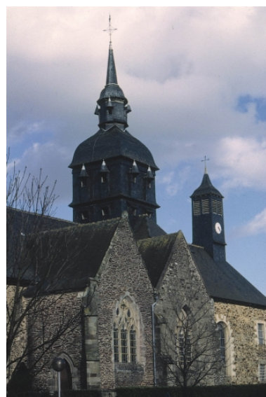
Vue partielle sud IVR53_19943502754ZA

Vue générale prise du sud est en 1994 IVR53_19943502753ZA