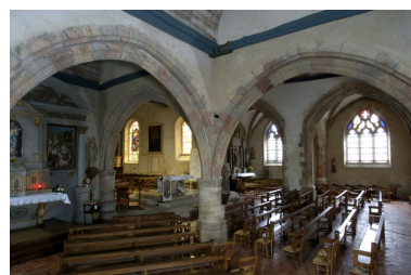
Vue intérieure prise depuis les chapelles nord IVR53_20043501123NUCA