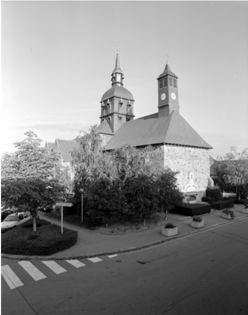
Le choeur pris du sud-est en 1994