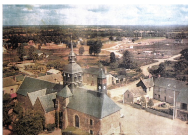
Vue aérienne sud-est vers 1960, avec l'ancien presbytère au nord.