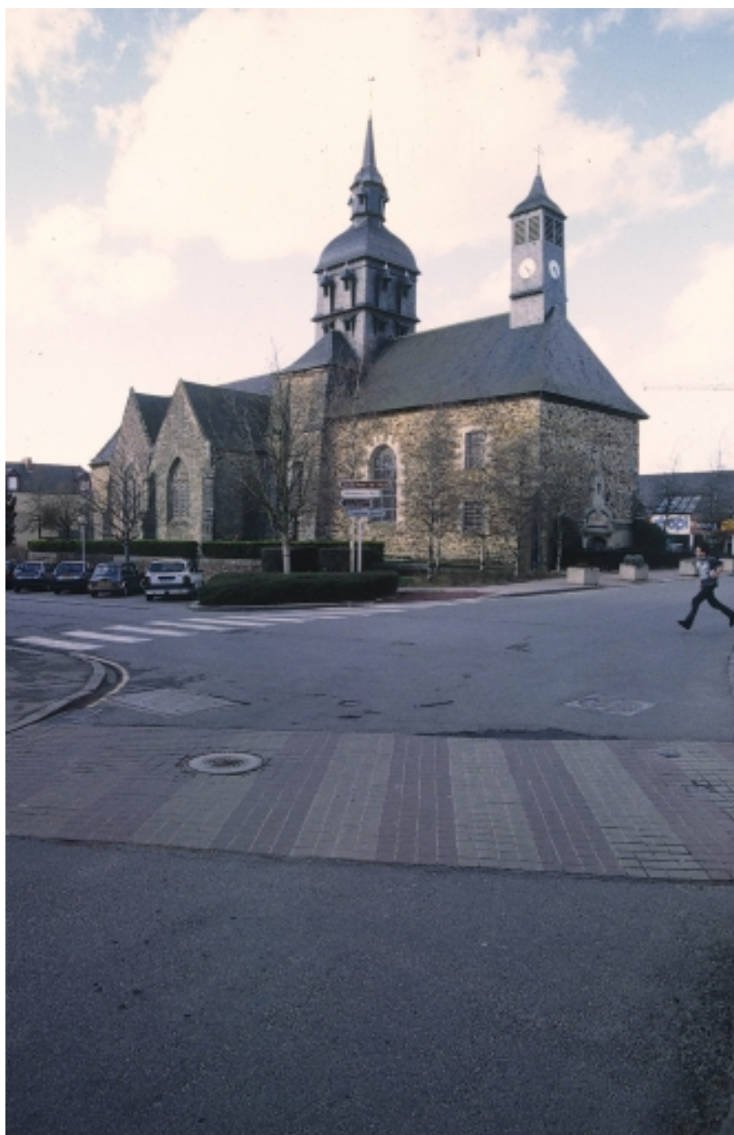
Vue générale prise du sud est en 1994