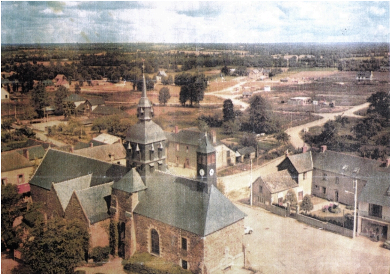
Vue aérienne sud-est vers 1960, avec l'ancien presbytère au nord.