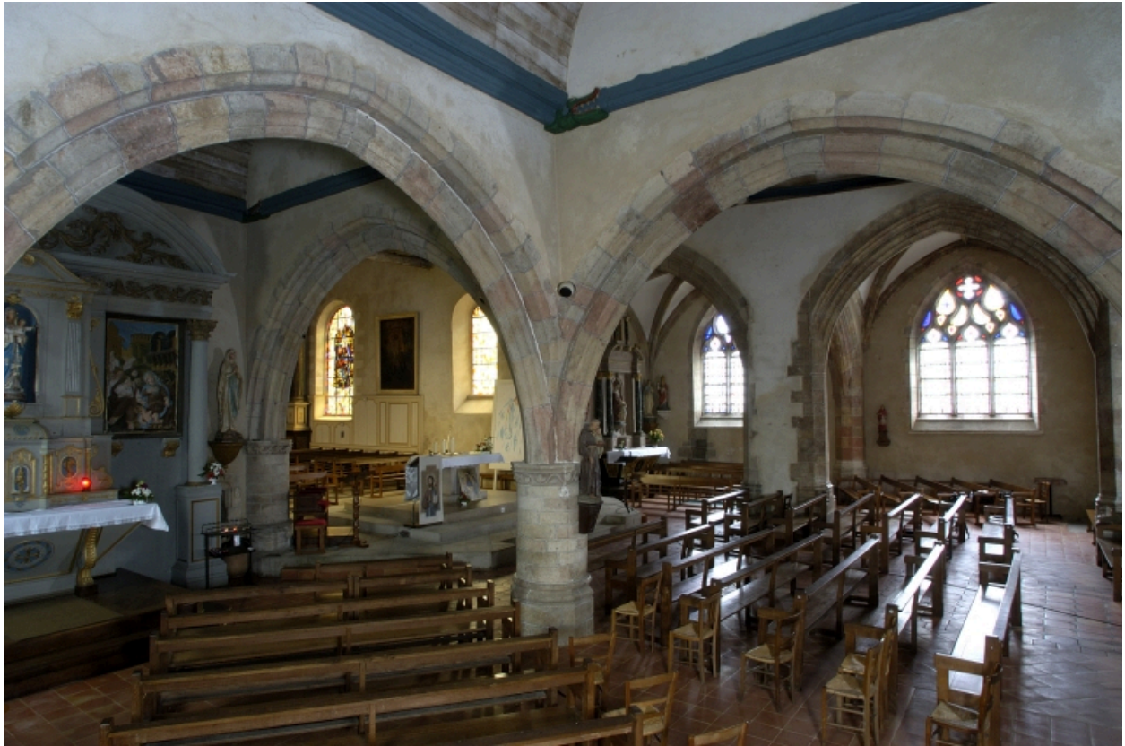
Vue intérieure prise depuis les chapelles nord