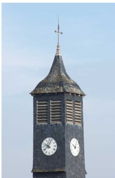
Campanile et horloge sur le chevet