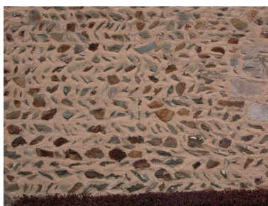
Détail : mur sud de la nef IVR53_20043503908NUCA