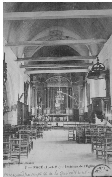
Carte postale ; vue intérieure vers 1900 IVR53_20043503821NUC