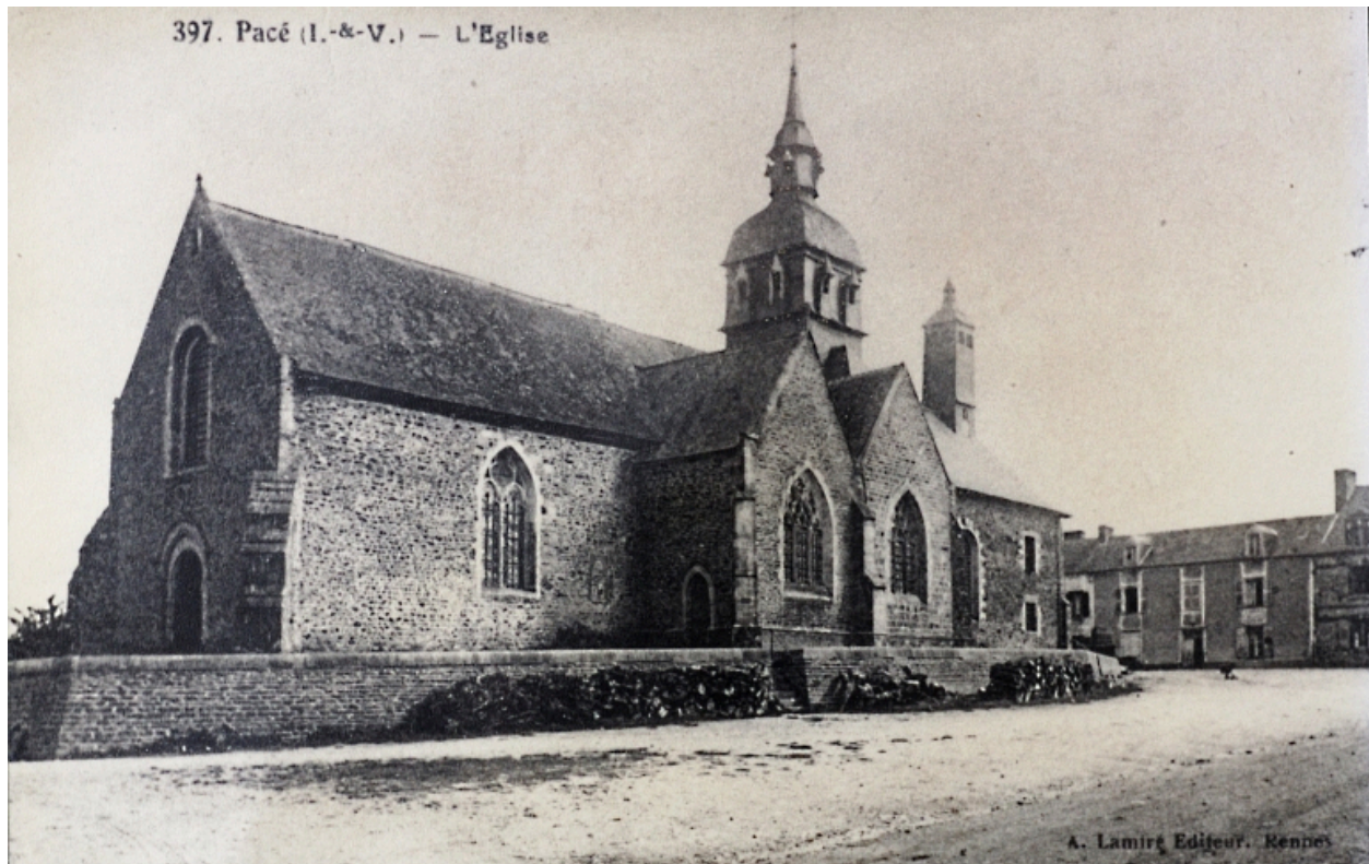
Carte postale vers 1900, l'église vue du sud-ouest