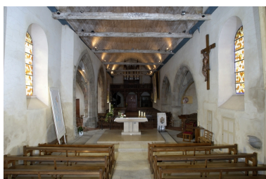
Vue intérieure prise du choeur vers la nef IVR53_20043501124NUCA