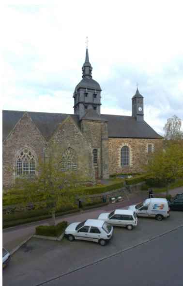
Vue partielle sud IVR53_20043500510NUCA

Vue générale prise du sud est en 1994 IVR53_19943502753ZA