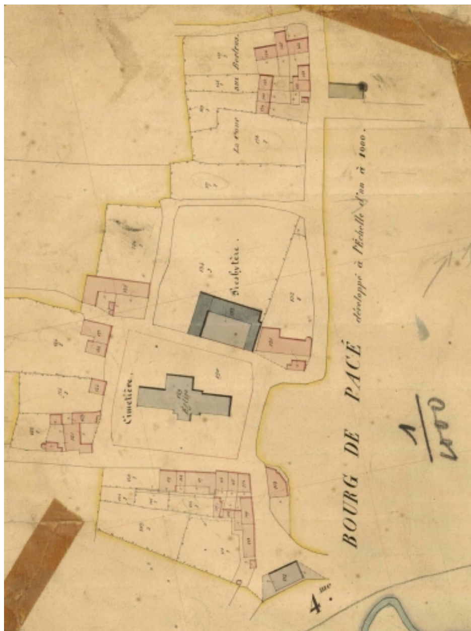
L'église sur le cadastre de 1851