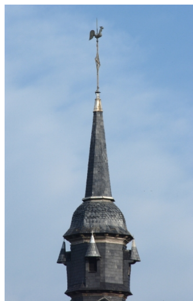
Flèche au sommet du clocher IVR53_20043500252NUCA