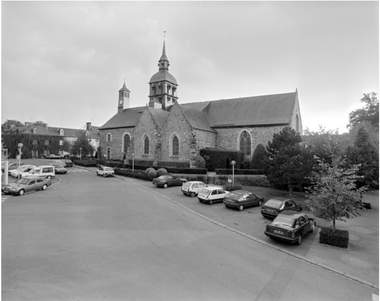
Vue générale prise du nord-ouest en 1994