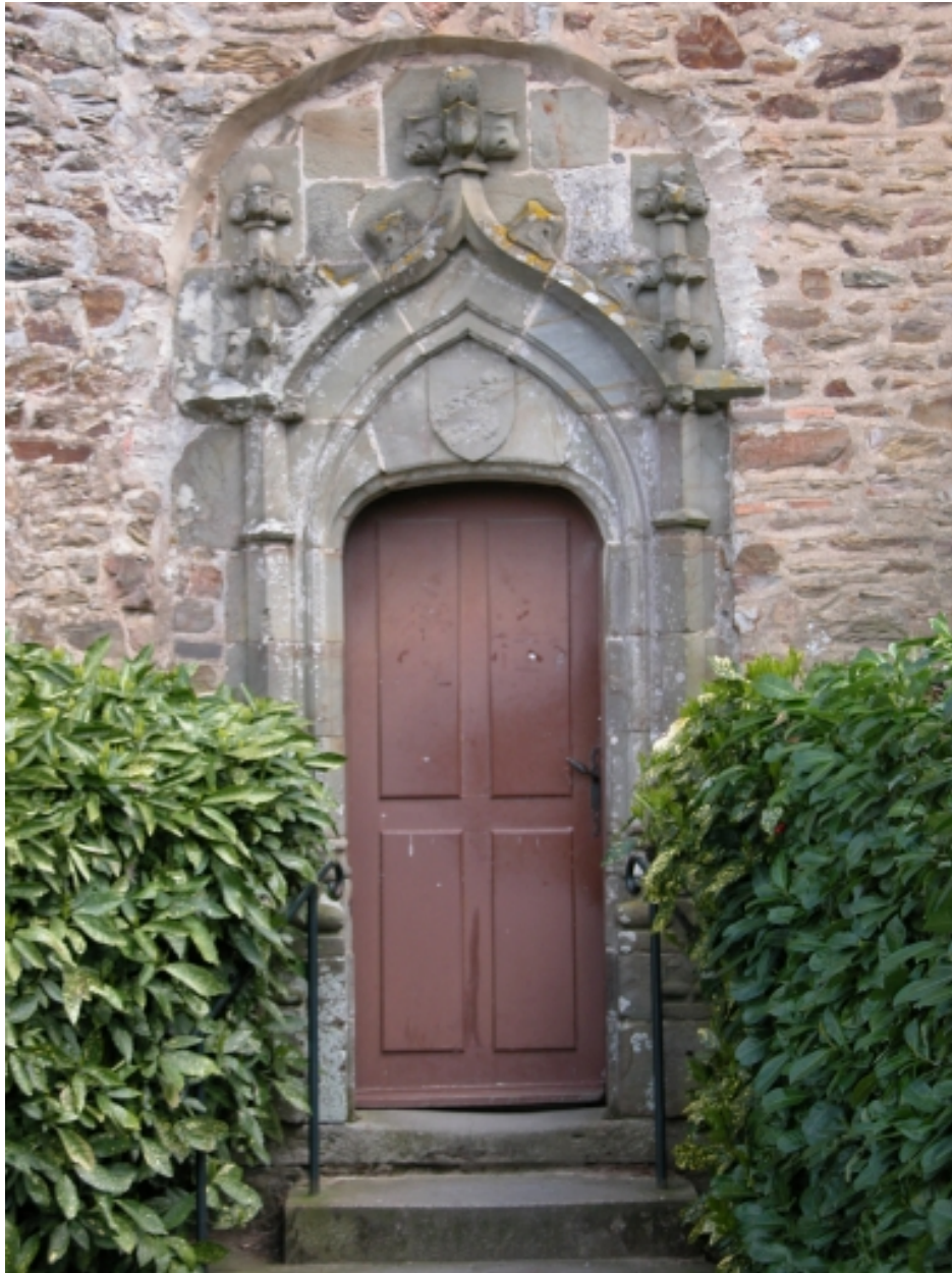
Détail : porte ; transept nord, mur ouest