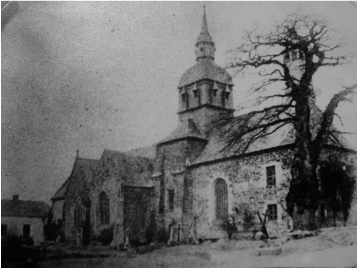
Vue de l'église prise du sud-est vers 1900.