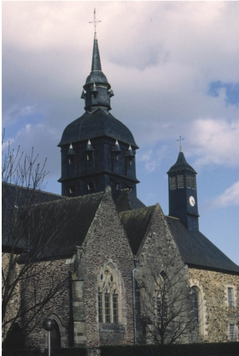
Vue partielle sud