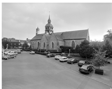
Vue générale prise du nord-ouest en 1994 IVR53_19943502172X