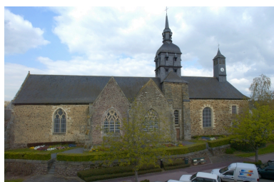
Vue générale sud IVR53_20043500512NUCA