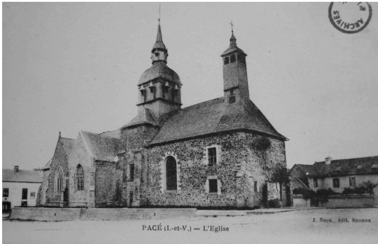
Carte postale : l'église vue du sud-est vers 1900