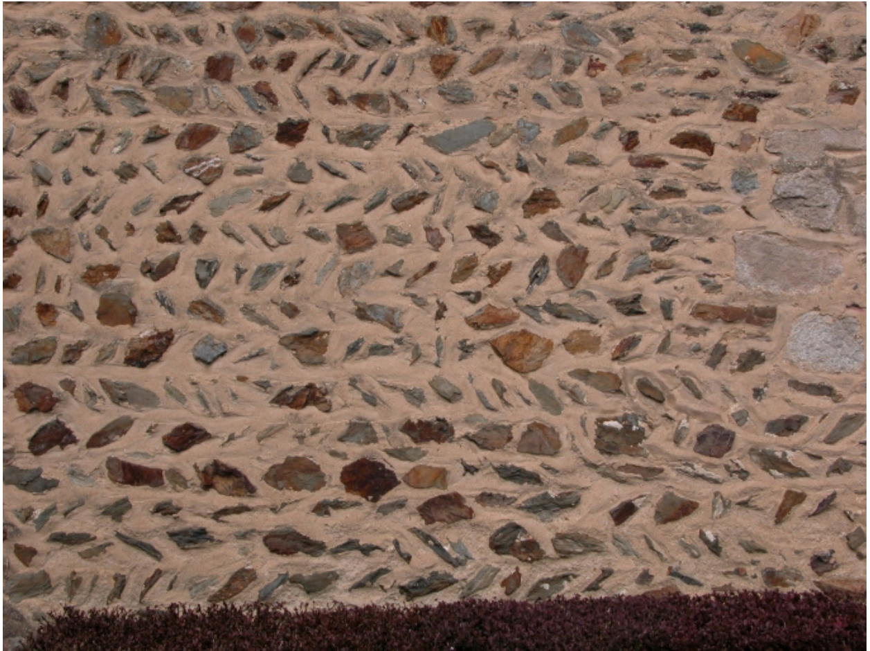
Détail : mur sud de la nef