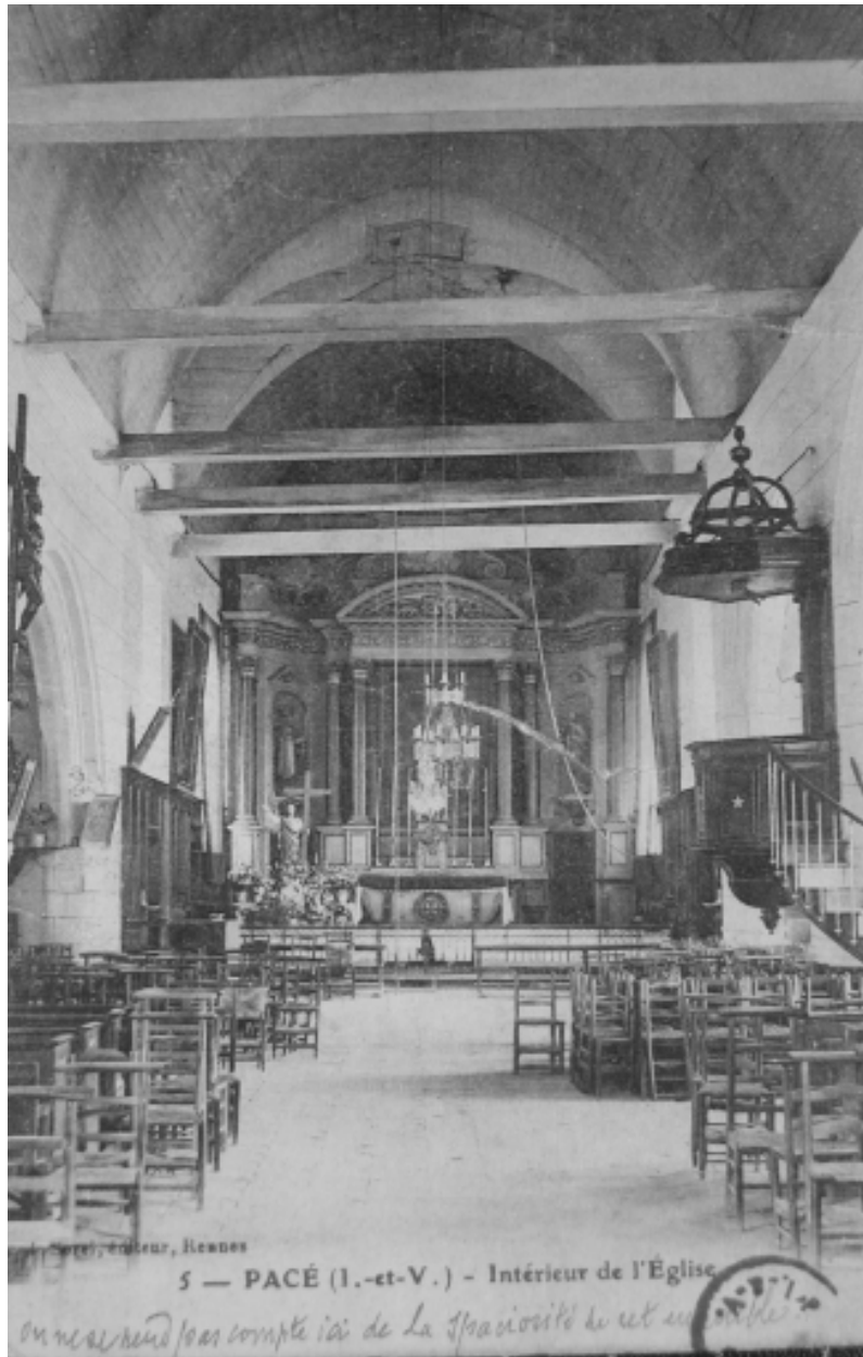
Carte postale ; vue intérieure vers 1900