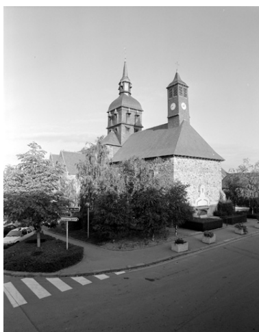
Le chœur pris du sud-est en 1994