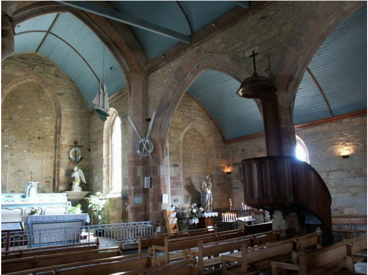
Vue intérieure prise de la nef vers le bas-côté sud