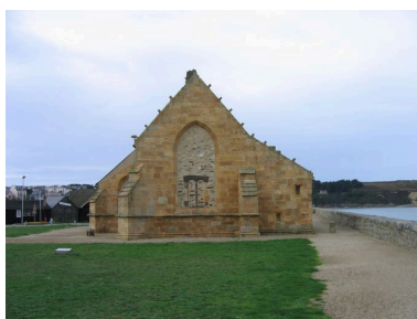
Chevet de la chapelle de Notre-Dame-de-Rocamadour IVR53_20062908451NUCA