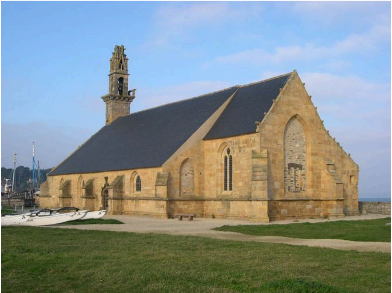
Elévations extérieures sud et est de la chapelle Notre-Dame-de-Rocamadour