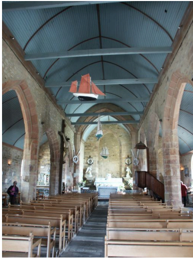
Vue intérieure vers le coeur avec les ex-voto