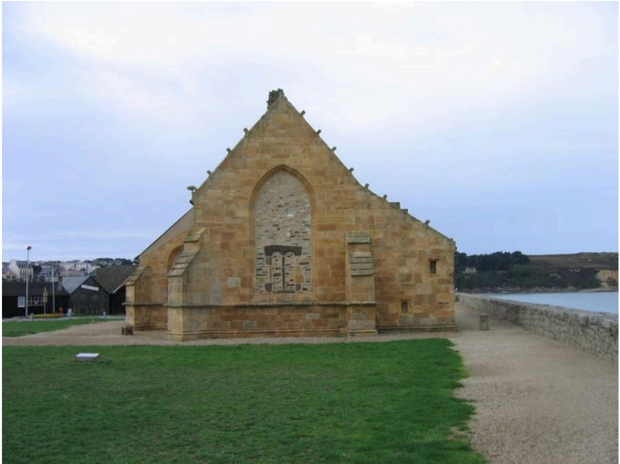
Chevet de la chapelle de Notre-Dame-de-Rocamadour