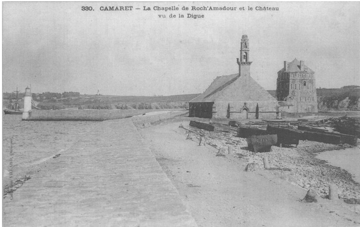
Carte postale : la chapelle de Roch'Amadour et le château vu de la digue