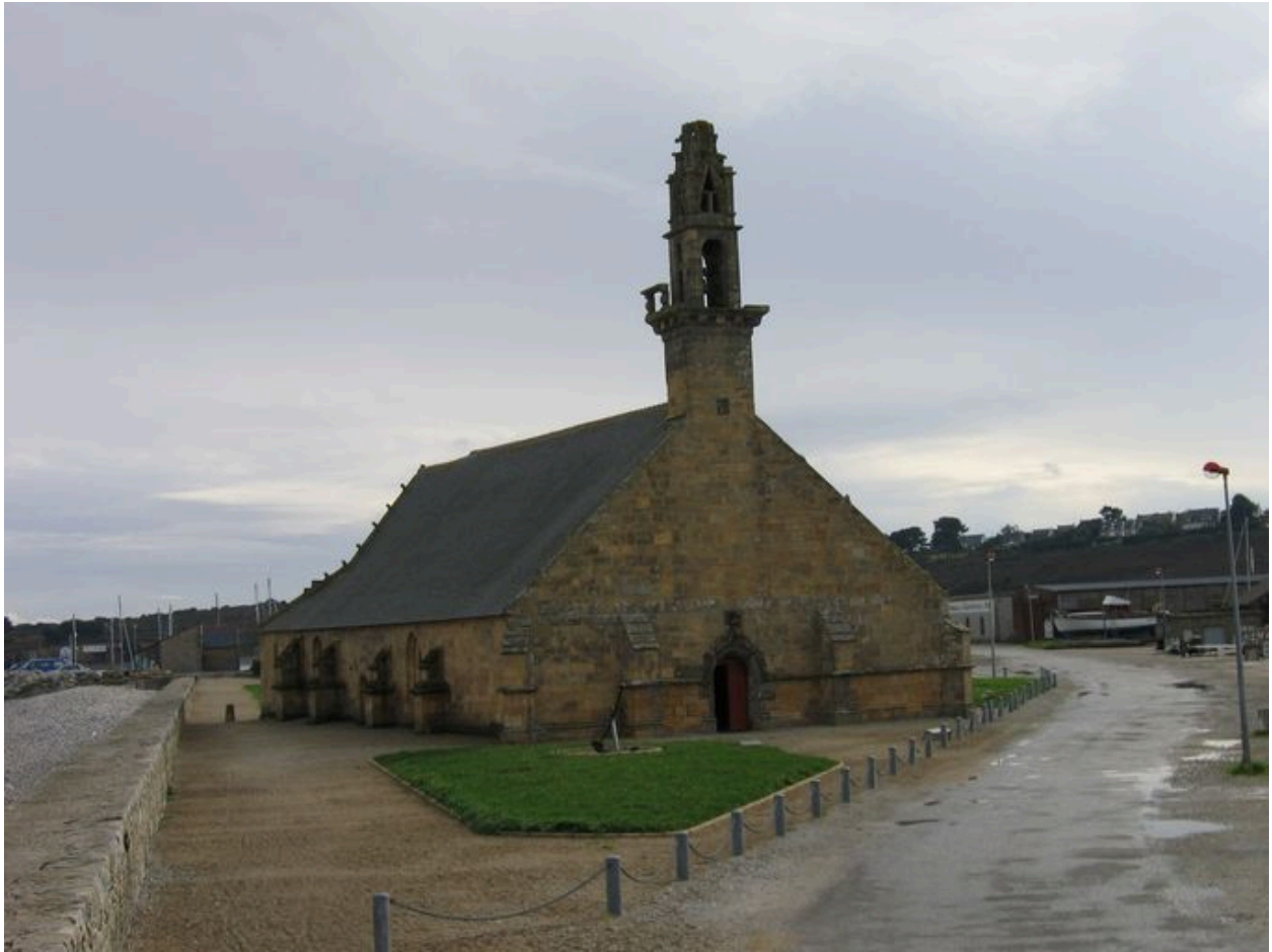
Elévations extérieures nord et ouest de la chapelle Notre-Dame-de-Rocamadour