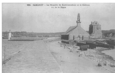
Carte postale : la chapelle de Roch'Amadour et le château vu de la digue IVR53_20082908275NUC