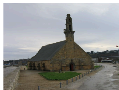
Elévations extérieures nord et ouest de la chapelle Notre-Dame-de-Rocamadour