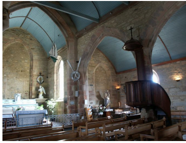
Vue intérieure prise de la nef vers le bas-côté sud