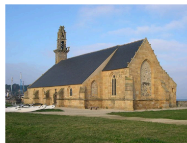
Elévations extérieures sud et est de la chapelle Notre-Dame-de-Rocamadour