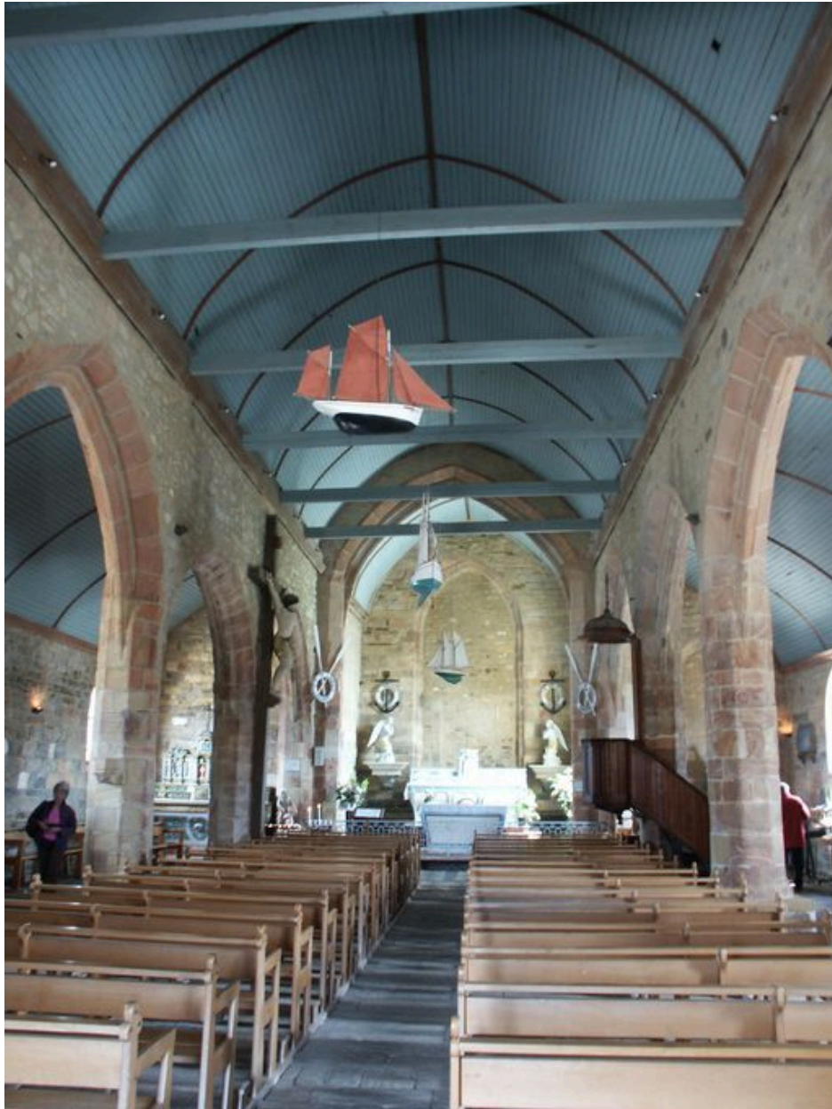
Vue intérieure vers le coeur avec les ex-voto