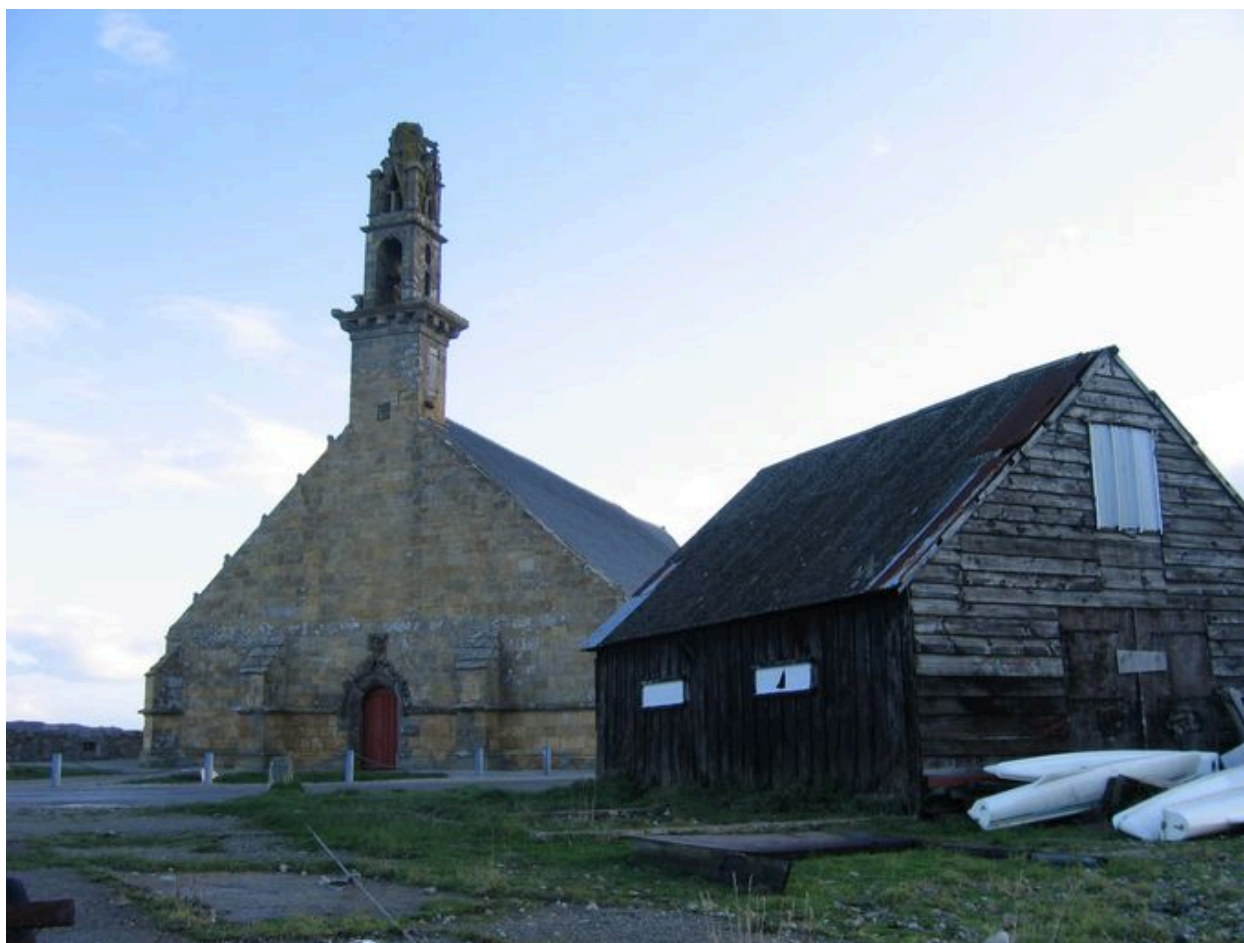
Vue générale de la chapelle Notre-Dame-de-Rocamadour