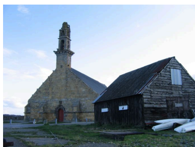
Vue générale de la chapelle Notre-Dame-de-Rocamadour IVR53_20062908377NUCA