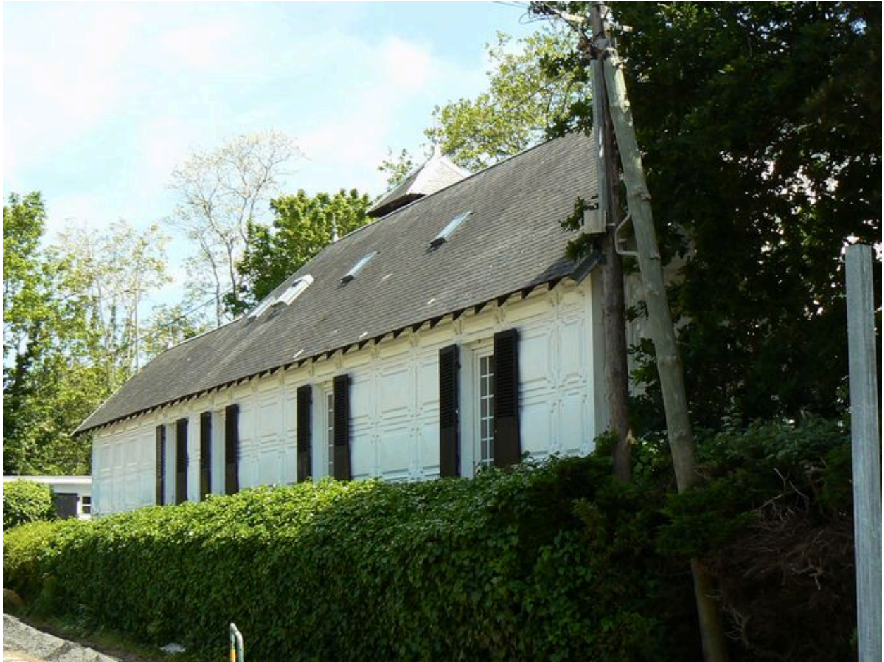
Vue latérale de la villa Ker Ar Bruck