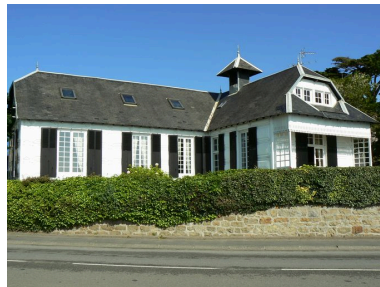
Vue générale de la villa Ker Ar Bruck