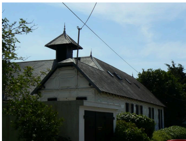
Vue latérale de la villa Ker Ar Bruck IVR53_20072908709NUCA