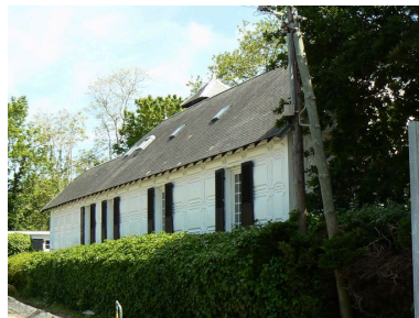
Vue latérale de la villa Ker Ar Bruck IVR53_20072908708NUCA