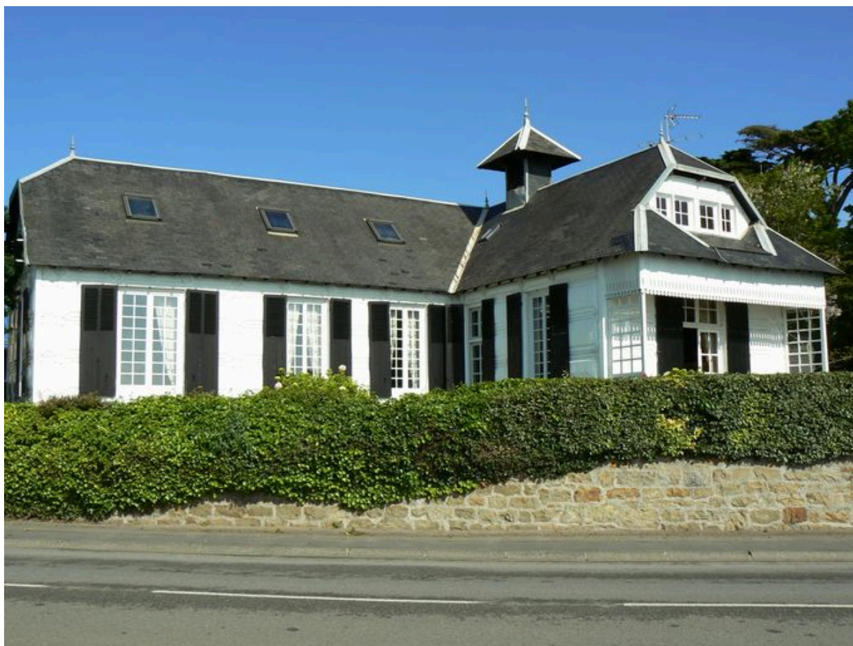
Vue générale de la villa Ker Ar Bruck