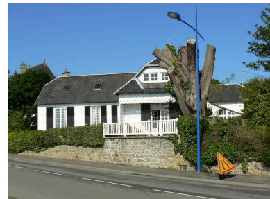
Villa Ker Ar Bruck IVR53_20072908710NUCA