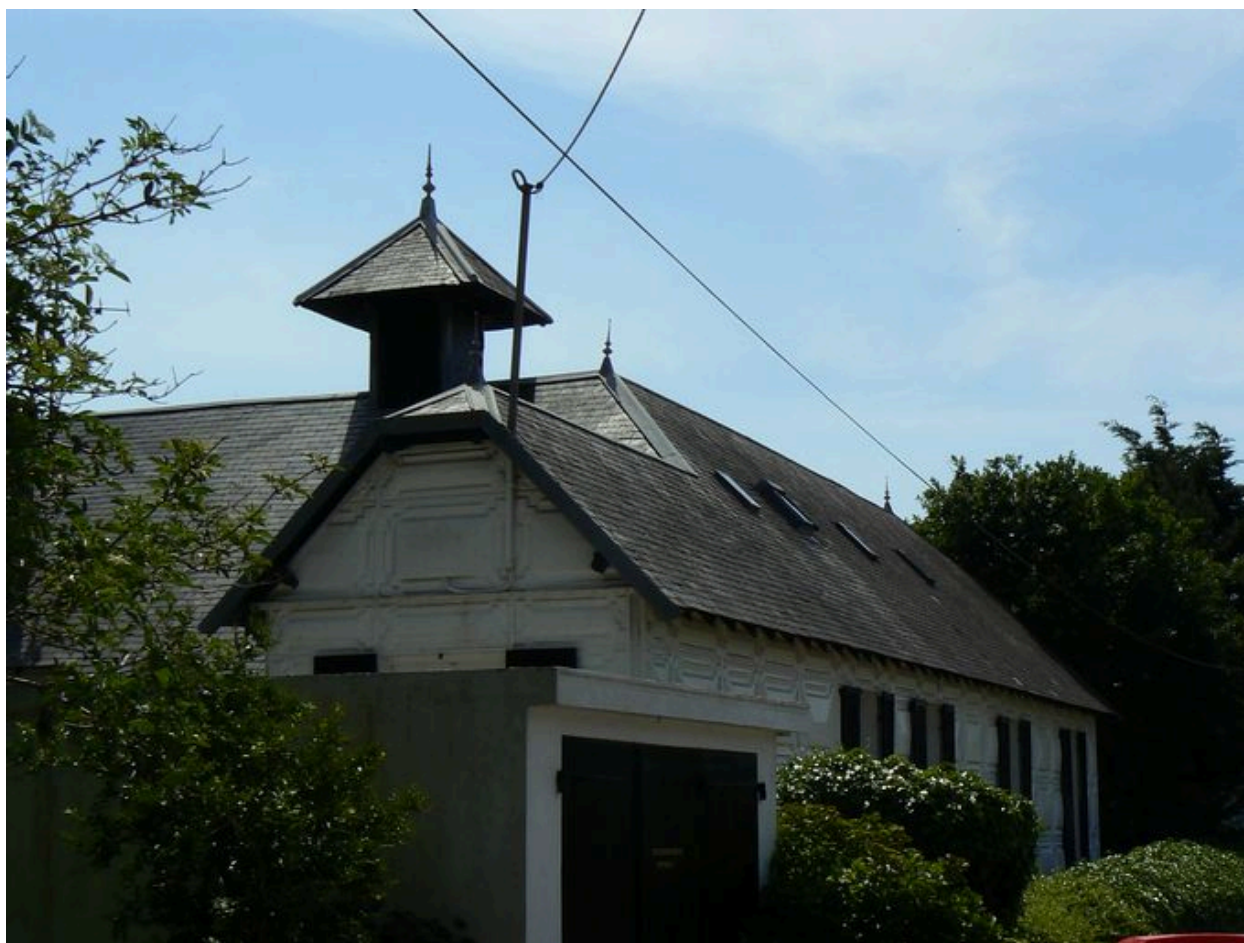
Vue latérale de la villa Ker Ar Bruck