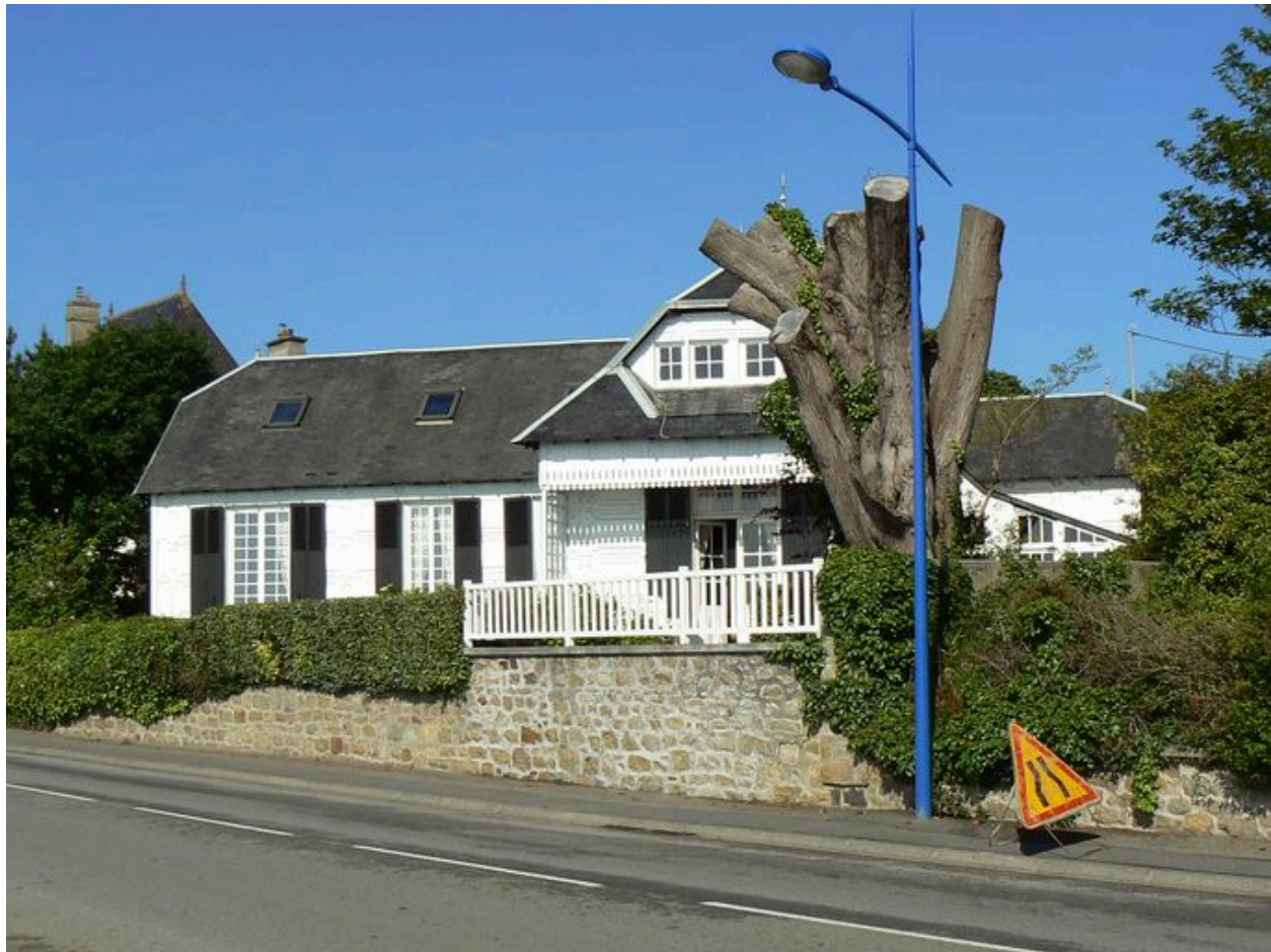
Villa Ker Ar Bruck