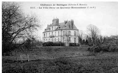
Vue générale IVR53_20042208976NUCB