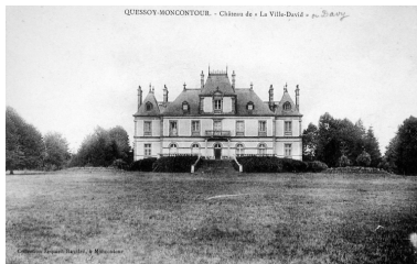
Elévation postérieure