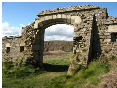
Porte nord de l'enceinte du fort de la Fraternité