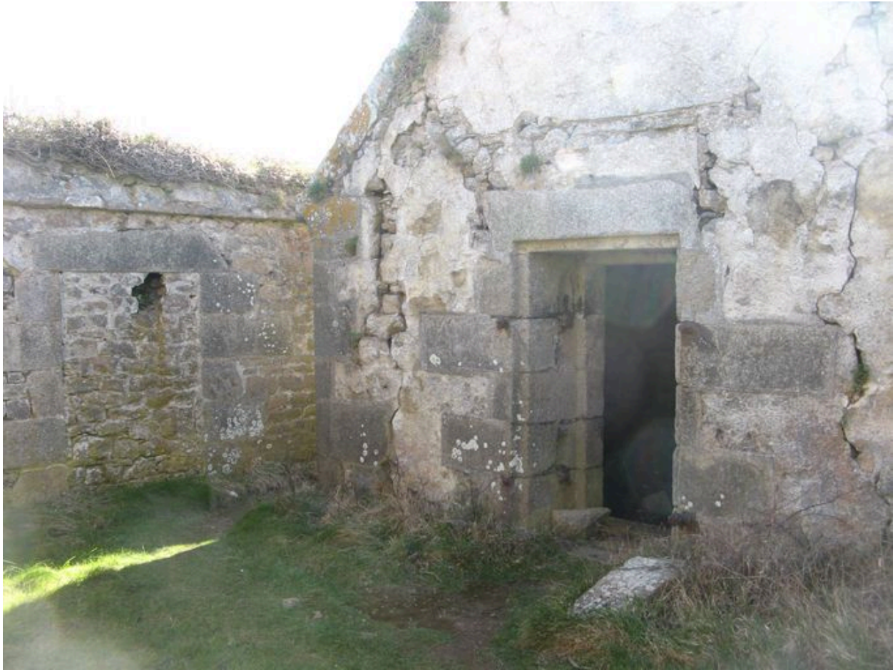
Magasin à poudre du fort de la Fraternité