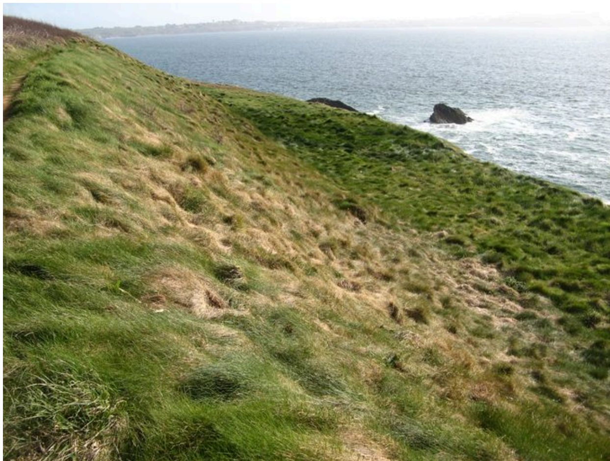
Ancienne batterie du fort de la Fraternité