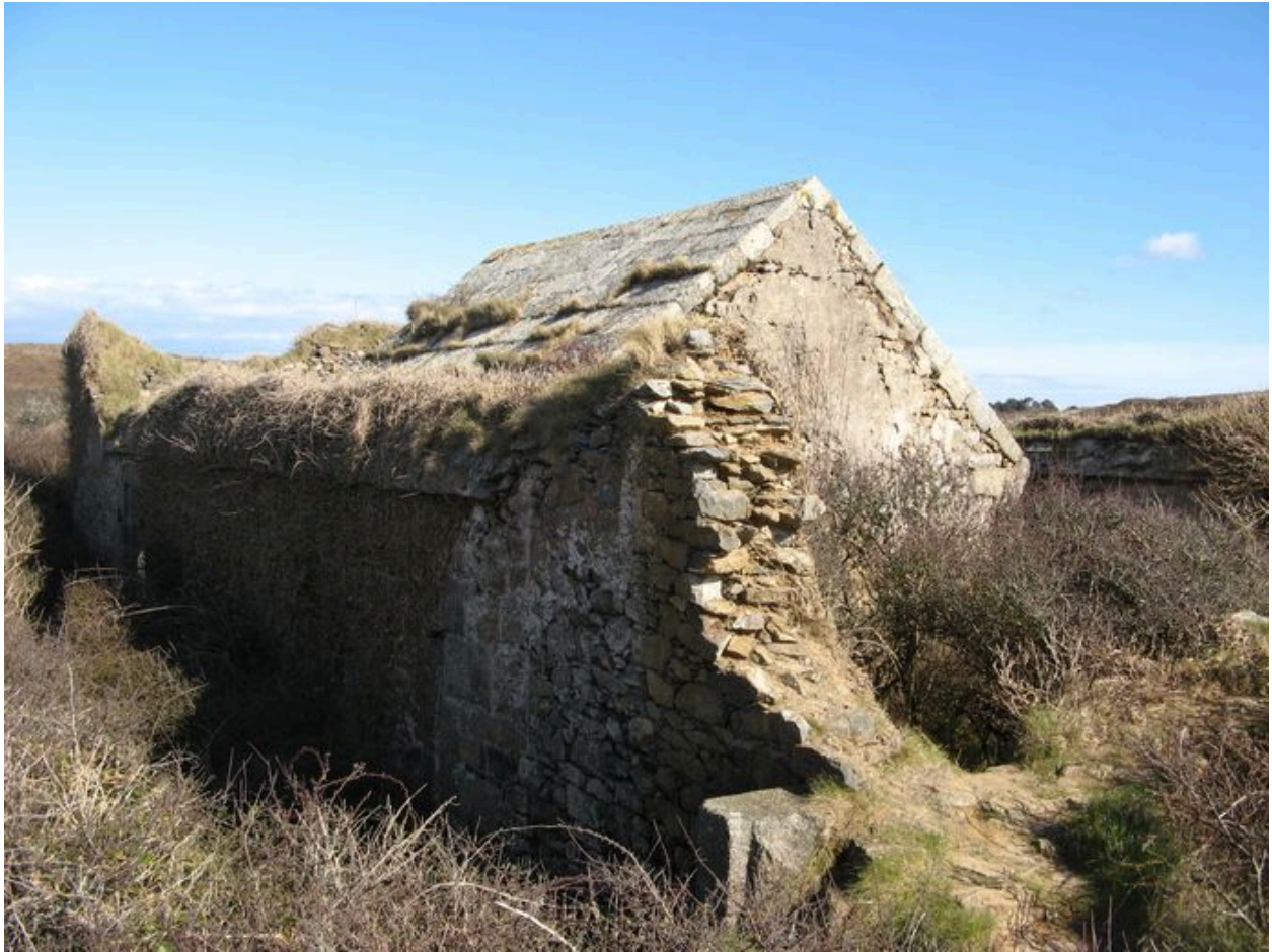
Magasin à poudre du fort de la Fraternité