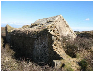
Magasin à poudre du fort de la Fraternité IVR53_20082908465NUCA

IVR53_20082908461NUCA