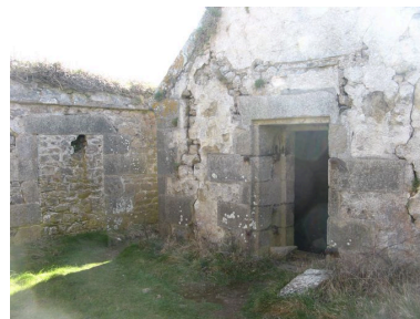
Magasin à poudre du fort de la Fraternité IVR53_20082908464NUCA