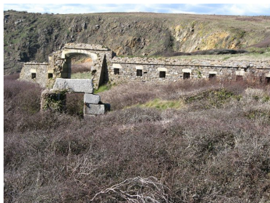
Vue générale du fort de la Fraternité et de son enceinte