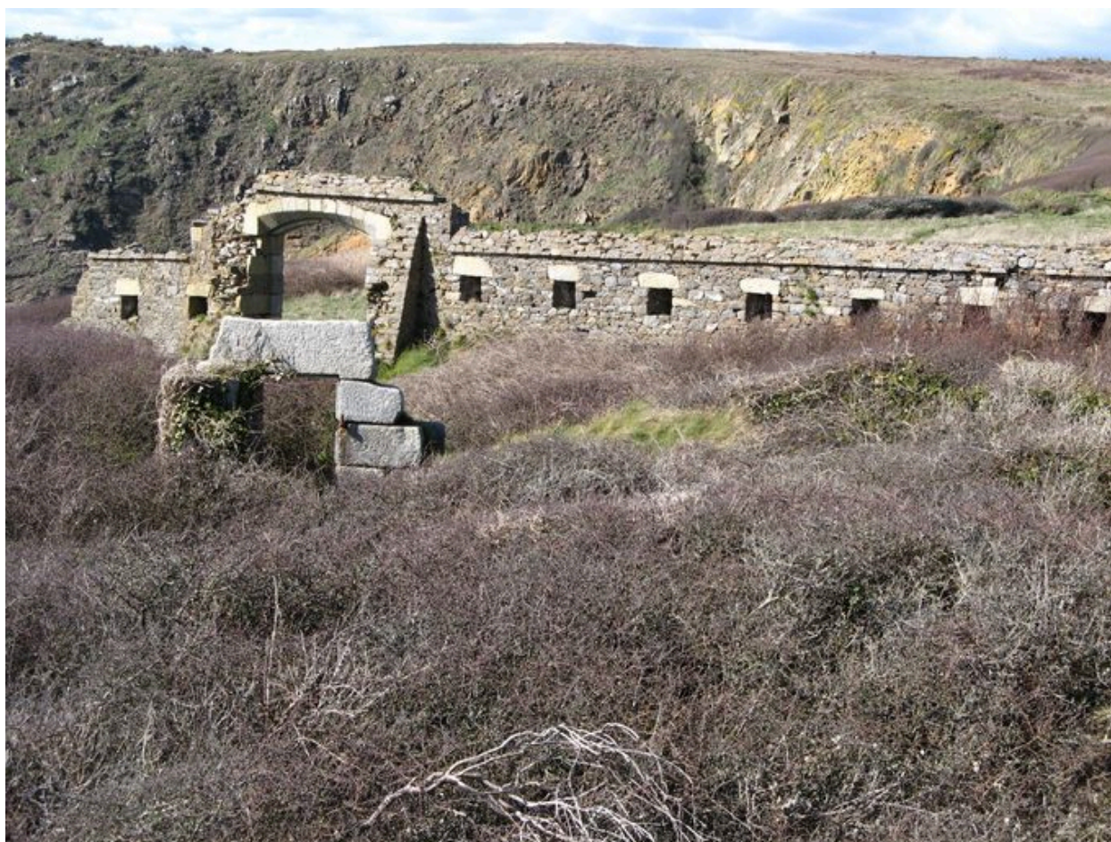
Vue générale du fort de la Fraternité et de son enceinte