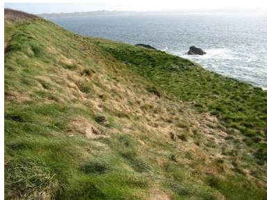
Ancienne batterie du fort de la Fraternité IVR53_20082908482NUCA