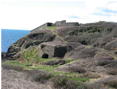
Vue du site de la Fraternité (avec four à chaux et fort à l'arrière-plan) IVR53_20082908466NUCA