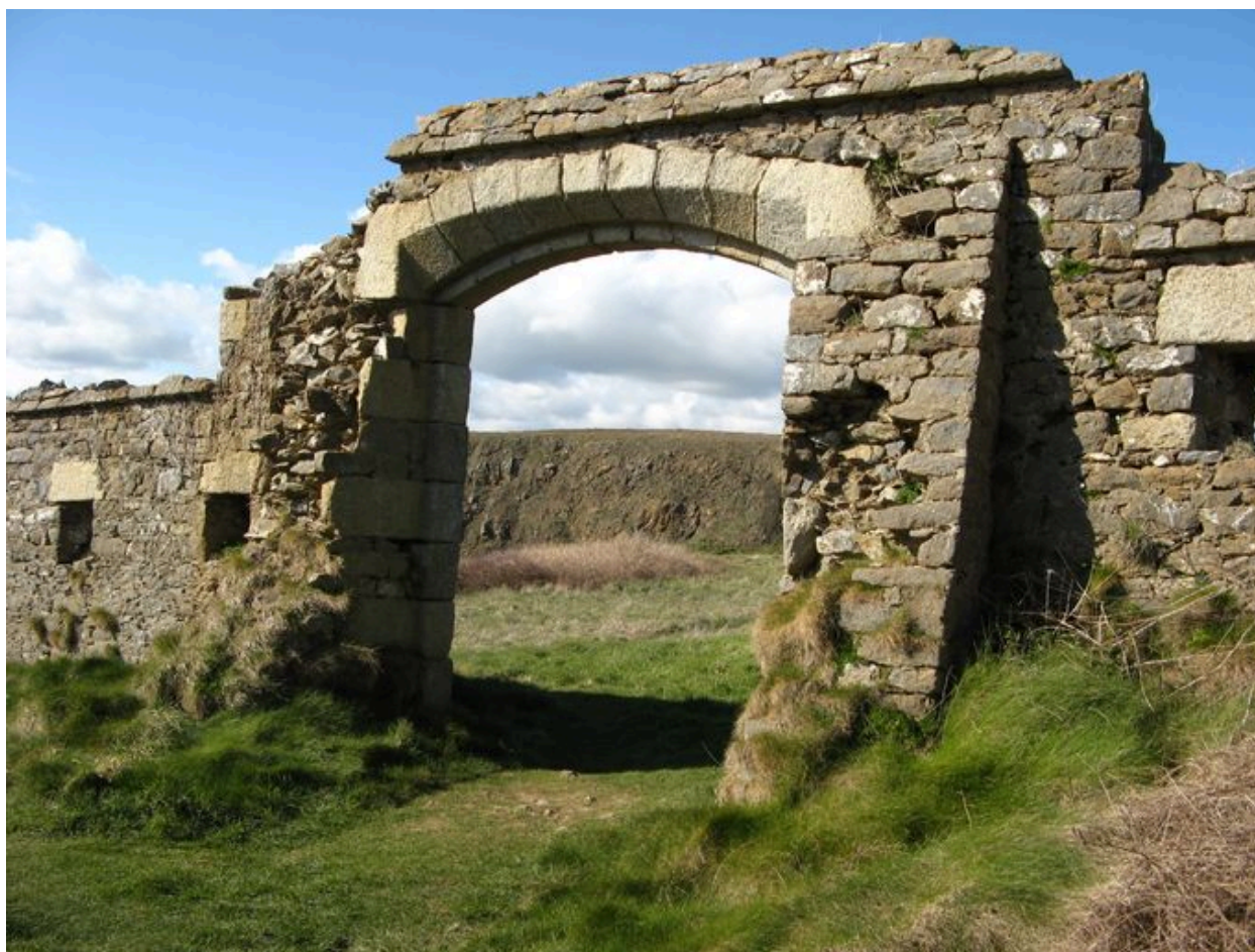
Porte nord de l'enceinte du fort de la Fraternité