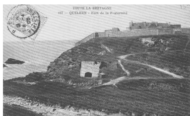
Carte postale : Fort de la Fraternité