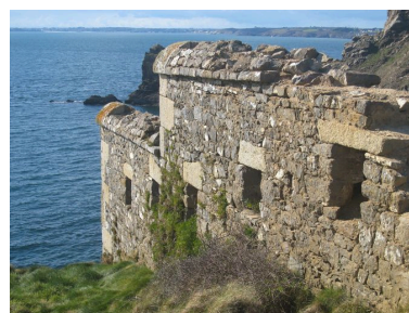
Enceinte du fort de la Fraternité