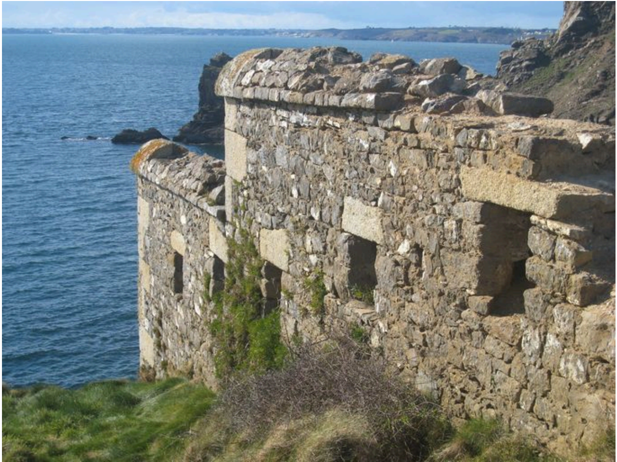
Enceinte du fort de la Fraternité