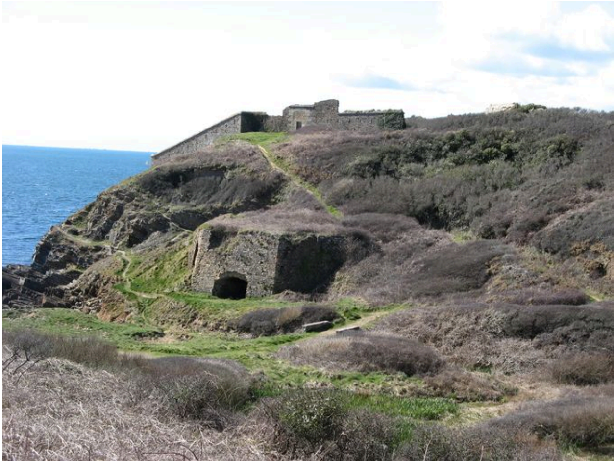
Vue du site de la Fraternité (avec four à chaux et fort à l'arrière-plan)