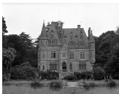
Vue générale sud IVR53_19815600755X