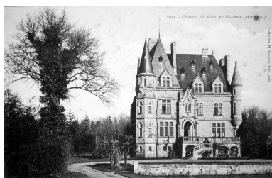
Vue générale IVR53_20045606293NUCB