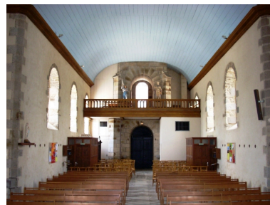
Saint-Méen, église paroissiale : vue axiale ouest IVR53_20082906281NUCA