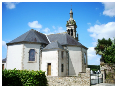
Saint-Méen, église paroissiale : vue générale nord-est