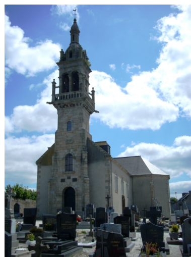
Saint-Méen, église paroissiale : vue générale sud-ouest