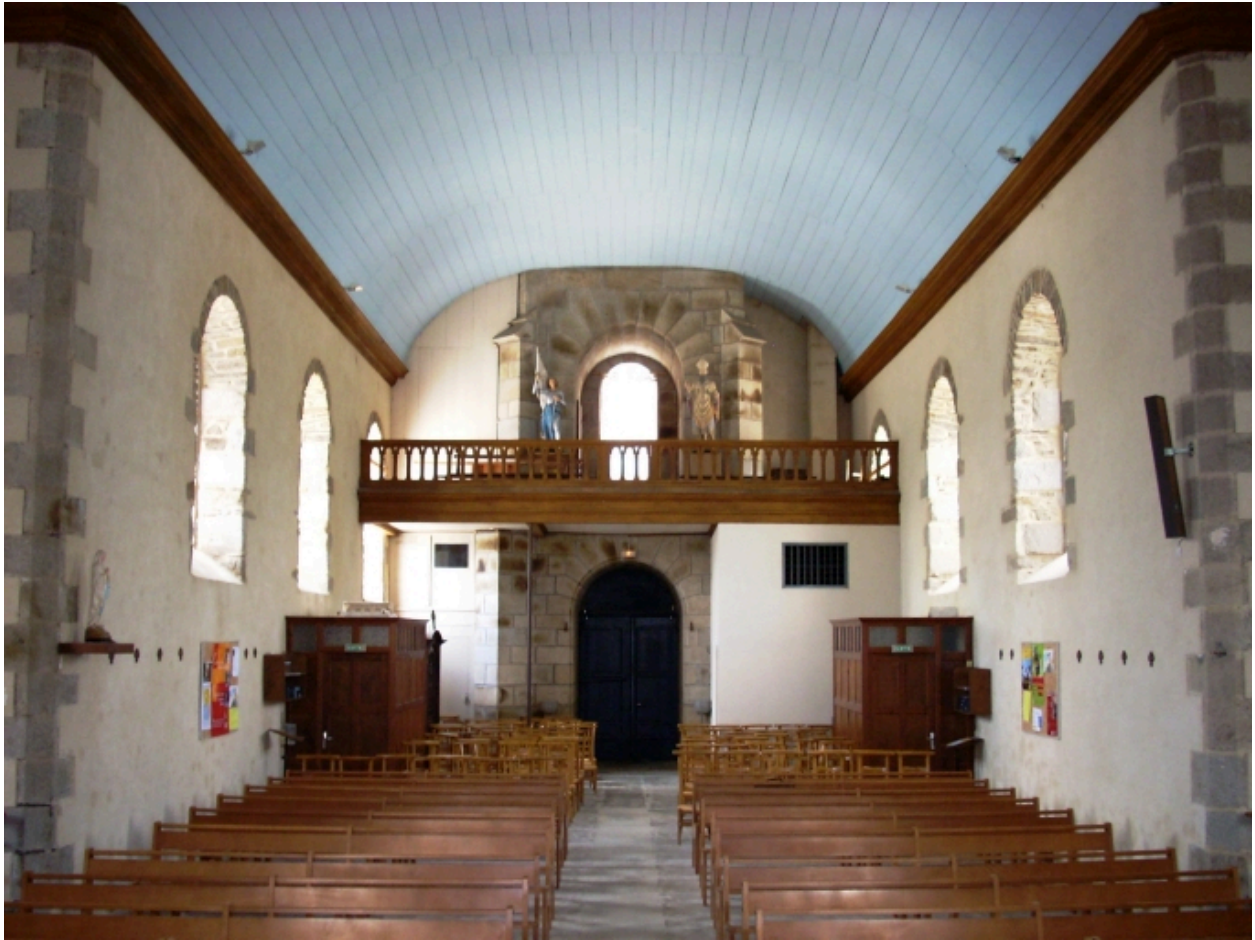
Saint-Méen, église paroissiale : vue axiale ouest