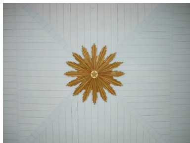
Saint-Méen, église paroissiale : détail du lambris de couverture à la croisée du transept. IVR53_20082906282NUCA