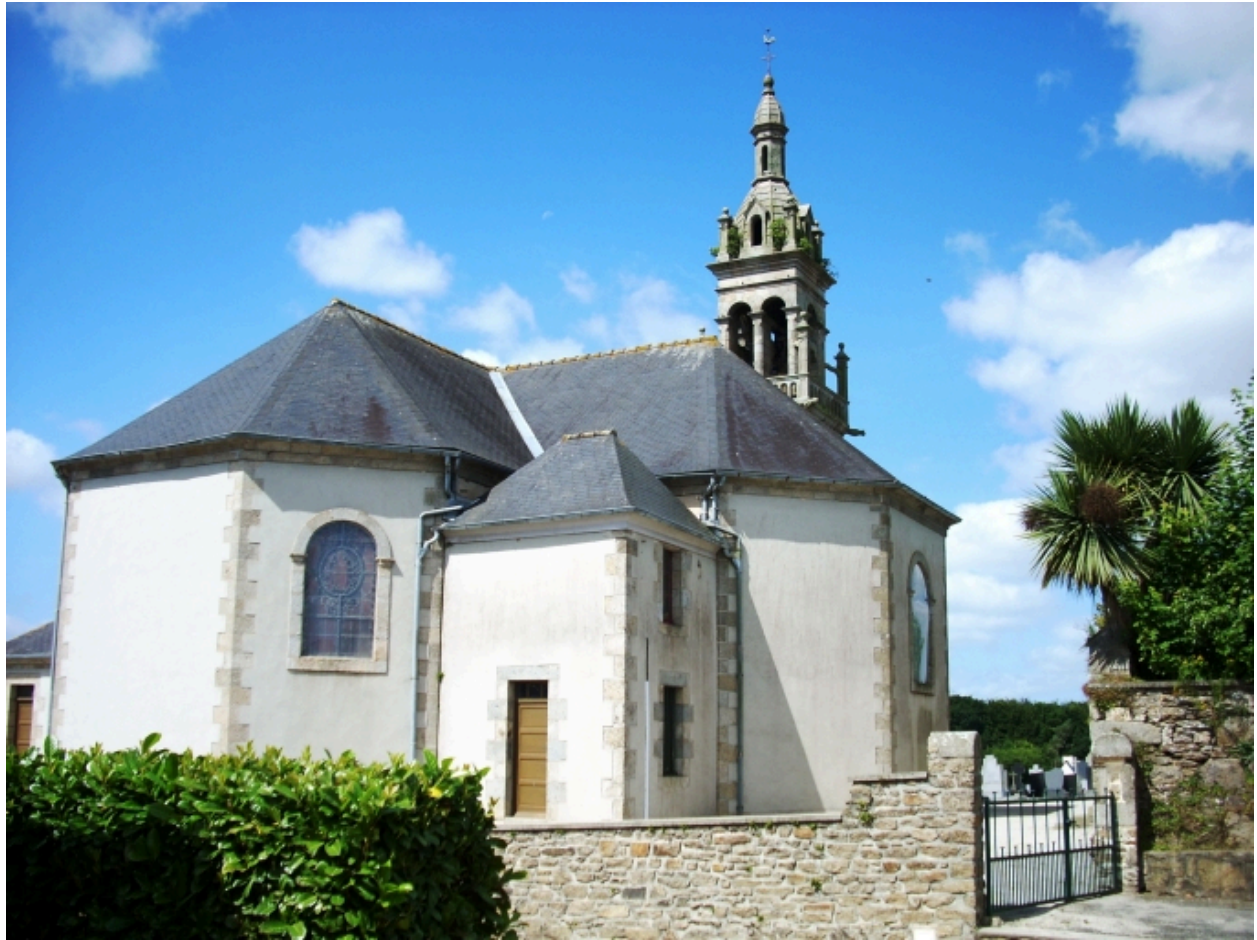
Saint-Méen, église paroissiale : vue générale nord-est