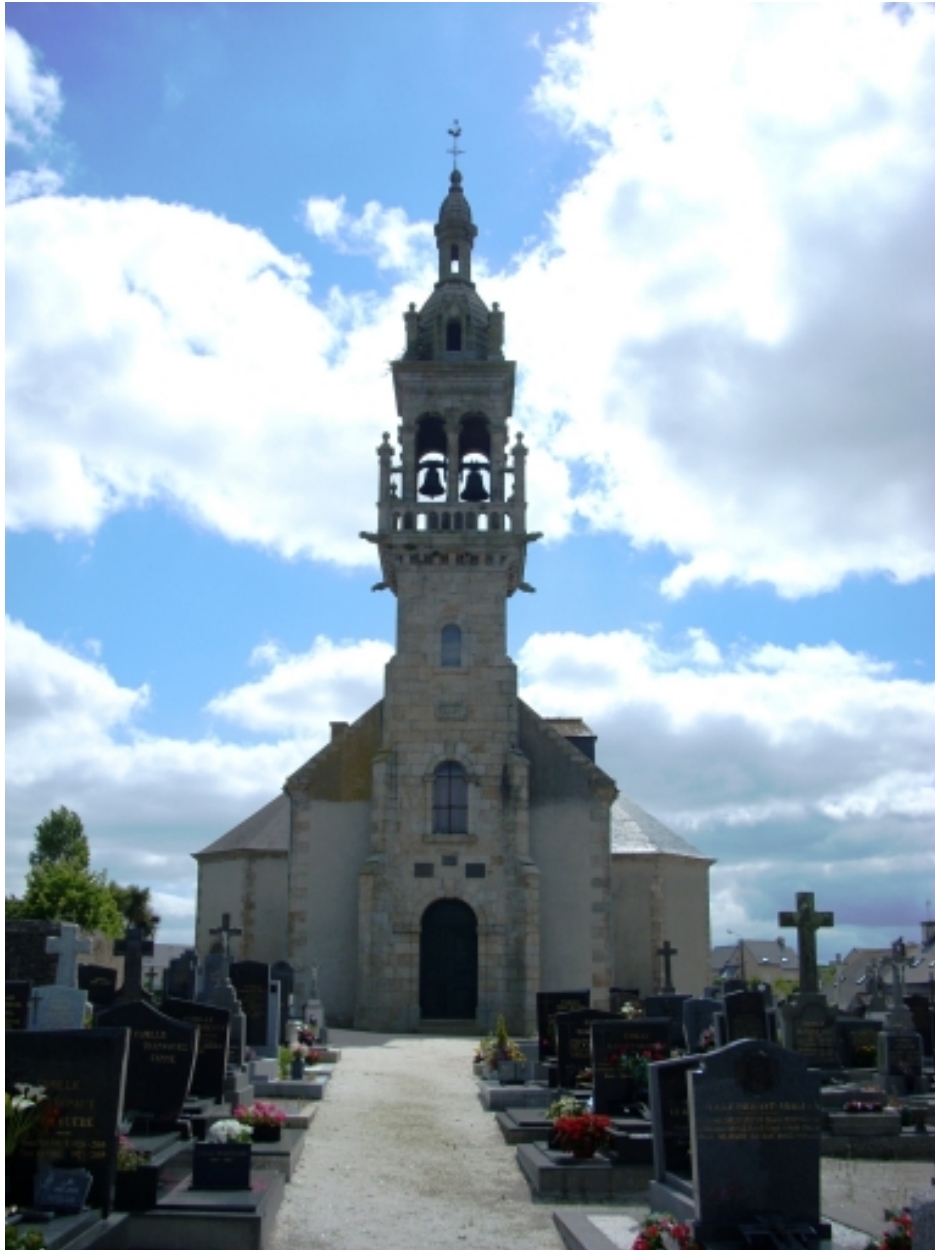
Saint-Méen, église paroissiale : vue générale ouest