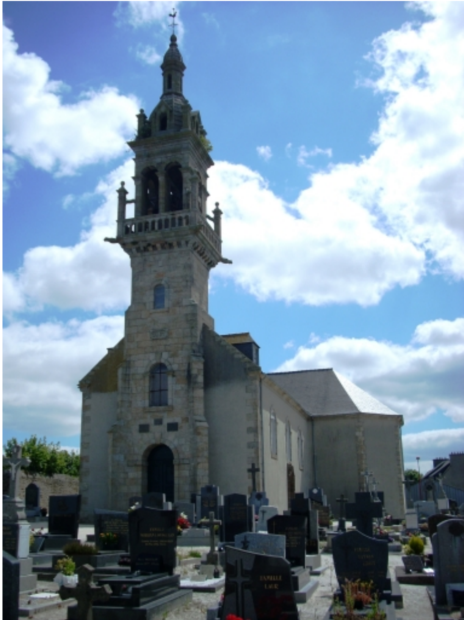
Saint-Méen, église paroissiale : vue générale sud-ouest