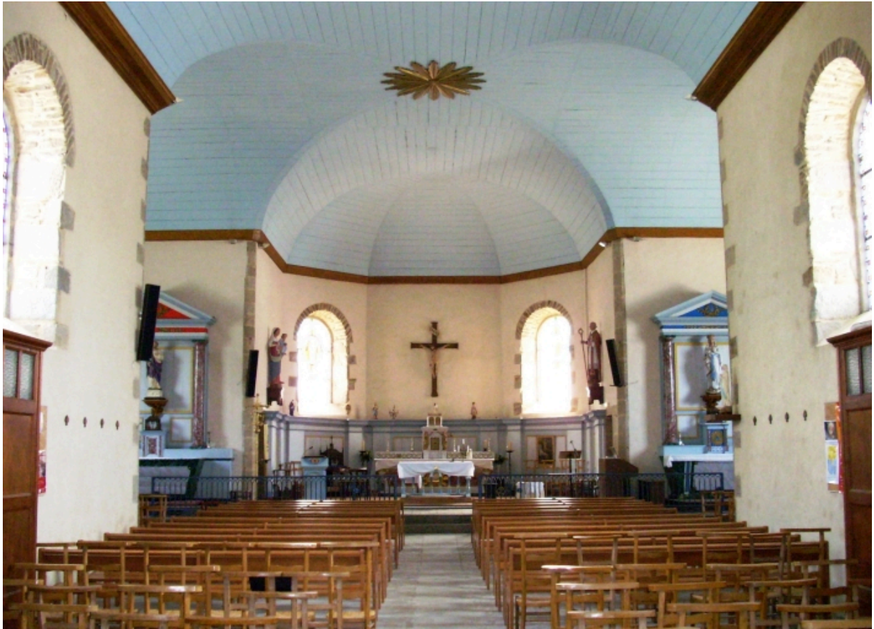
Saint-Méen, église paroissiale : vue axiale est