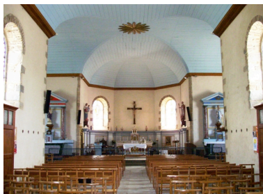
Saint-Méen, église paroissiale : vue axiale est IVR53_20082906280NUCA