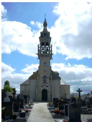
Saint-Méen, église paroissiale : vue générale ouest IVR53_20082906276NUCA