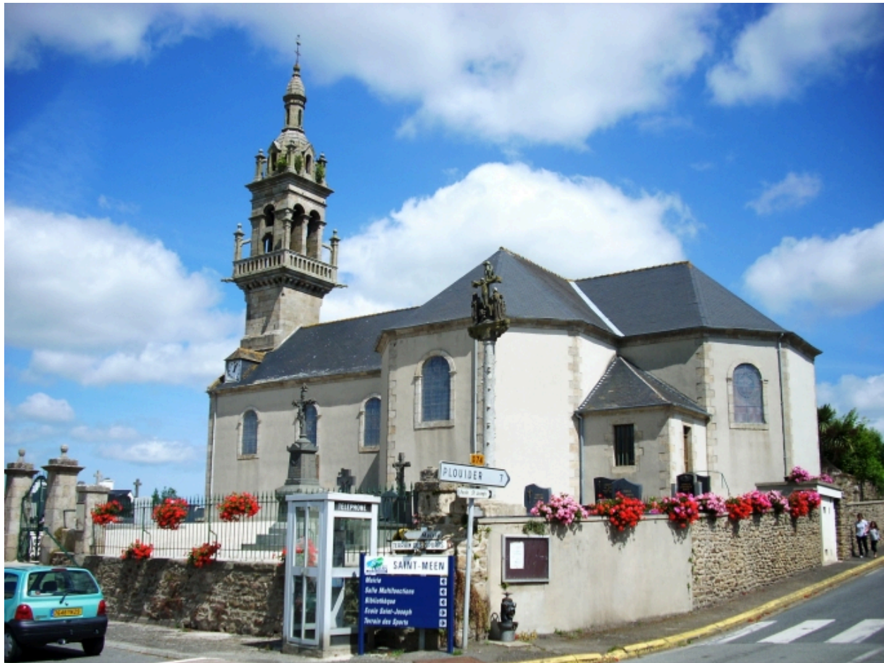
Saint-Méen, église paroissiale : vue générale sud-est