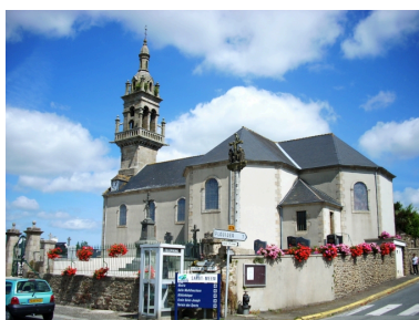
Saint-Méen, église paroissiale : vue générale sud-est