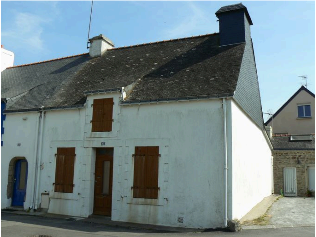
Vue générale de la maison de pêcheur du 45 rue de Moustérian