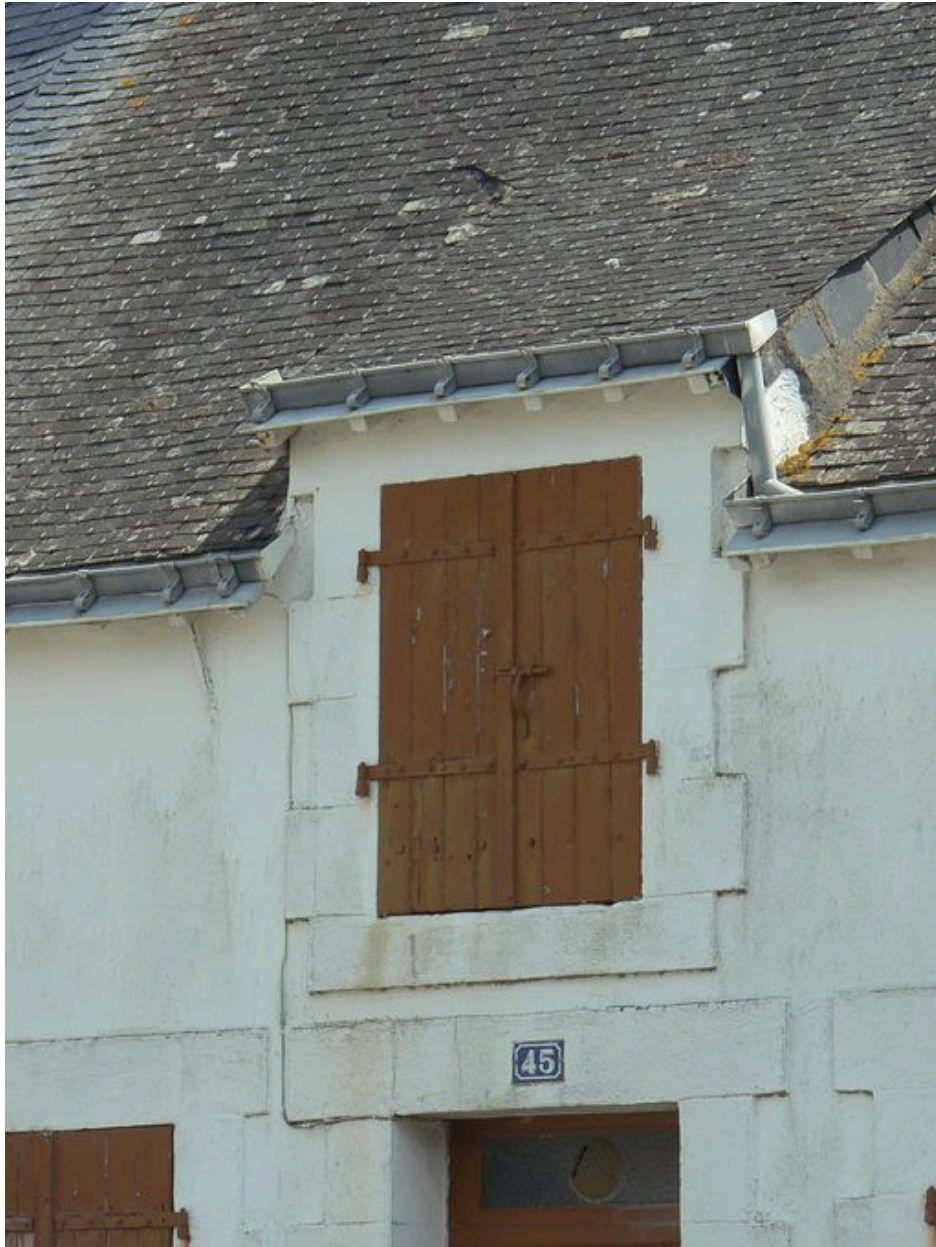
Détail de la maison de pêcheur du 45 rue de Moustérian