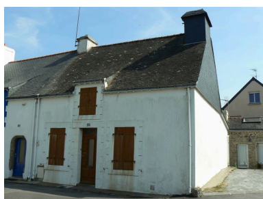
Vue générale de la maison de pêcheur du 45 rue de Moustérian IVR53_20075605720NUCA