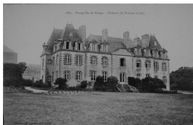
Vue de la façade principale IVR53_20035604289NUCB