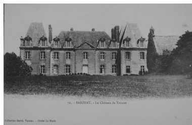
Vue de la façade postérieure