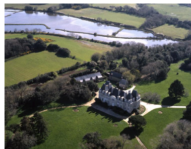
Vue aérienne nord-ouest, IVR53_19945600417XA