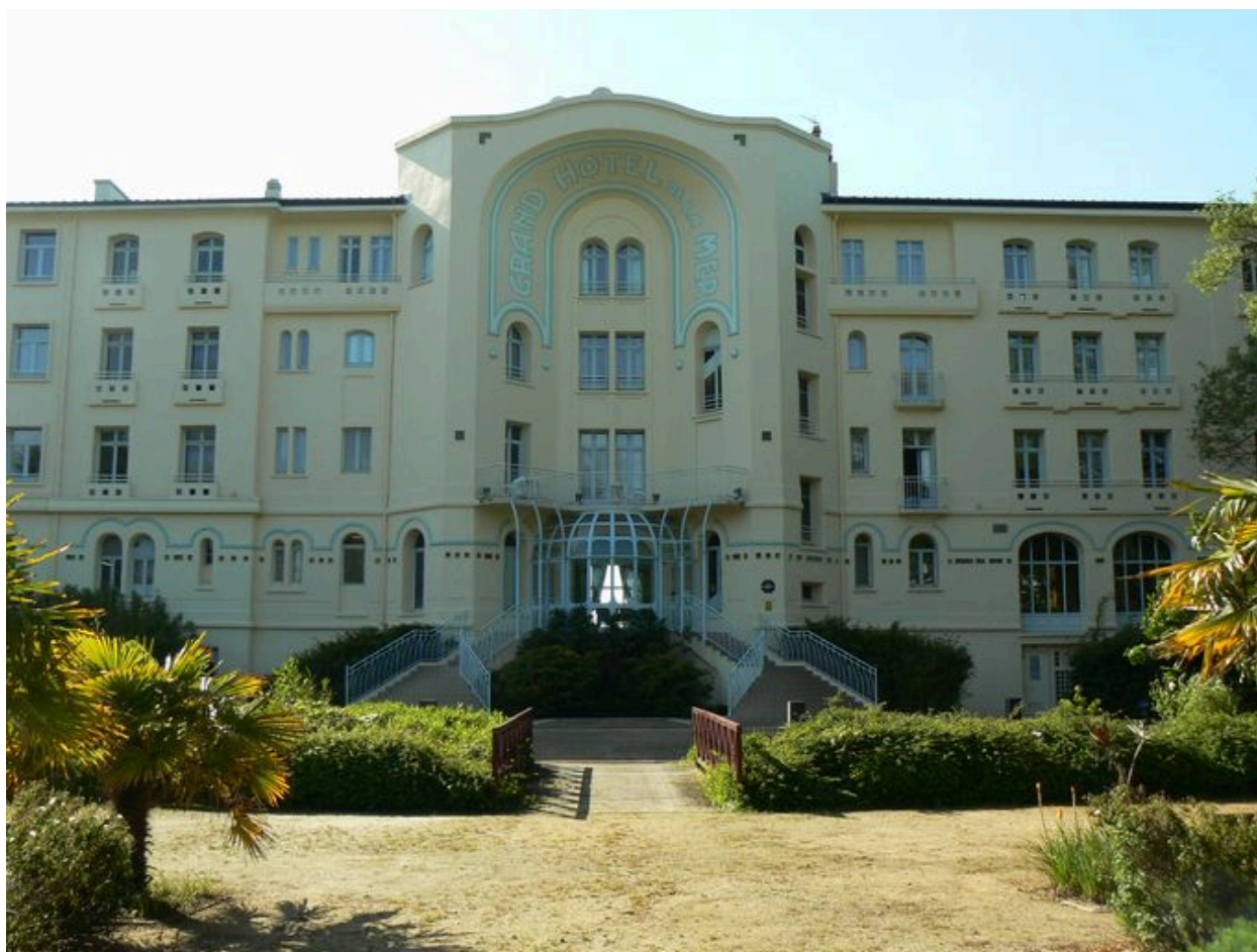
Grand Hôtel de la Mer de Morgat, côté arrivée