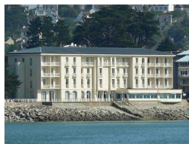
Vue générale du Grand Hôtel de la Mer de Morgat, côté plage