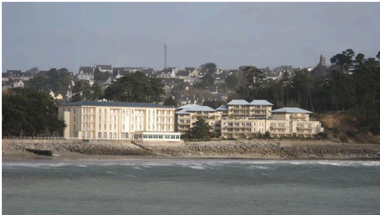
Vue générale du Grand Hôtel de la Mer, côté plage