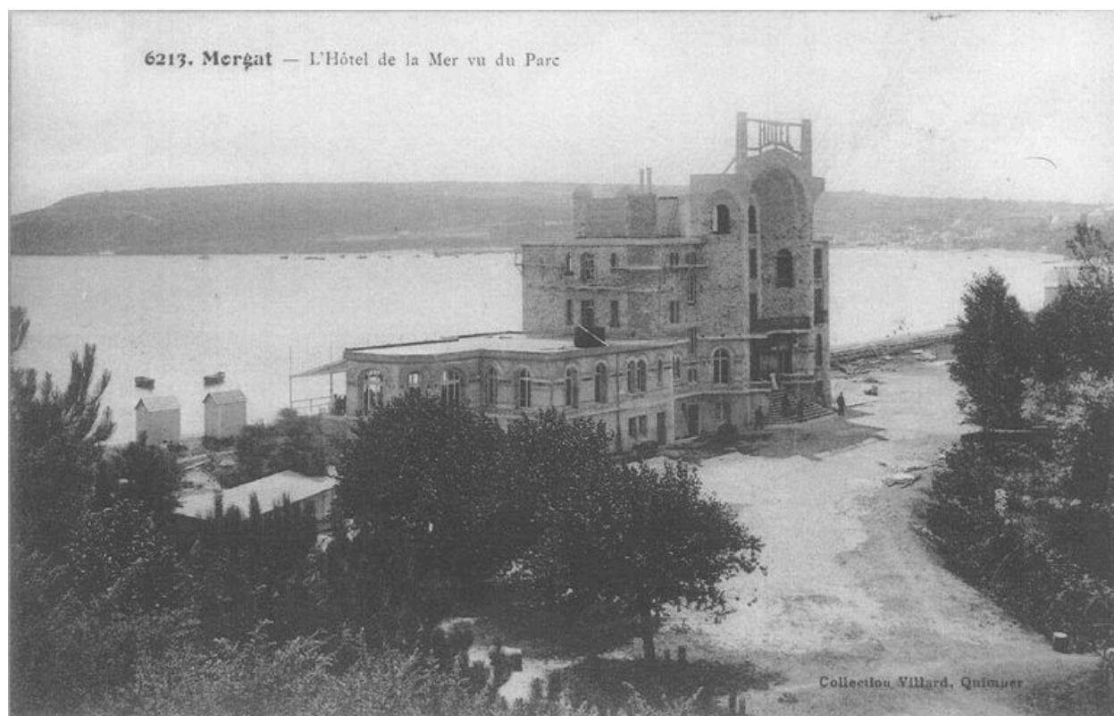
Carte postale : l'Hôtel de la Mer vu du Parc