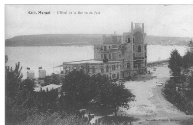
Carte postale : l'Hôtel de la Mer vu du Parc IVR53_20082908343NUCB