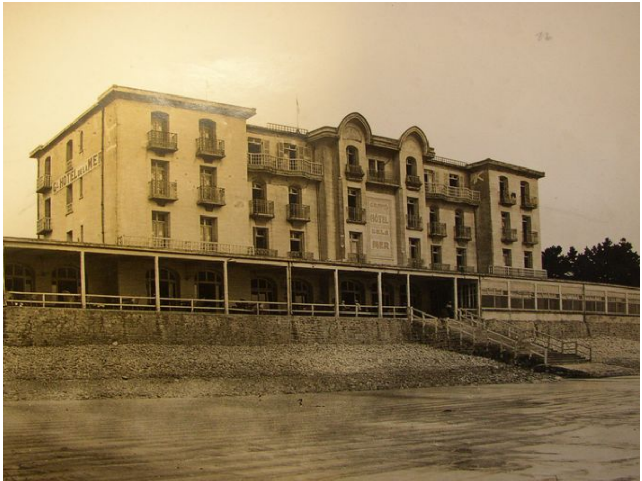
Vue ancienne du Grand Hôtel de la Mer, côté plage