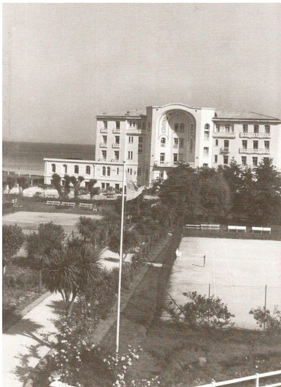
Vue générale ancienne du Grand Hôtel de la Mer, à l'arrière côté terre