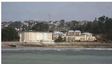
Vue générale du Grand Hôtel de la Mer, côté plage IVR53_20072908737NUCA