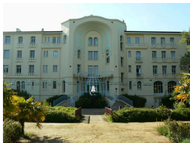
Grand Hôtel de la Mer de Morgat, côté arrivée