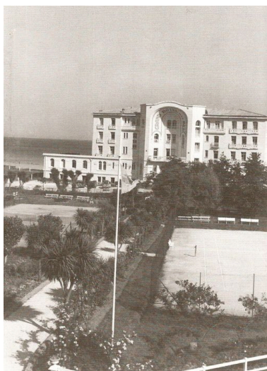
Vue générale ancienne du Grand Hôtel de la Mer, à l'arrière côté terre IVR53_20072908738NUC