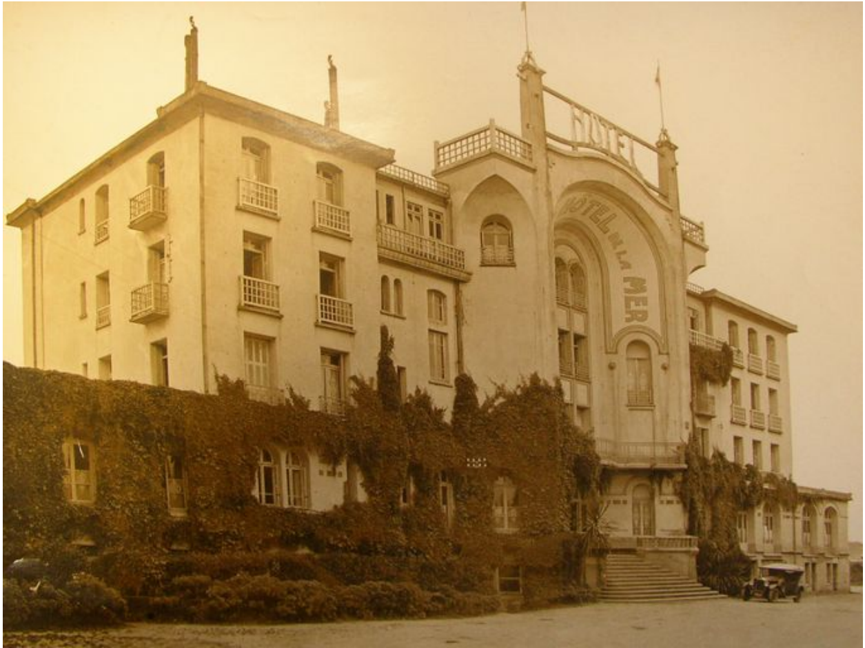
Vue ancienne du Grand Hôtel de la Mer, à l'arrière côté terre