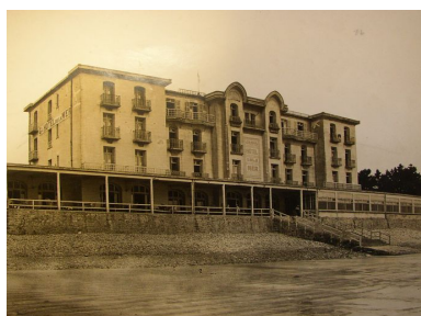
Vue ancienne du Grand Hôtel de la Mer, côté plage