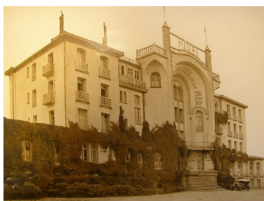
Vue ancienne du Grand Hôtel de la Mer, à l'arrière côté terre