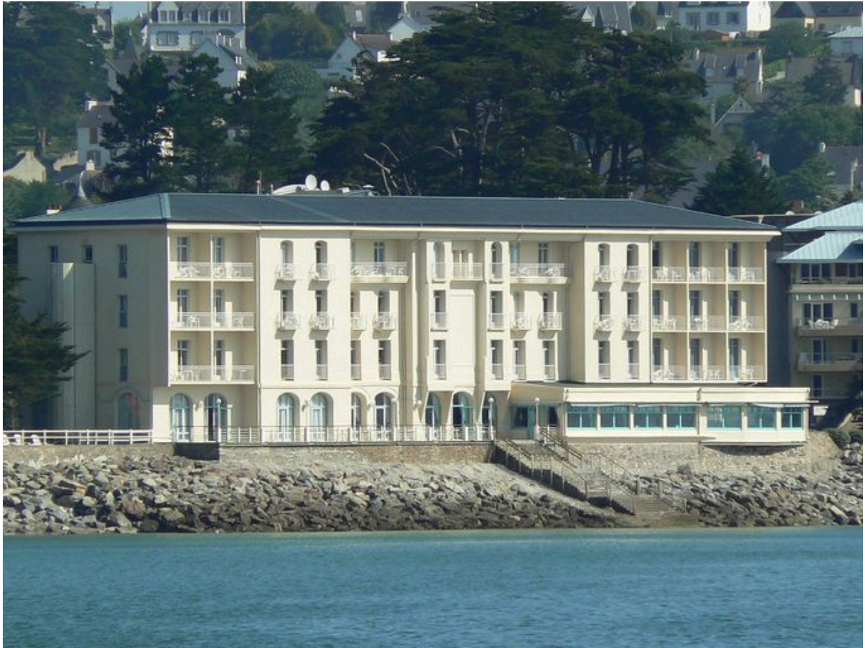
Vue générale du Grand Hôtel de la Mer de Morgat, côté plage