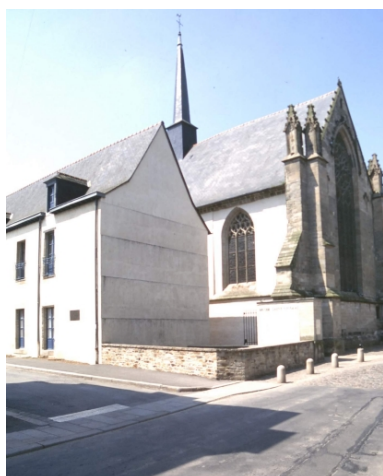
Pignons sud est : vue générale.