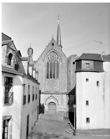
Elévation Sud : vue générale IVR53_19953500221X