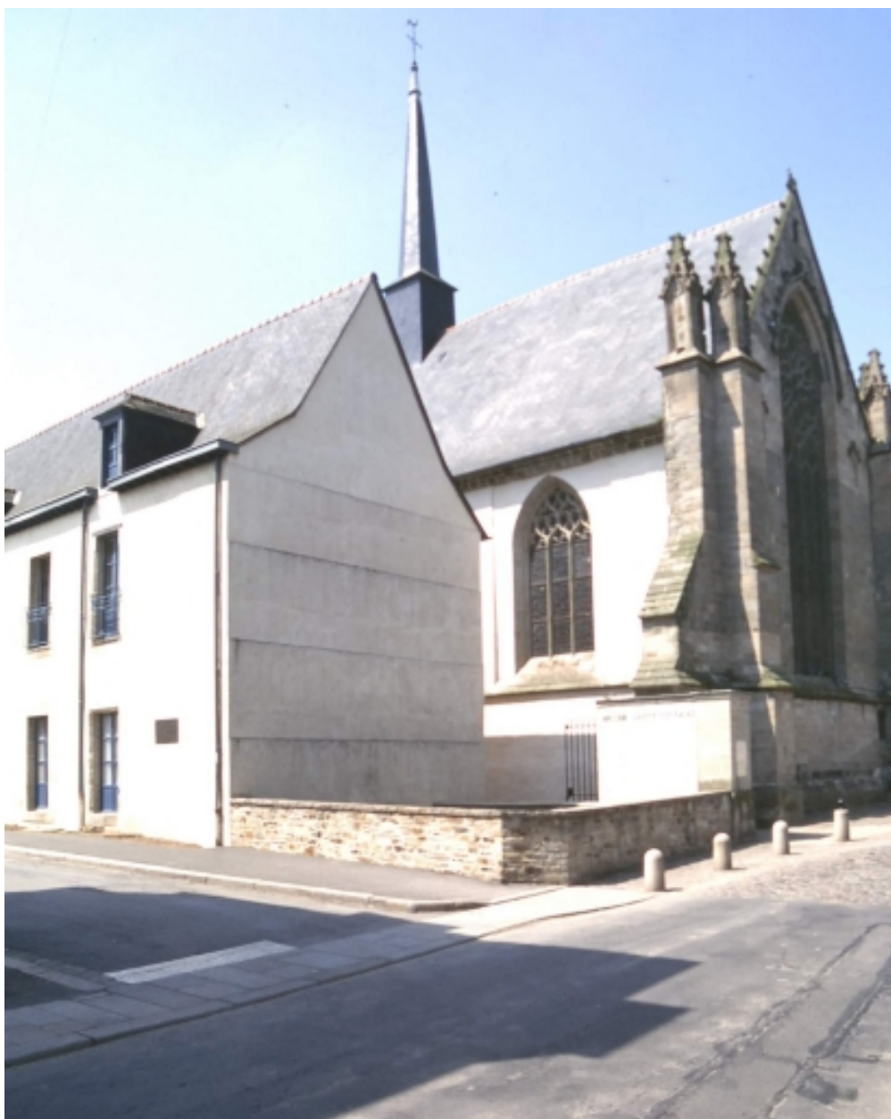
Pignons sud est : vue générale.