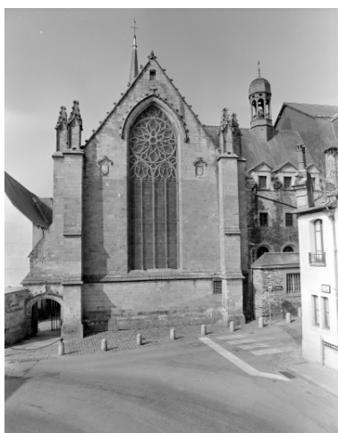
Elévation Nord : vue générale IVR53_19953500244X