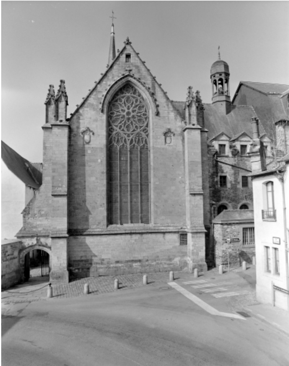
Elévation Nord : vue générale