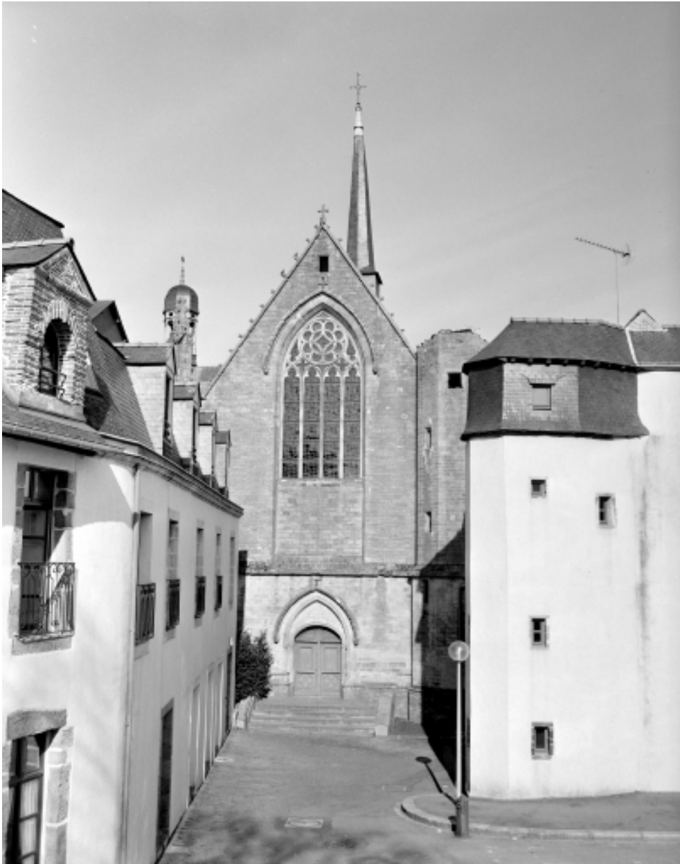
Elévation Sud : vue générale