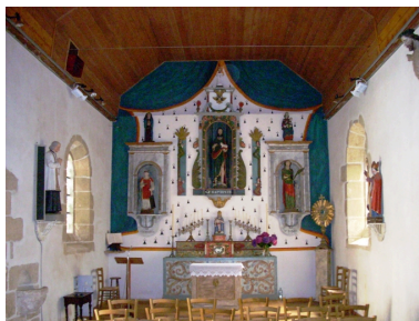
Guerlesquin, chapelle Saint-Jean : vue axiale est IVR53_20082906659NUCA