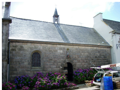
Guerlesquin, chapelle Saint-Jean : vue générale nord-est IVR53_20082906658NUCA