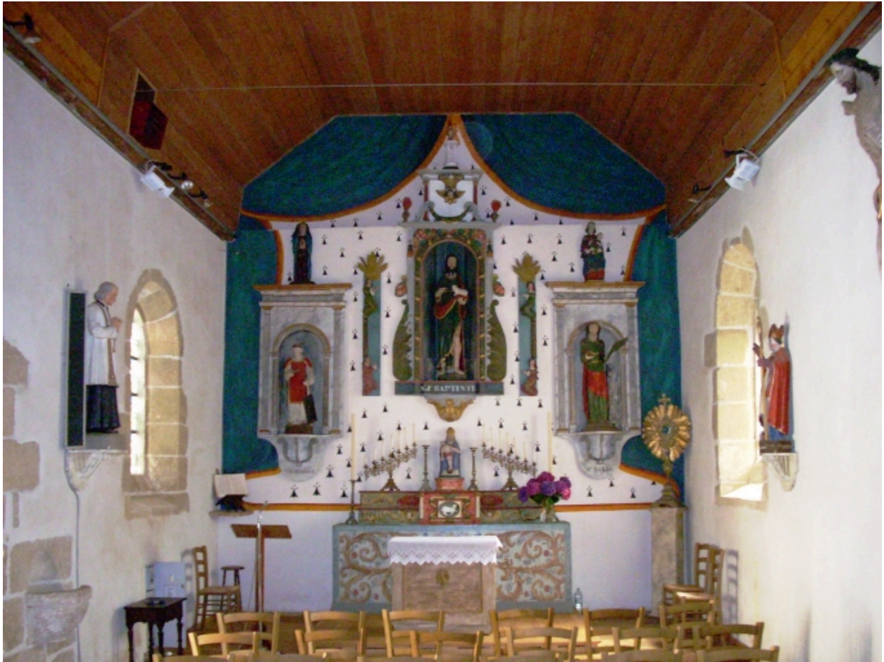
Guerlesquin, chapelle Saint-Jean : vue axiale est