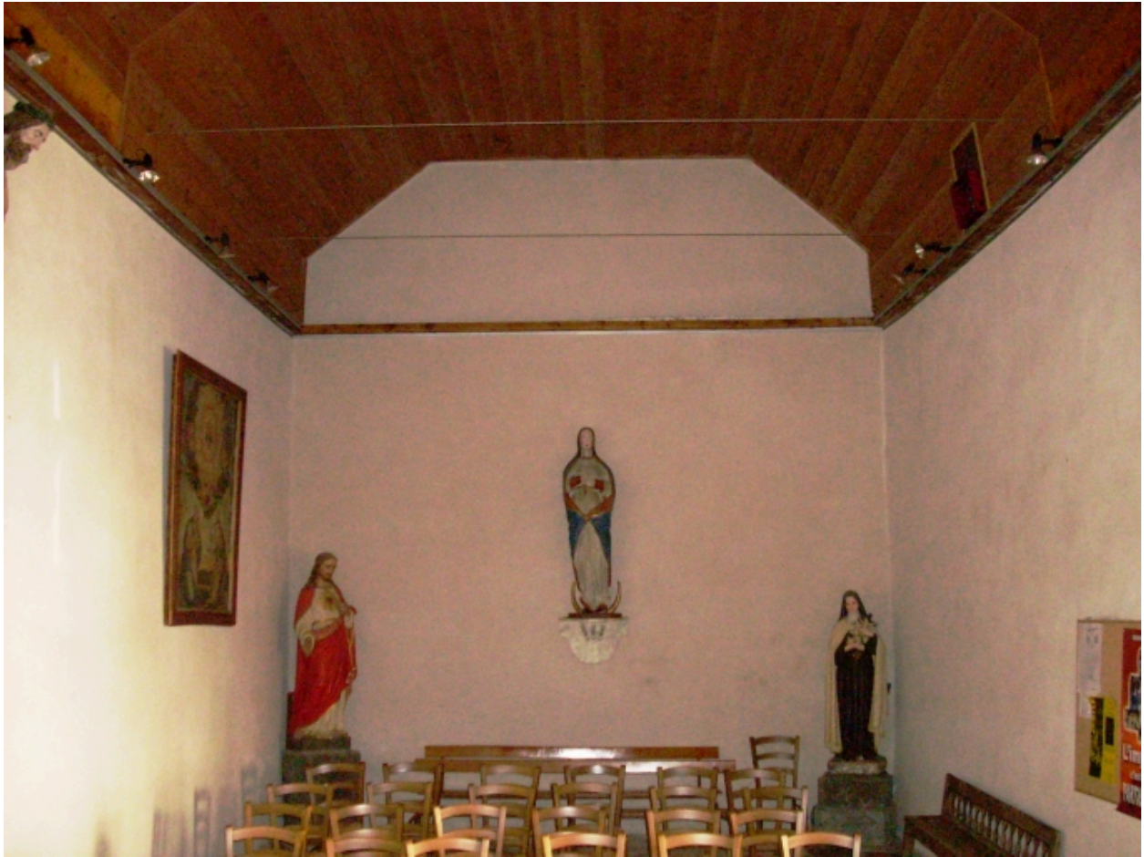
Guerlesquin, chapelle Saint-Jean : vue axiale ouest