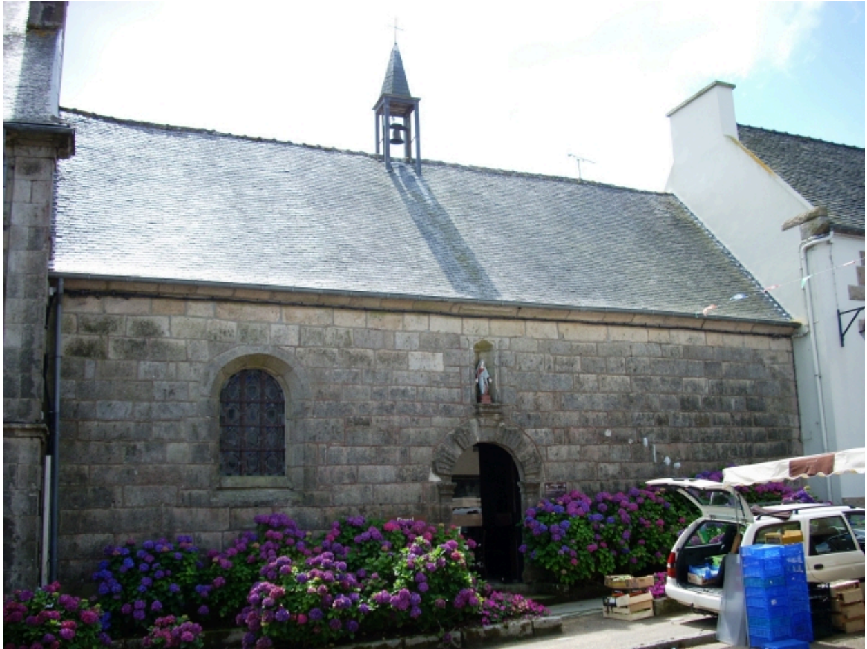
Guerlesquin, chapelle Saint-Jean : vue générale nord-est