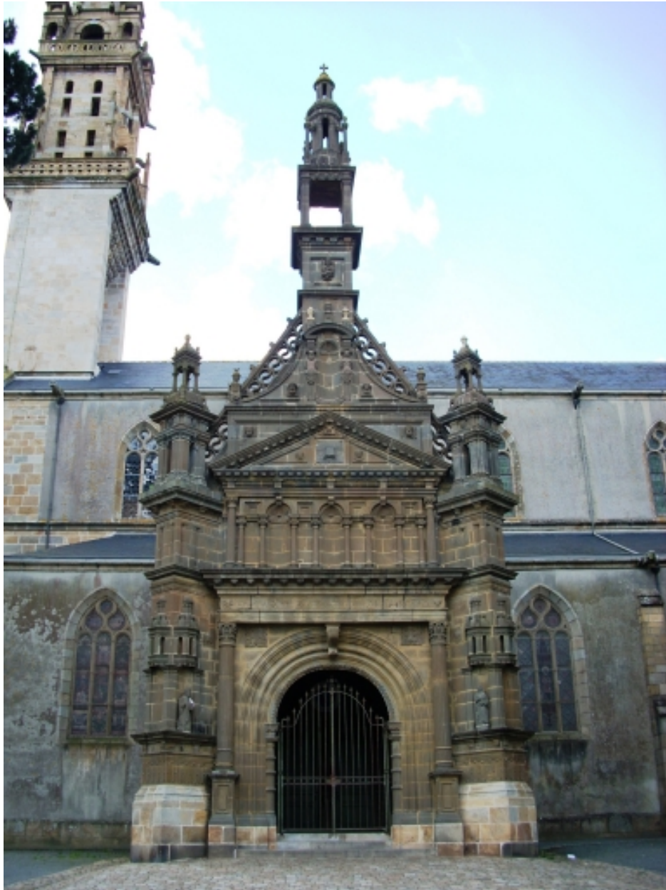
Landerneau, église Saint-Houardon : détail porche sud