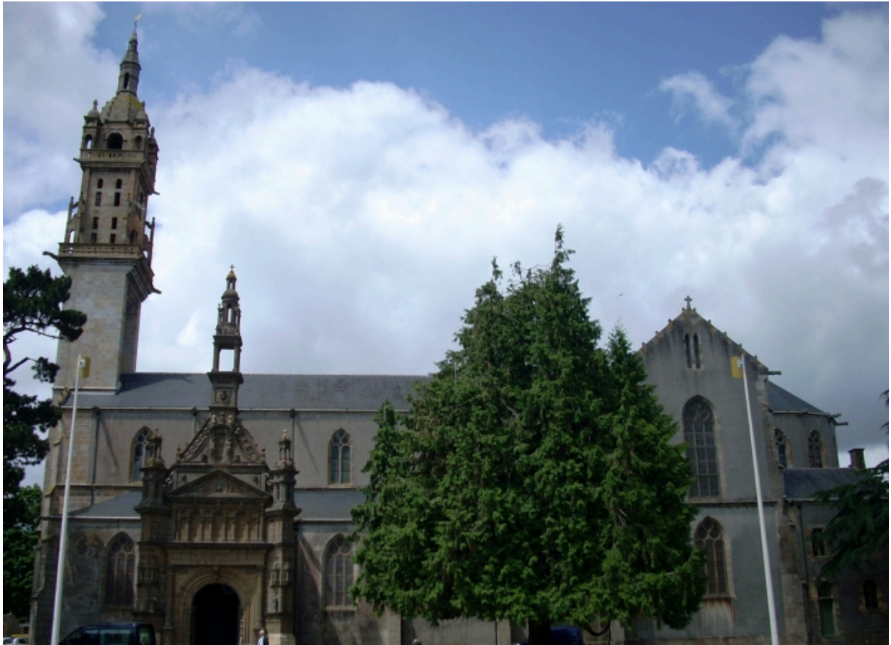
Landerneau, église Saint-Houardon : élévation sud