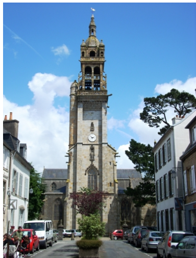
Landerneau, église Saint-Houardon : élévation ouest IVR53_20082906421NUCA