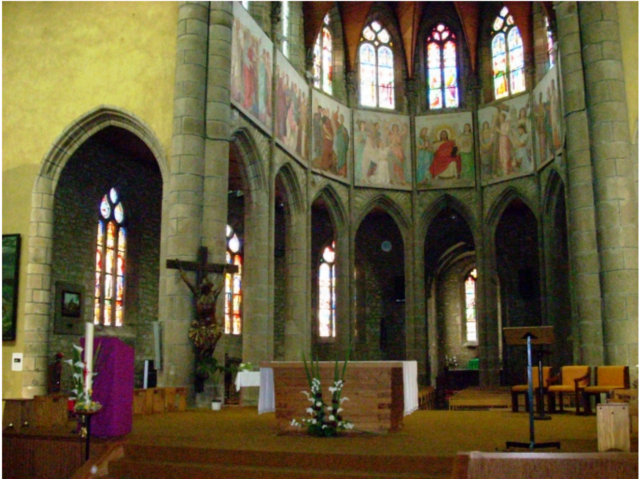
Landerneau, église Saint-Houardon : détail, vue transversale du chœur depuis le sud-ouest