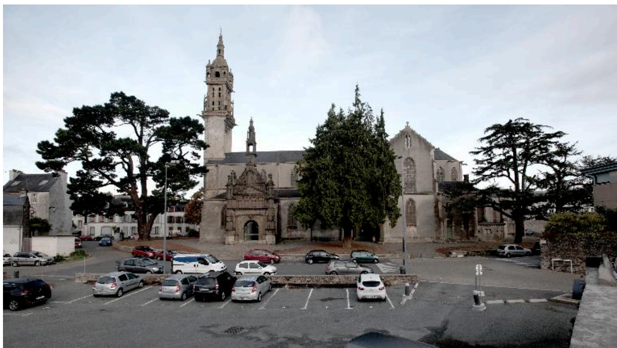
Vue de situation de l'église