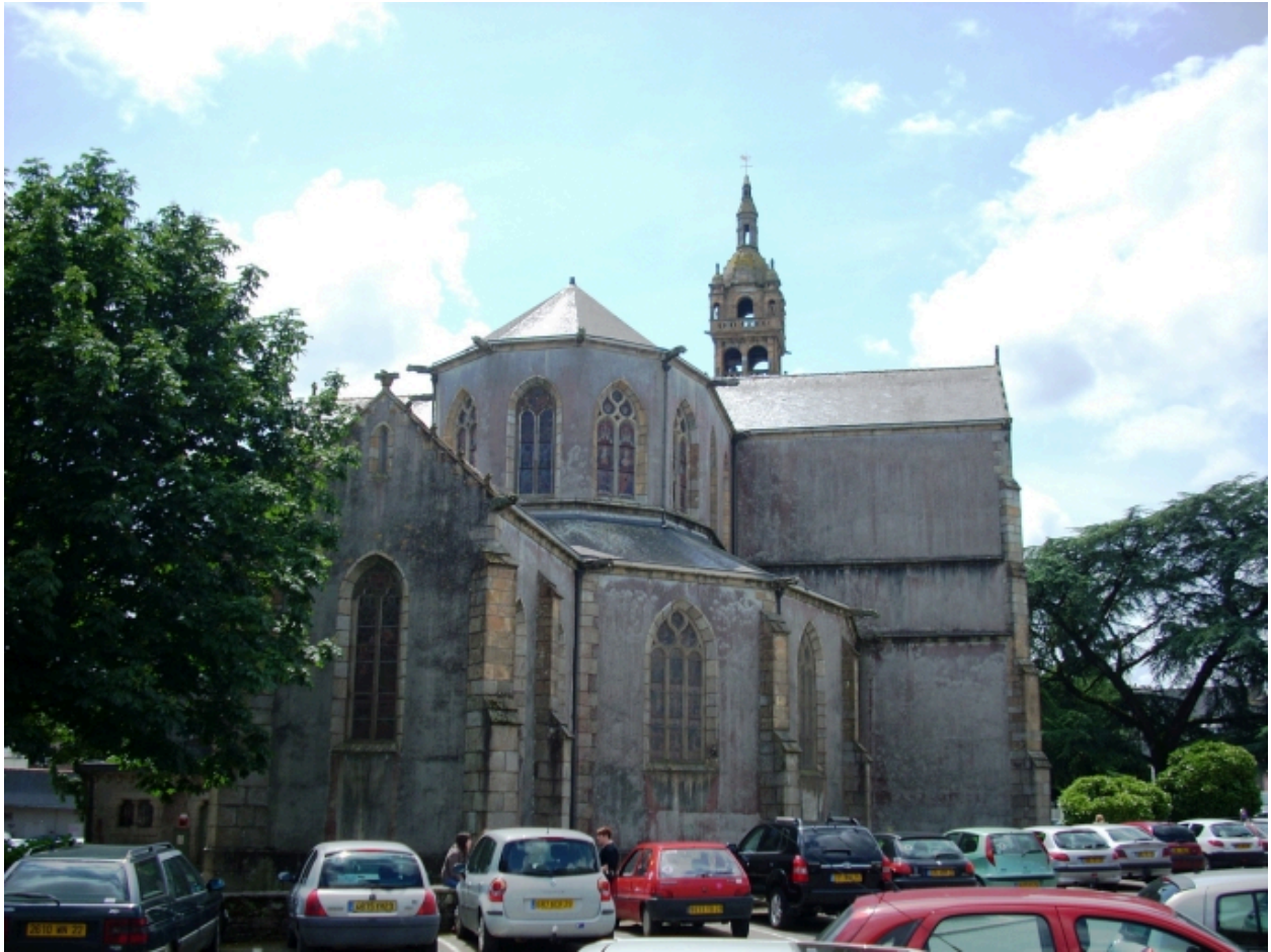
Landerneau, église Saint-Houardon : vue générale nord-est