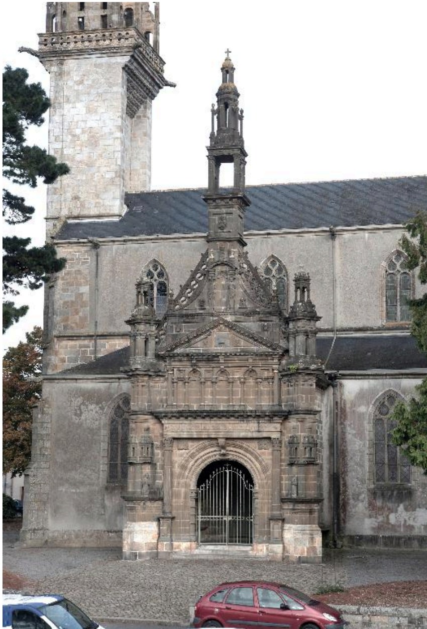
Vue du porche sud