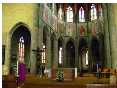
Landerneau, église Saint-Houardon : détail, vue transversale du choeur depuis le sud-ouest IVR53_20082906427NUCA