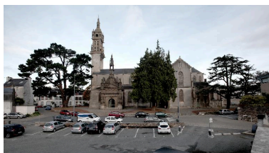
Vue de situation de l'église IVR53_20162900277NUCA