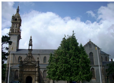
Landerneau, église Saint-Houardon : élévation sud IVR53_20082906422NUCA