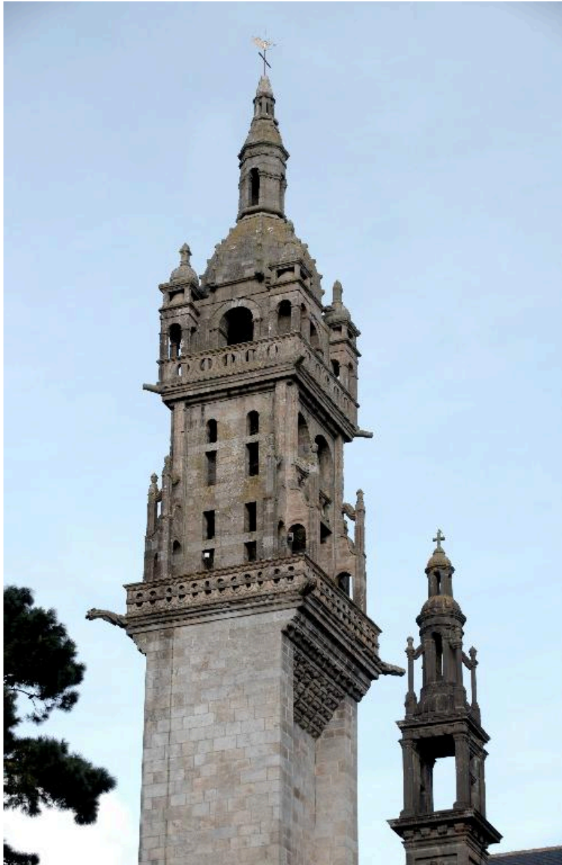
Vue de détail du clocher