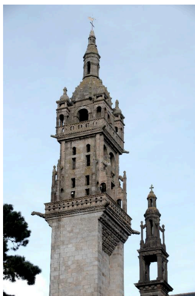
Vue de détail du clocher IVR53_20162900279NUCA