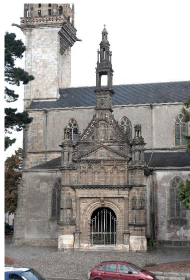
Vue du porche sud