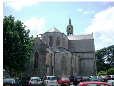
Landerneau, église Saint-Houardon : vue générale nord-est IVR53_20082906423NUCA