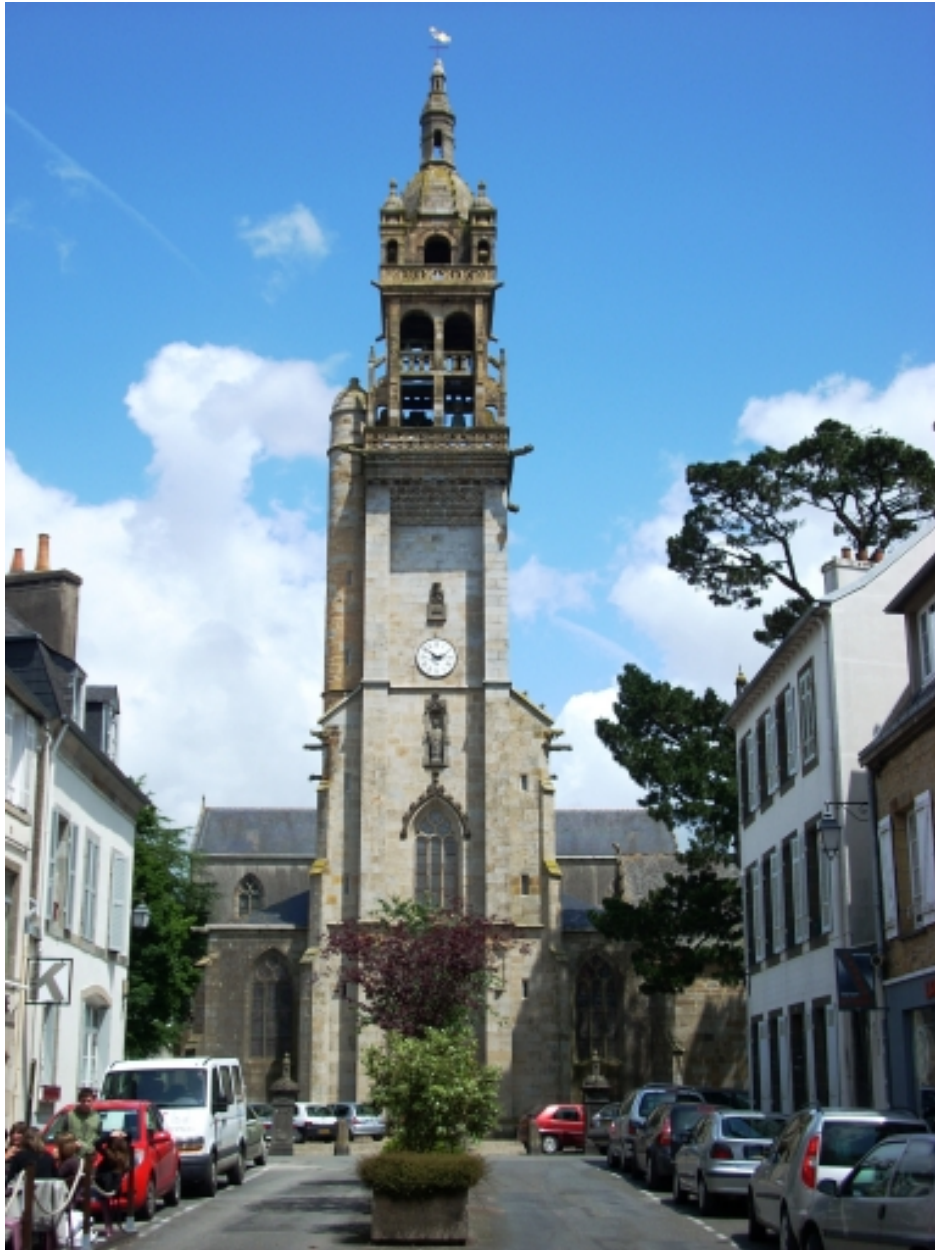
Landerneau, église Saint-Houardon : élévation ouest