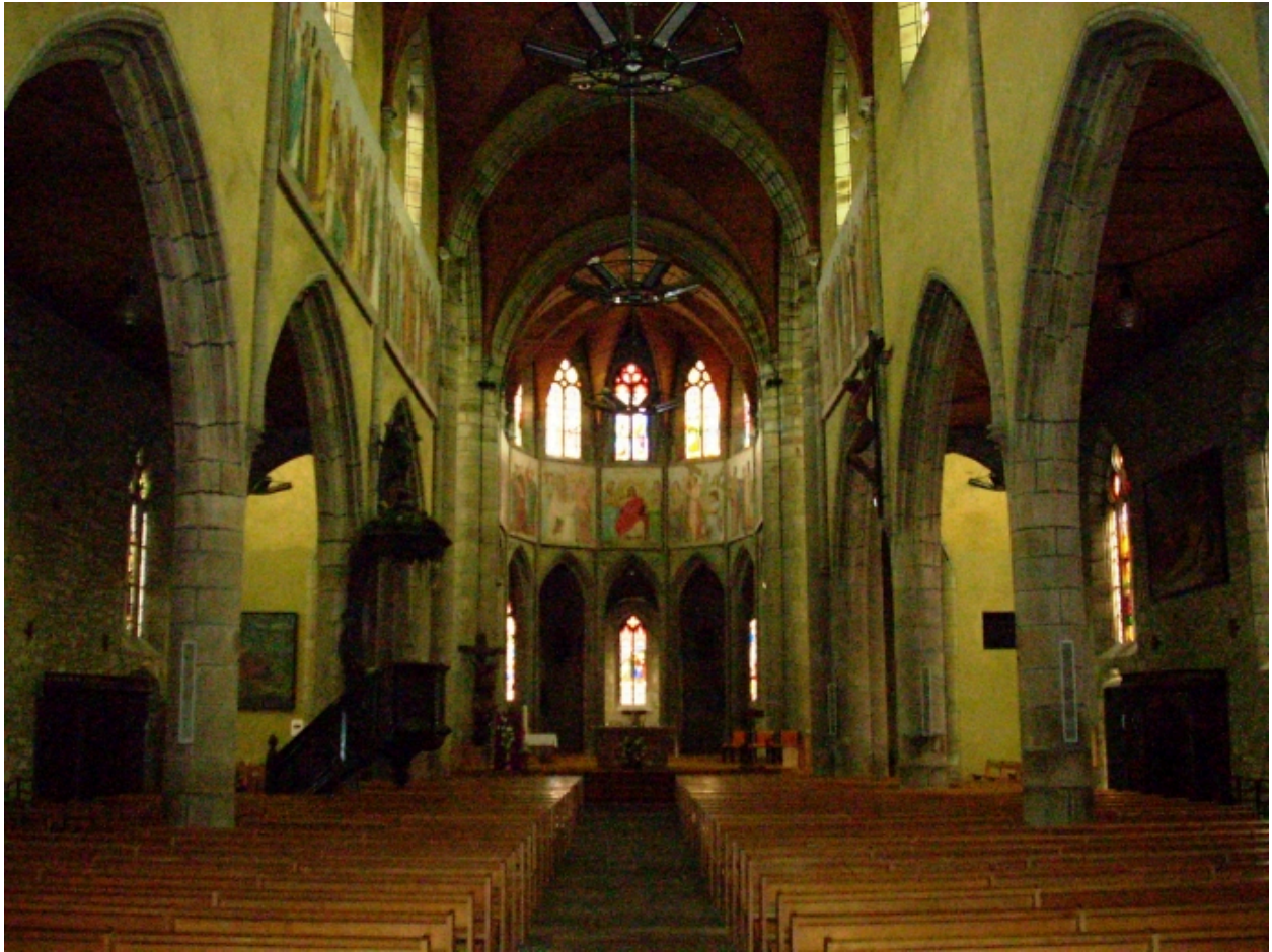
Landerneau, église Saint-Houardon : vue axiale est