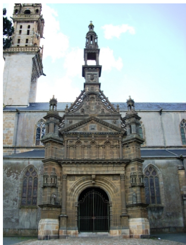
Landerneau, église Saint-Houardon : détail porche sud IVR53_20082906424NUCA