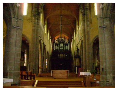
Landerneau, église Saint-Houardon : vue axiale ouest IVR53_20082906426NUCA