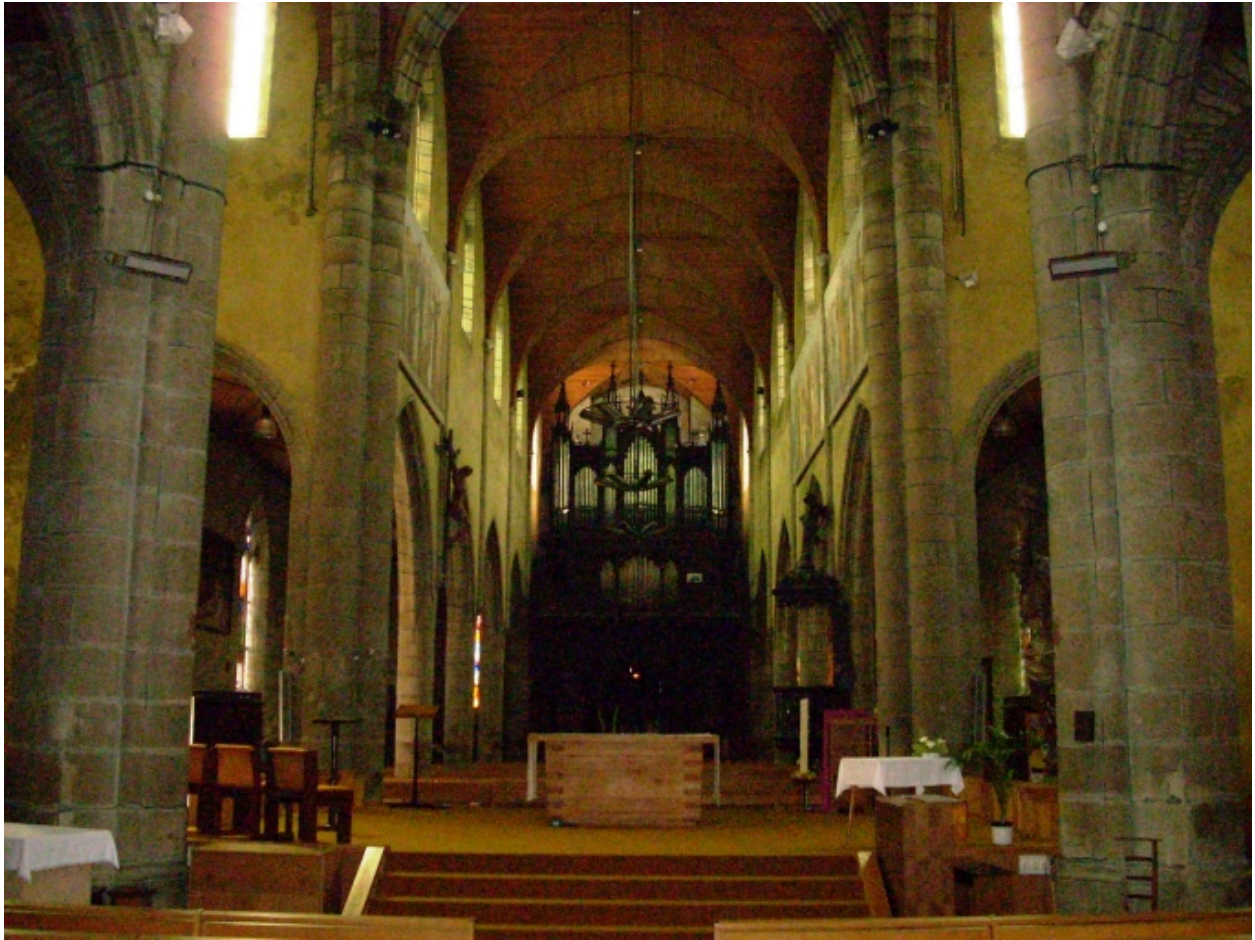
Landerneau, église Saint-Houardon : vue axiale ouest