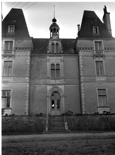
Façade nord (état en 1973) IVR53_19733505544Z