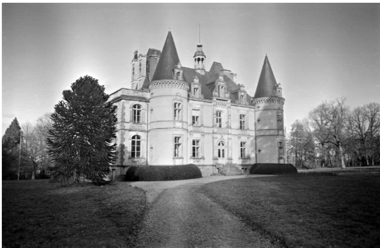
Vue générale de la façade sud (état en 1973)