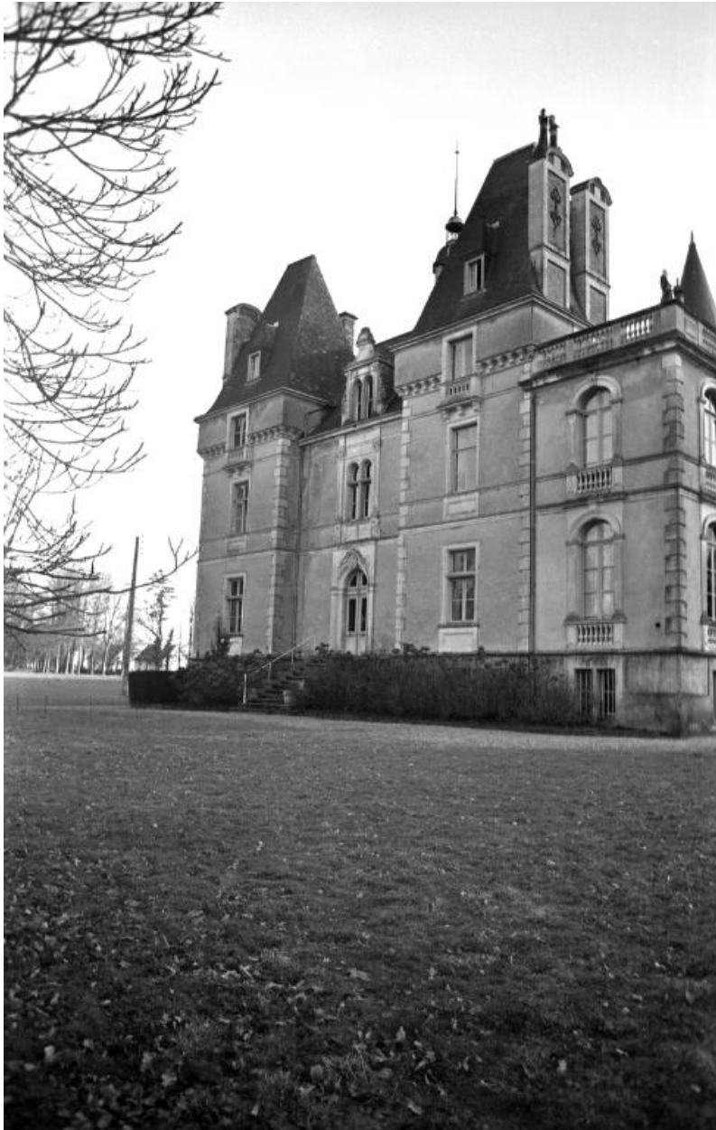
Façade nord (état en 1973)