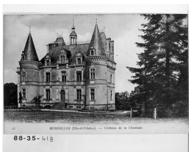
Vue générale de la façade sud, carte postale ancienne (début 20e siècle)