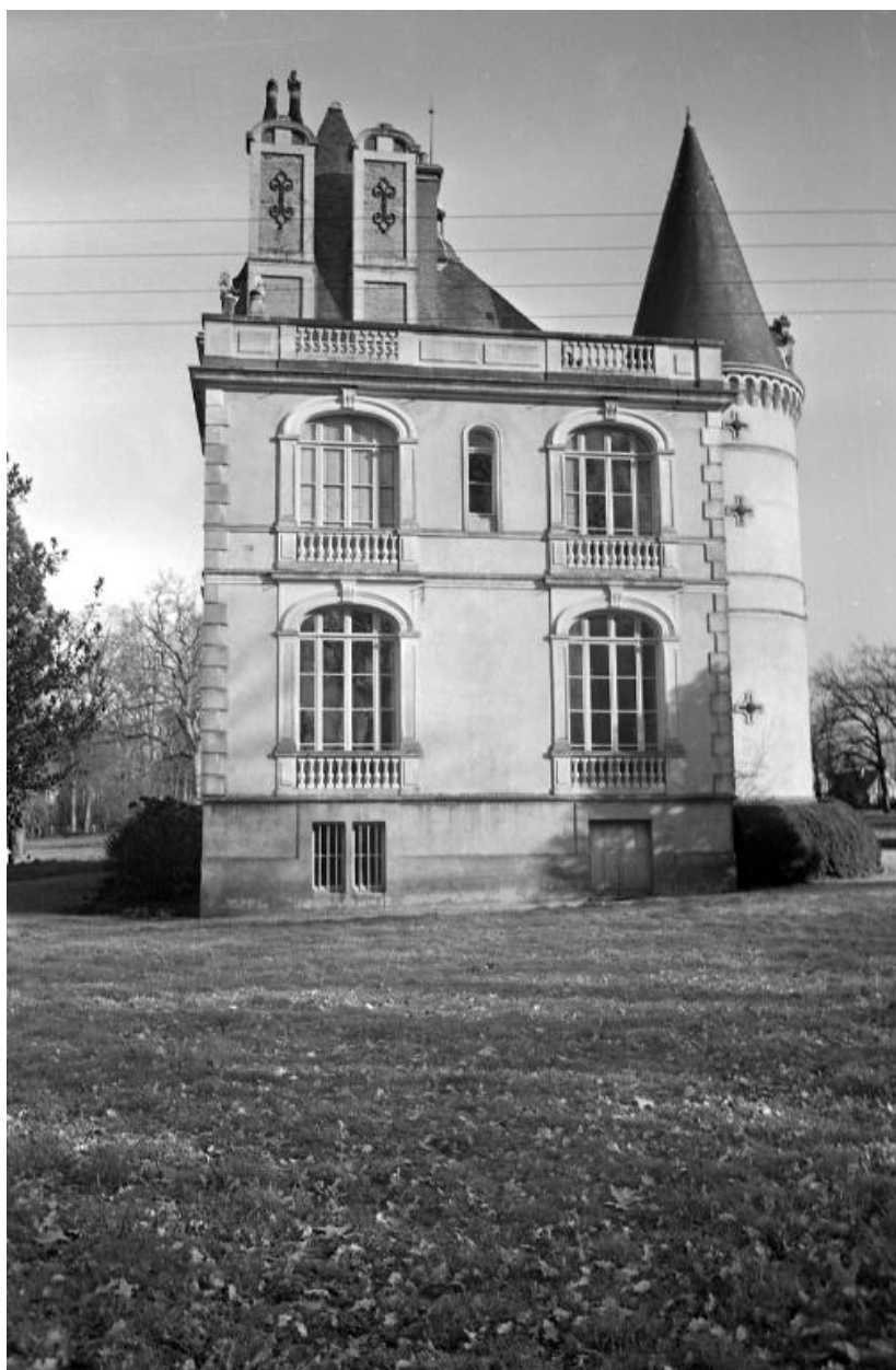
Façade ouest (état en 1973)