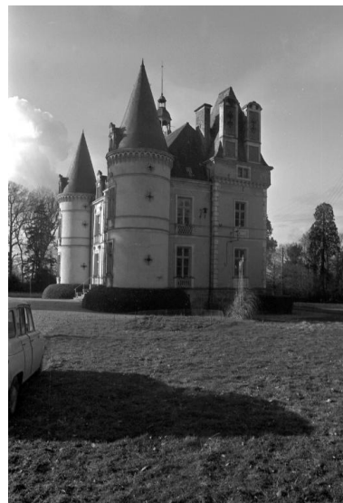
Façade est (état en 1973)