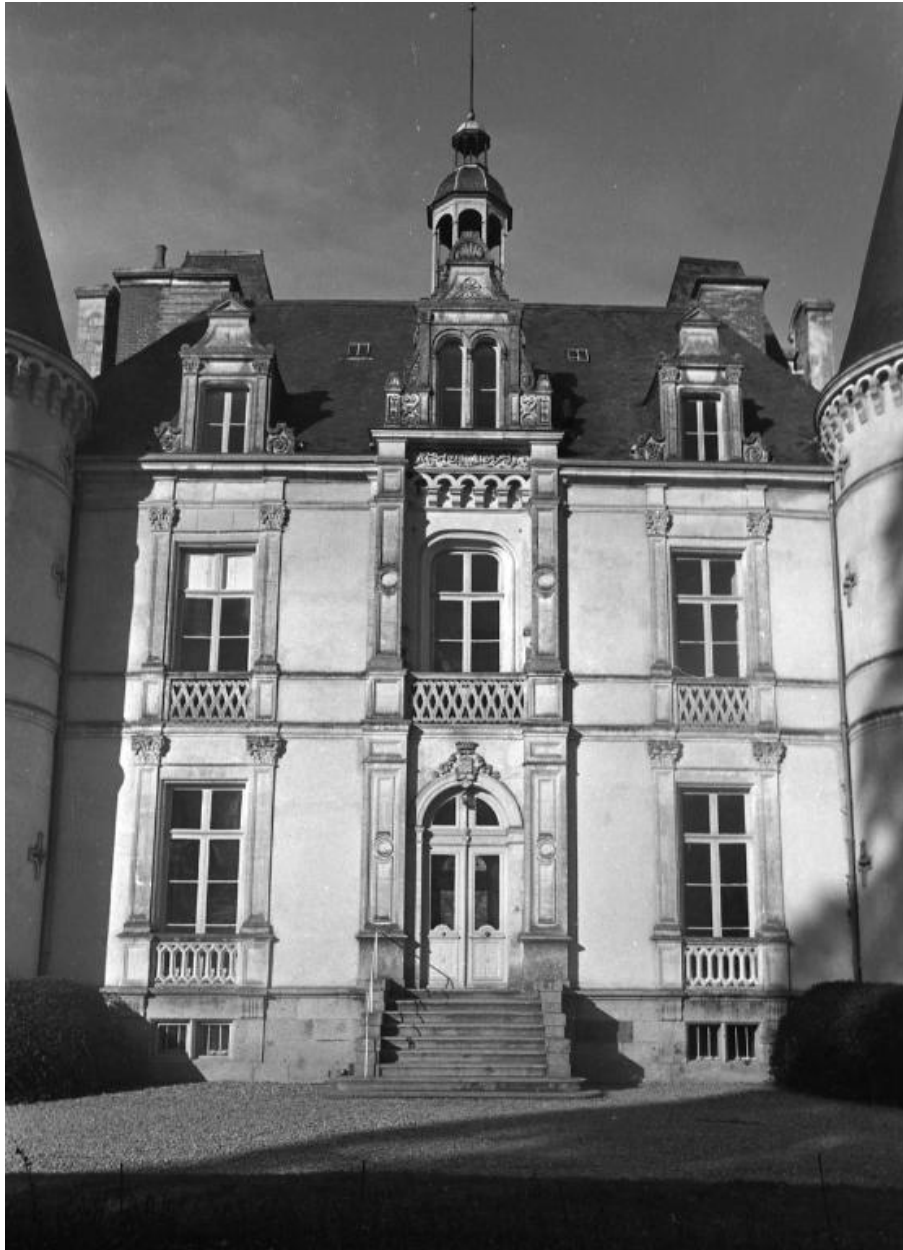
Façade sud (état en 1973)