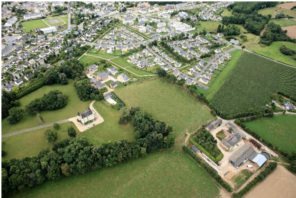
Vue aérienne (état en 2009)