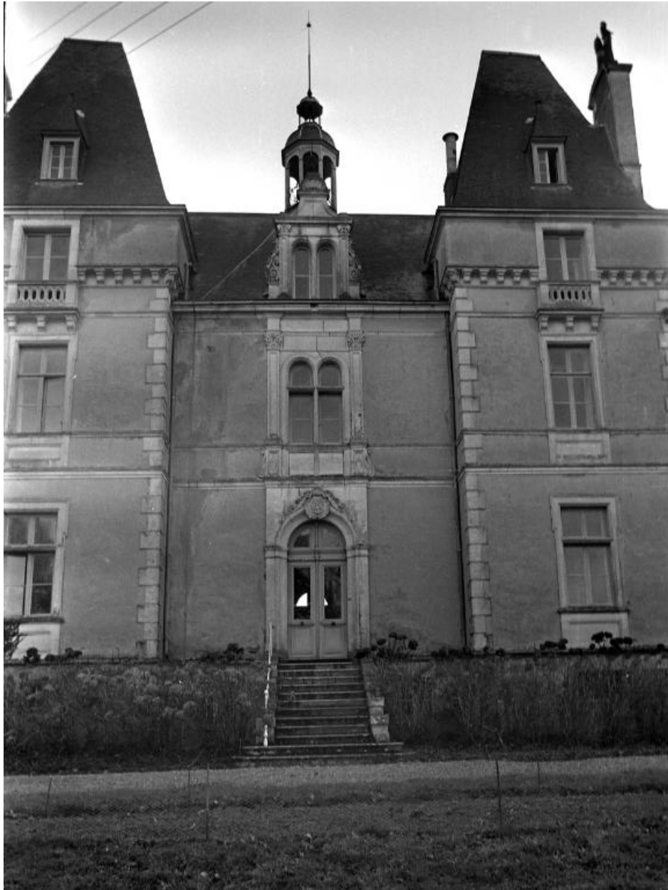
Façade nord (état en 1973)