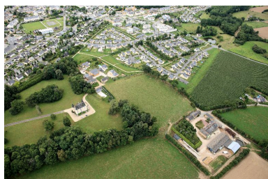
Vue aérienne (état en 2009) IVR53_20173506646NUCA