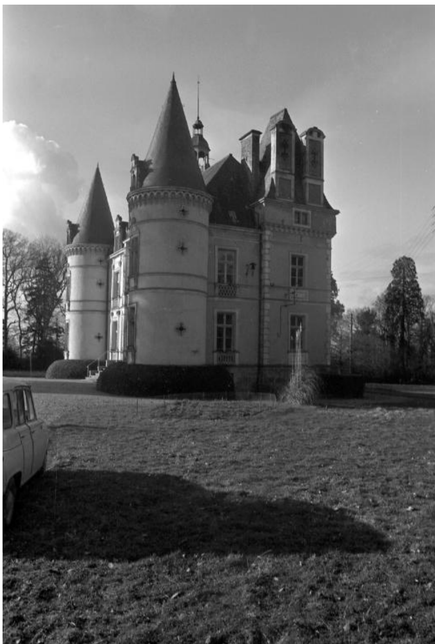
Façade est (état en 1973)