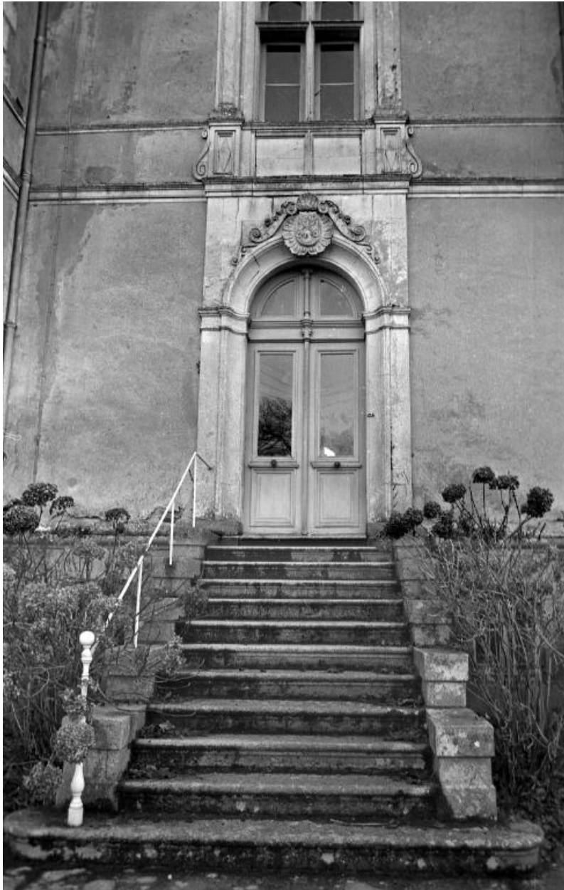
Porte d'entrée façade nord (état en 1973)