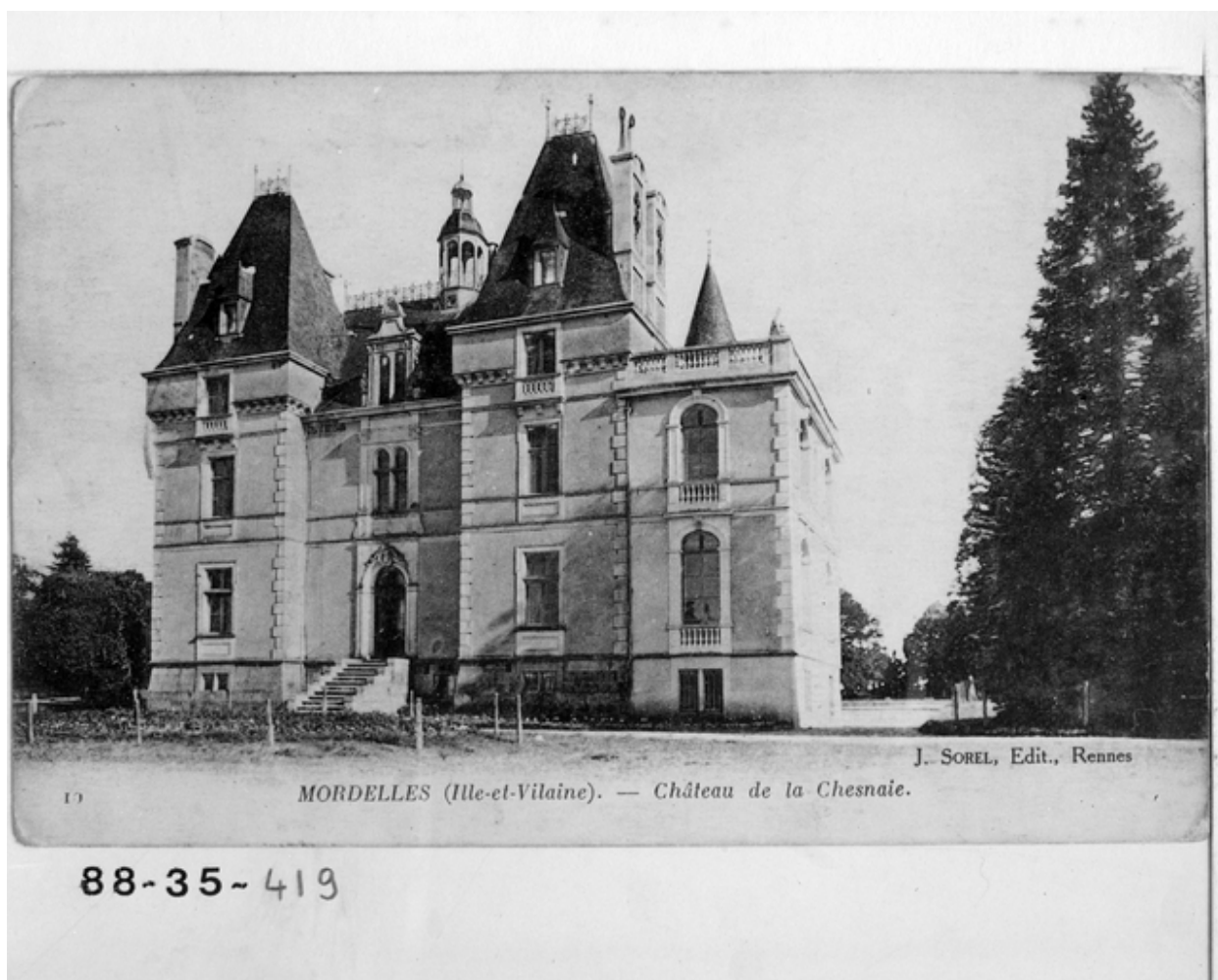
Vue générale de la façade nord, carte postale ancienne (début 20e siècle)