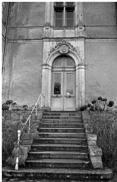
Porte d'entrée façade nord (état en 1973) IVR53_19733505543Z