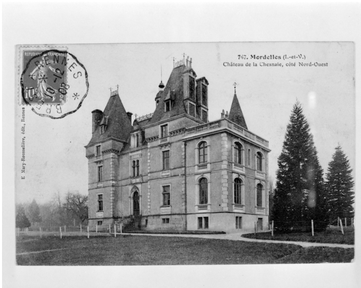
Château de la Chesnaie, côté nord-ouest, carte postale ancienne (début 20e siècle)