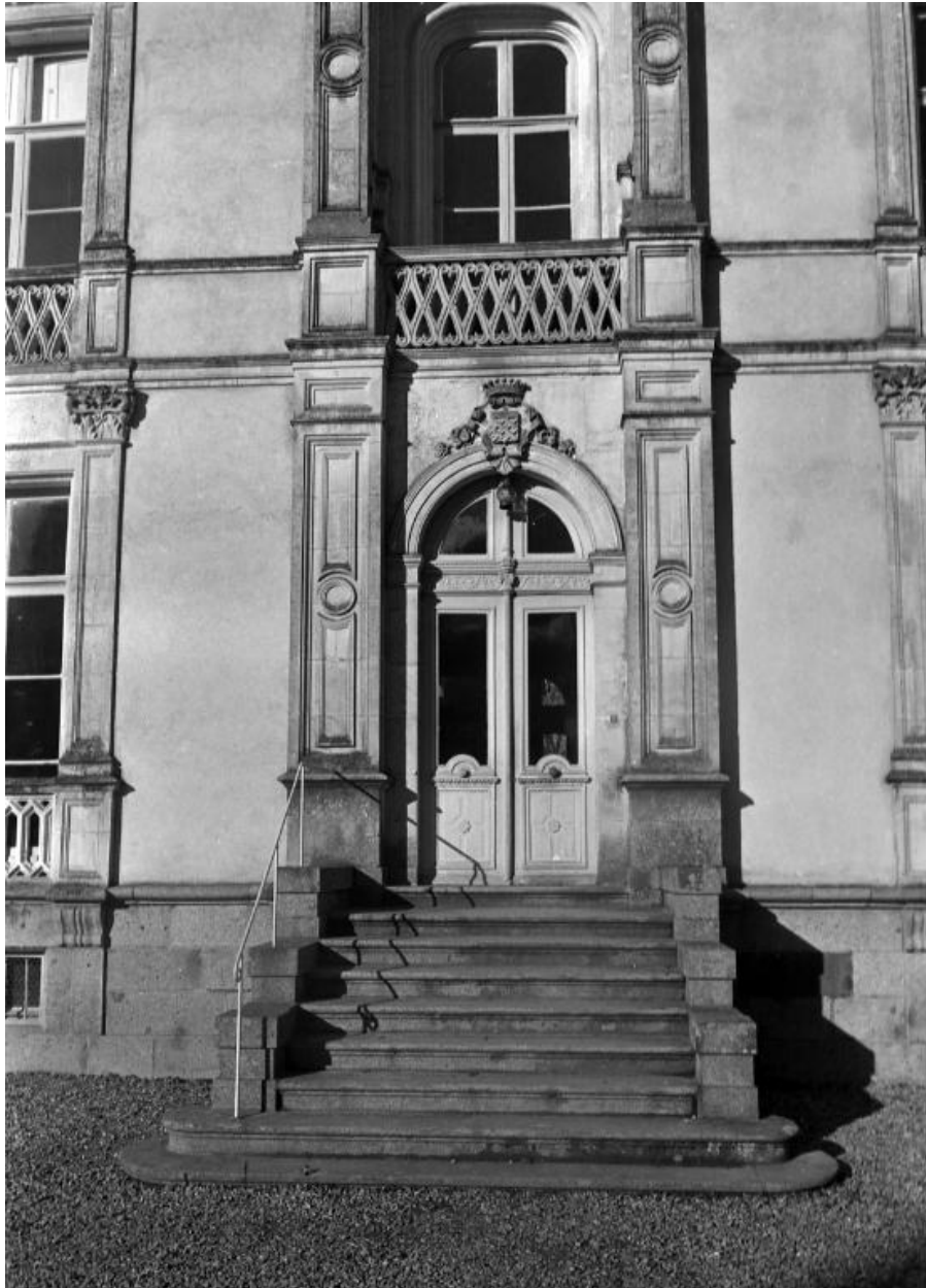
Porte d'entrée façade sud (état en 1973)