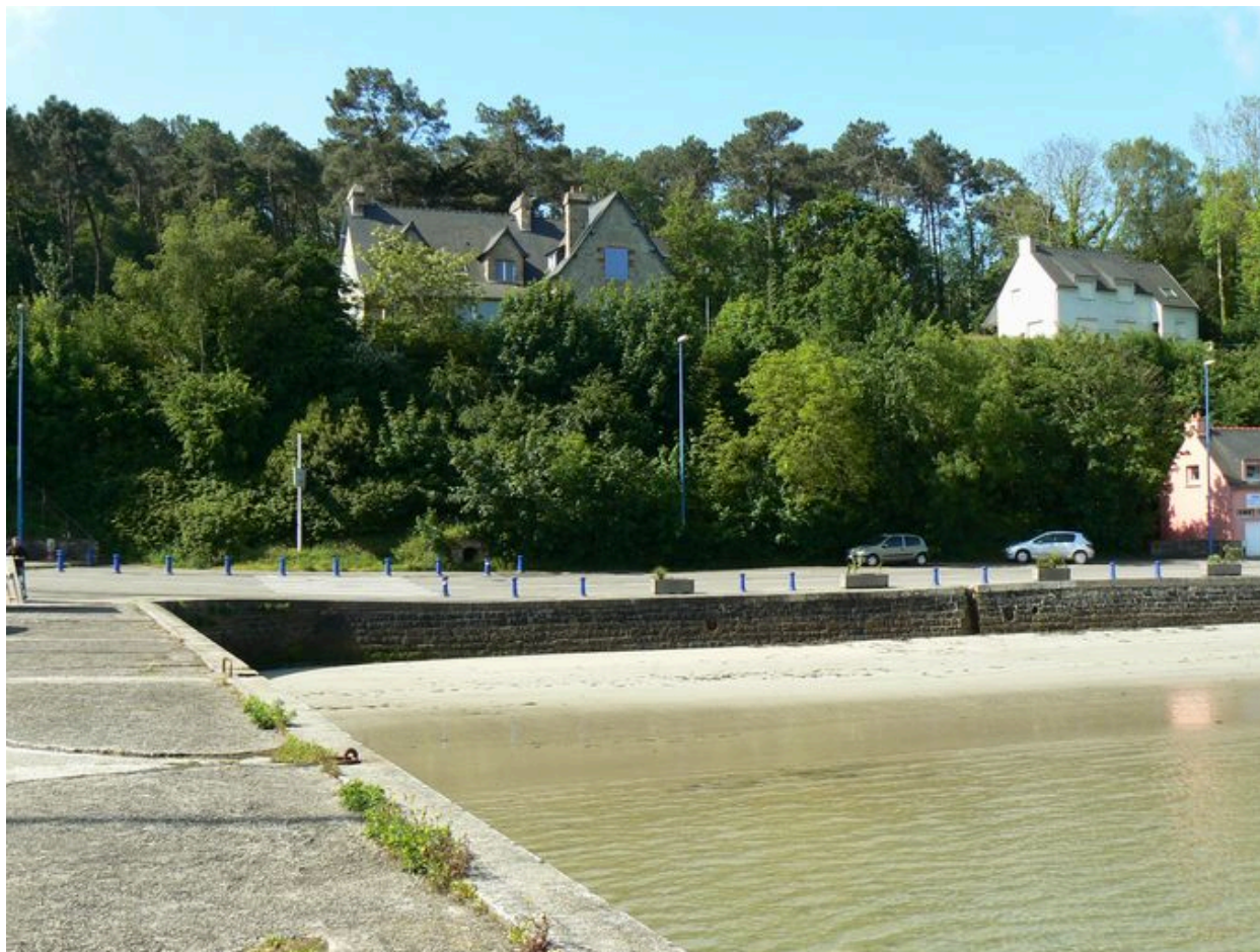
Villa Lazard, vue du port