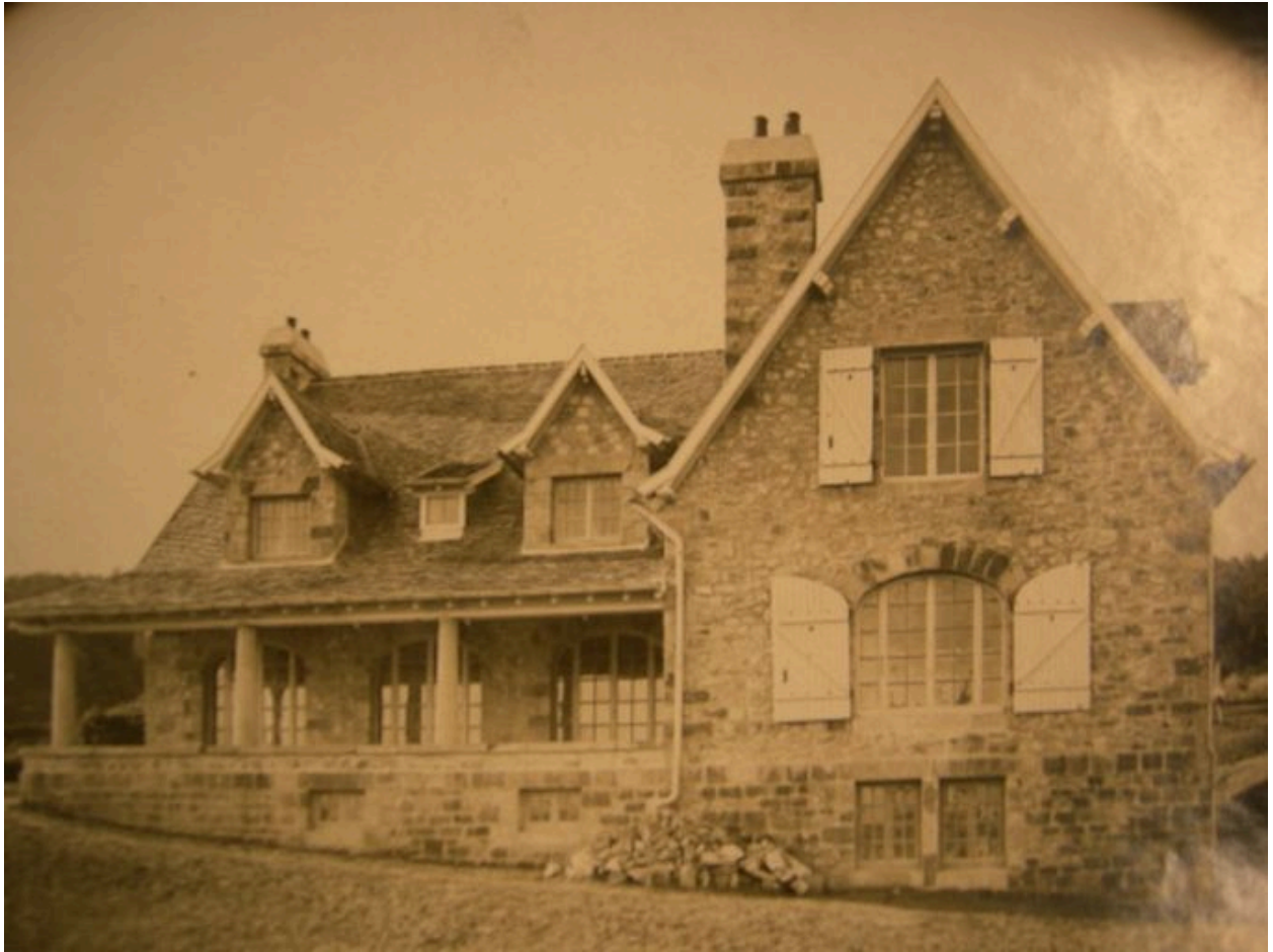
Vue ancienne de la villa Lazard, côté mer