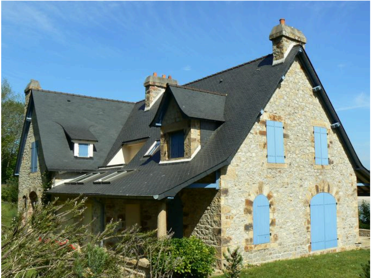
Vue générale de la villa Lazard, côté terre