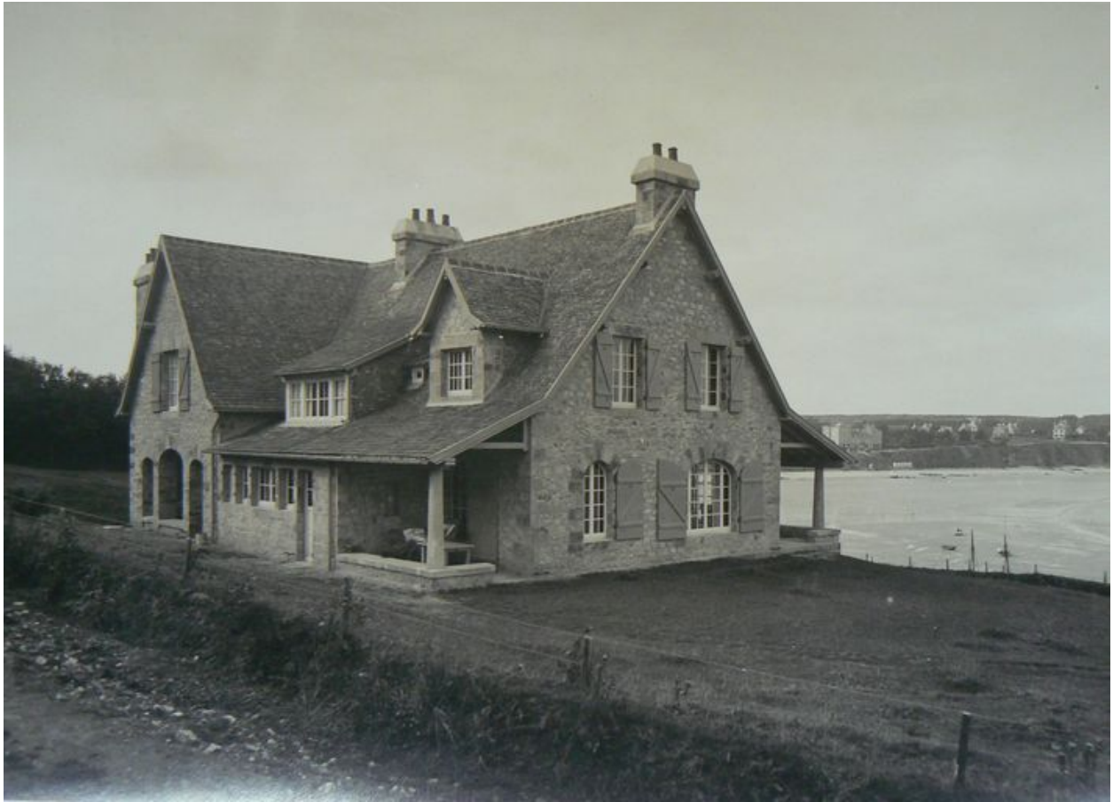
Vue ancienne de la villa Lazard, côté terre