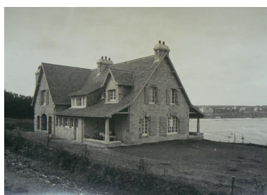
Vue ancienne de la villa Lazard, côté terre IVR53_20072908673NUC