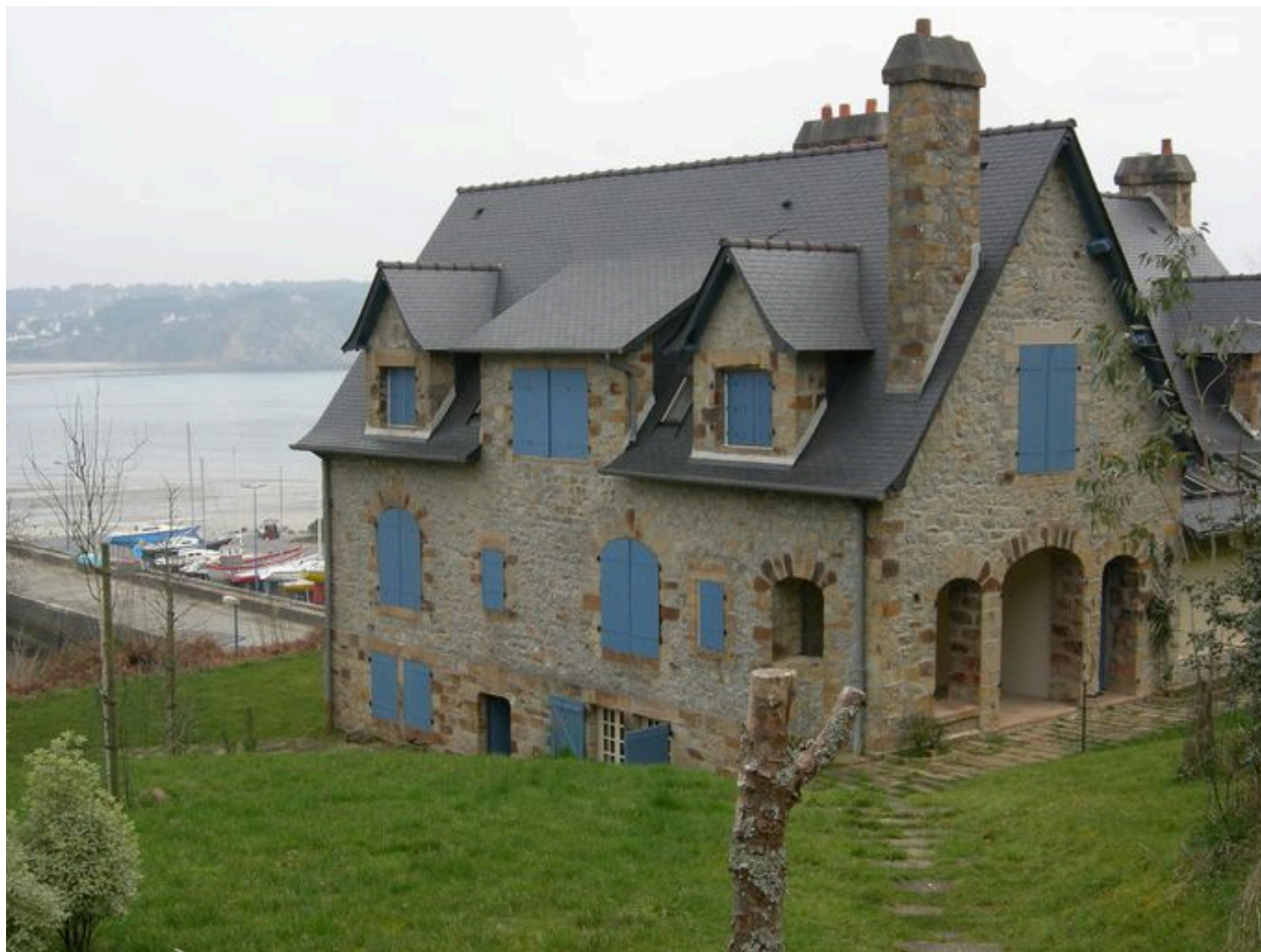
Vue de trois-quarts de la villa Lazard, côté terre