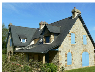
Vue générale de la villa Lazard, côté terre