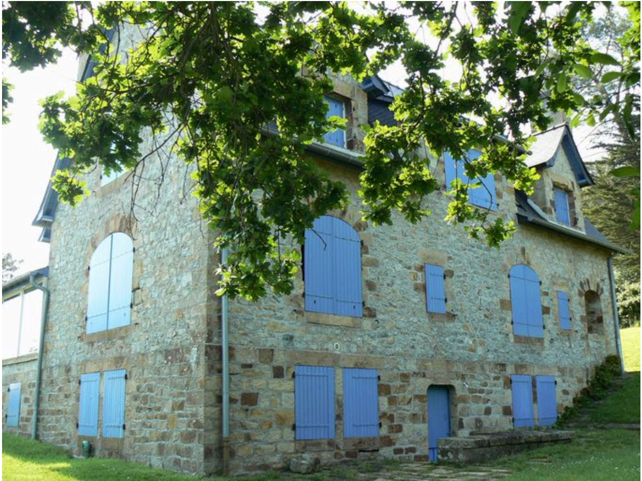
Vue latérale de la villa Lazard