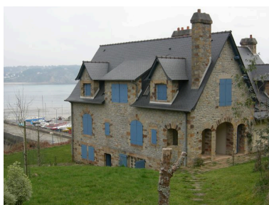
Vue de trois-quarts de la villa Lazard, côté terre IVR53_20062908629NUCA