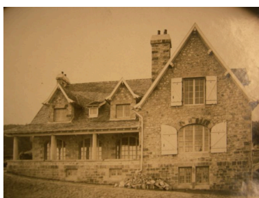
Vue ancienne de la villa Lazard, côté mer