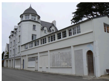
Vue générale IVR53_20072908825NUC