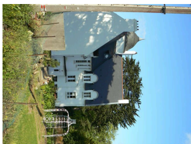
Vue latérale IVR53_20072908823NUCA