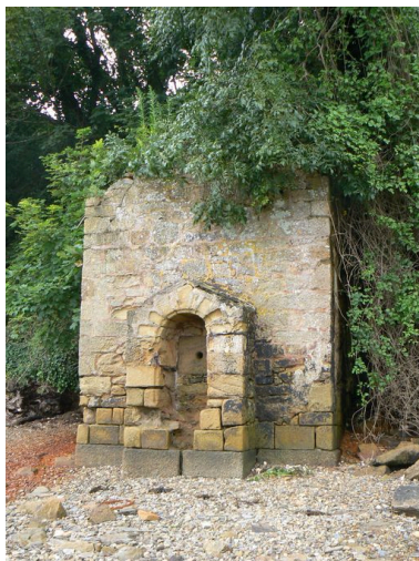
Fontaine de Quélern IVR53_20072908961NUCA