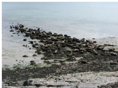
Cale de la caserne Sourdis IVR53_20082908417NUCA