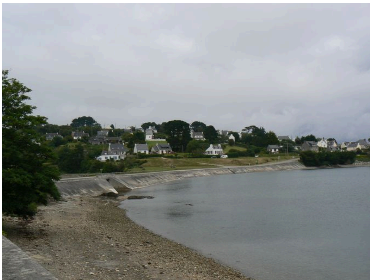
Digue-route de Kervian