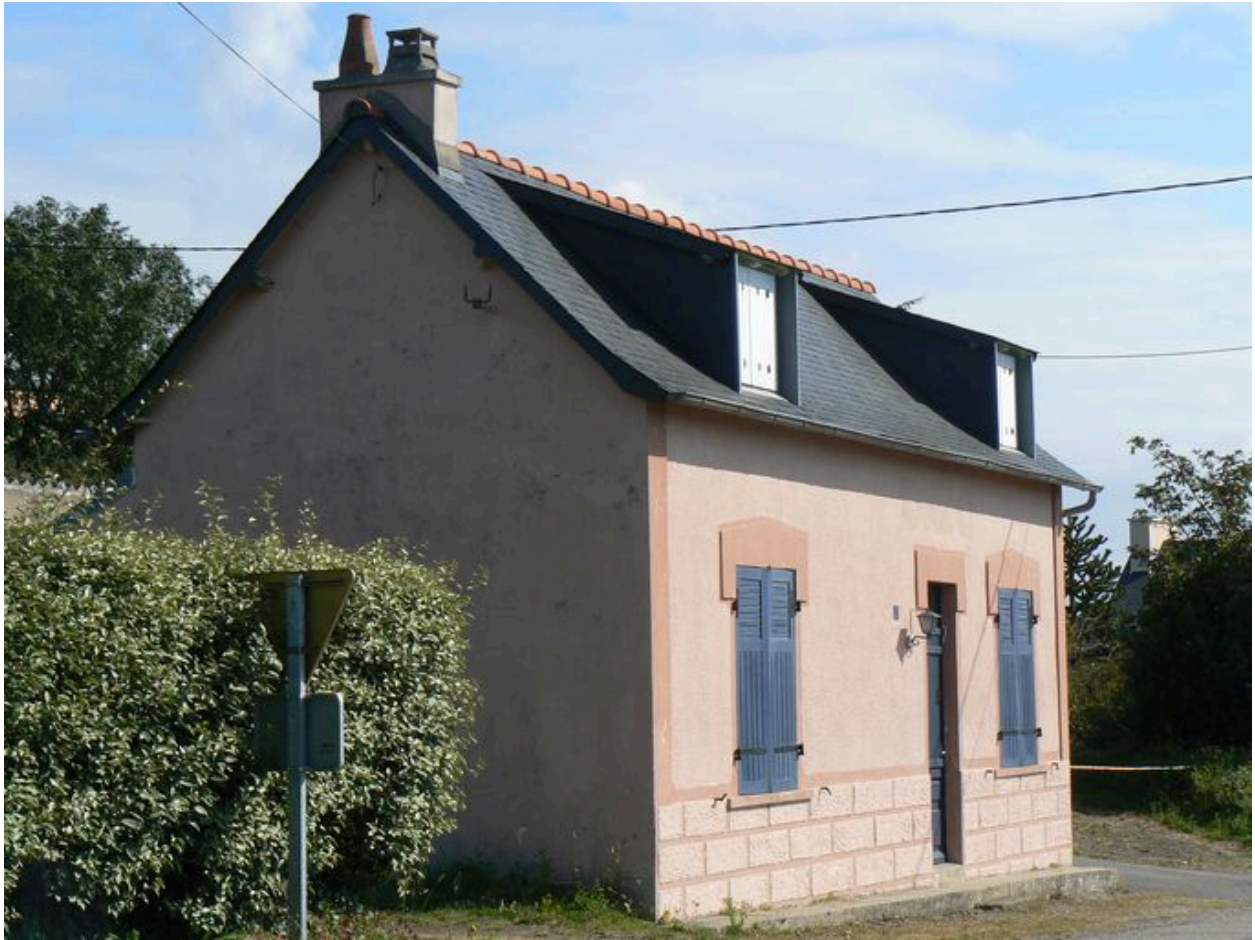
Bistrot 'Au départ du vapeur'