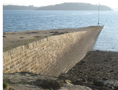
Cale de Quélern