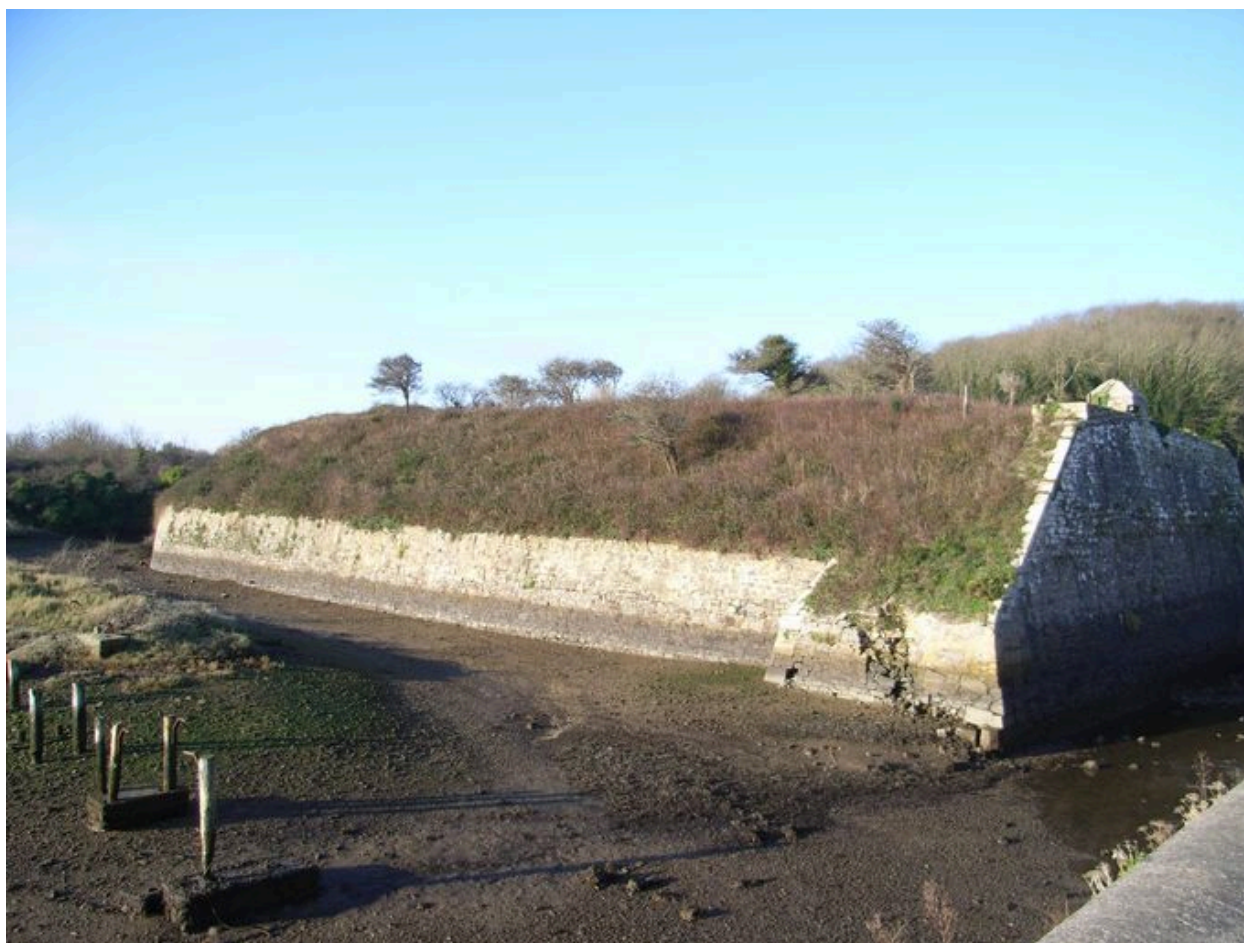
Lignes de Quéléren