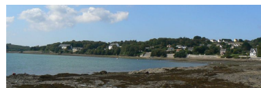
Vue générale de l'espace portuaire et militaire de Quéléren IVR53_20072908981NUCA