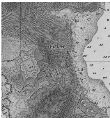
Carte de Quéléren en 1950 IVR53_20082908509NUC