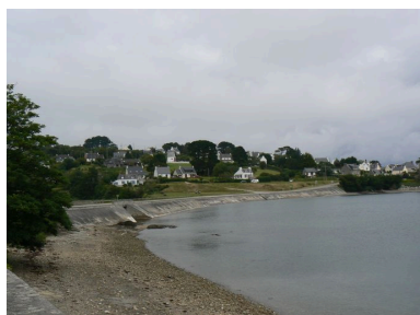
Digue-route de Kervian IVR53_20072908965NUCA