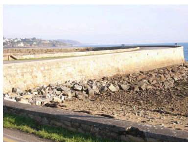
Digue-route de Quéléren