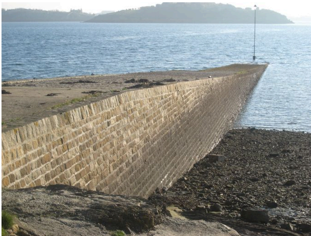
Cale de Quéléren