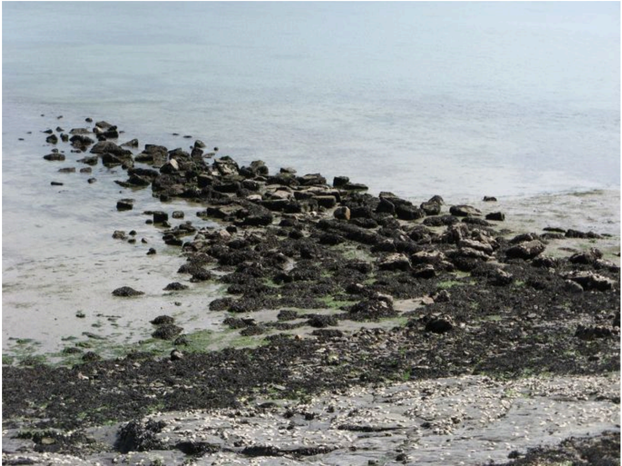
Cale de la caserne Sourdis