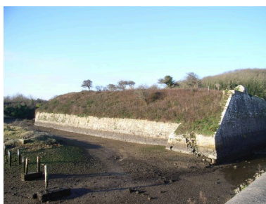
Lignes de Quéléren