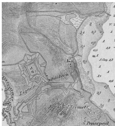
Carte de Quéléren en 1934