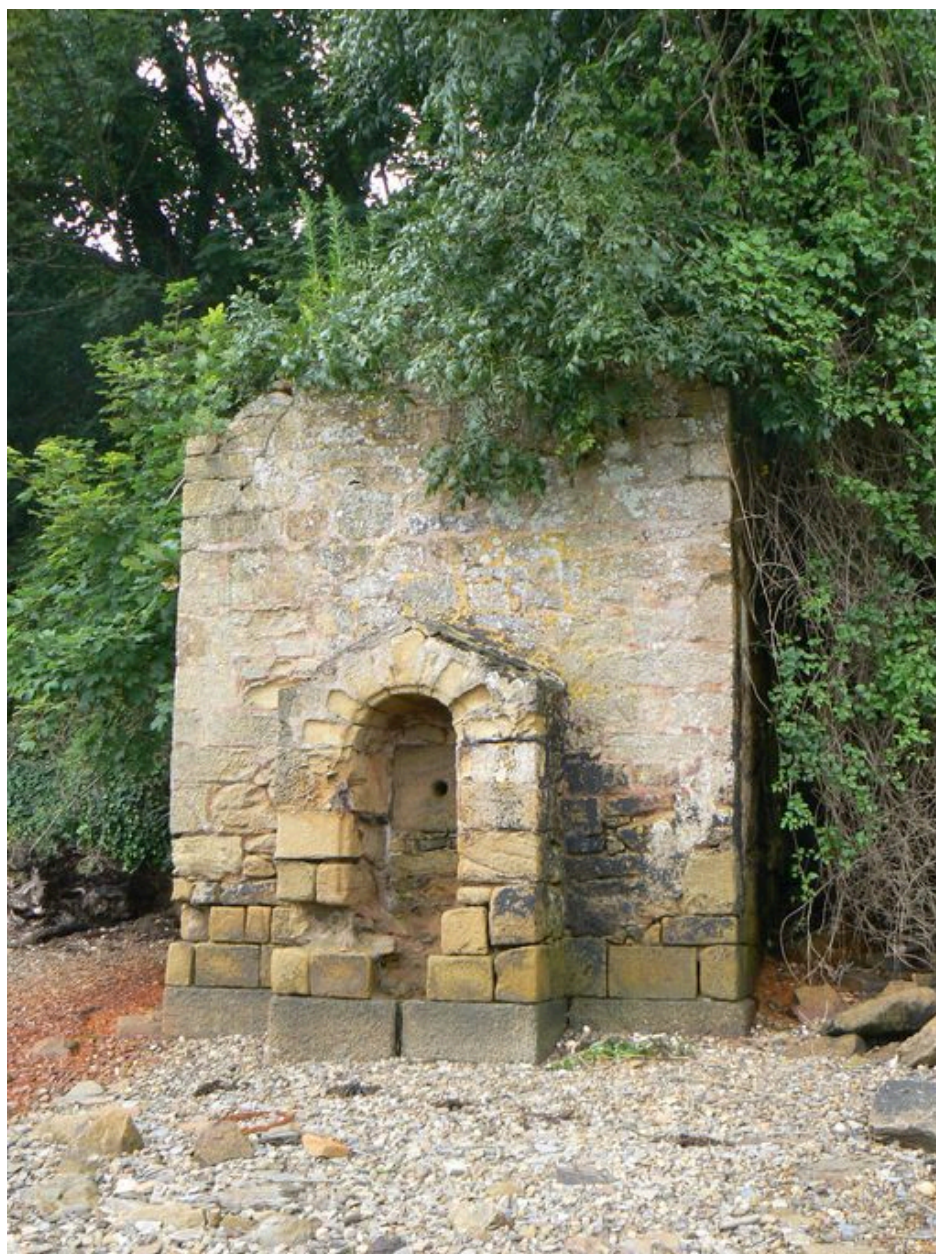
Fontaine de Quéléren