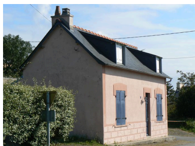
Bistrot 'Au départ du vapeur' IVR53_20072908975NUCA