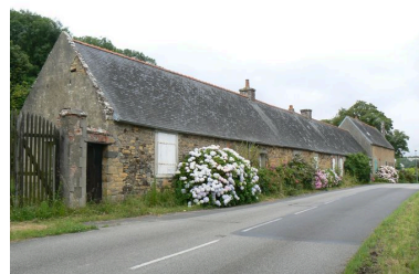
Briqueterie Kermarec devenue villa-pension La Pagode