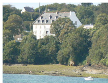
Caserne Sourdis