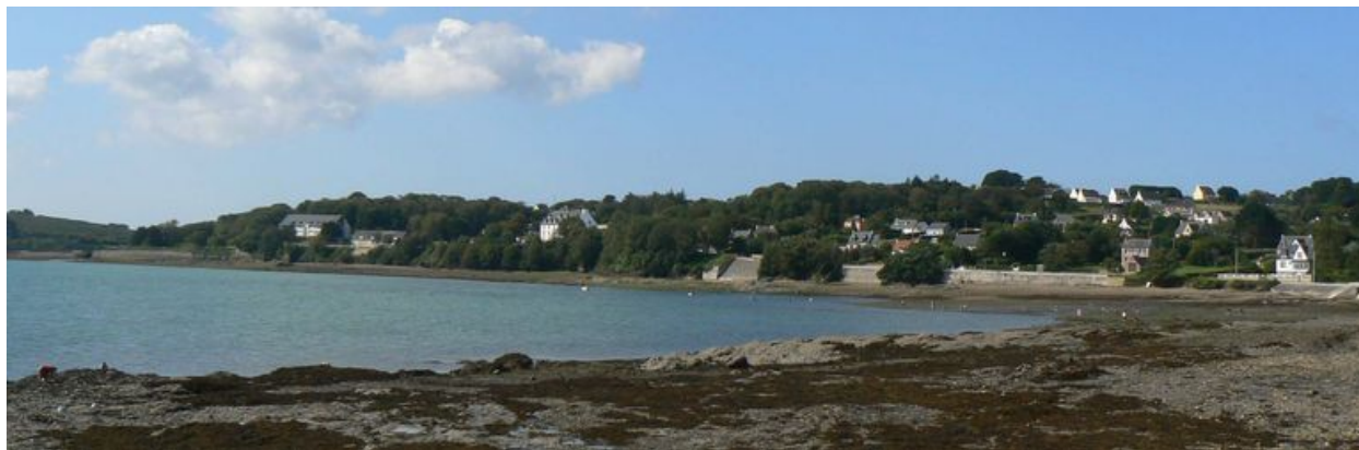
Vue générale de l'espace portuaire et militaire de Quéléren