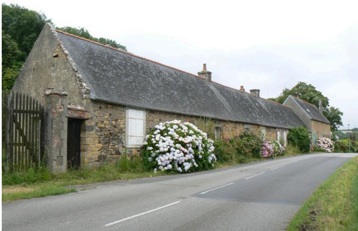
Briqueterie Kermarec devenue villa-pension La Pagode