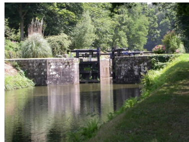
Vue générale sud-ouest IVR53_20053519039NUCA