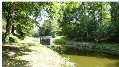
Canal d'Ille et Rance Site de la Pêchetière IVR53_20243531624NUCA