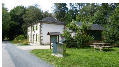
Vue est IVR53_20243531622NUCA