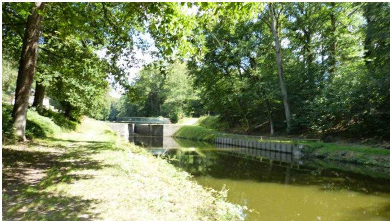
Canal d'Ille et Rance Site de la Pêchetière