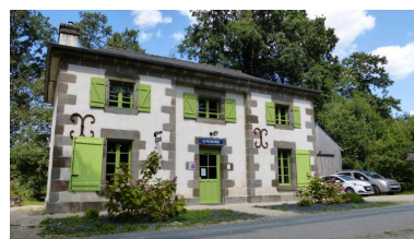
Vue sud, La Pêchetière (Hédé-Bazouges) IVR53_20243531621NUCA