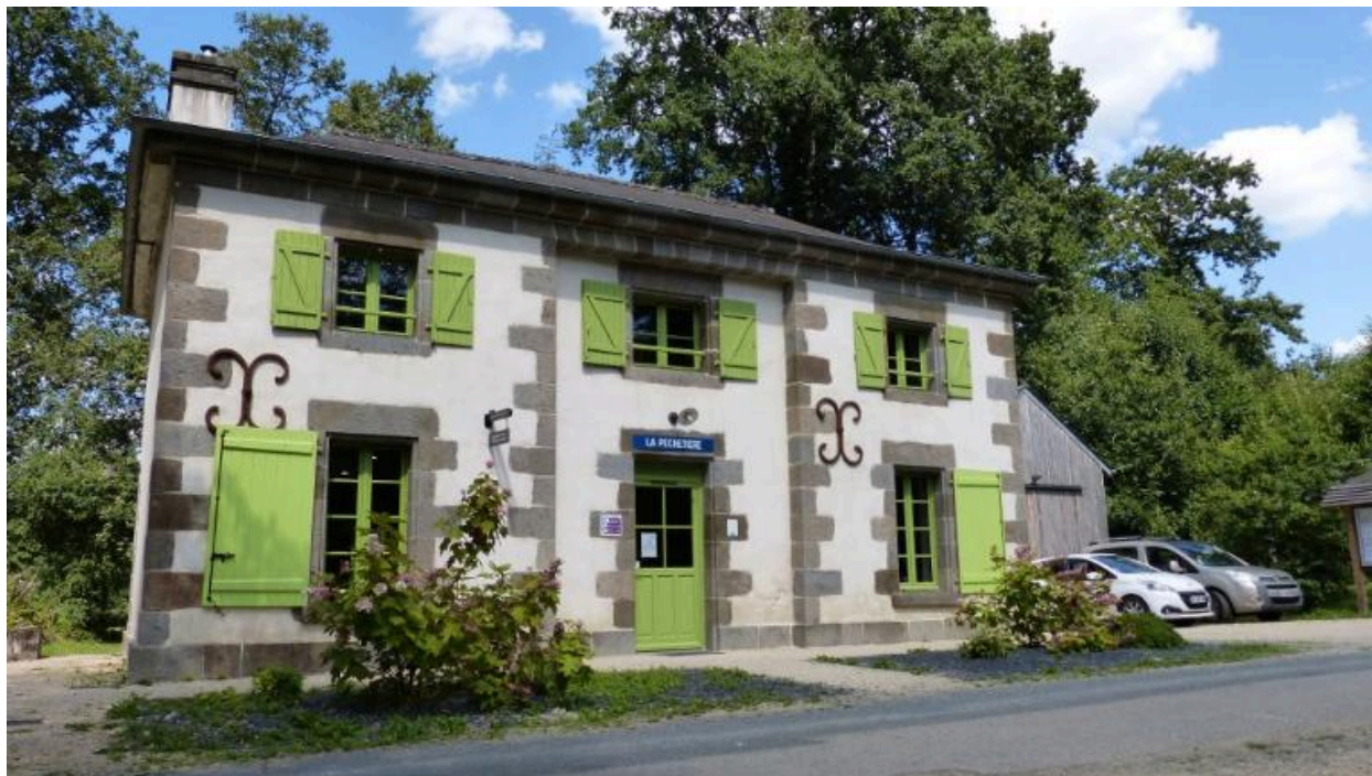
Vue sud, La Pêchetière (Hédé-Bazouges)