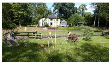
Vue sud IVR53_20243531619NUCA