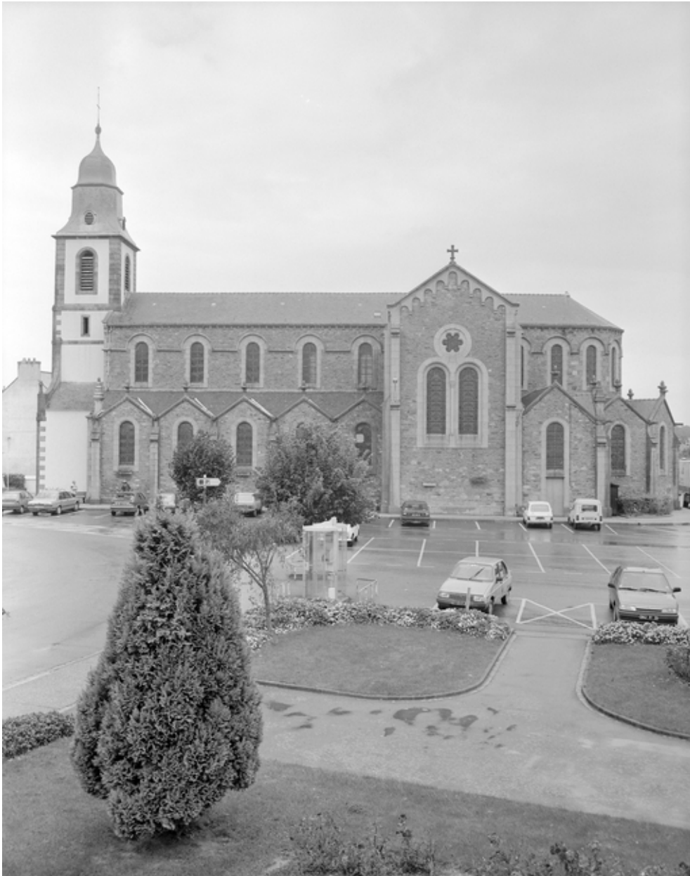
Elévation Sud : vue générale