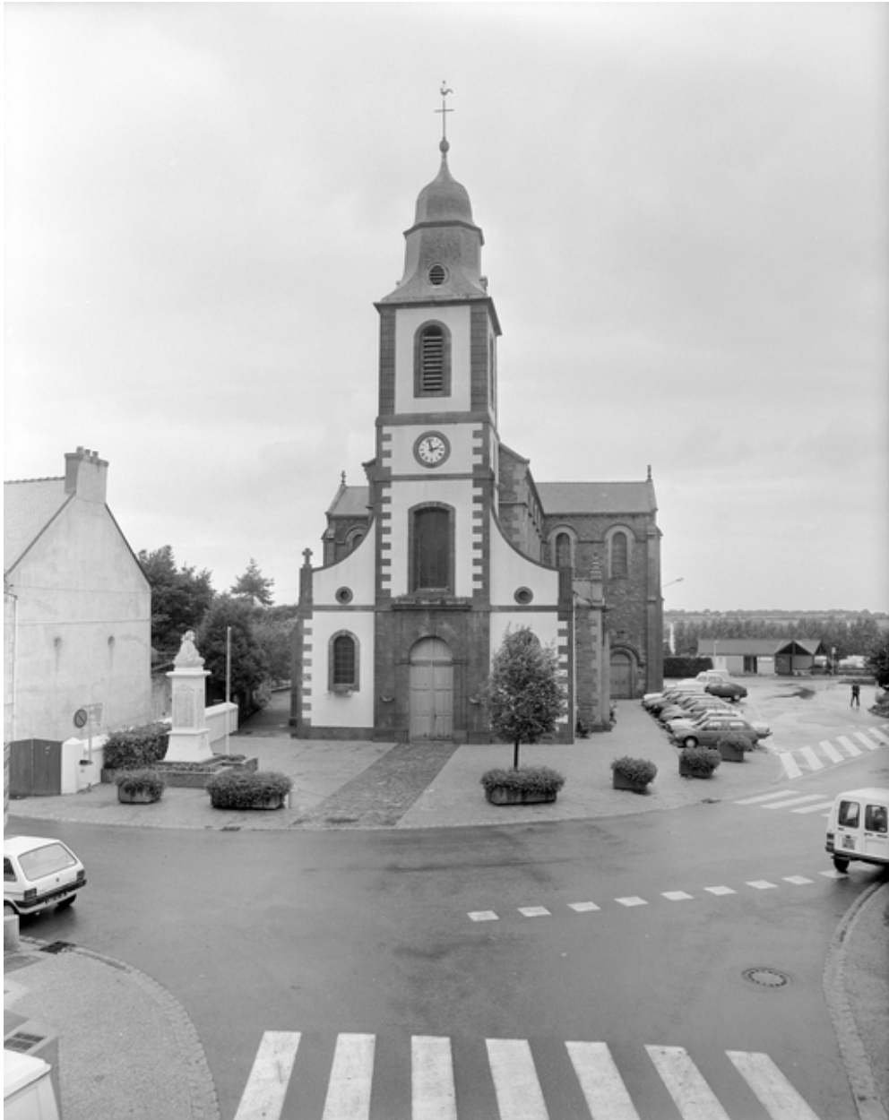
Elévation Ouest : vue générale