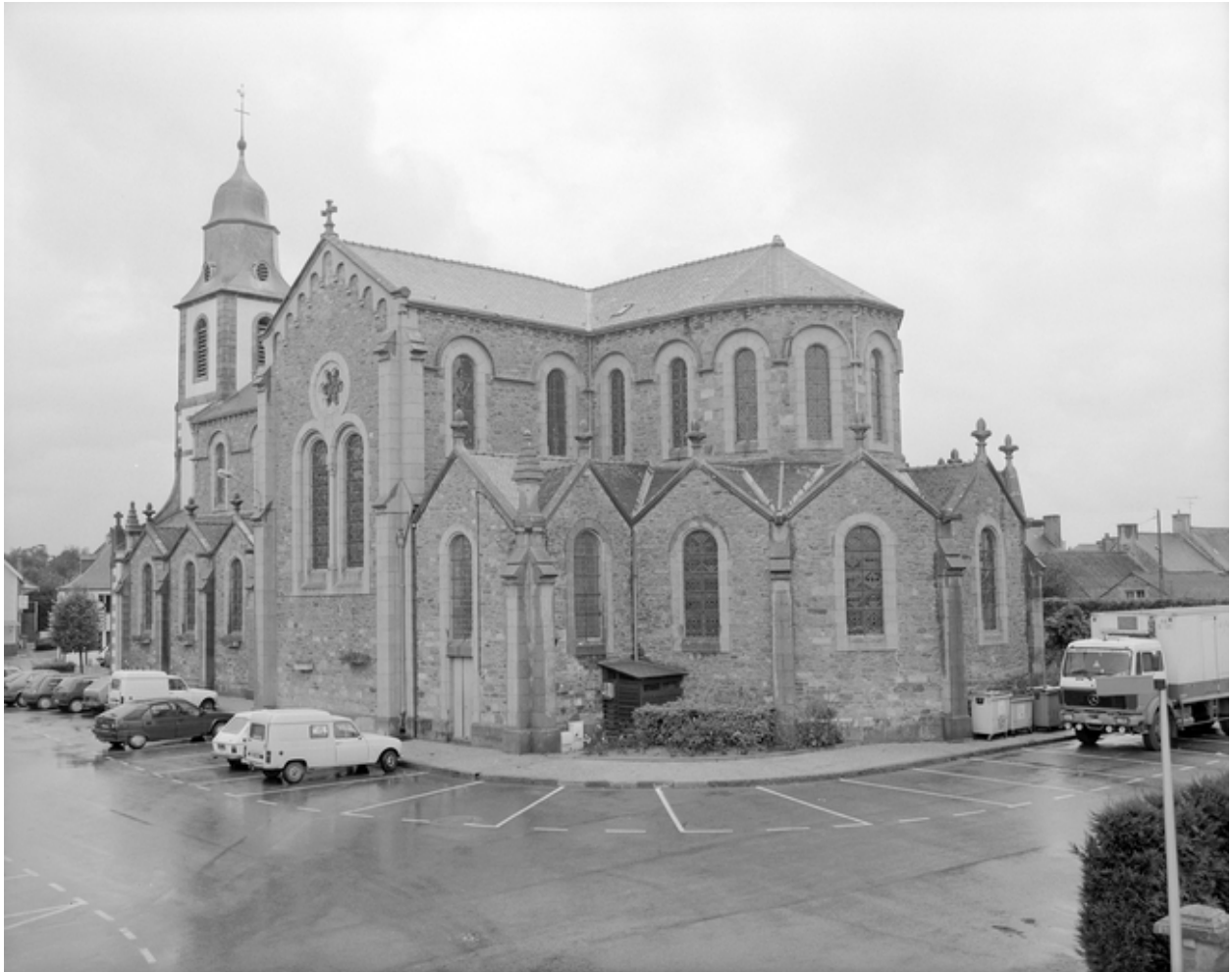
Elévation Est : vue générale