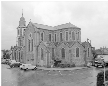
Elévation Est : vue générale IVR53_19943501859X