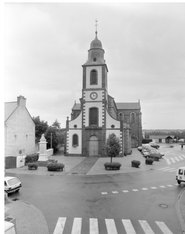
Elévation Ouest : vue générale IVR53_19943501861X