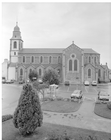
Elévation Sud : vue générale IVR53_19943501865X