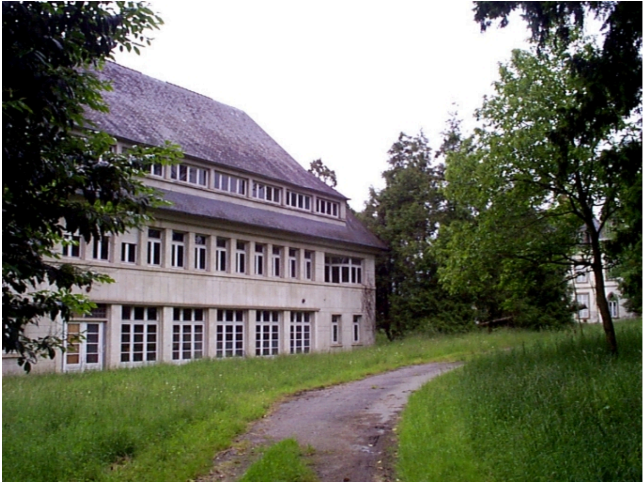
Vue du situation ; le château à droite sur l'image