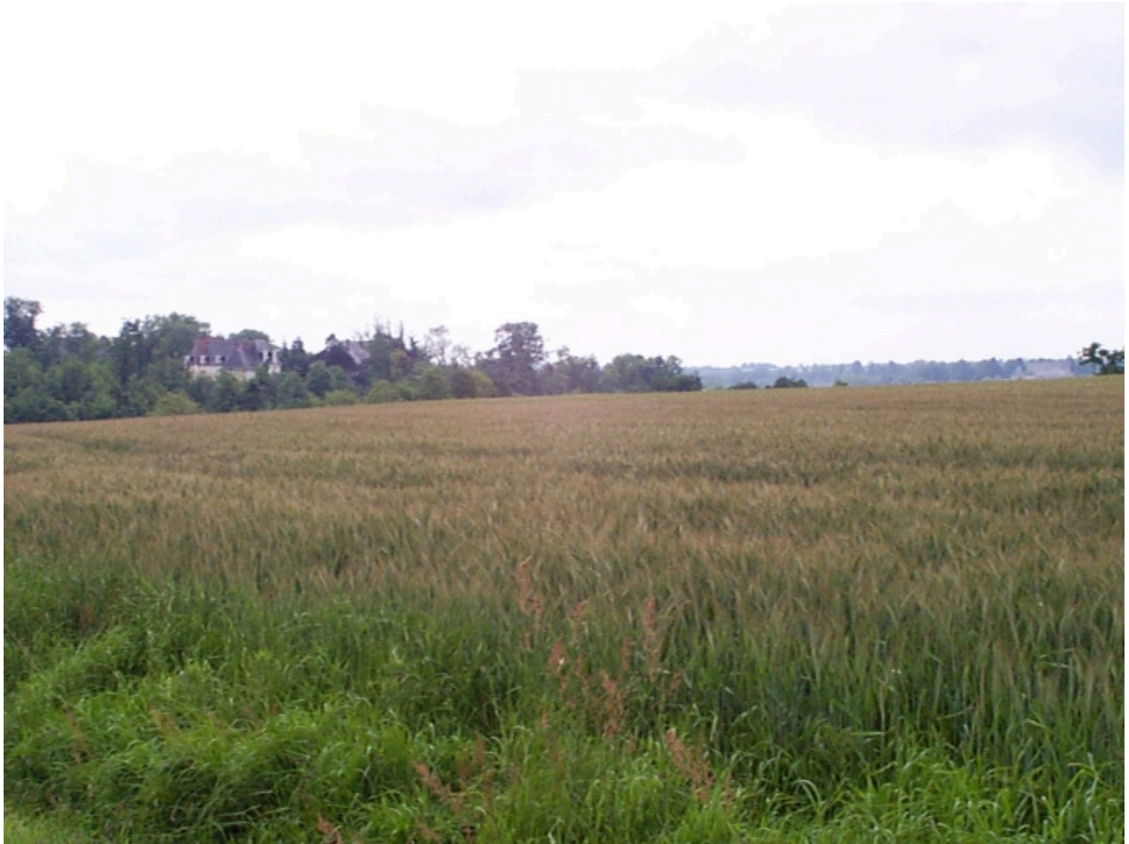
Vue de situation nord