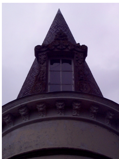
Une lucarne sur la tour est IVR53_20003508069NUCA