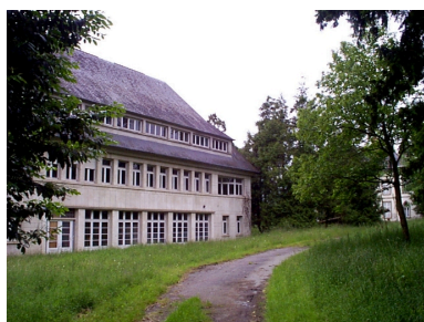
Vue du situation ; le château à droite sur l'image IVR53_20003508073NUCA