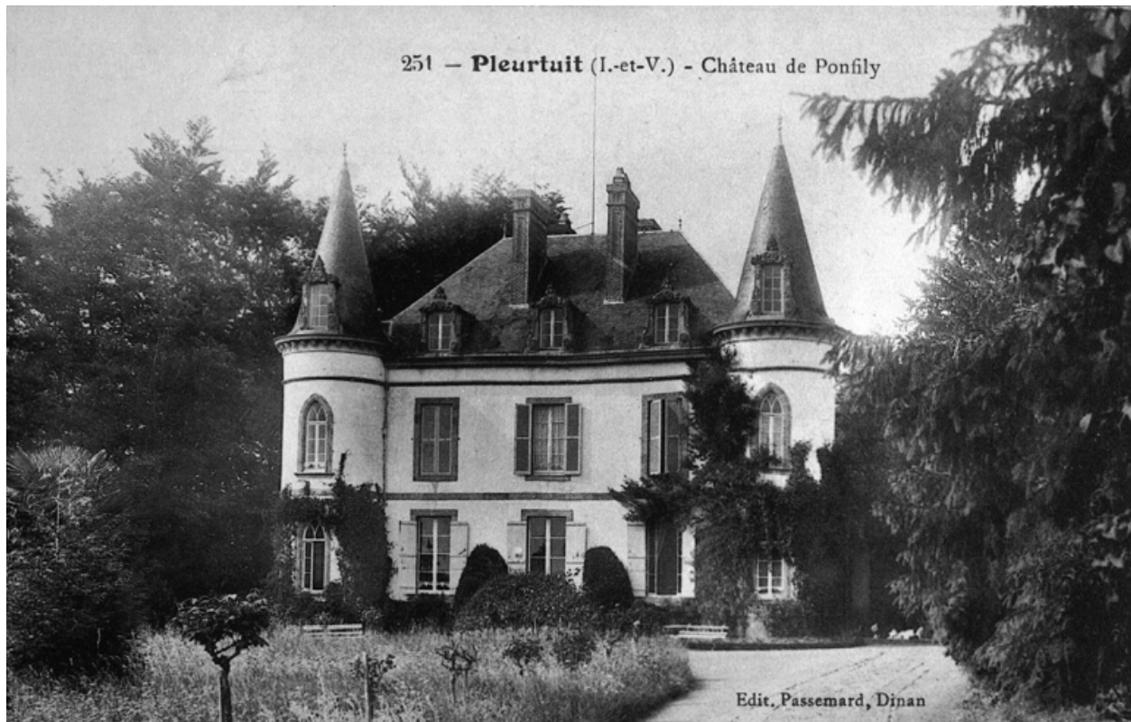
Le château dit de Pontfily au début du 20e siècle