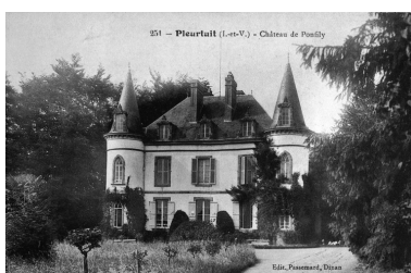
Le château dit de Pontfily au début du 20e siècle