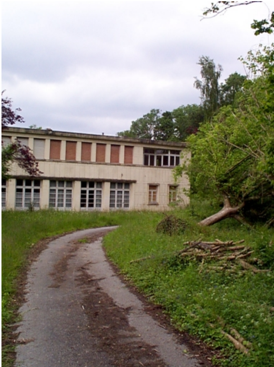
Détail : bâtiment moderne au nord