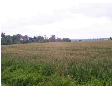
Vue de situation nord