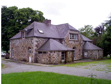
Communs du château IVR53_20003508074NUCA