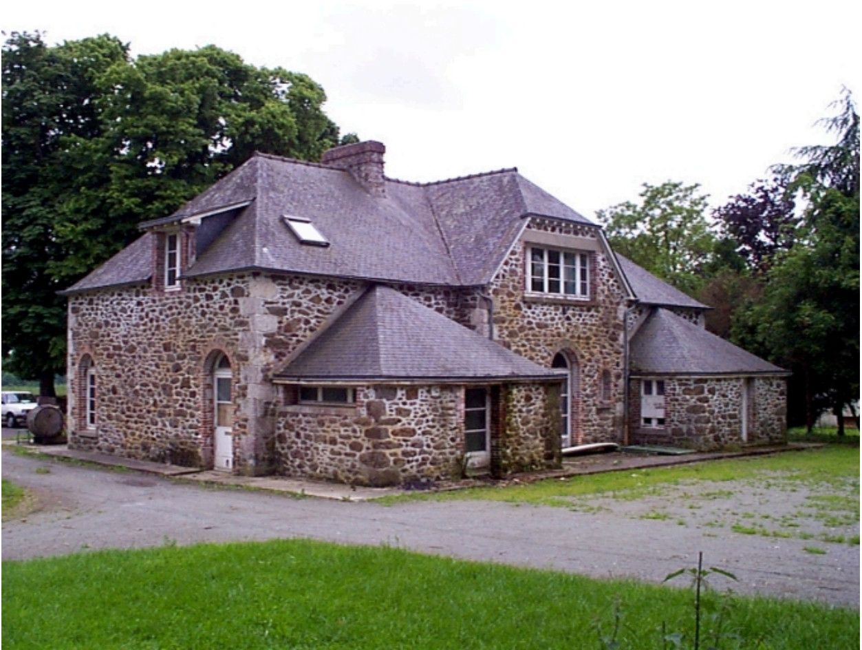
Communs du château