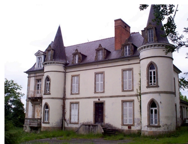
Vue générale sud IVR53_20003508068NUCA