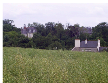
Vue de situation nord-ouest IVR53_20003508059NUCA