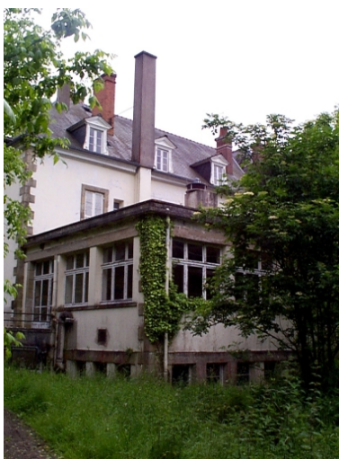
Détail : façade nord du château IVR53_20003508072NUCA