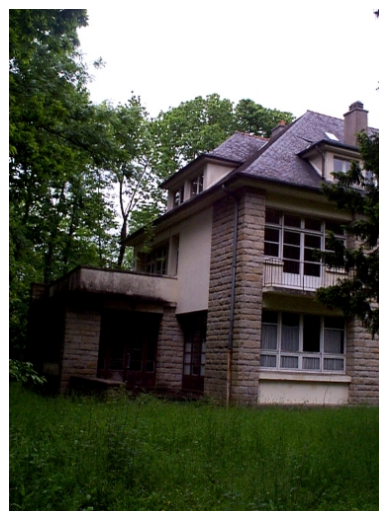
Détail : bâtiment moderne au nord est