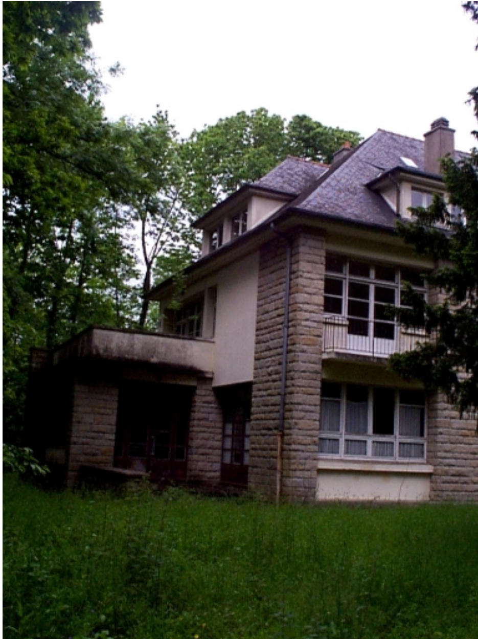
Détail : bâtiment moderne au nord est