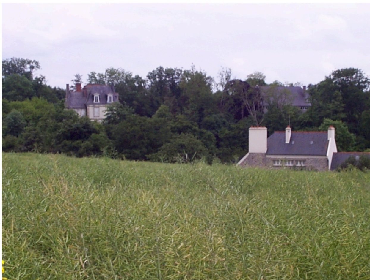
Vue de situation nord-ouest