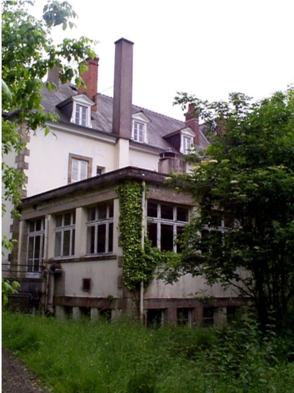
Détail : façade nord du château