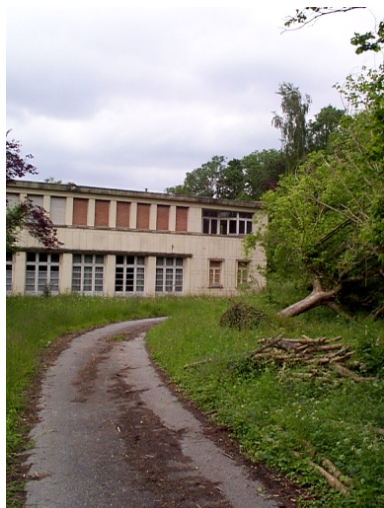
Détail : bâtiment moderne au nord IVR53_20003508071NUCA