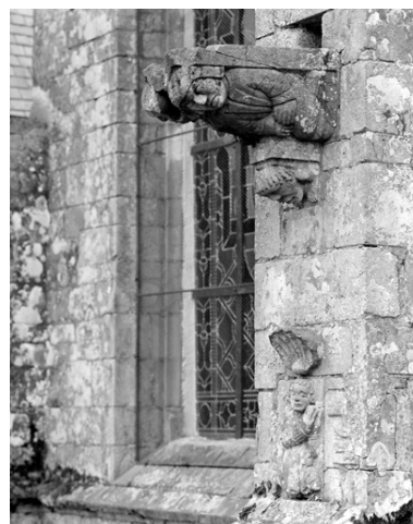
Façade nord, détail gargouille et décor sculpté IVR53_19943501498X