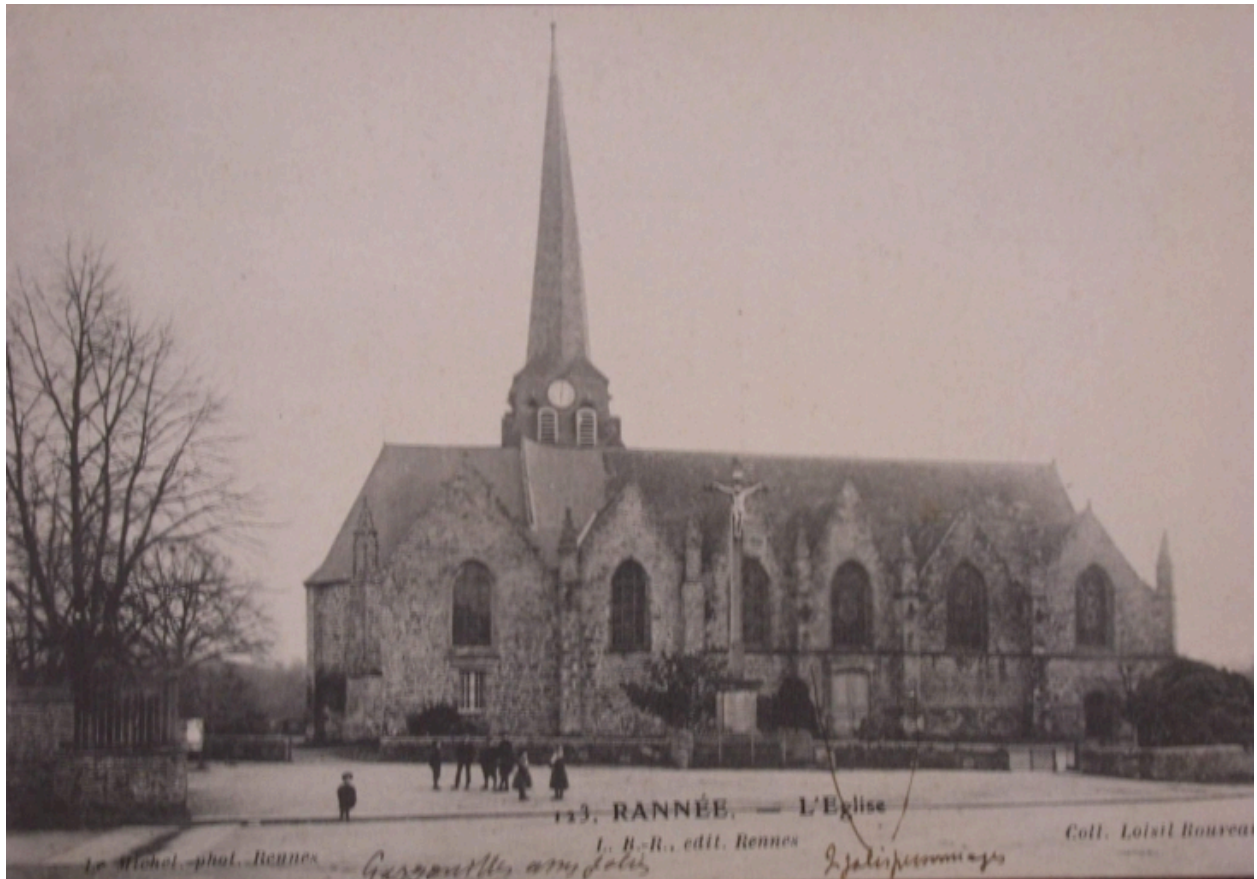
L'église, au début du 20e siècle, (carte postale, A.D. Ille-et-Vilaine : 6Fi)