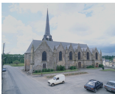
Vue générale de la façade nord IVR53_19953500333XA