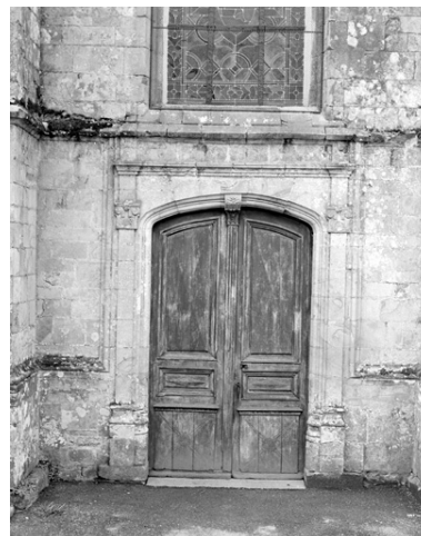
Façade nord, portail IVR53_19943501494X

Vue intérieure, au début du 20e siècle (carte postale, A.D. Ile-et-Vilaine : 6Fi) IVR53_19933500848XB