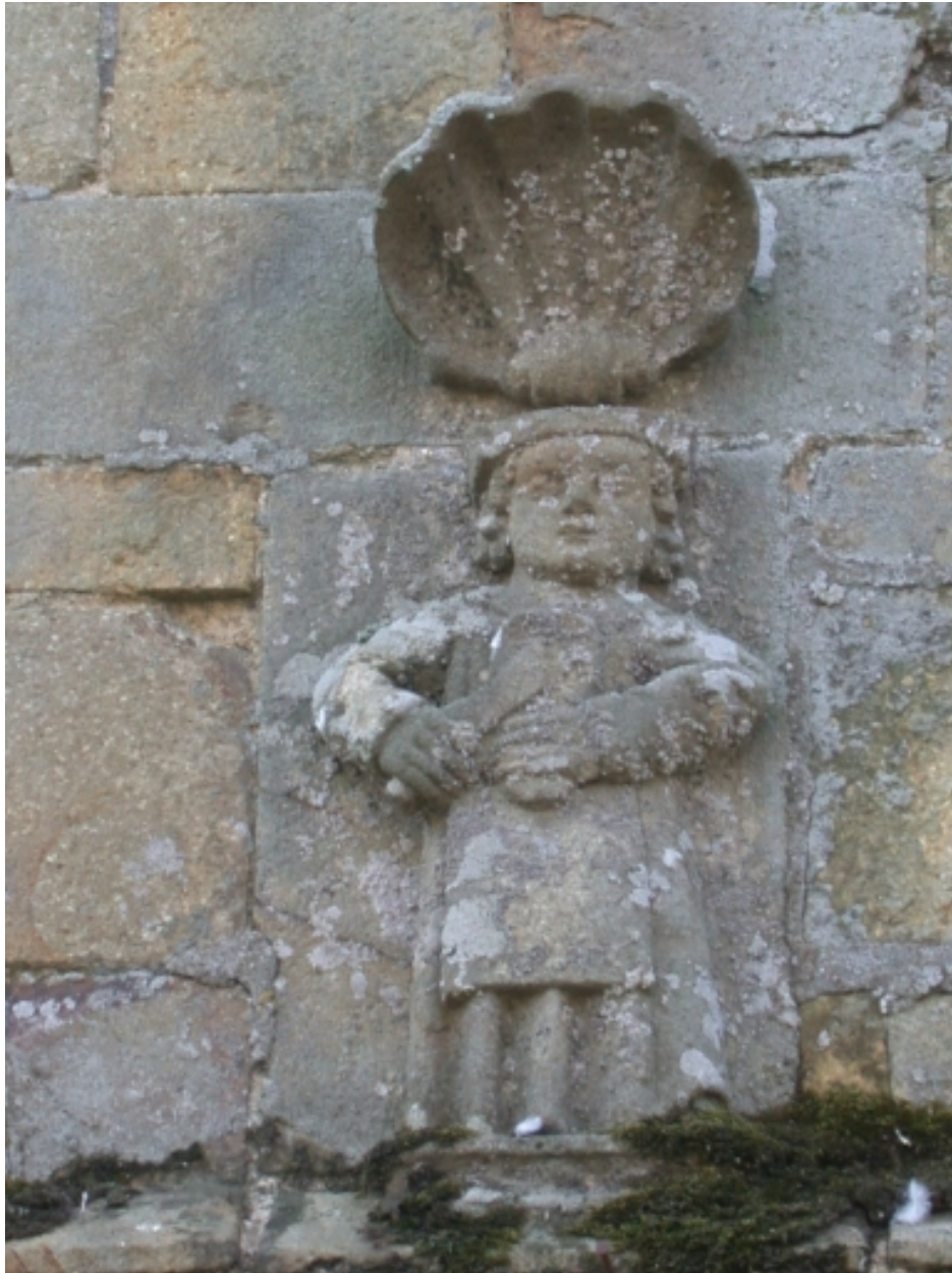
Façade nord, demi-relief, détail : saint Crépin ?, saint Crépinien?