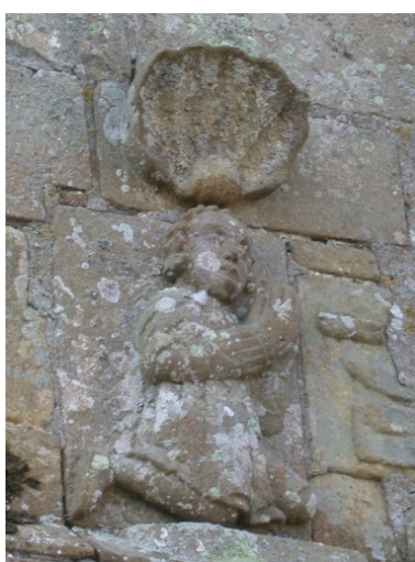
Façade nord, détail bas-relief, donateur