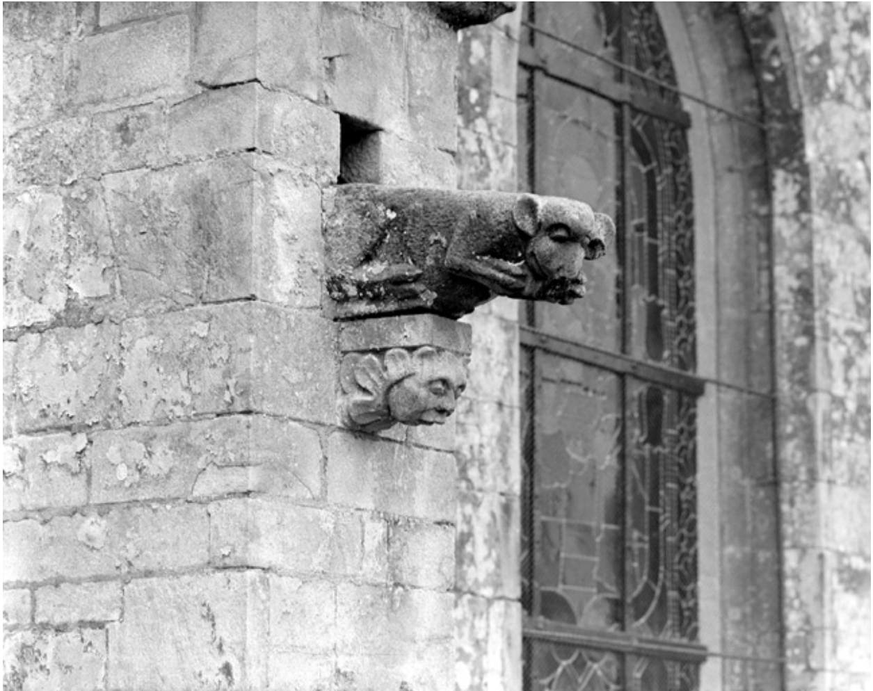
Façade nord, détail, console et gargouille