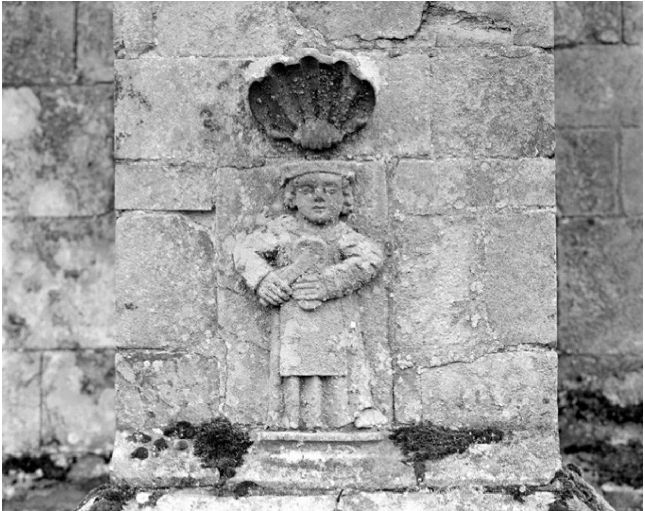
Façade nord, détail d'un bas relief représentant saint Crépin ou saint Crépinien