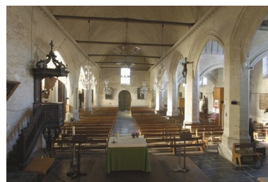
Vue intérieure prise du chœur vers la nef IVR53_20053500188NUCA