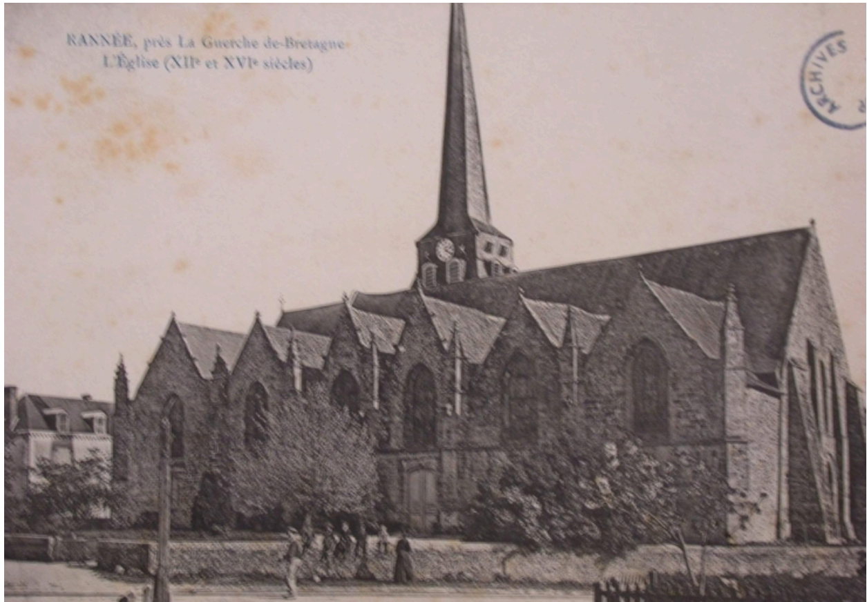
L'église au début du 20e siècle, (carte postale, A.D. Ile-et-Vilaine : 6Fi)