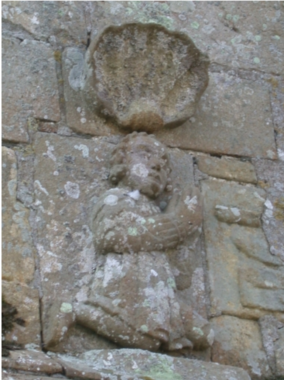
Façade nord, détail bas-relief, donateur