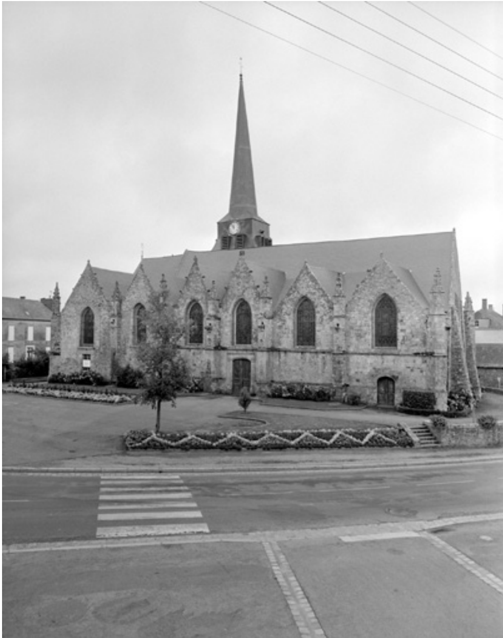
Vue générale de la façade nord