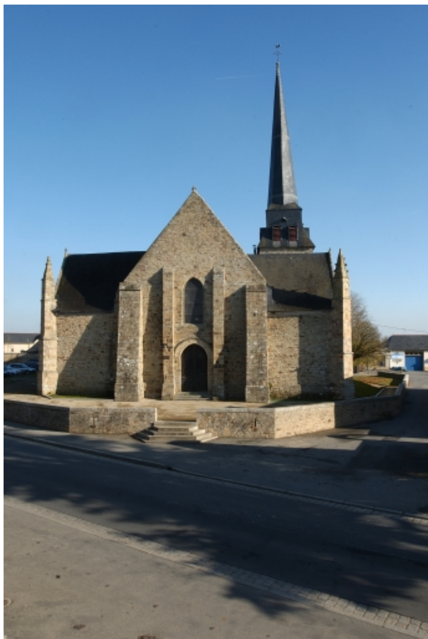
Vue générale de la façade ouest