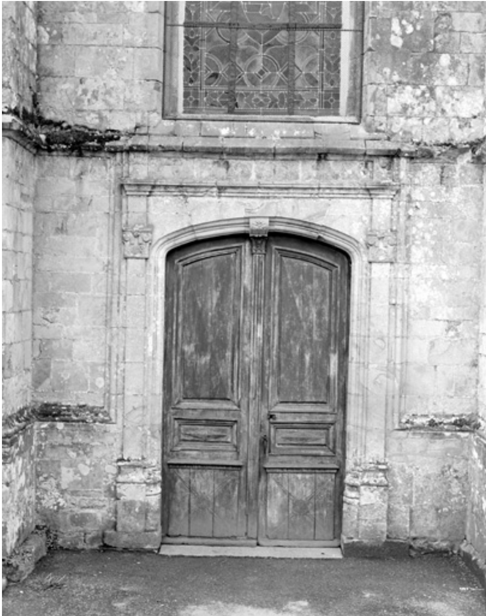
Façade nord, portail