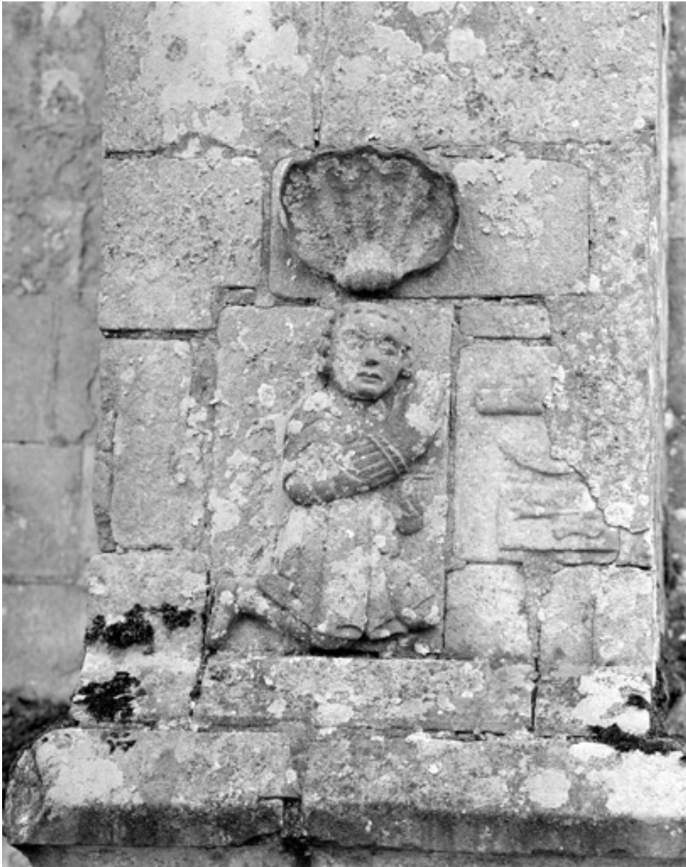
Façade nord, détail du bas relief, donateur agenouillé