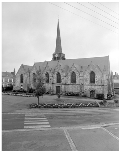
Vue générale de la façade nord IVR53_19943501493X

L'église, au début du 20e siècle, (carte postale, A.D. Ile-et-Vilaine : 6Fi) IVR53_20043516591NUCA