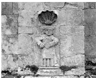
Façade nord, détail d'un bas relief représentant saint Crépin ou saint Crépinien IVR53_19943501497X