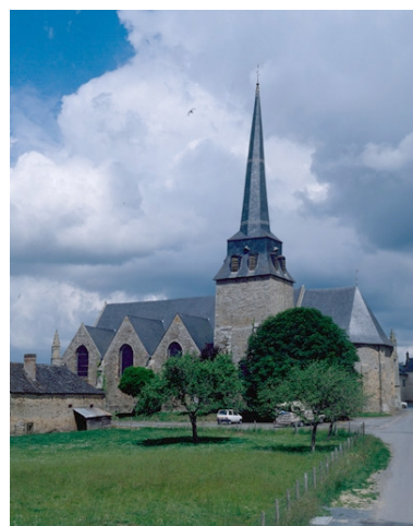
Vue générale de la façade sud