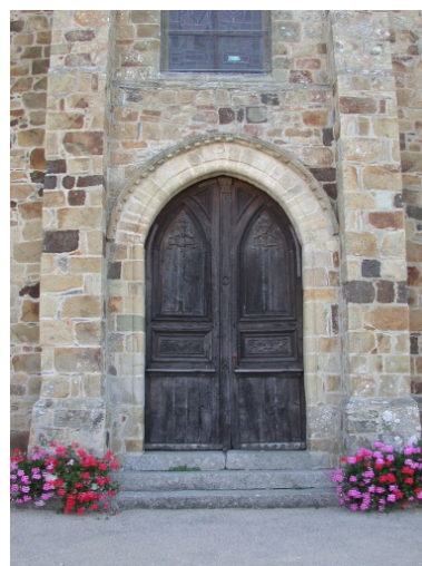
Portail ouest IVR53_20043516595NUCA