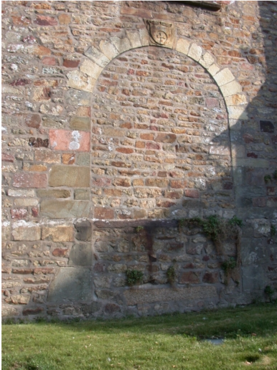
Façade sud, détail portail muré