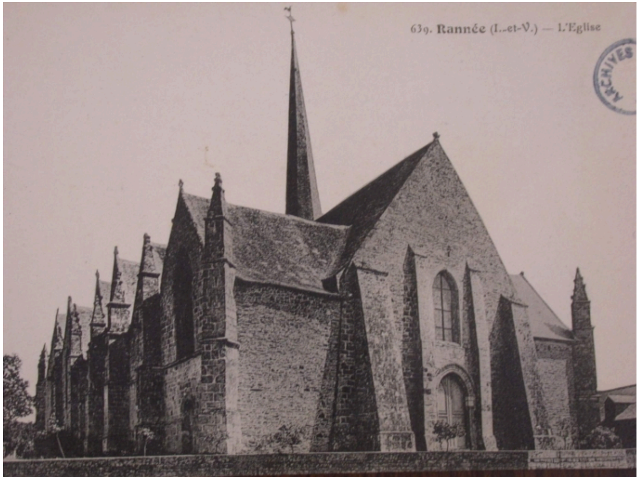
L'église, au début du 20e siècle, (carte postale, A.D. Ille-et-Vilaine : 6Fi)