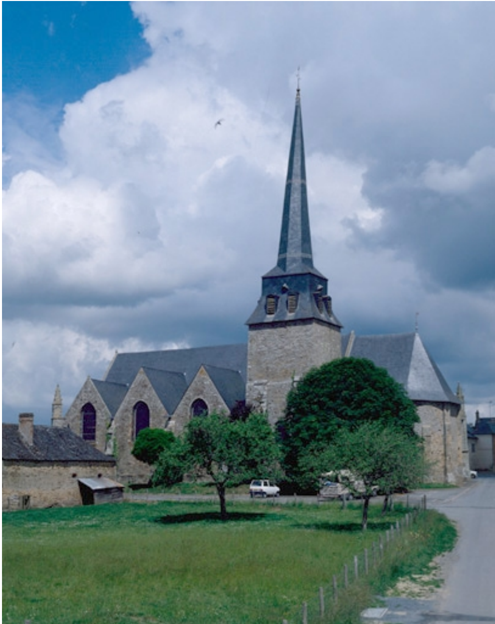
Vue générale de la façade sud