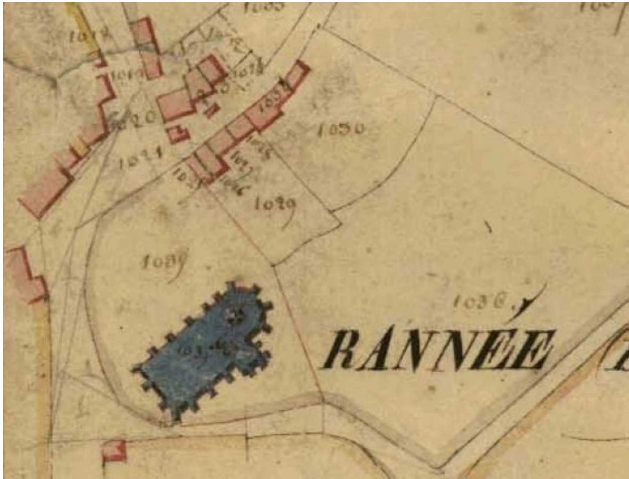
Extrait du cadastre de 1827