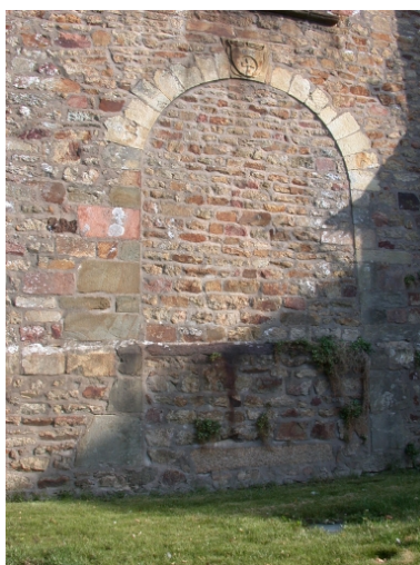
Façade sud, détail portail muré IVR53_20043516593NUCA