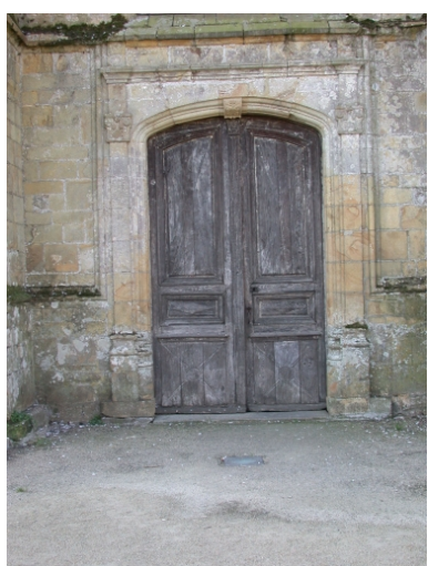
Portail nord