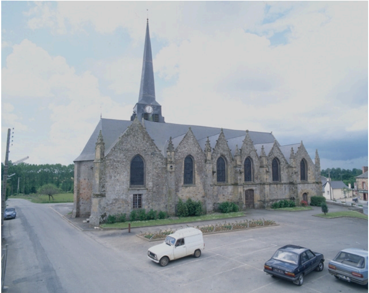
Vue générale de la façade nord