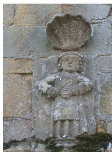
Façade nord, demi-relief, détail : saint Crépin ?, saint Crépinien?