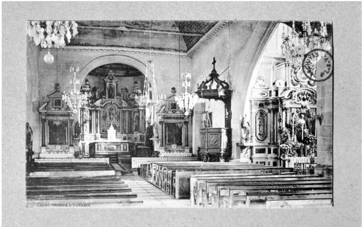
Vue intérieure, au début du 20e siècle (carte postale, A.D. Ille-et-Vilaine : 6Fi)