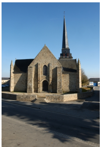
Vue générale de la façade ouest IVR53_20043502650NUCA