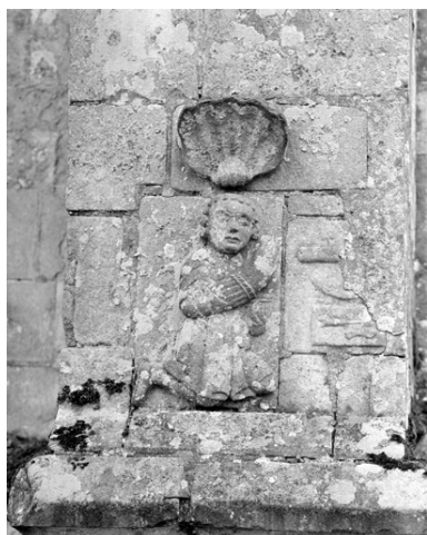
Façade nord, détail du bas relief, donateur agenouillé