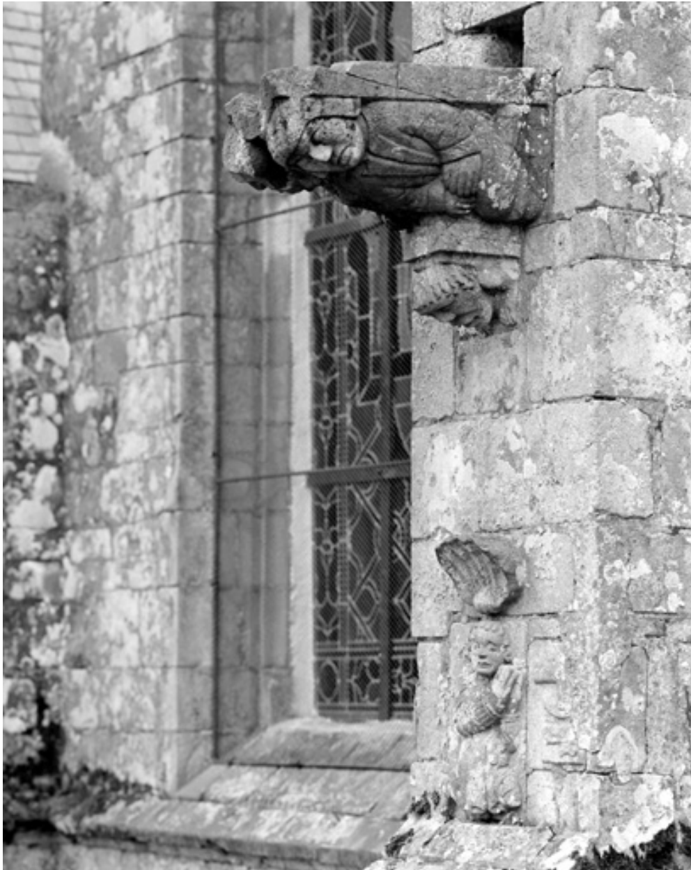
Façade nord, détail gargouille et décor sculpté