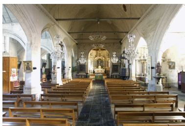
Vue intérieure prise de la nef vers le chœur IVR53_20053500187NUCA