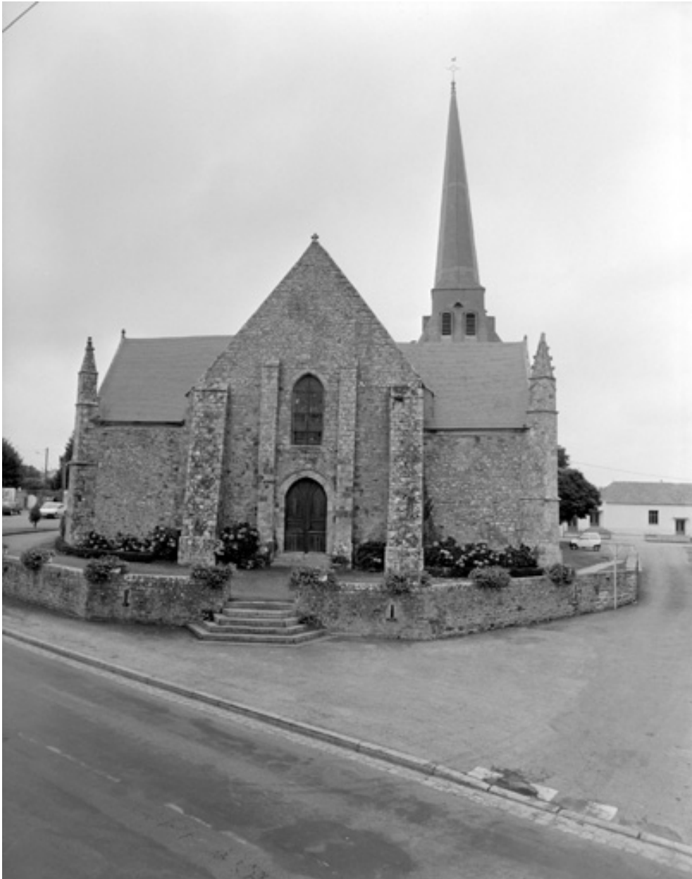
Vue générale de la façade ouest