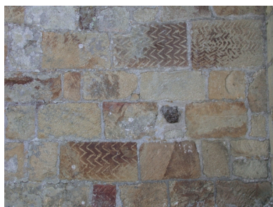
Façade nord, détail de la mise en oeuvre, pierres avec décor taillé en chevrons IVR53_20043516598NUCA