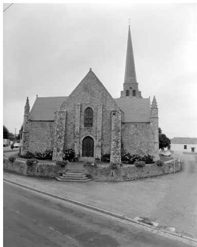
Vue générale de la façade ouest IVR53_19943501492X

L'église au début du 20e siècle, (carte postale, A.D. Ile-et-Vilaine : 6Fi) IVR53_20043516590NUCA