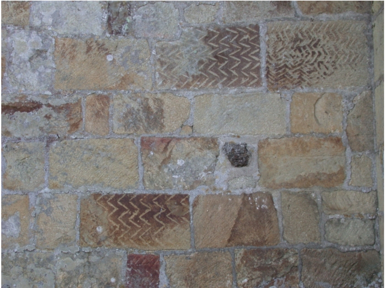
Façade nord, détail de la mise en oeuvre, pierres avec décor taillé en chevrons