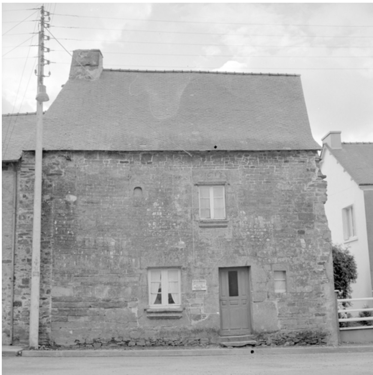
Elévation nord, vue générale.