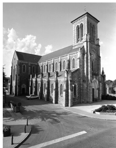
Vue générale nord-est IVR53_19943501755X