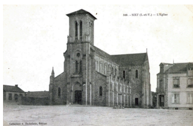
L'élévation nord de l'église sur une carte postale ancienne IVR53_20003502767X