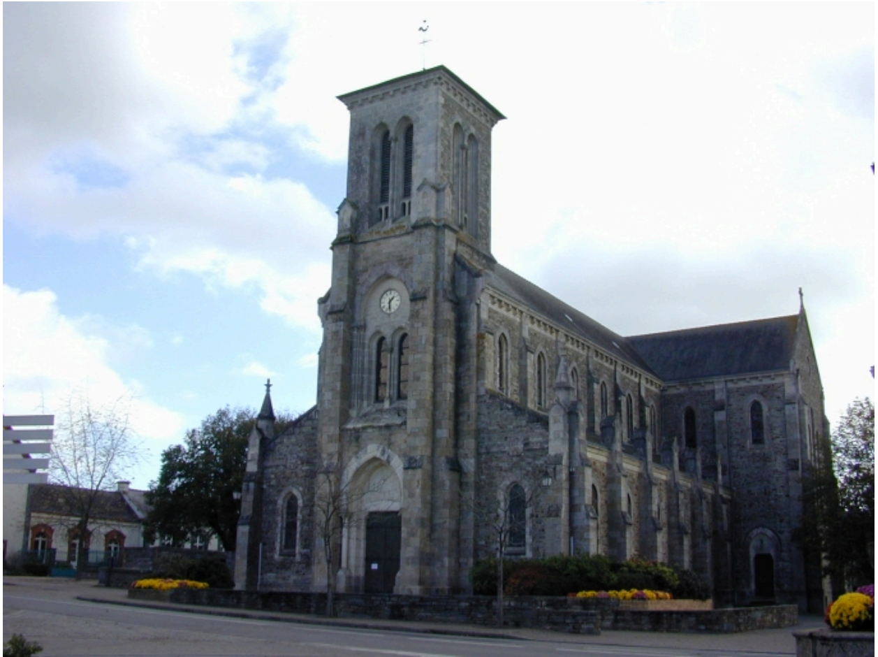
Vue générale nord-ouest