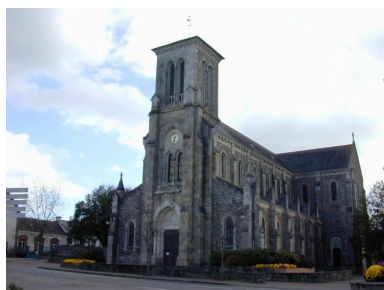
Vue générale nord-ouest IVR53_20003511387NUCA