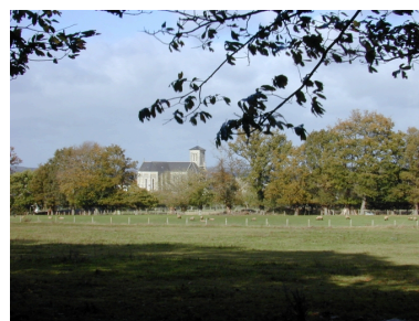
Vue de situation depuis le sud IVR53_20003511382NUCA