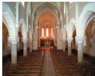
Intérieur : vue générale vers le chœur