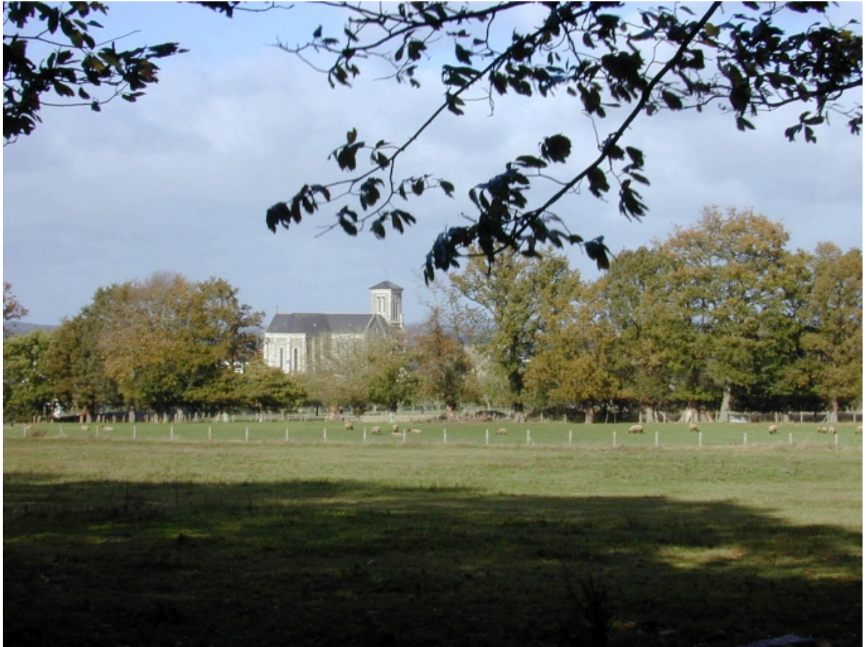
Vue de situation depuis le sud