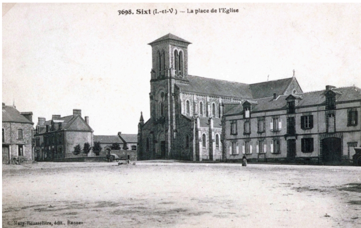
L'église vue depuis la place Charles Gaulle sur une carte postale ancienne