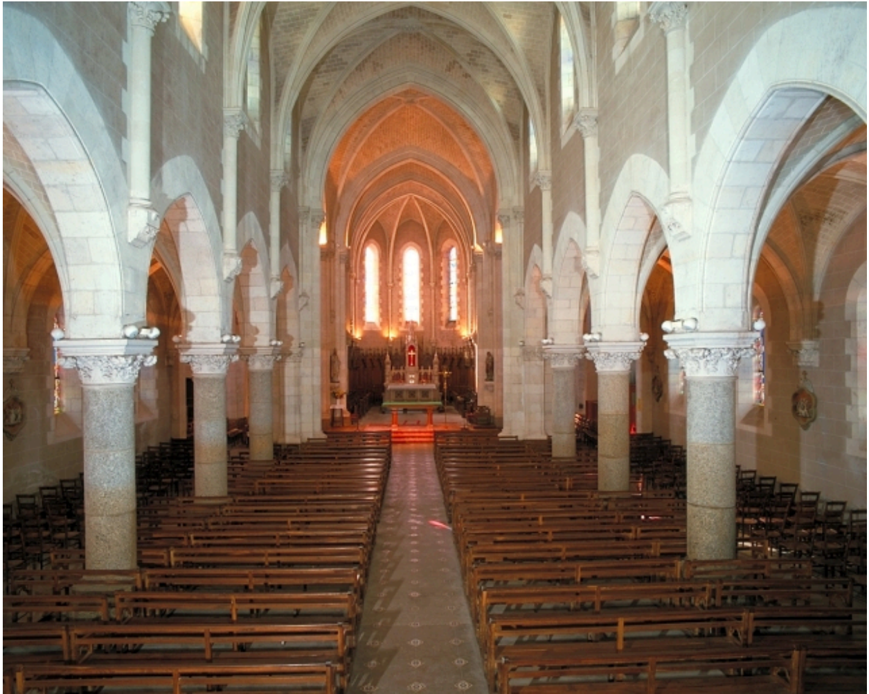
Intérieur : vue générale vers le chœur