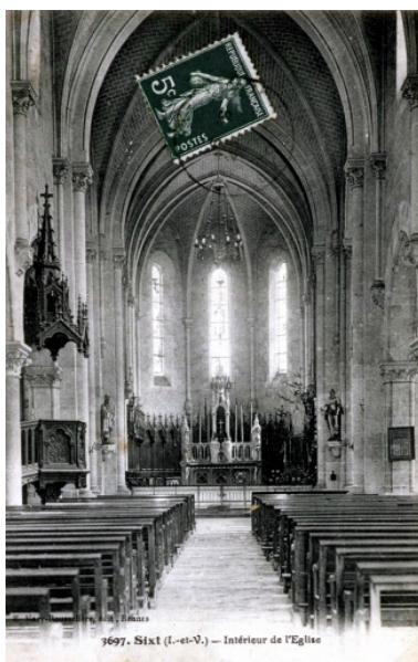
Carte postale ancienne présentant l'intérieur de l'église