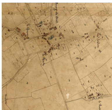
L'ancienne église paroissiale représentée en bleu sur la cadastre de 1831