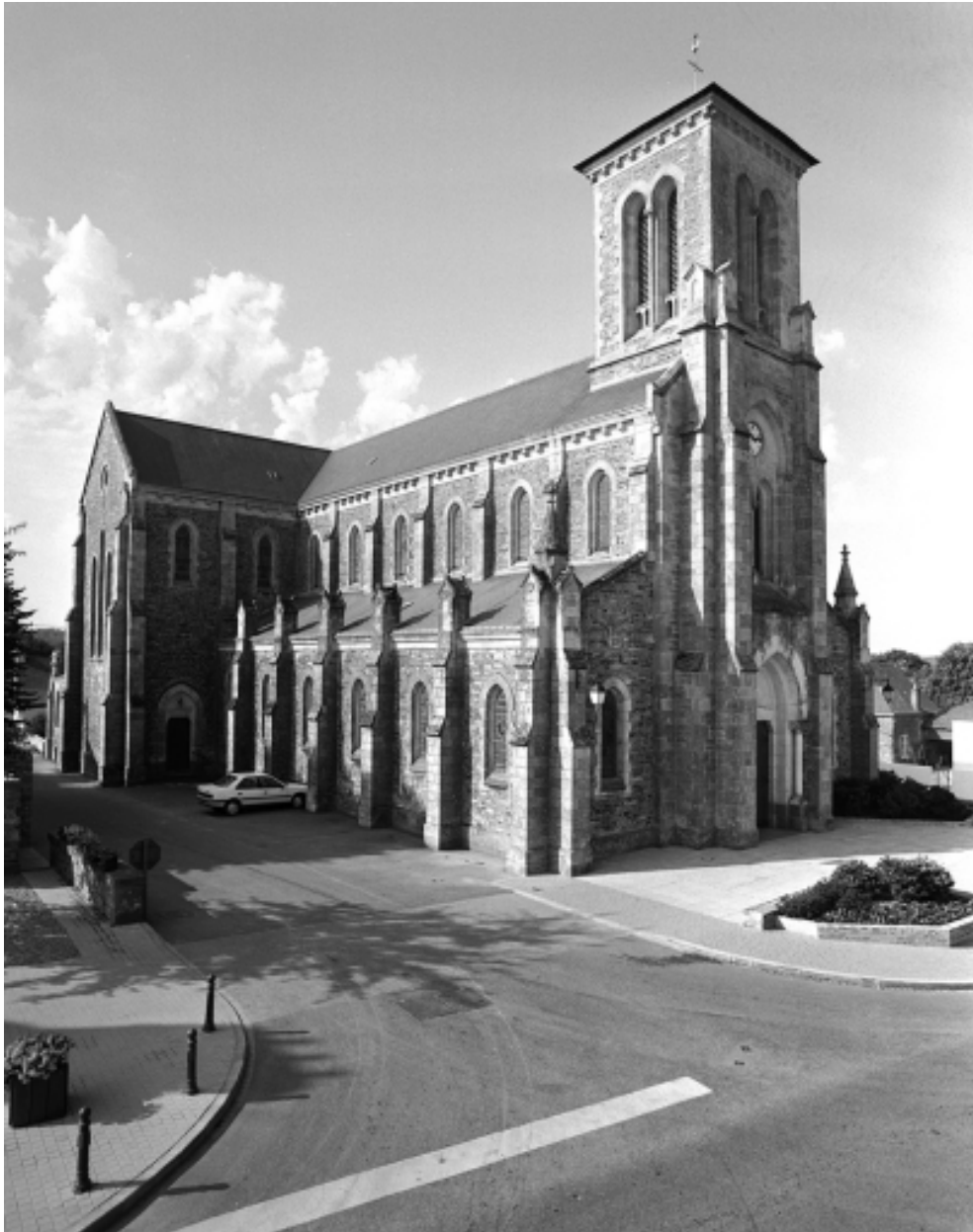
Vue générale nord-est