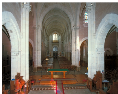
Intérieur : vue générale vers la nef

Vue générale sud