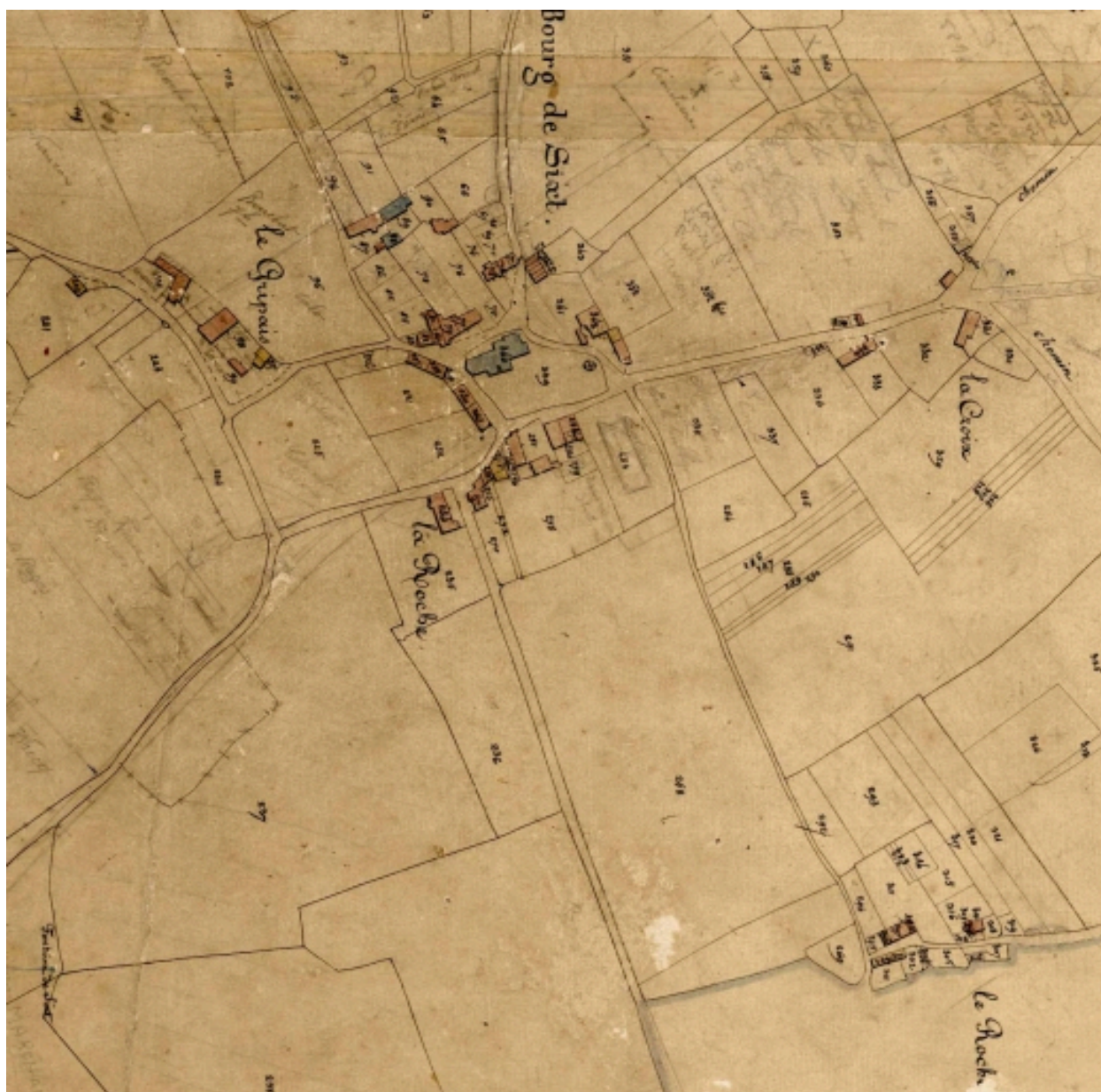
L'ancienne église paroissiale représentée en bleu sur la cadastre de 1831