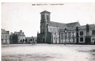
L'église vue depuis la place Charles Gaulle sur une carte postale ancienne IVR53_20003502773X