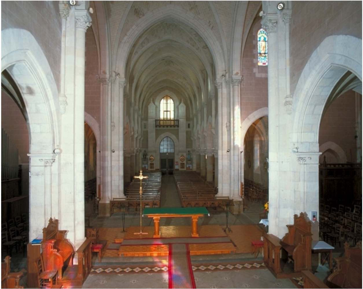
Intérieur : vue générale vers la nef