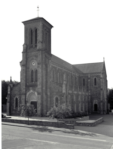
Vue générale nord-ouest IVR53_19943501754X