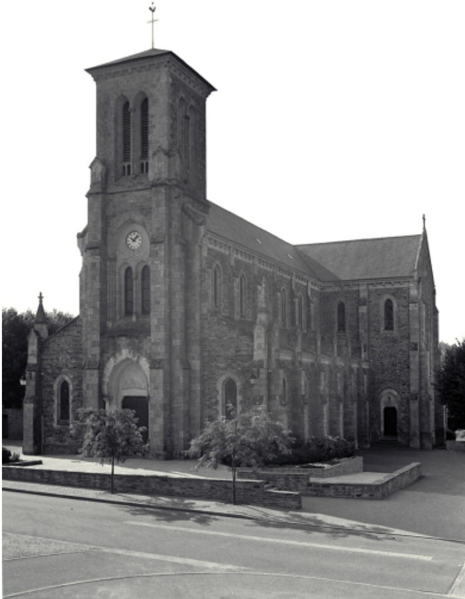
Vue générale nord-ouest