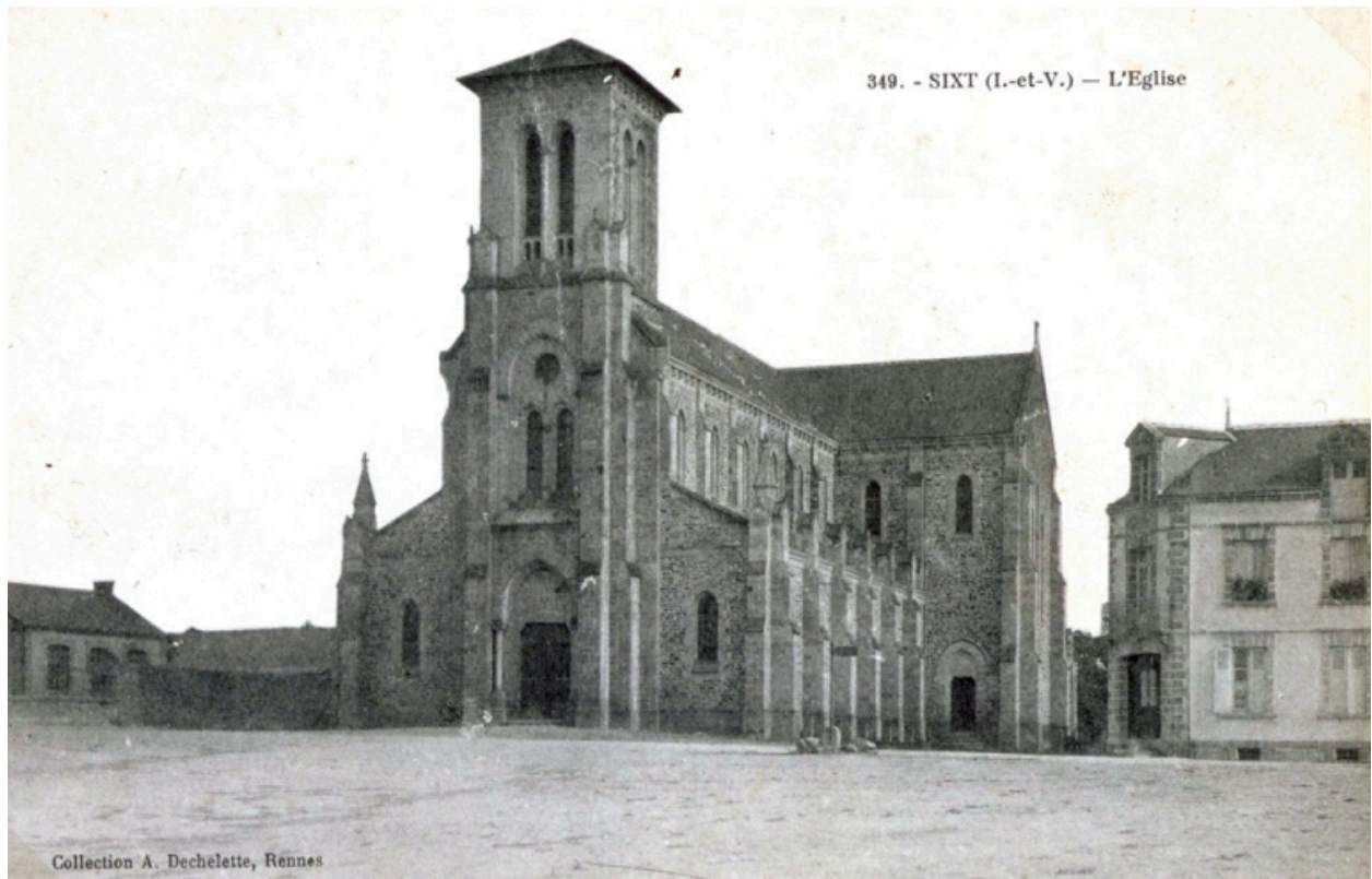
L'élévation nord de l'église sur une carte postale ancienne