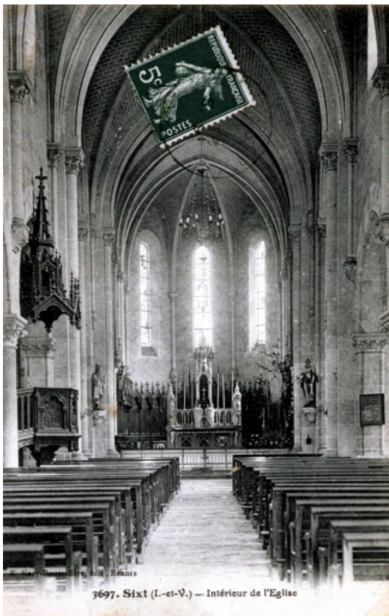
Carte postale ancienne présentant l'intérieur de l'église