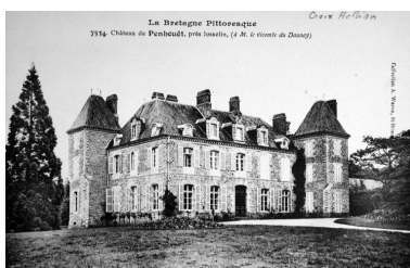
Château de Penhouët, près Josselin, carte postale 1er quart 20e siècle