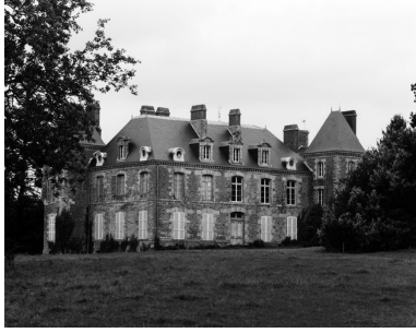
Vue sud-ouest IVR53_19915600724X