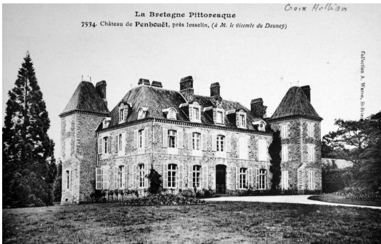
Château de Penhouët, près Josselin, carte postale 1er quart 20e siècle (A. D. Ille-&-Vilaine)