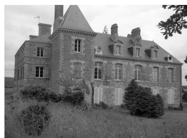
Elévation sud, IVR53_19915600723X