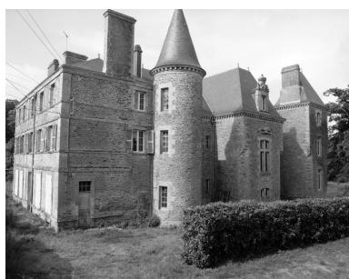
Elévation nord : vue rapprochée prise du nord-est IVR53_19915600721X