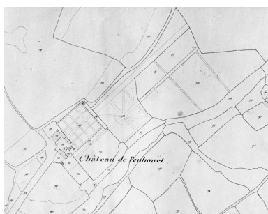
Le château de Penhouët sur le cadastre de 1831