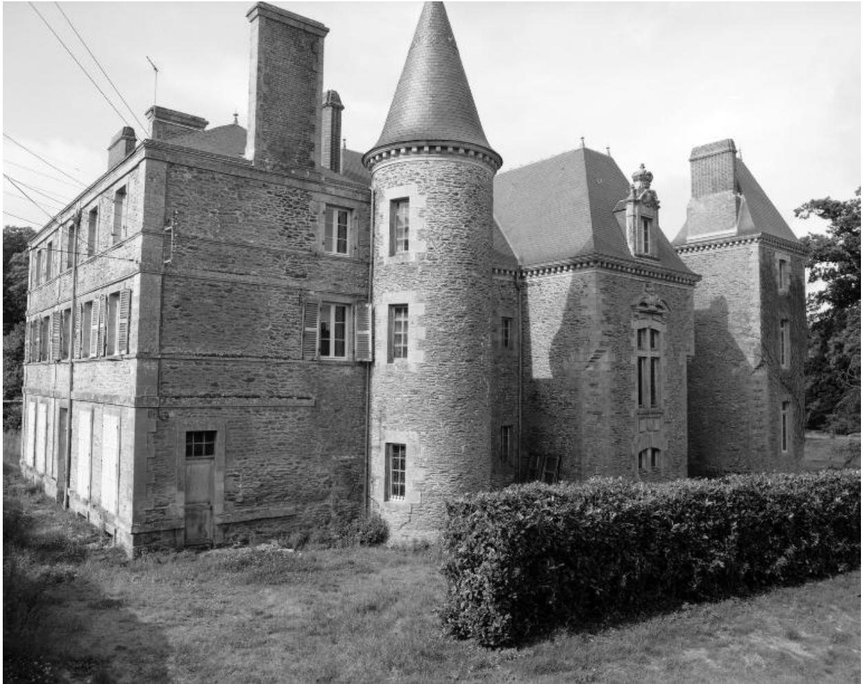
Elévation nord : vue rapprochée prise du nord-est