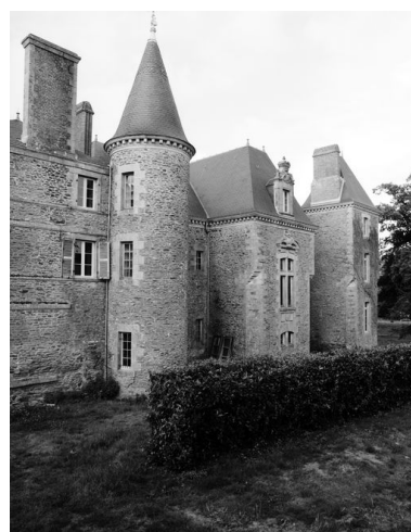
Elévation nord : vue générale prise du nord-est IVR53_19915600722X