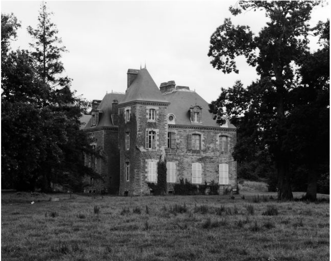
Elévation ouest : vue générale prise du nord-ouest