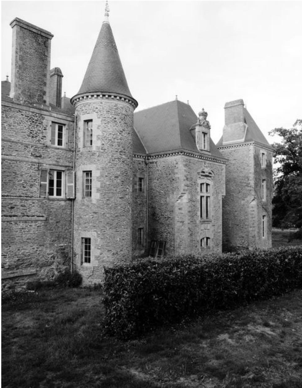
Elévation nord : vue générale prise du nord-est