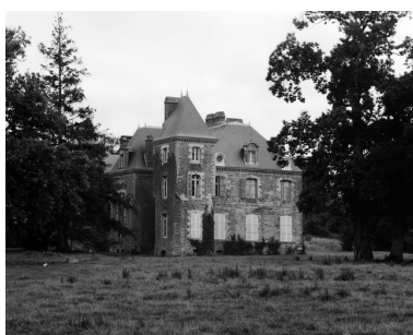
Elévation ouest : vue générale prise du nord-ouest