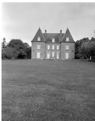
Élévation sud IVR53_19963500873X