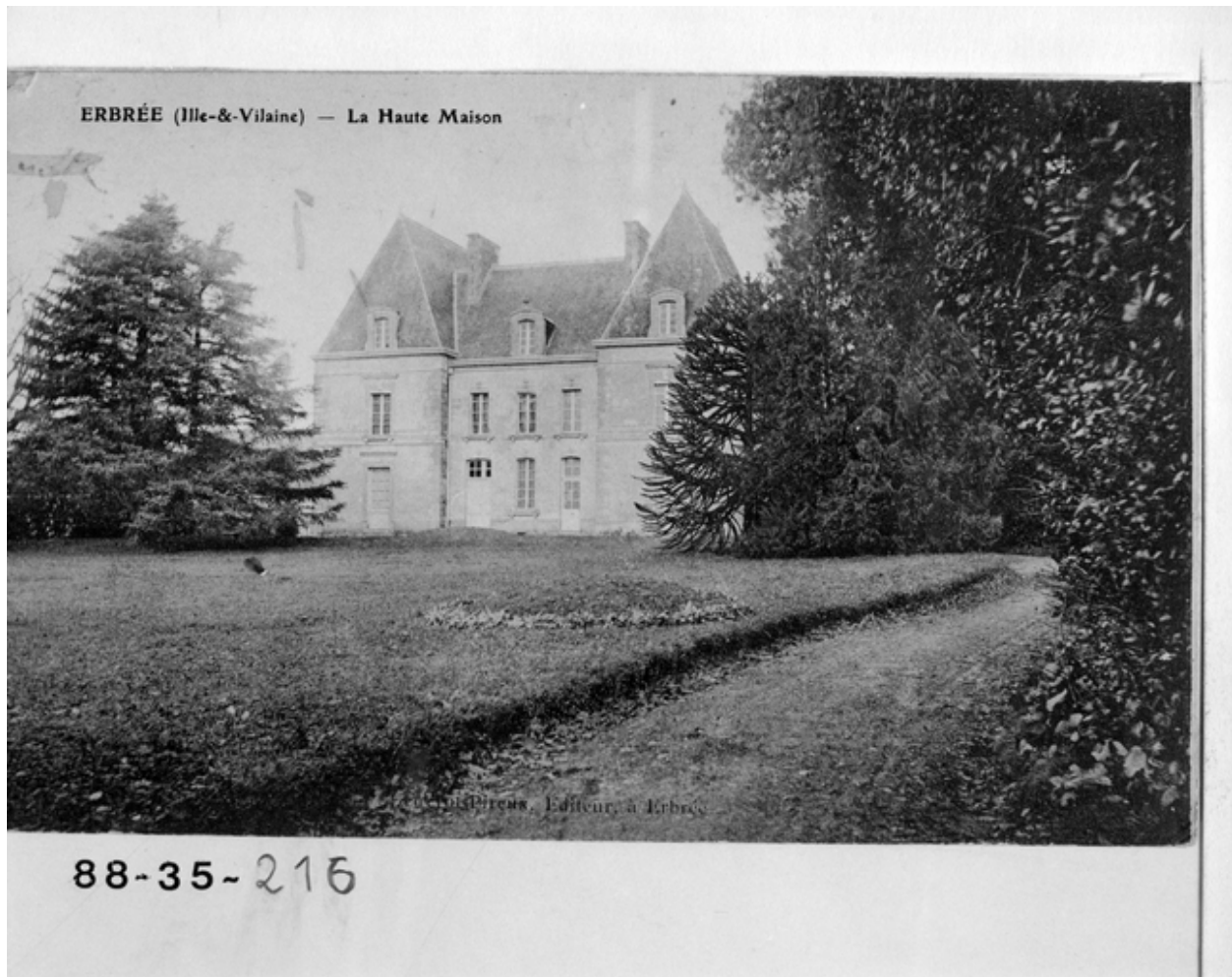
Erbrée (Ile-et-Vilaine) - La Haute Maison - Vue générale avec le parc. Carte postale ancienne.