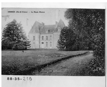
Erbrée (Ille-et-Vilaine) - La Haute Maison - Vue générale avec le parc. Carte postale ancienne. Fonds Lagrée. IVR53_19883500216X