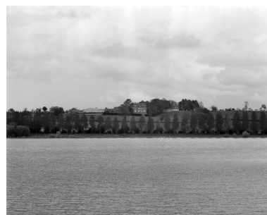
Vue de situation. IVR53_19963500877X