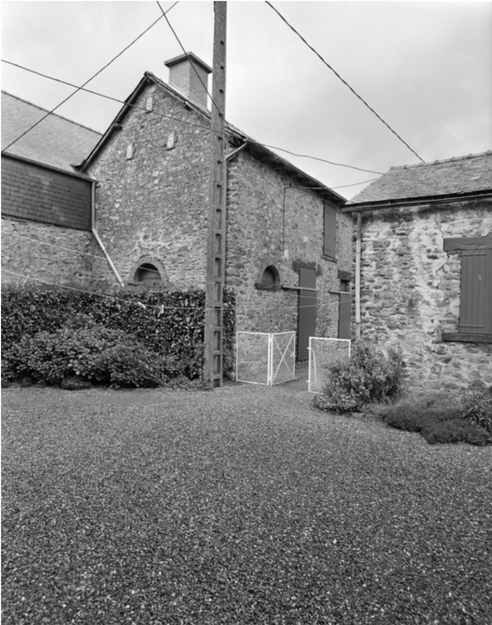
Elévation nord des communs