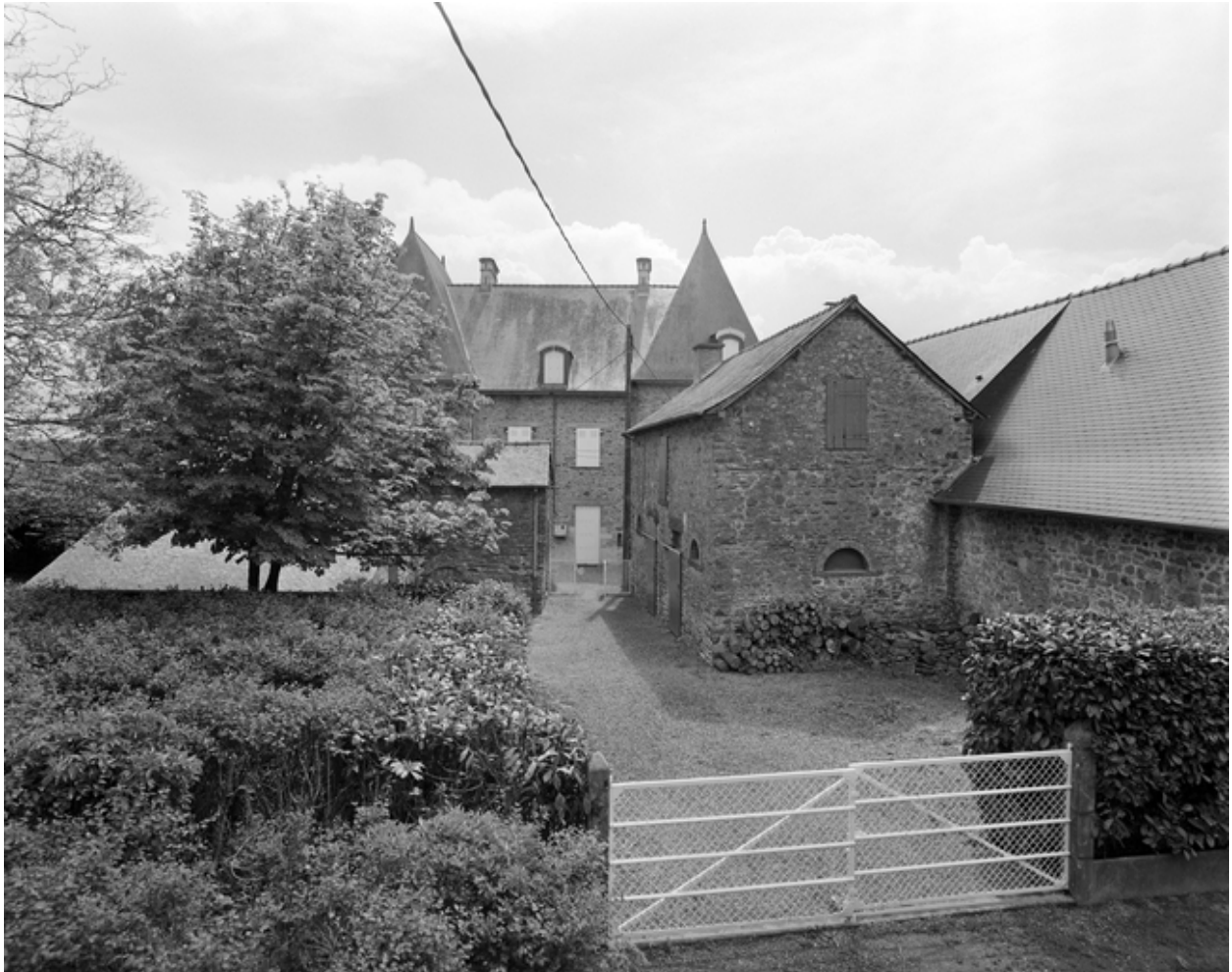
Elévation nord, avec les communs.