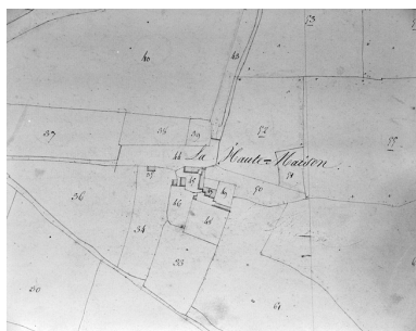
Plan de situation. Extrait cadastral 1824, feuille H1. IVR53_19963501018X