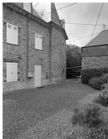
Élévation nord. IVR53_19963500874X