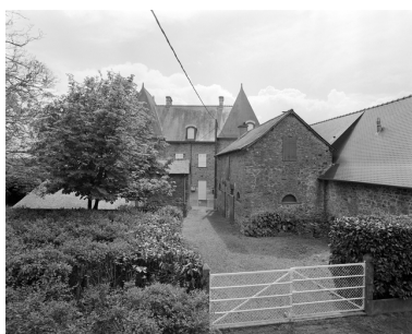
Élévation nord, avec les communs. IVR53_19963500876X