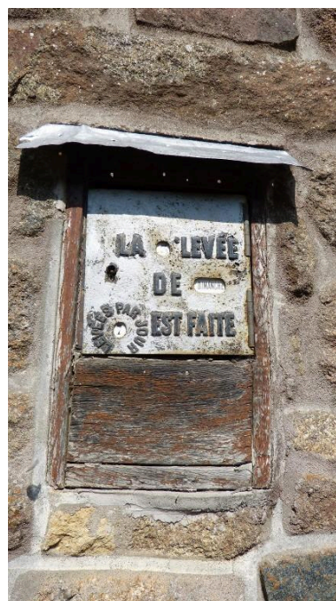
Boîte aux lettres système Thiéry - Les Iffs IVR53_20243531025NUCA