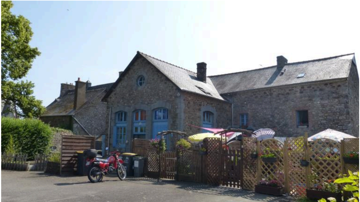
Avancée abritant l'ancienne salle de classe de l'école - Ancienne mairie-école - Les Iffs