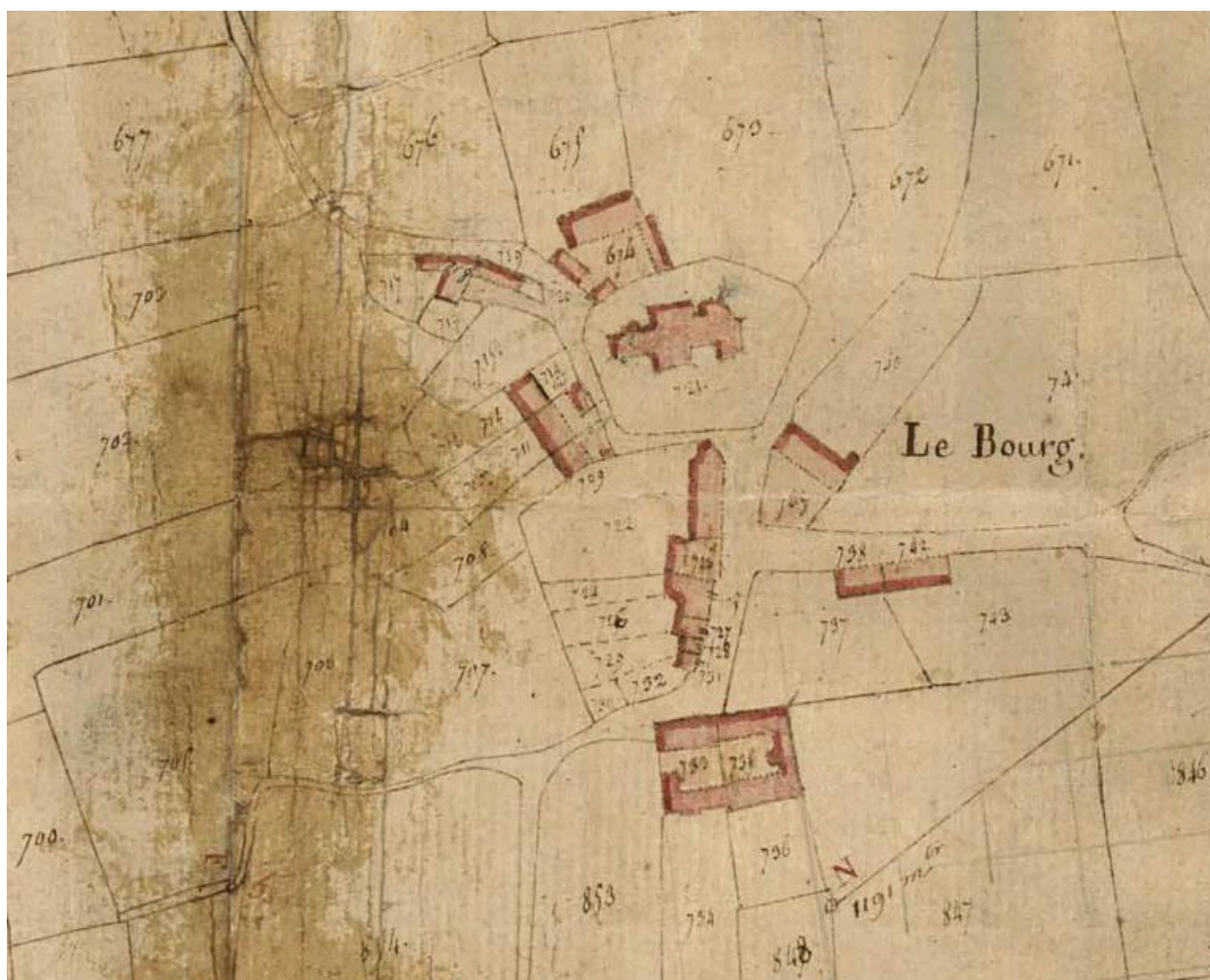
Cadastre de 1825, Le Bourg, Section B