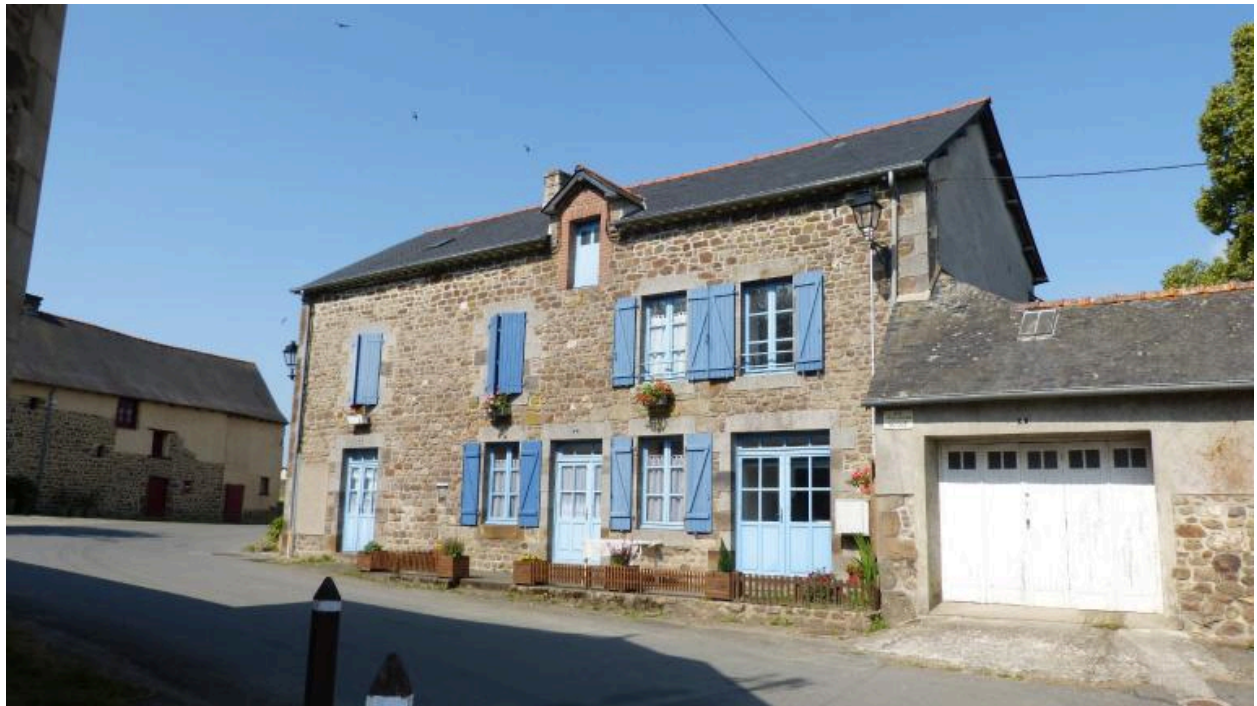
Ancienne mairie - Les Iffs