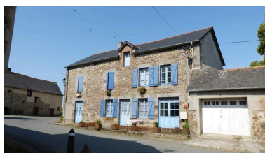
Ancienne mairie - Les Iffs IVR53_20243531024NUCA