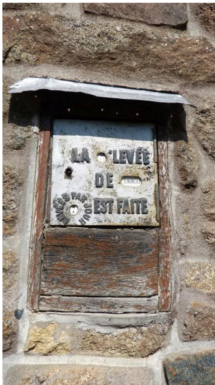
Boîte aux lettres système Thiéry - Les Iffs