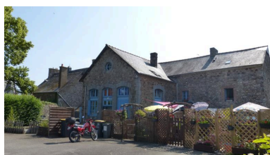
Avancée abritant l'ancienne salle de classe de l'école - Ancienne mairie-école - Les Iffs IVR53_20243531026NUCA

Auteur(s) du dossier : Association Communes du Patrimoine Rural de Bretagne