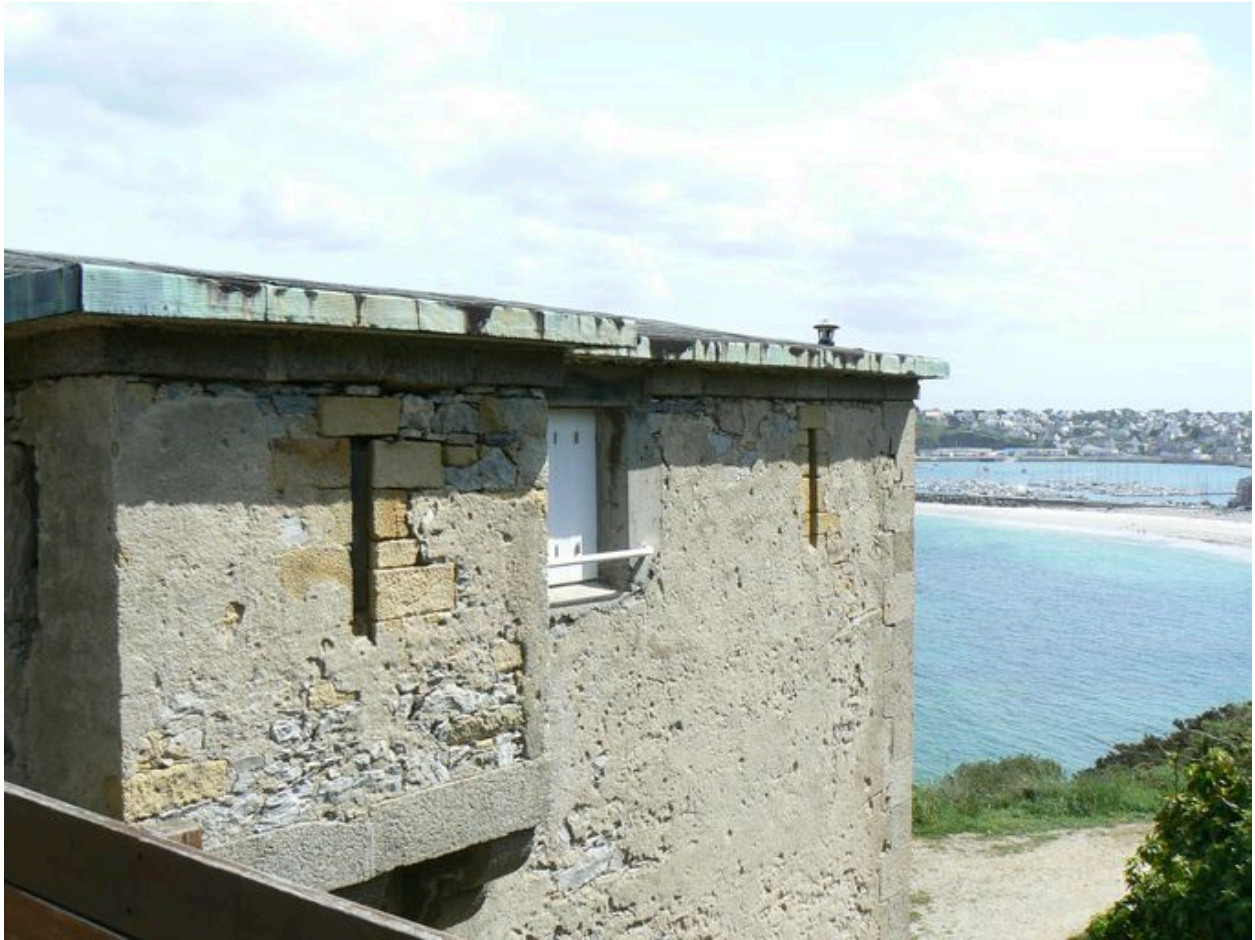
Vue latérale du réduit de batterie de côte du Petit Gouin