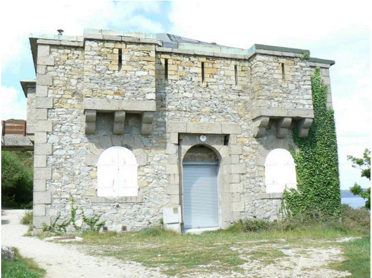
Vue générale du réduit de batterie de côte du Petit Gouin