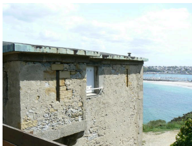
Vue latérale du réduit de batterie de côte du Petit Gouin