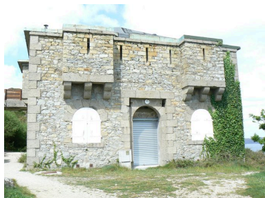
Vue générale du réduit de batterie de côte du Petit Gouin IVR53_20072908571NUCA