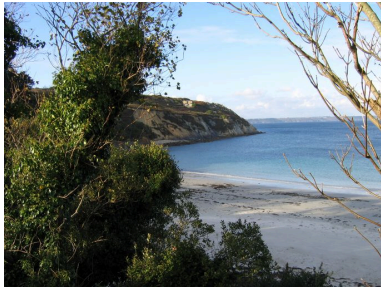
Vue du réduit de batterie de côte du Petit Gouin dominant l'anse du Corréjou IVR53_20062908496NUCA