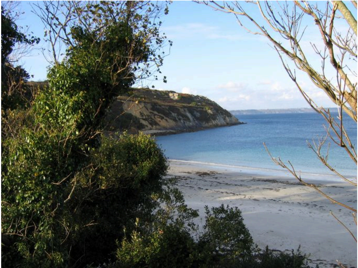
Vue du réduit de batterie de côte du Petit Gouin dominant l'anse du Corréjou